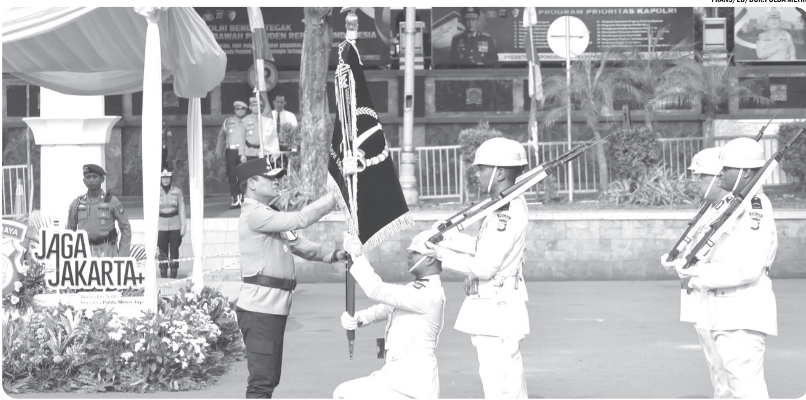
POLDA METRO JAYA TERIMA TANDA KEHORMATAN NUGRAHA SAKANTI