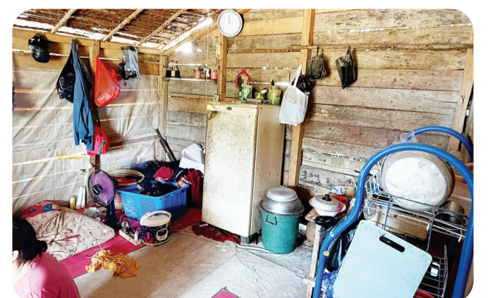
Salah satu bagian dalam rumah sebelum dibedah.