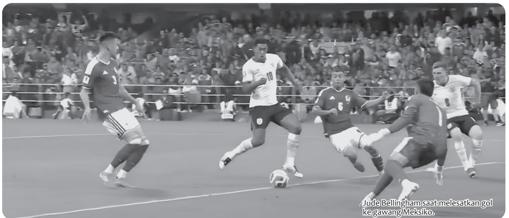
Jude Bellingham saat melepaskan gol ke gawang Meksiko.

Brasil yang tersentak berupaya menyamakan skor, namun Haaland berhasil menggan-