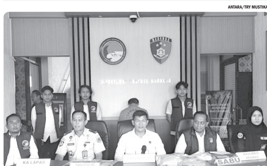
PENGUNGKAPAN KASUS PEREDARAN SABU DIKENDALIKAN NARAPIDANA