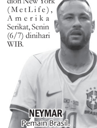
NEYMAR Pemain Brasil.

Solbakken menyebut Brasil bermain dengan mengandalkan serangan balik dan di lapangan para pemain Norwegia berusaha tidak termakan taktik lawan. Dia juga menegaskan timnya pantas menang di laga tersebut. "Mengapa kemenangan berpihak kepada kami? Yah, kami bermain, ini sedikit seperti Manchester City melawan Real Madrid. Mereka (Brasil) bertahan dan mengandalkan serangan balik, dan kami harus melelehkan mereka. Karena itulah yang terbaik dari kami, dan saya rasa kami