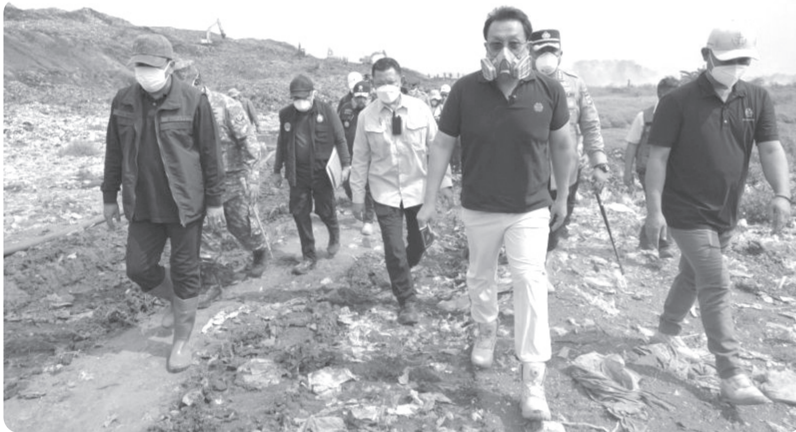
WAMEN LH TINJAU LOKASI KEBAKARAN DI TPA JATIWARINGIN

Wamen LH (Wakil Menteri Lingkungan Hidup) Diaz Hendropriyono (kedua kanan) saat meninjau lokasi kebakaran di TPA Jatiwaringin, Kabupaten Tangerang, Banten, Sabtu (4/7/2026). Wamen LH minta kepala daerahantisipasi kebakaran TPA akibat El Nino.