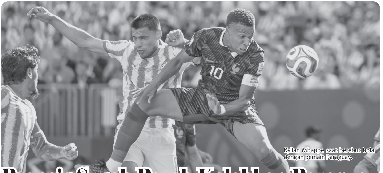
Kylian Mbappe saat berebut bola dengan pemain Paraguay.