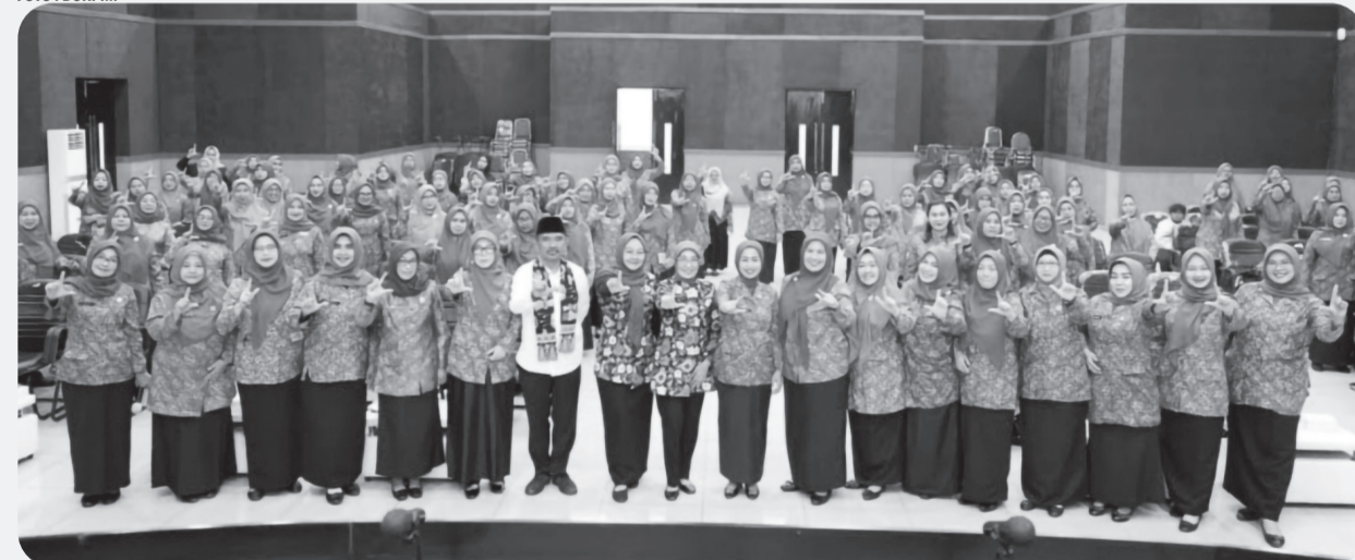
Kegiatan Pembinaan Gelari Pelangi Tahun 2026 di Aula KH. Noer Ali Gedung Bupati Bekasi, Cikarang Pusat, Jumat (3/7).

CIKARANG PUSAT (LB) - Program Gerakan Keluarga Indonesia dalam Peningkatan Kualitas Pendidikan dan Pengelolaan Ekonomi (Gelari Pelangi) menjadi fokus penguatan Tim Penggerak PKK Kabupaten Bekasi sebagai upaya meningkatkan kualitas sumber daya manusia sekaligus memperkuat perekonomian keluarga.