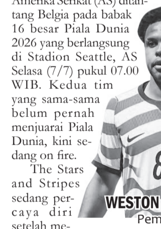
WESTON MCKENNIE Pemain AS.

Selanjutnya Prancis akan melawan Maroko pada babak perempatfinal yang berlangsung Jumat (10/7) pukul 03.00 WIB. ●vit