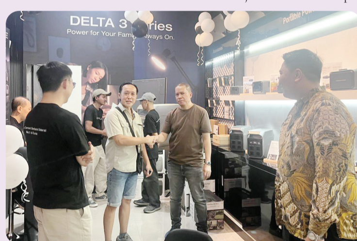
Suasana grand opening EcoFlow Authorized Store.

mendukung pemanfaatan energi bersih yang lebih luas.