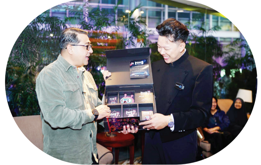
Menteri Ekraf Teuku Riefky Harsya (kiri) berbincang dengan Bayu Skak (kanan).

JAKARTA (LB) - Menteri Ekonomi Kreatif/Kepala Badan Ekonomi Kreatif (Ekraf) Teuku Riefky Harsya mengapresiasi film Foufo garapan SKAK Studios dan SinemArt.