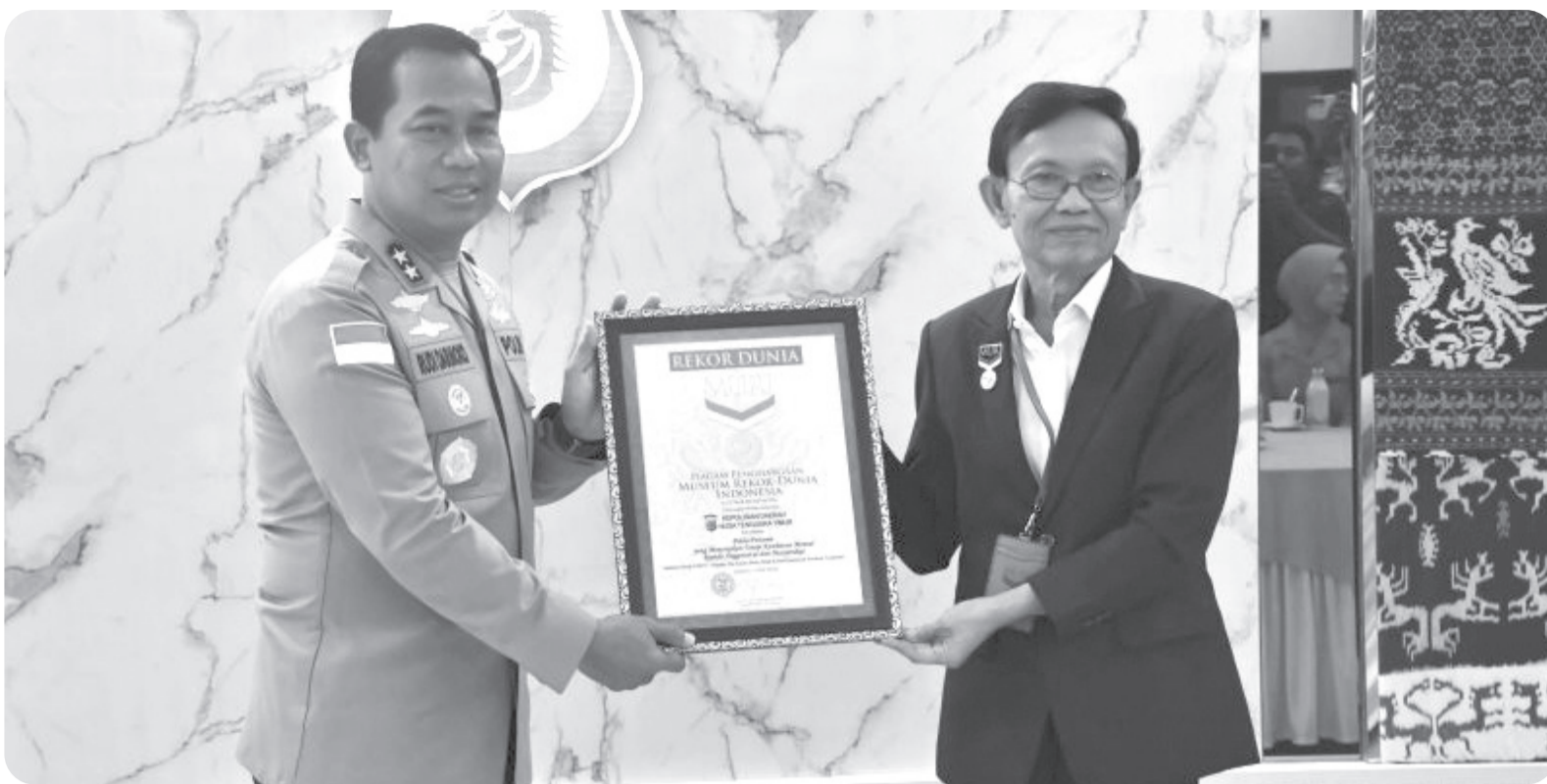
POLDA NTT TERIMA PENGHARGAAN MURI