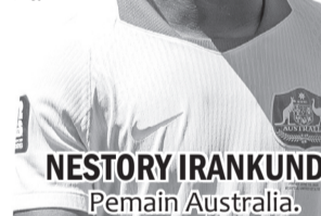
NESTORY IRANKUNDA Pemain Australia.