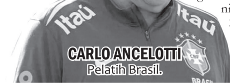
CARLO ANCELOTTI Pelatih Brasil.

Selecao gagal memenuhi ekspektasi usai terhenti di babak 16 besar. Menghadapi Norwegia, Brasil dipaksa mengakui keunggulan lawan usai kalah dengan skor 1-2.