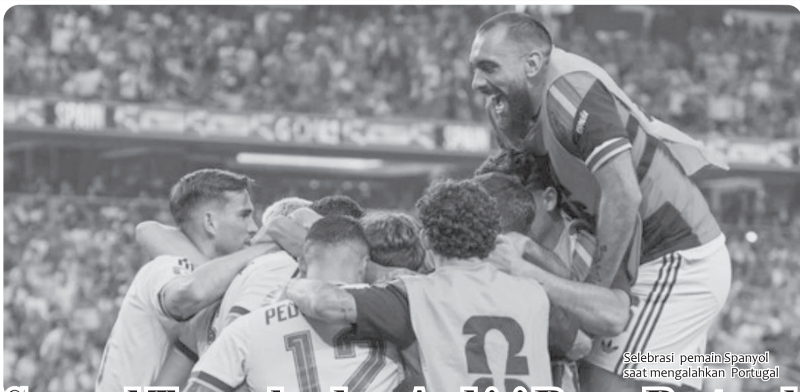
Selebrasi pemain Spanyol saat mengalahkan Portugal

Piala Asia 2027 dimulai pada 7 Januari di Arab Saudi. Australia tergabung di Grup D bersama Tajikistan, Irak, dan Singapura. Timnas Indonesia juga ikut bertarung di Piala Asia 2027. Garuda tergabung di Grup F bareng Jepang, Qatar, dan Thailand. •vdt