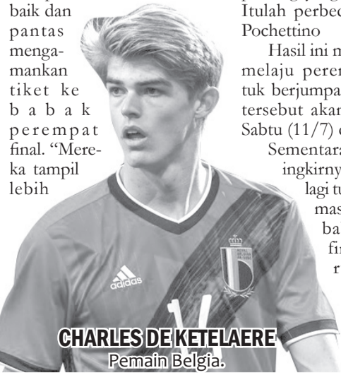
CHARLES DE KETELAERE Pemain Belgia.

Hasil ini membuat Belgia melaju perempatfinal untuk berjumpa Spanyol. Laga tersebut akan berlangsung, Sabtu (11/7) dini hari WIB. Sementara dengan tersingkirnya AS, tidak ada lagi tuan rumah yang masih berkiprah di babak perempat final. Dua tuan rumah lainnya, Kanada dan Meksiko sudah kandas terlebih dahulu. •vdt