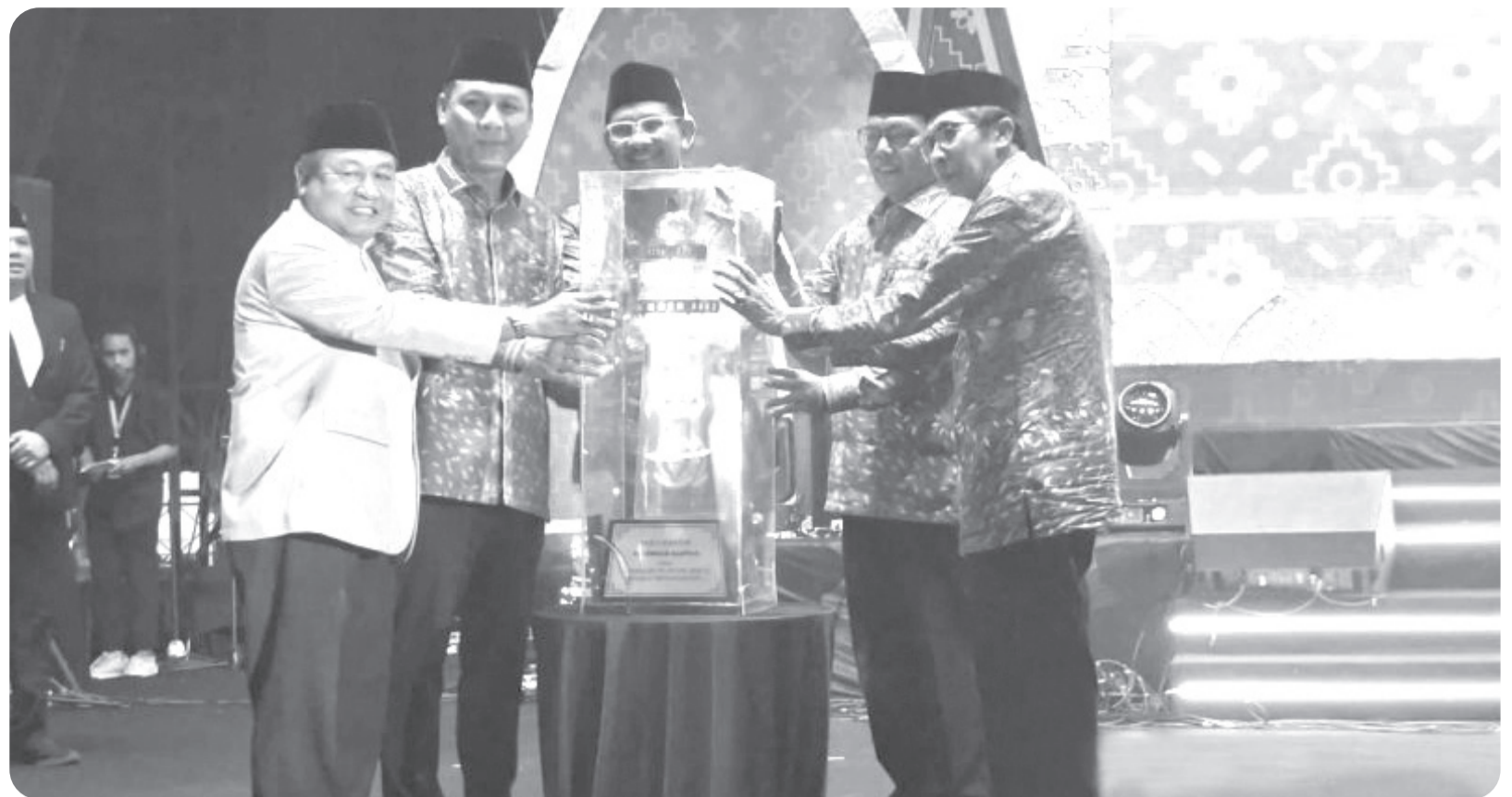
PEMROV BANTEN MENGGELAR MTQ KE-23 TINGKAT PROVINSI

Pemprov Banten bersama Kemenag RI membuka MTQ (Musabaqah Tilawatil Quran) ke-23 tingkat provinsi di KP3B (Kawasan Pusat Pemerintahan Provinsi Banten), Kota Serang, Banten, Senin (6/7/2026) malam. Pemrov Banten menggelar MTQ ke-23 tingkat provinsi di KP3B, Kota Serang, sebagai ajang penjurangan kafilah terbaik untuk mewakili daerah pada tingkat nasional.