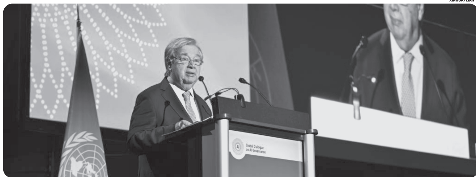
DIALOG GLOBAL TENTANG TATA KELOLA AI

Sekjen PBB (Sekretaris Jenderal Perserikatan Bangsa-Bangsa) Antonio Guterres berbicara pada pembukaan sesi pertama Dialog Global tentang Tata Kelola AI di Jenewa, Swiss, Senin (6/7/2026). Pembukaan sesi pertama Dialog Global tentang Tata Kelola AI dimulai di sini pada hari Senin. Dialog dua hari ini telah mempertemukan perwakilan dari pemerintah, perusahaan teknologi, akademisi, masyarakat sipil, dan komunitas teknis untuk membahas tata kelola AI. Agenda tersebut mencakup segmen tingkat tinggi, sesi tematik, dan acara sampingan yang membahas peluang dan risiko AI, menjembatani kesenjangan AI, kerja sama internasional, dan pengawasan manusia terhadap sistem AI.