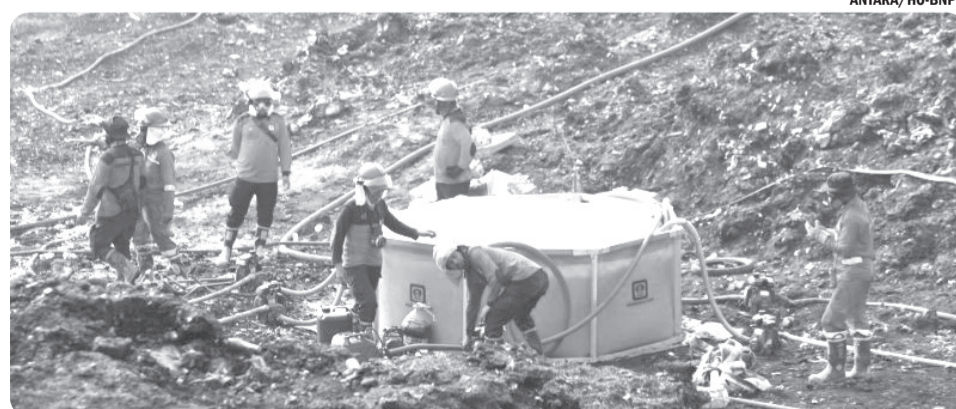
45 PERSEN LAHAN TERBAKAR DI TPA JATIWARINGIN BERHASIL DIPADAMKAN

"Pemerintah perlu merehabilitasi dan memperluas jaringan irigasi teknis untuk meningkatkan indeks pertanaman, membangun infrastruktur konservasi air skala komunitas seperti check