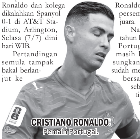
CRISTIANO RONALDO Pemain Portugal.

Selama kariernya di Piala Dunia, Ronaldo membuat 11 gol termasuk tiga gol di edisi kali ini. Bukan akhir yang menyenangkan untuk megabintang seperti Ronaldo. •vdt