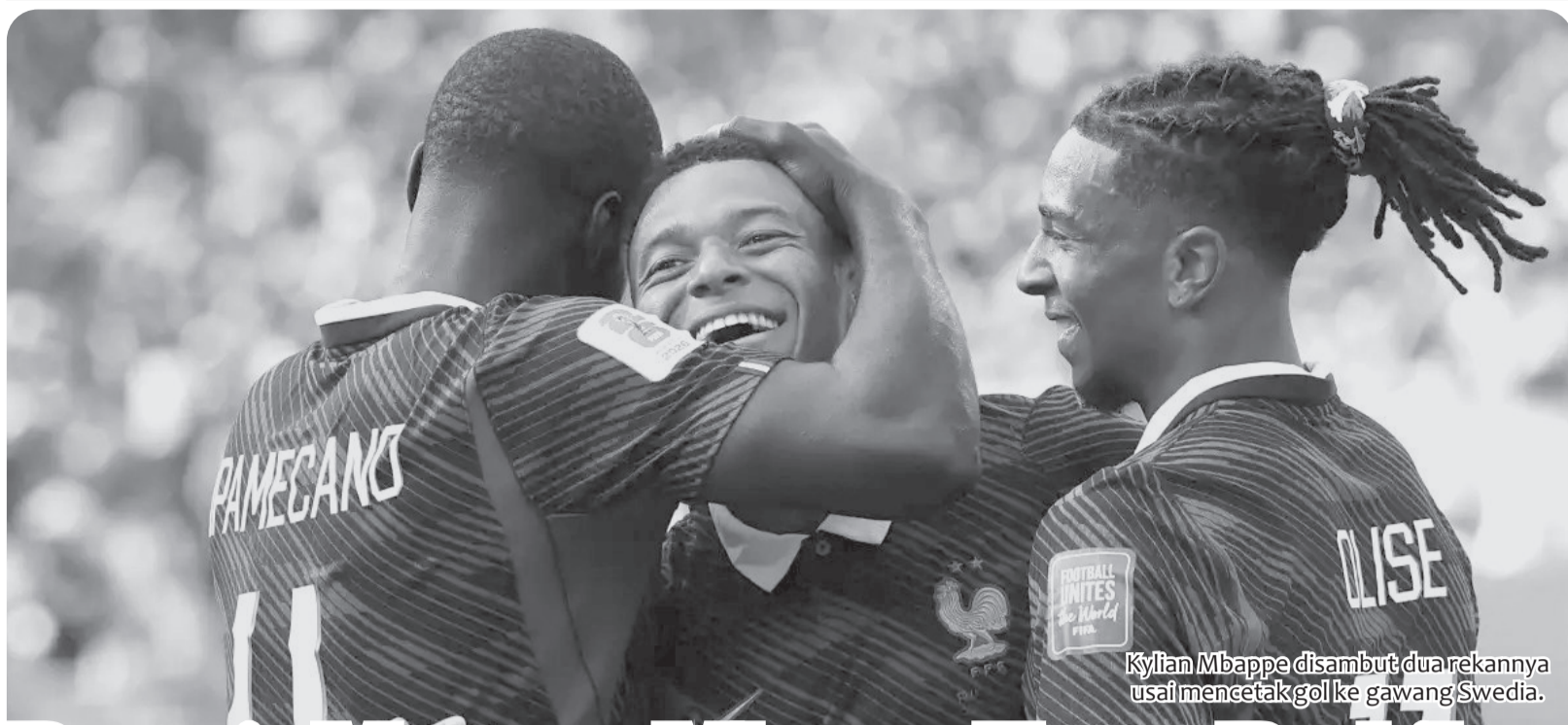
Kylian Mbappe disambut dua rekannya usai mencetak gol ke gawang Swedia.