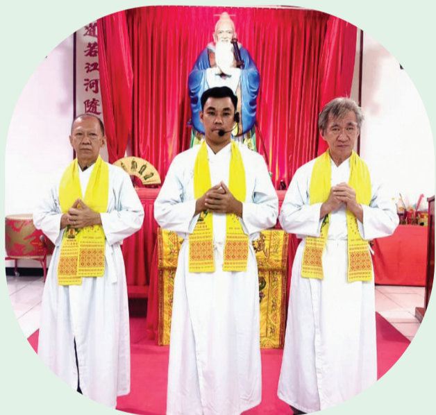
Pimpinan prosesi persembahyangan.

JAKARTA (LB) - Malam Purnama bukan sekedar penanda pergantian waktu dalam kalender, lebih dari itu, Malam Purnama merupakan momen untuk berhenti sejenak dalam kesibukan. Dalam penanggalan Kalender Kongzili, setiap tanggal 1 (Chu Yi) dan 15 (Shi Wu) merupakan hari sembahyang yang memiliki makna penting bagi umat Khonghucu.