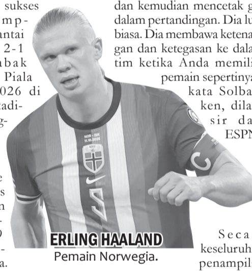
ERLING HAALAND Pemain Norwegia.

ang besar di babak pertama dan kemudian mencetak gol dalam pertandingan. Dia luar biasa. Dia membawa ketenangan dan ketegasan ke dalam tim ketika Anda memiliki pemain seperti," kata Solbakken, dilansir dari ESPN.