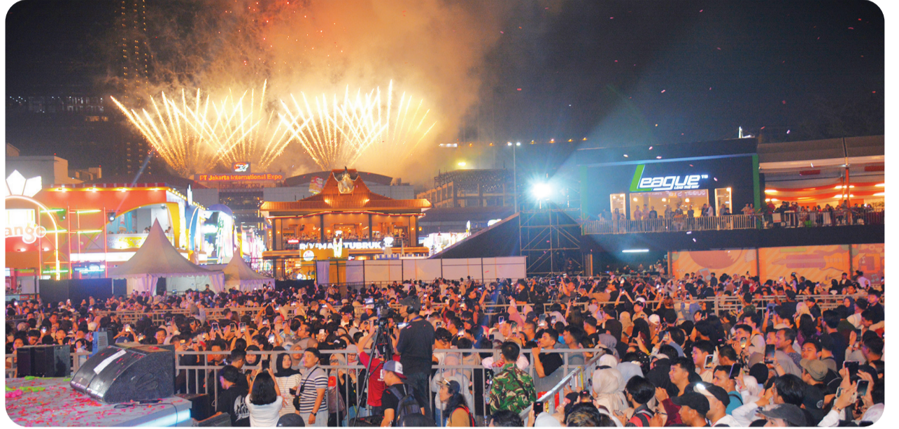
Warga antusias menyaksikan pesta kembang api.

"Selamat ulang tahun ke-499 Kota Jakarta. Semoga semangat kebersamaan yang kita rayakan malam ini semakin memperkuat langkah Jakarta menuju usia lima abad sebagai kota global yang maju, membanggakan, dan membahagiakan seluruh warganya. Jakarta adalah kota kita bersama yang harus terus dijaga dan dibangun demi kemajuan di masa depan," pungkasnya. ● kris