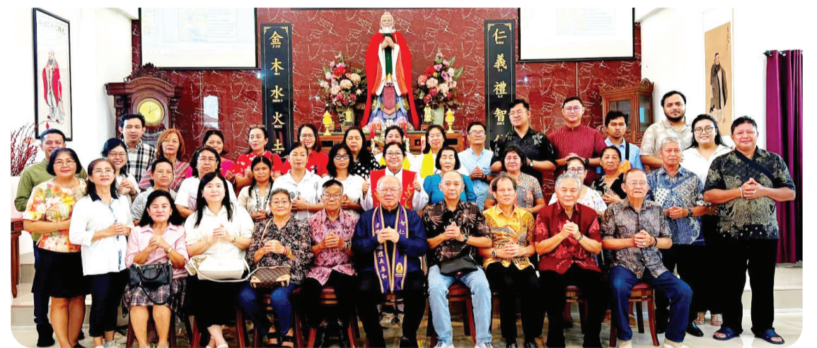
Pengurus MAKIN Citeureup, Pengurus Pusat MATAKIN dan umat berfoto bersama.

Ia juga sempat menyinggung tempat suci umat Khonghucu di Qufu, Shandong, Tiongkok, yang merupakan tempat lahir dan