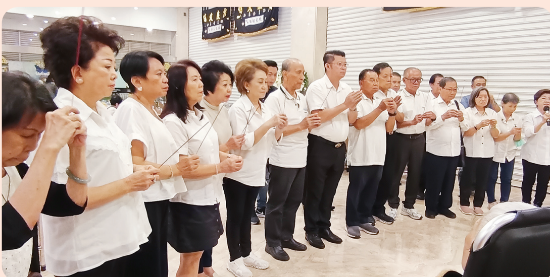
Pimpinan dan Pengurus Hainan Indonesia memberikan penghormatan.