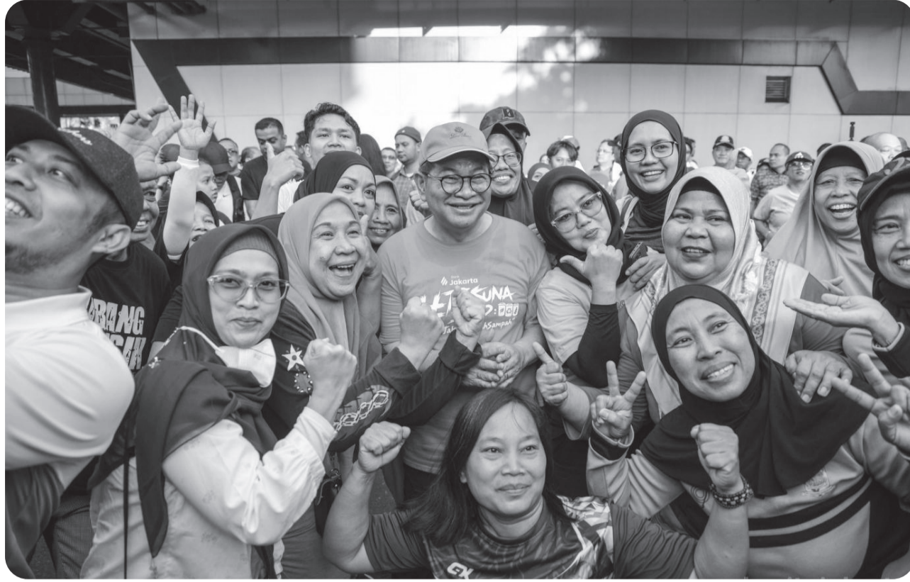
PRAMONO ANUNG SAPA WARGA DI HBKB RASUNA SAID Gubernur DKI Jakarta Pramono Anung berfoto bersama para warga yang melakukan aktivitas di HBKB (Hari Bebas Kendaraan Bermotor) Jalan HR Rasuna Said, Setiabudi, Jakarta Selatan, Minggu (7/6/2026). HBKB di Jalan HR Rasuna Said, resmi digelar secara rutin setiap hari Minggu mulai pukul 05.30 hingga 09.00 WIB.