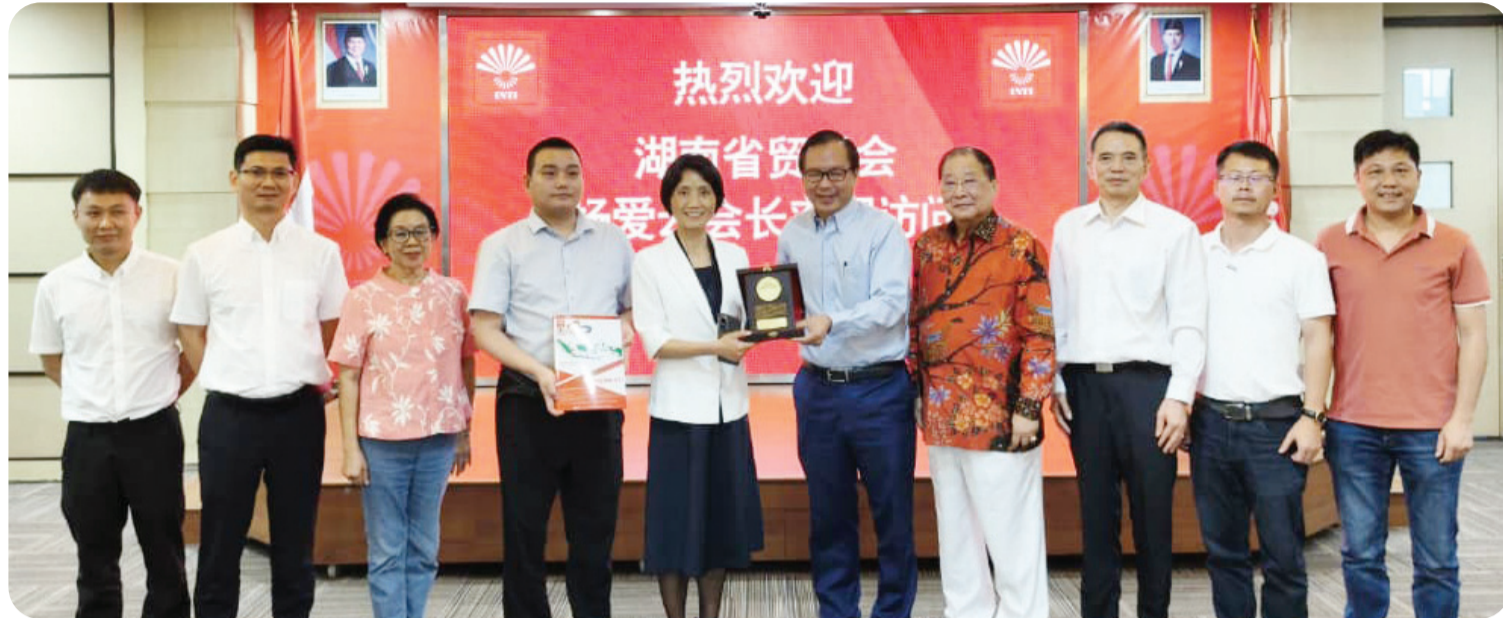
Kedua belah pihak berfoto bersama.

Ada pun kunjungan ini bertujuan untuk menyampaikan apresiasi dan ucapan terima kasih kepada Perhimpunan INTI atas dukungan serta bantuan yang selama ini diberikan kepada para pengusaha