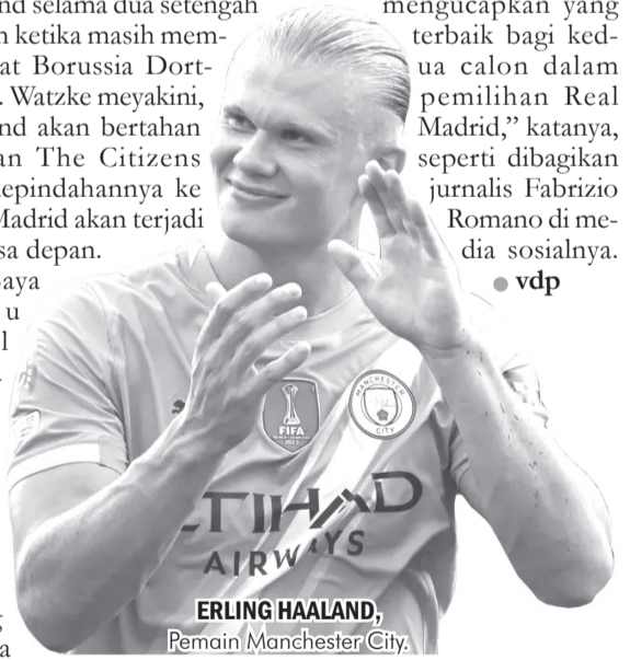
ERLING HAALAND, Pemain Manchester City.