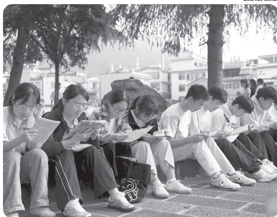
UJIAN MASUK PERGURUAN TINGGI NASIONAL Para siswa bersiap untuk ujian di luar lokasi ujian masuk perguruan tinggi nasional di Kota Tengchong, Provinsi Yunnan, Tiongkok, Minggu (7/6/2026). Ujian masuk perguruan tinggi nasional tahun ini, yang juga dikenal sebagai gaokao, dimulai pada hari Minggu di seluruh negeri.

"Mereka bangga, dan ada hal-hal yang tidak pernah mereka bayangkan akan mereka lakukan, tetapi harus mereka lakukan. Mereka tidak punya pilihan, dan itu membutuhkan waktu sedikit," kata dia. •tom