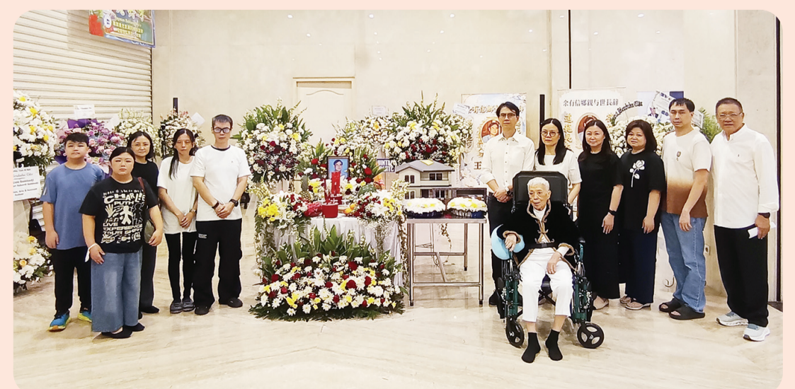
Foto bersama keluarga besar mendiang Usin Sumbadji dengan kerabat.