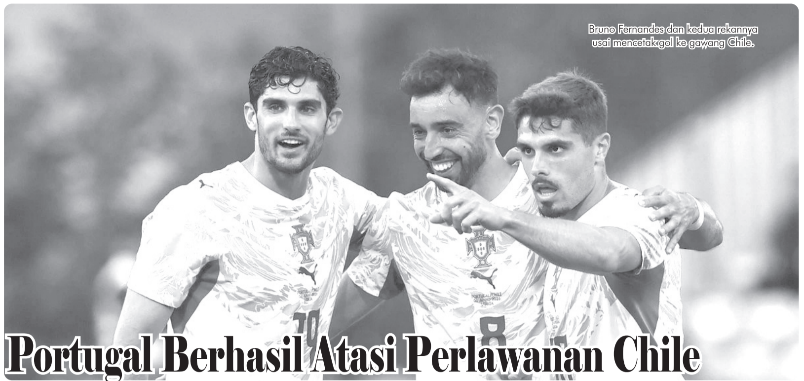
Bruno Fernandes dan kedua rekannya usai mencetak gol ke gawang Chile.