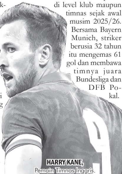
HARRY KANE, Pemain Timnas Inggris.