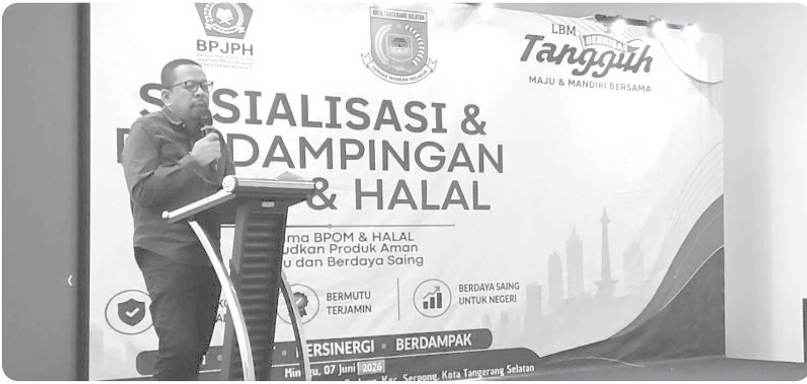
PEMERINTAH TERUS MENDORONG PERAN SEKTOR UMKM

Kepala Bakom (Badan Komunikasi) Pemerintah RI Muhammad Qodari memberikan sambutan dalam agenda sosialisasi dan pendampingan BPO & Halal di Tangerang Selatan, Banten, Minggu (7/6/2026). Pemerintah terus mendorong peran sektor UMKM (Usaha Mikro, Kecil dan Menengah) untuk memperkuat kestabilan ekonomi di dalam negeri.