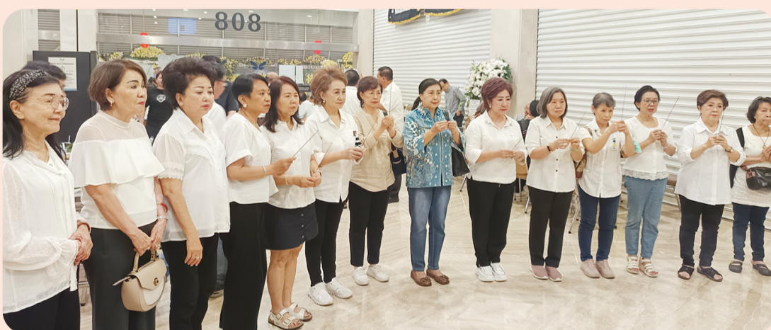
Pimpinan dan Pengurus Dharma Wanita Perhimpunan Persatuan Guangdong Indonesia memberikan penghormatan.