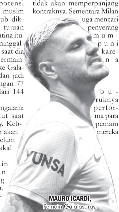
MAURO ICARDI, Pemain Galatasaray.