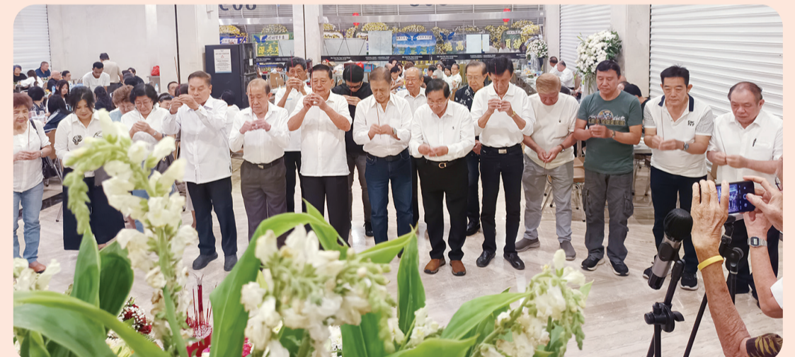
Pimpinan dan Pengurus Yayasan Belitung Mulia memberikan penghormatan.