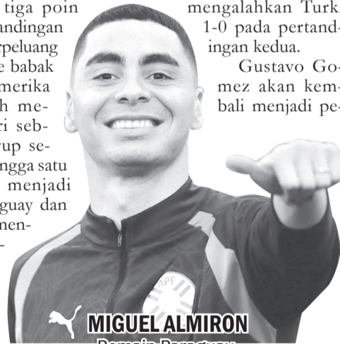
MIGUEL ALMIRON Pemain Paraguay.

Di laga lain, AS akan bertemu Turki di Los Angeles Stadium, Jumat (26/6) pukul 09.00 WIB. Laga ini tidak berpengaruh apa-apa bagi kedua tim. •vdp