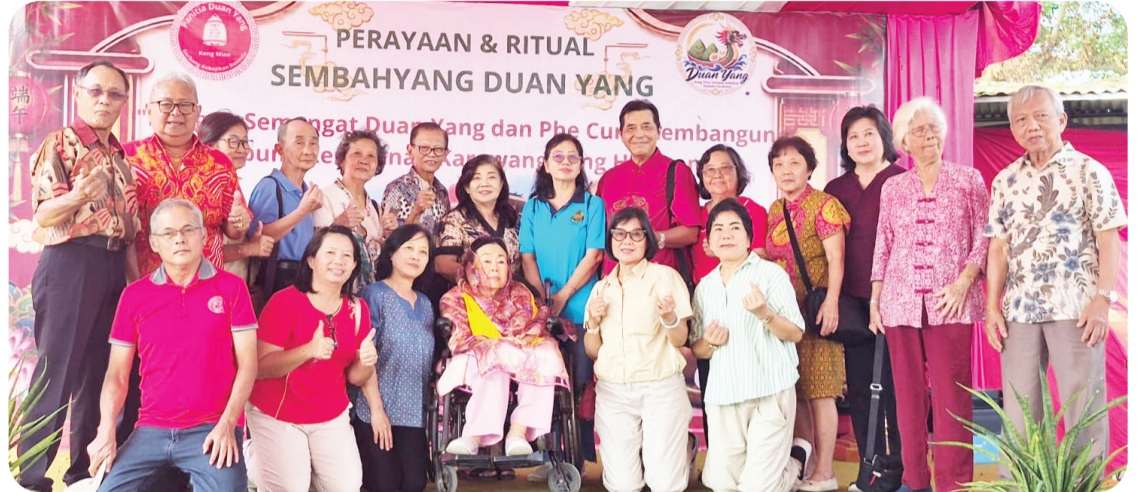
Sejumlah umat Khonghucu berfoto bersama Ibu Negara RI ke-4 Sinta Nuriyah Wahid.

JAKARTA (LB) - Ibu Negara RI ke-4, Sinta Nuriyah Wahid menghadiri perayaan dan sembahyang Duan Yang, di Kong Miao Gerbang Kebajikan, Perumahan Resinda, Karawang, Jumat (19/6/2026).