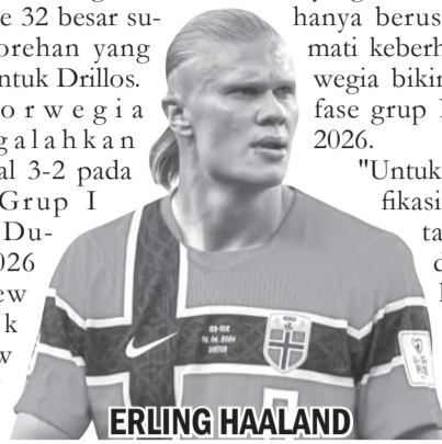
ERLING HAALAND Pemain Norwegia.