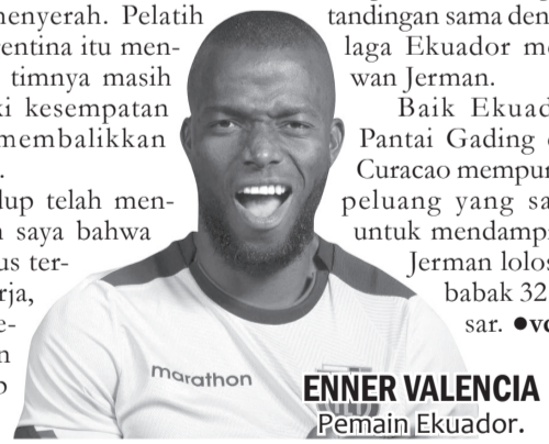
ENNER VALENCIA Pemain Ekuador.

Baik Ekuador, Pantai Gading dan Curacao mempunyai peluang yang sama untuk mendampingi Jerman lolos ke babak 32 besar. •vdp