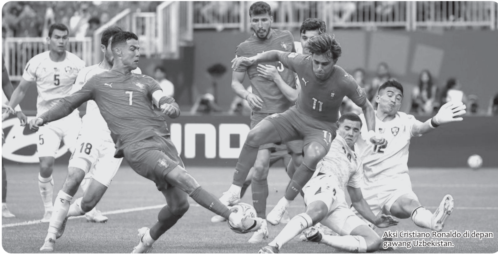
Aksi Cristiano Ronaldo di depan gawang Uzbekistan.