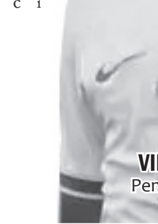
VINICIUS JUNIOR Pemain Timnas Brasil

Hasil ini membawa Skotlandia sementara memimpin Grup C Piala Dunia 2026 dengan 3 poin, di atas Maroko dan Brasil (1), dan Haiti yang jadi ju r u k u n c i