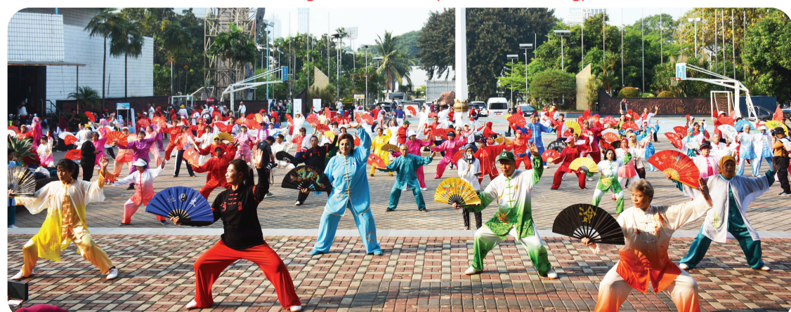
Para atlet dan pegiat taiji bersama-sama memeragakan beragam jurus senam taiji