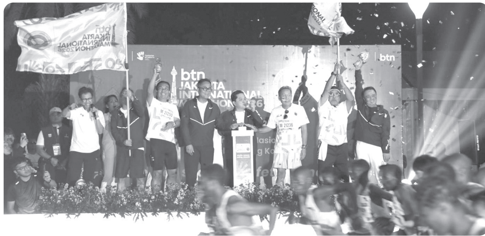
WAGUB RANO KARNO LEPAS 8.200 PELARI MARATON BTN JAKIM 2026