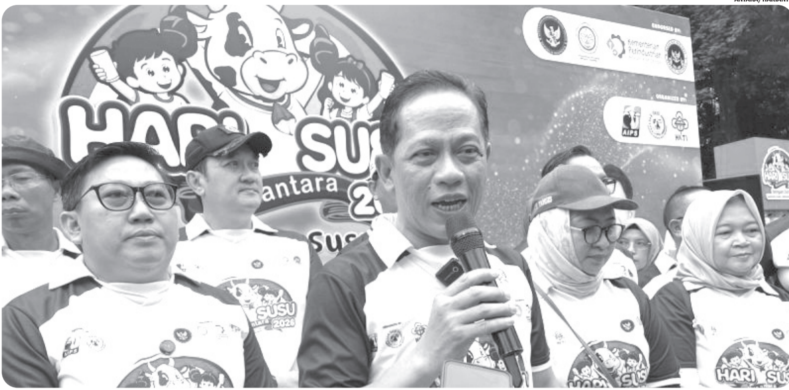
PERINGATAN HARI SUSU NUSANTARA 2026