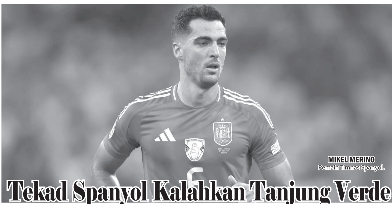
MIKEL MERINO Pemain Timnas Spanyol.