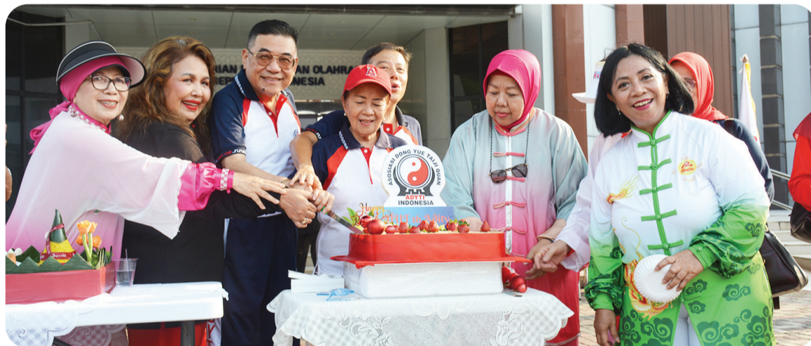
Prosesi potong kue ulang tahun