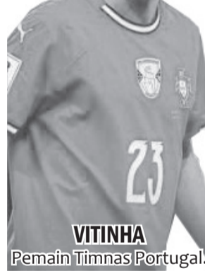
VITINHA Pemain Timnas Portugal.

Mereka didukung para junior yang sudah tahu rasanya juara, seperti Vitinha, Joao Neves, Rafael Leao, Nuno Mendes, Goncalo Inacio, Goncalo Guedes, hingga Francisco Conceicao.