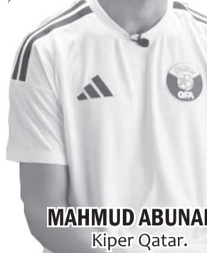
MAHMUD ABUNADA Kiper Qatar.

Qatar kini sudah membuat sejarahnya sendiri dengan untuk pertama kali meraih poin di Piala Dunia. Pada edisi 2022 saat menjadi