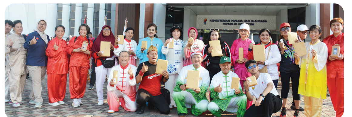
Para penerima hadiah door prize berfoto bersama