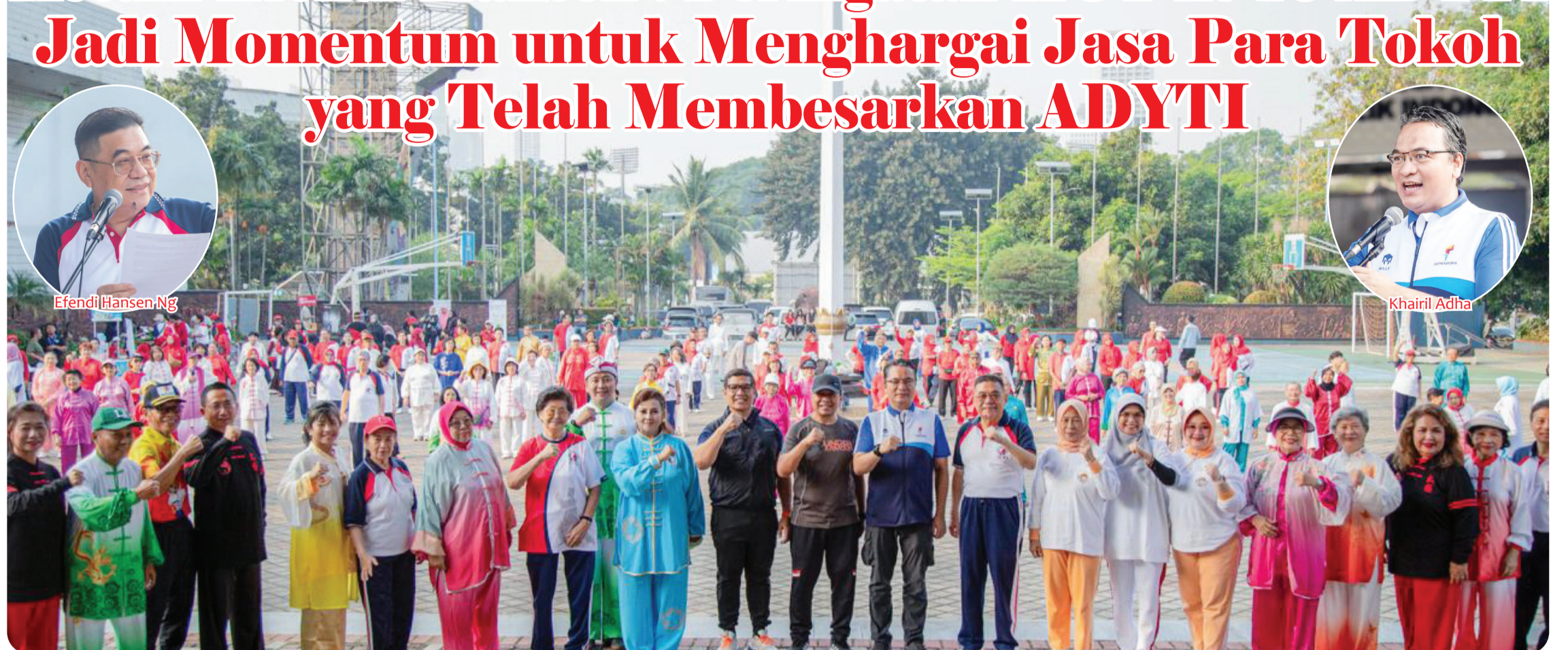
Segenap hadirin berfoto bersama