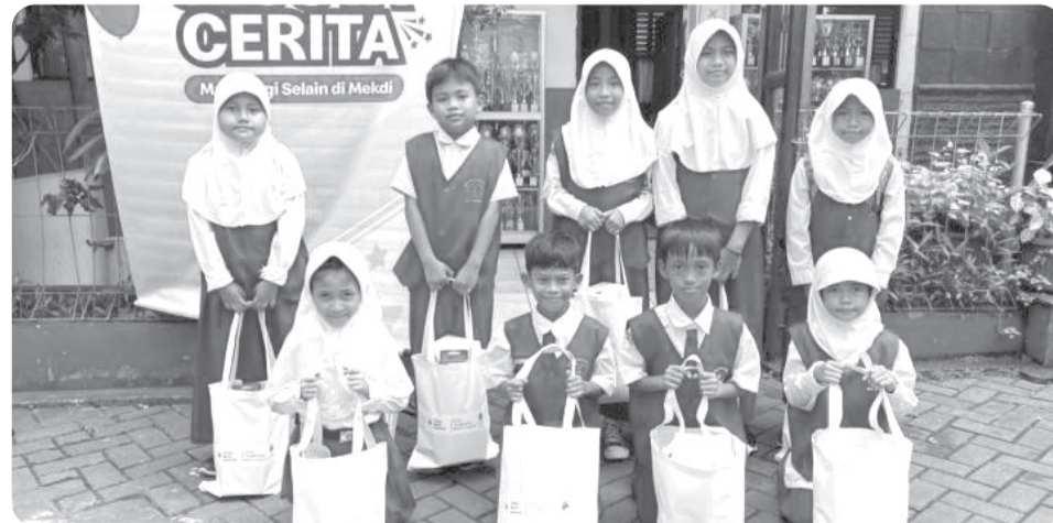
BANTUAN PERLENGKAPAN SEKOLAH