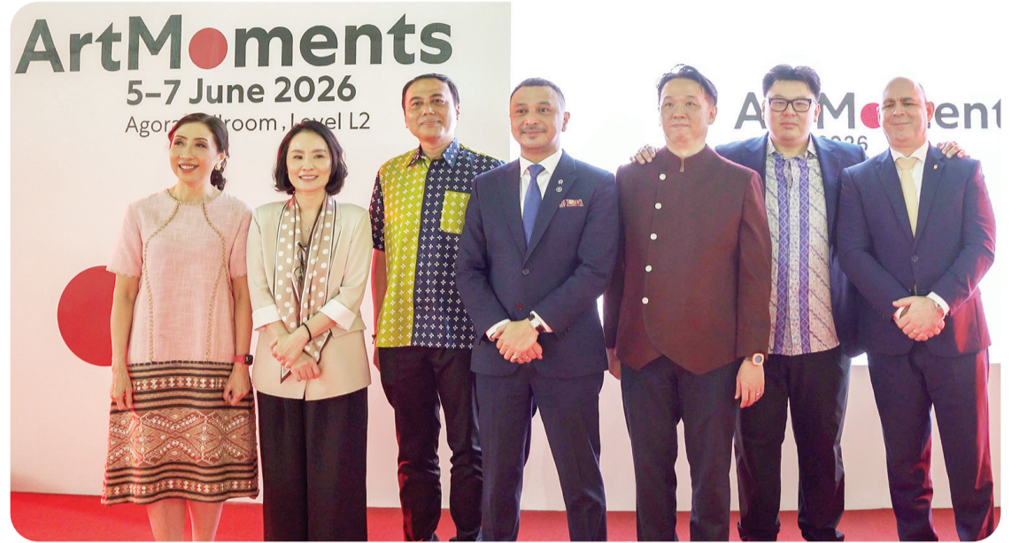
Berfoto bersama Wakil Menteri Kebudayaan Giring Ganeshha.