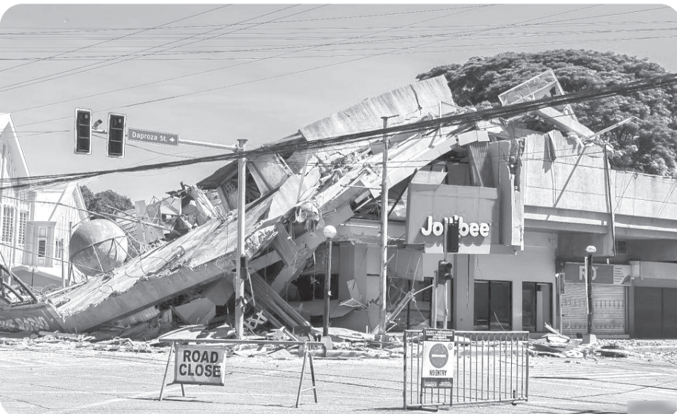
GEMPA BUMI LANDA FILIPINA

Rute dari Afrika Utara menuju Italia dan Malta ini terus memakan korban meski peringatan bahaya sudah berulang kali disampaikan. •tom