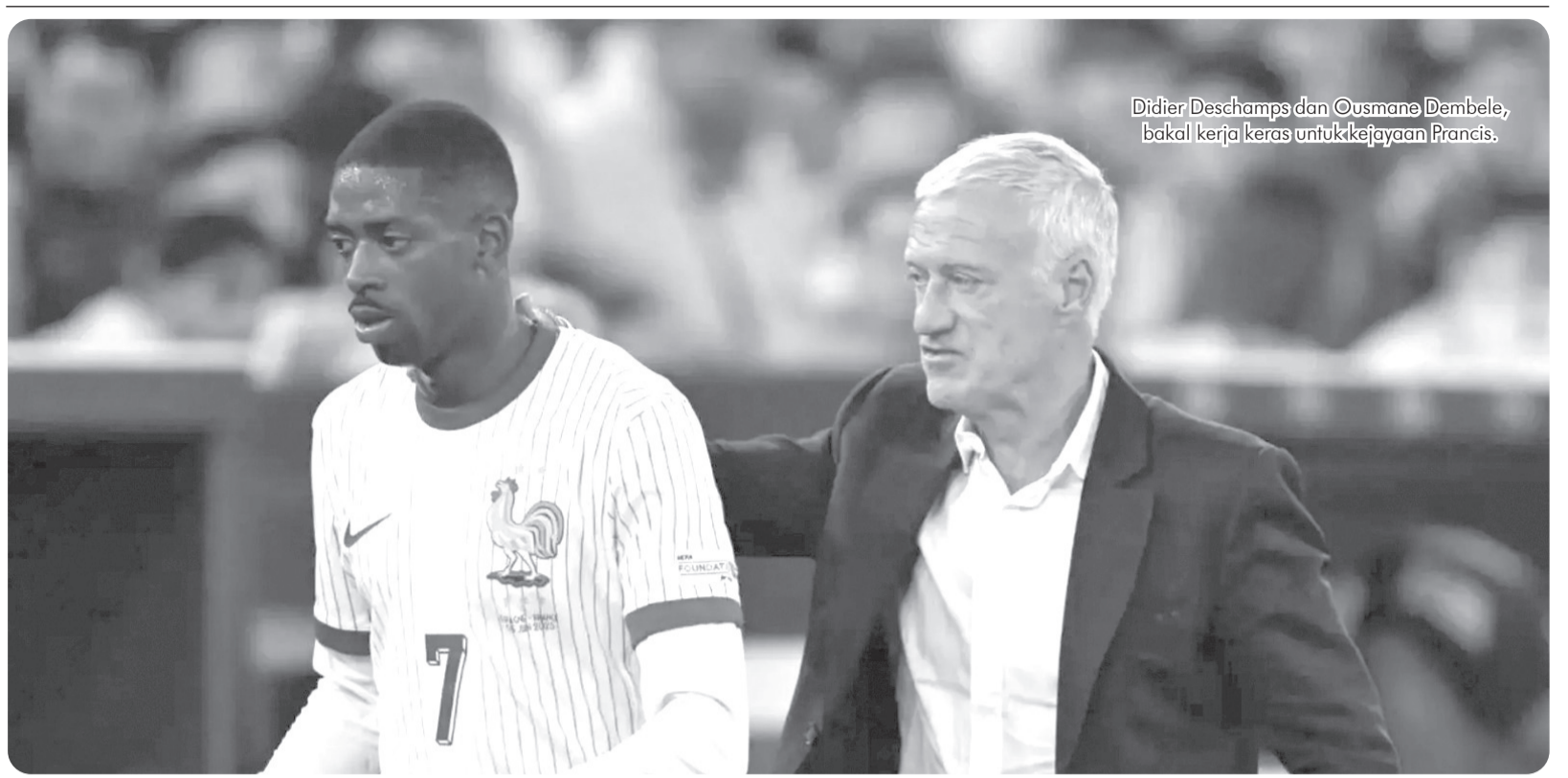
Didier Deschamps dan Ousmane Dembele, bakal kerja keras untuk kejayaan Prancis.