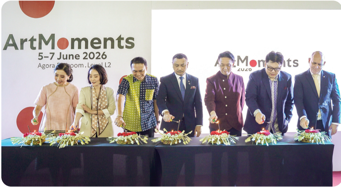
Prosesi pembukaan pameran.