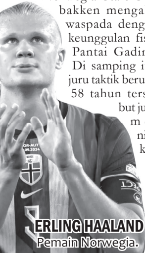
ERLING HAALAND Pemain Norwegia.

Perlu diketahui kedua tim belum pernah bertemu sebelumnya. Maka, laga diprediksi berjalan alot, keras dan seru. ●vit