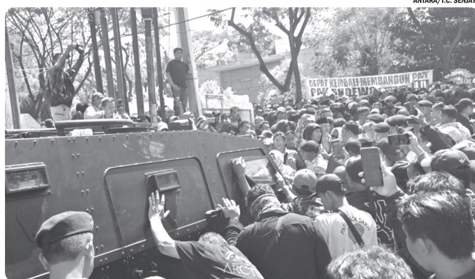
SIDANG PUTUSAN SELA BUPATI NON AKTIF PATI SUDEWA

"Tetapi memang paling tidak mereka ingin berjalan bersamaan dan ada rezeki yang mereka dapatkan dari penumpang yang memang tidak dilayani atau tidak kebagian BisKita," tambah Dody. •pur