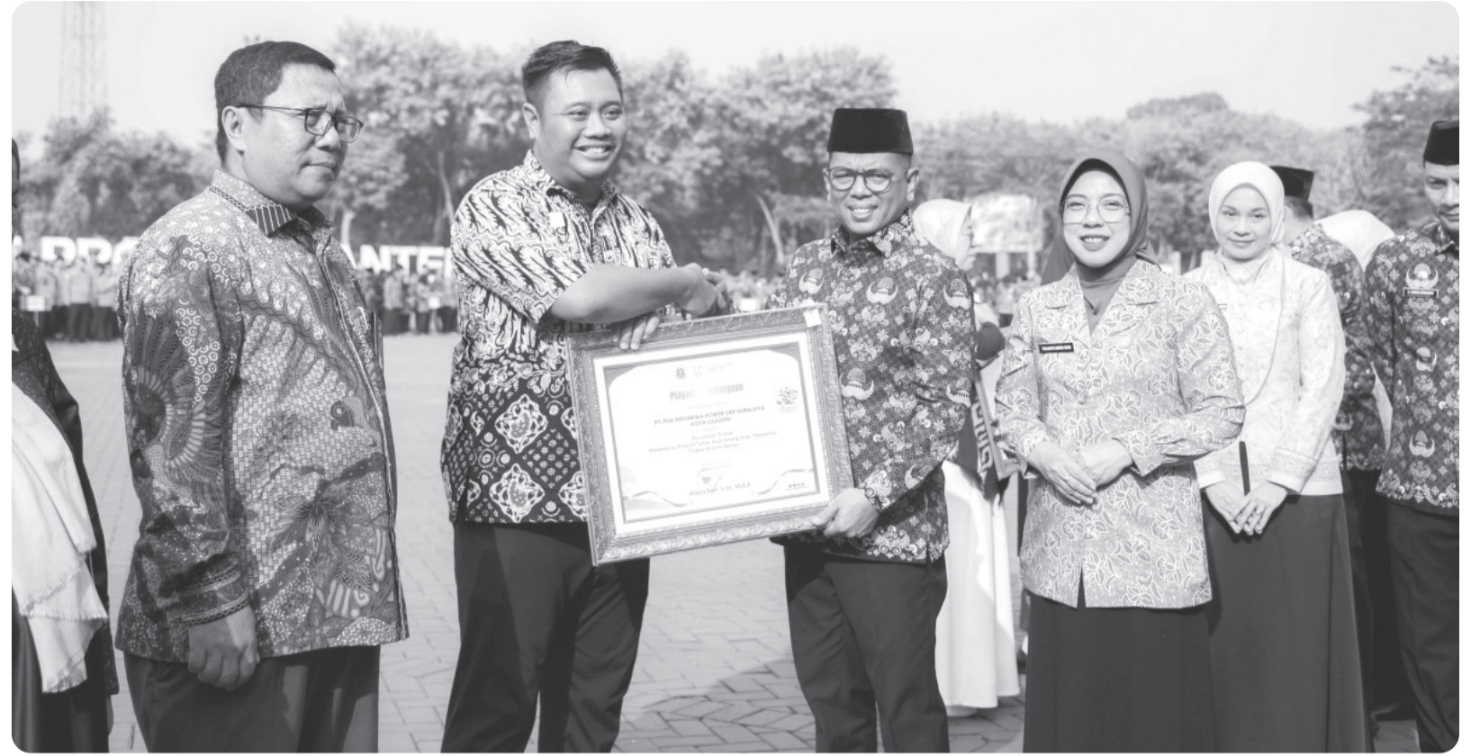
PERINGATAN HARGANAS KE-33 TINGKAT PROVINSI BANTEN