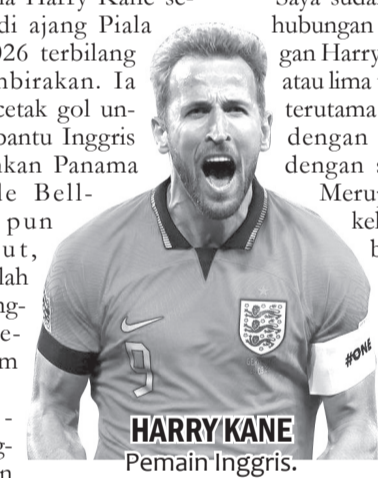
HARRY KANE Pemain Inggris.

Dengan 11 gol sepanjang Piala Dunia, Kane sudah melampaui Cristiano Ronaldo dengan laga lebih sedikit. Masih ada kesempatan bagi Kane untuk menabuh pundi-pundi golnya.