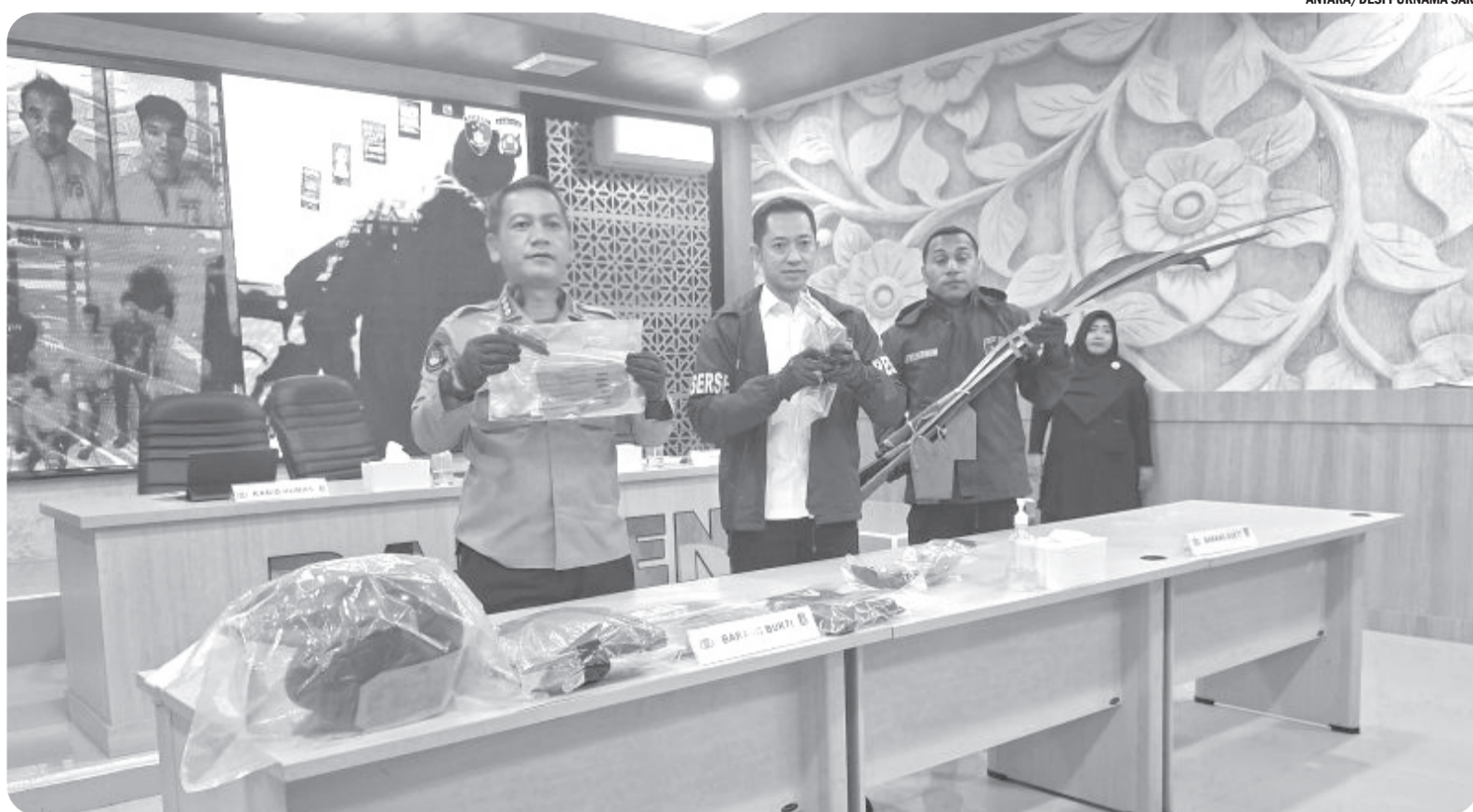
UNGKAP SINDIKAT CURANMOR BERSENJATA API RAKITAN

Jajaran kepolisian tunjukkan barang bukti saat ungkap kasus di Polda Banten, Kota Serang, Senin (29/6/2026). Direktorat Reserse Kriminal Umum Polda Banten mengungkap sindikat pencurian kendaraan bermotor yang menggunakan senjata api rakitan serta menyita 13 sepeda motor yang diduga hasil kejahatan.