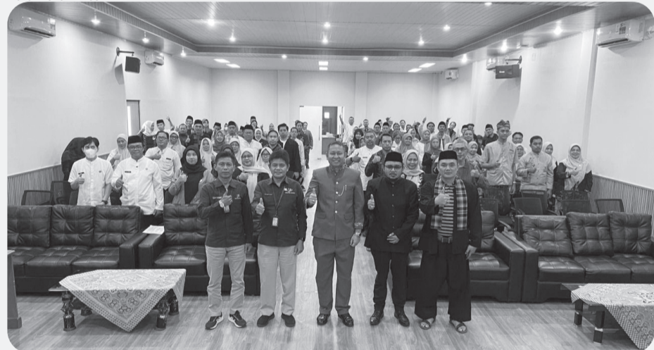
Sosialisasi Evaluasi Penyelenggaraan Statistik Sektoral (EPSS) Tahun 2026 di Aula Dinas Pendidikan Kota Bekasi, Senin (29/6).

KOTA BEKASI (LB) - Dinas Komunikasi, Informatika, Statistik dan Persandian (Diskominfostandi) Kota Bekasi, Jawa Barat, melaksanakan kegiatan Sosialisasi Evaluasi Penyelenggaraan Statistik Sektoral (EPSS) Tahun 2026 yang berlangsung di Ruang Aula Dinas Pendidikan Kota Bekasi, Senin (29/6).