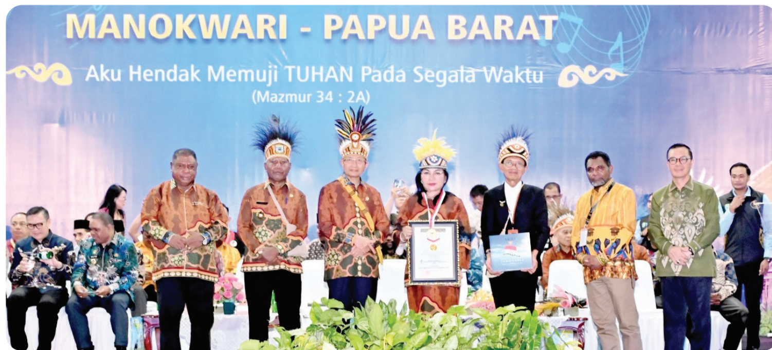
Penyerahan Rekor MURI Pesparawi Nasional XIV di Papua Barat. Humas Dirjen Bimas Kristen.

"Spiritualitas yang otentik harus berbanding lurus dengan tanggung