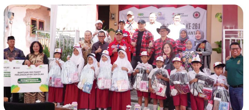
Foto bersama usai pembagian paket perlengkapan sekolah dan bingkisan kepada anak sekolah.