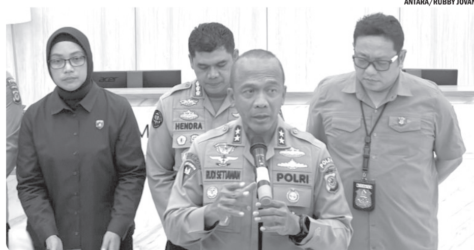
POLDA JABAR GANDENG META BURU PELAKU PENYEKAPAN WANITA

yang hilang dari kejadian ini. Di sekitarnya, tampak sejumlah pemuda yang sedang bersiap meninggalkan lokasi menggunakan sepeda motor. Sementara sampah-sampah bertebaran di jalan. • osm