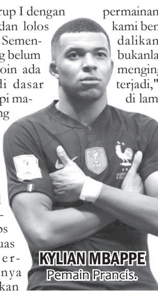
KYLIAN MBAPPE Pemain Prancis.

"Prancis tampil dengan baik, walau kami sudah berjuang. Kylian Mbappe sebagai pemain luar biasa dengan kecepatan yang tak terhentikan. Di sisi lain, cuaca ikut mempengaruhi konsentrasi kami," ujarnya. •vit