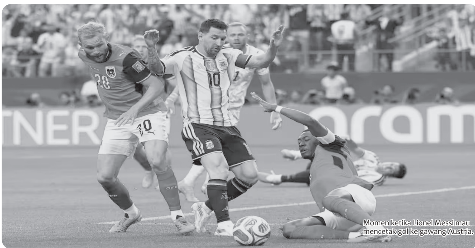
Momen ketika Lionel Messi mau menendang bola ke gawang Austria.