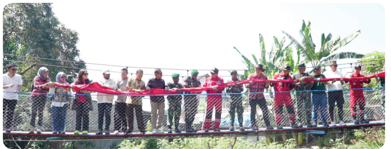
Rangkaian prosesi peresmian Jembatan Curah Banteng Batu, Jatim.