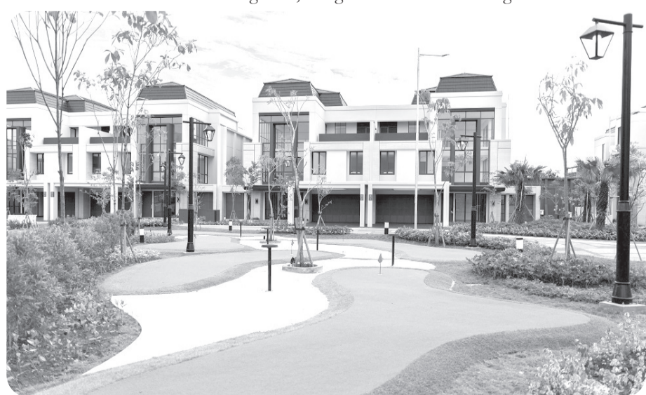
Klaster residensial Trésor di BSD City.

Dibangun di atas lahan seluas 3,4 hektare, Trésor menawarkan hunian bergaya American Classic dengan tiga tipe hunian yakni Gallant (LT 405 m 2 /LB 527 m 2 ), Montez (LT 240 m 2 /LB 412 m 2 ) dan Altair (LT 240 m 2 /LB 412 m 2 ). Setiap unit hunian memiliki 3 lantai bangunan, dengan 4 kamar