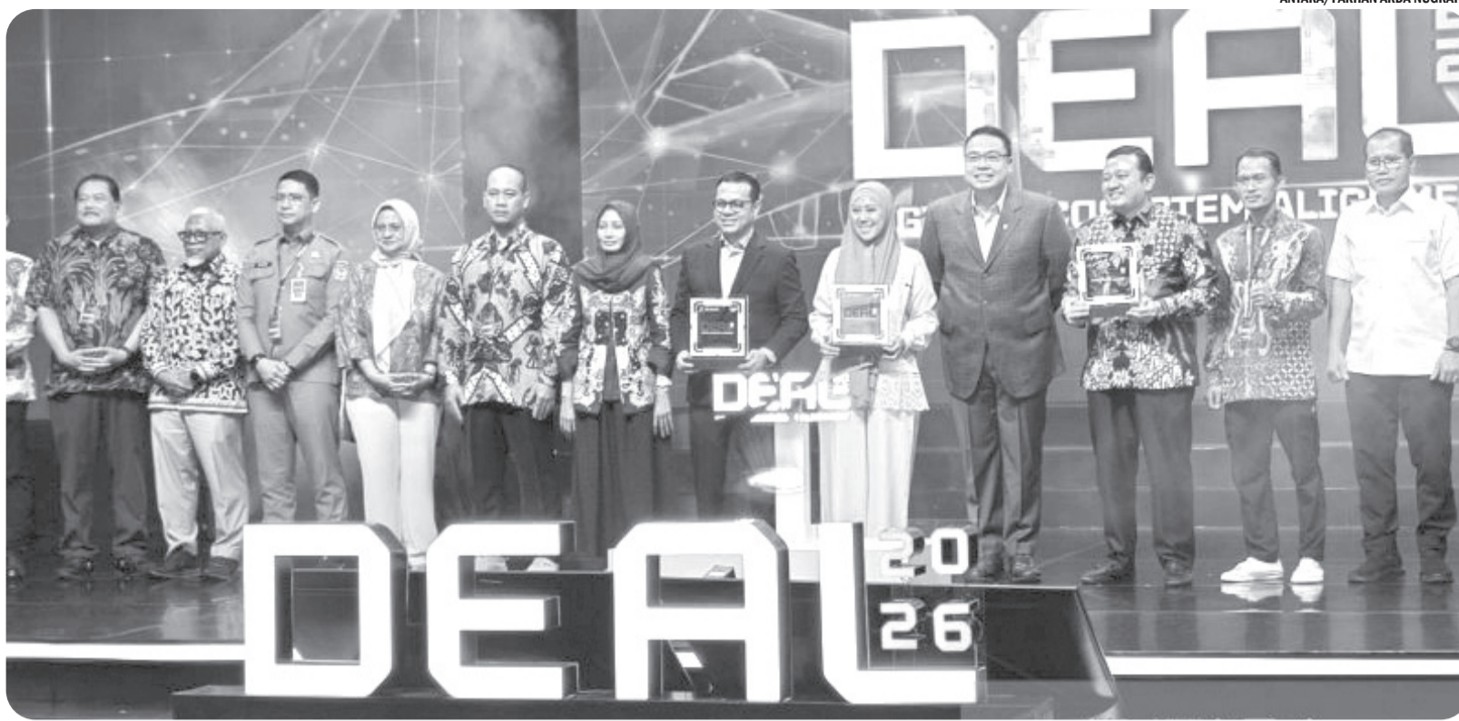
GERAKAN KOLABORASI UNTUK MAJUKAN EKOSISTEM DIGITAL

Kemkomdigi meresmikan gerakan DEAL (Digital Ecosystem Alignment) 2026 di Jakarta Selatan pada Selasa (23/6/2026). DEAL menjadi wadah kolaborasi antara pemerintah, industri, akademisi, investor, startup, UMKM, komunitas, dan pemerintah daerah yang diarahkan langsung pada implementasi konkret serta menyentuh kebutuhan nyata.