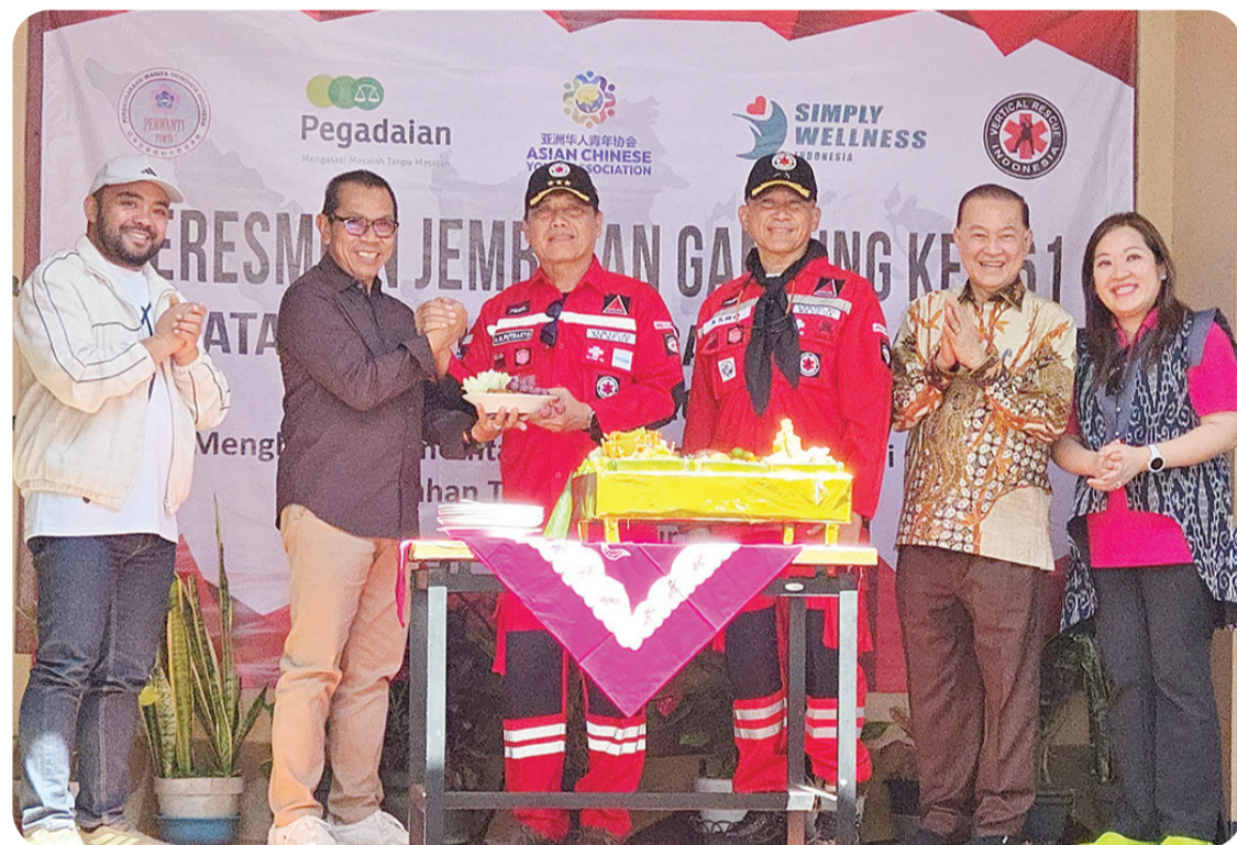
Pemotongan tumpeng wujud Syukur.

Pada kesempatan itu dilaksanakan juga bakti sosial dan salah satunya adalah Waqaf AIQur'an, kepada Musholla Babbussalaam dan Musholla Naiful Fallah, Kecamatan Temas, Batu. ● vit