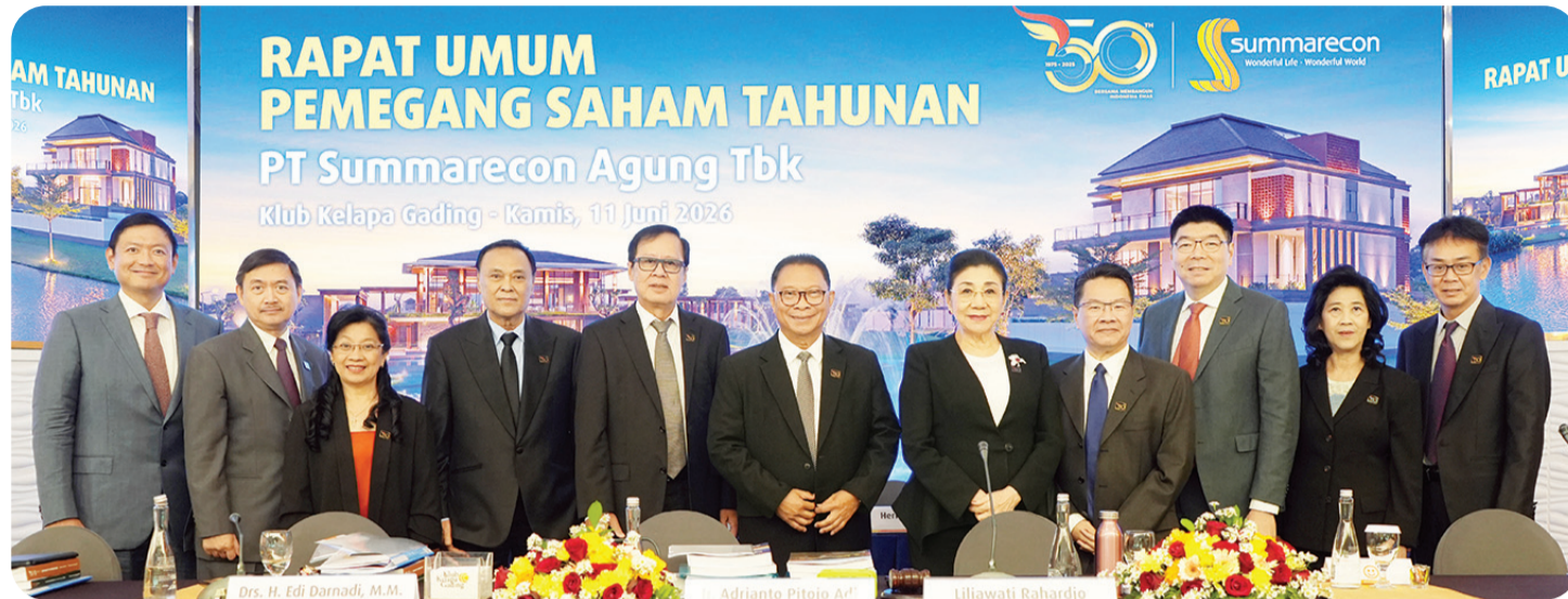
Jajaran Komisaris dan Direksi PT Summarecon Agung Tbk., berfoto bersama.