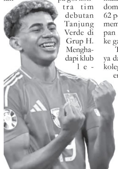
LAMINE YAMAL Pemain Timnas Spanyol.

ATLANTA (LB) - Spanyol cuma bisa berimbang pa gol kontra tim debutan Tanjung Verde di Grup H. Menghadapi klub le-