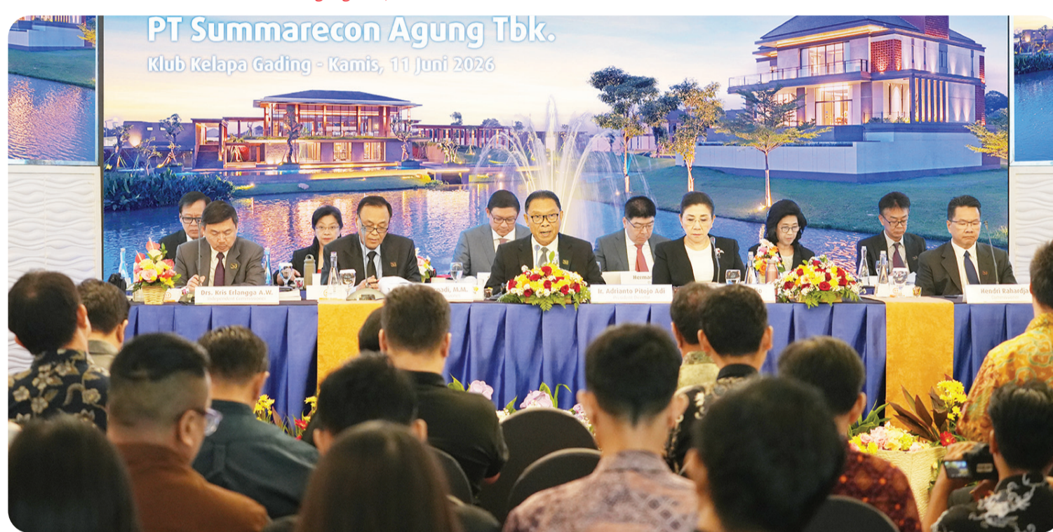
Jajaran Komisaris dan Direksi pada Rapat Umum Pemegang Saham Tahunan PT Summarecon Agung Tbk., 2025.

"Di tengah berbagai tantangan ekonomi yang masih berlangsung, kami bersyukur pasar hunian menengah dan menengah atas tetap menunjukkan resiliensi yang