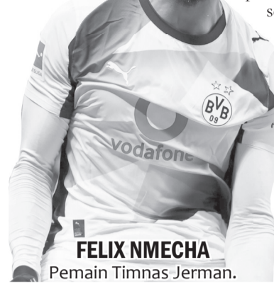
FELIX NMECHA Pemain Timnas Jerman.

HOUSTON (LB) - Timnas Jerman tampil digdaya pada matchday pertama Piala Dunia 2026 Grup E, Senin (15/6) dini hari WIB. Pasukan Julian Nagelsmann membantu Curacao 7-1.