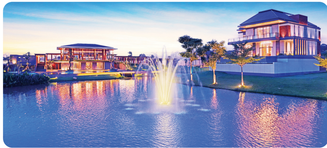
Sultan Island - Summarecon Bekasi.

Pada tahun 2026, Summarecon menetapkan target marketing sales sebesar Rp5,2 triliun dengan kontribusi dari marketing sales keseluruhan proyek di 9 kawasan kota terpadu. Penjualan selama 3 bulan pertama di awal tahun 2026 ini juga sangat baik dengan mencatatkan data penjualan properti senilai Rp 1,2 triliun, lebih tinggi 37% dari periode yang sama di tahun sebelumnya. ● kris