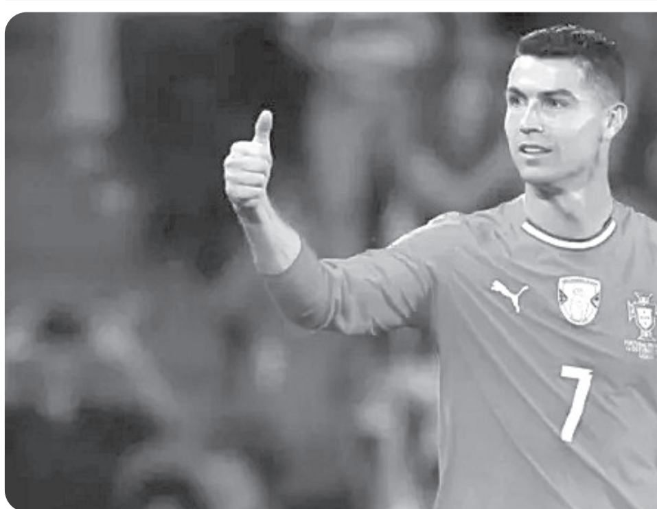
CRISTIANO RONALDO Pemain Timnas Portugal.

Hingga laga berakhir, skor 0-0 bertahan. Permainan monoton Spanyol yang selalu menyerang dari sisi sayap jadi alasan mengapa Tanjung Verde bisa meredam