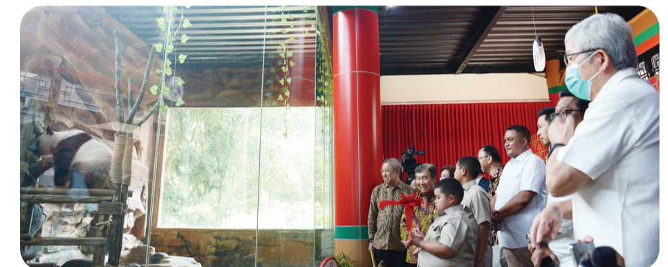
Para undangan kehormatan menyaksikan Bayi panda Rio dan induknya.