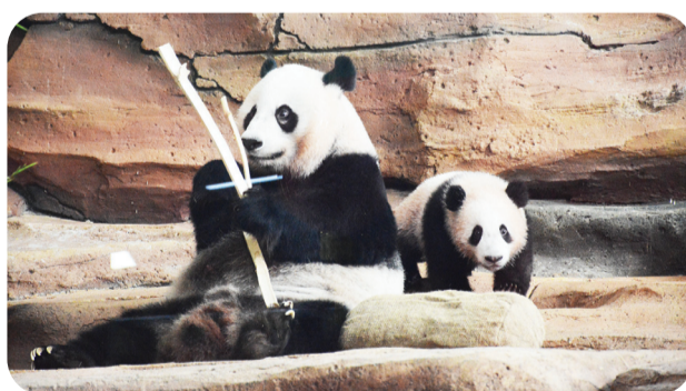
Bayi panda Rio bersama induknya.