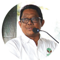
Dr. Ahmad Munawir

"Kami terus mengembangkan kemampuan Rio melalui program pelatihan terstruktur