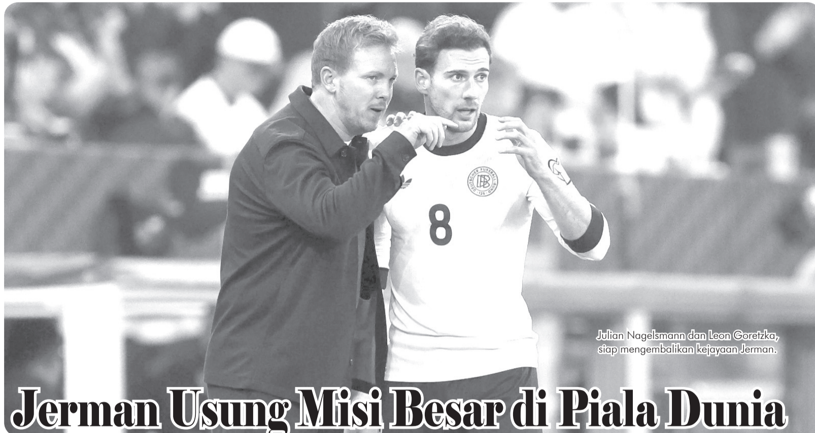
Julian Nagelsmann dan Leon Goretzka, siap mengembalikan kejayaan Jerman.