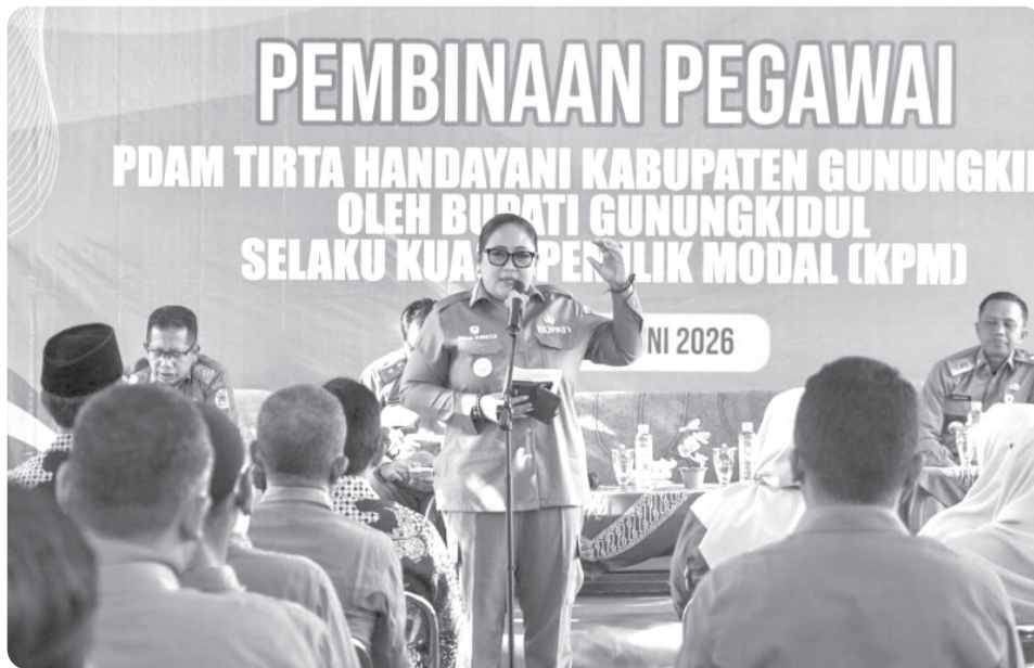
PEMKAB GUNUNGKIDUL PENUHI KEBUTUHAN AIR BERSIH