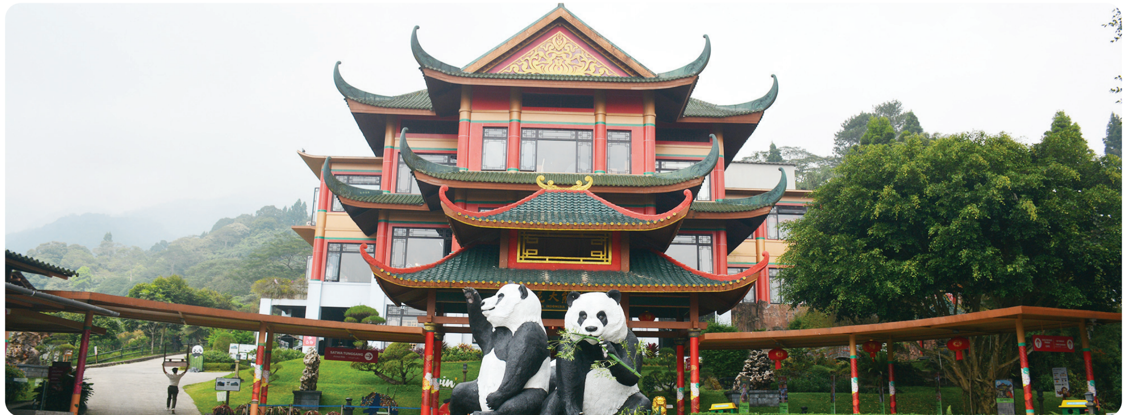
Istana Panda Indonesia, Taman Safari Indonesia.