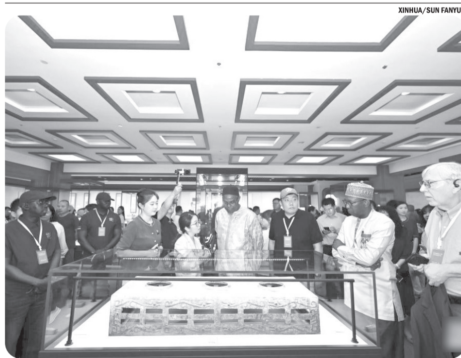
DELEGASI MULTINASIONAL KUNJUNGI MUSEUM TIANJIN Anggota delegasi multinasional mengunjungi Museum Tianjin di Tianjin, Tiongkok, Selasa (9/6/2026). Tur delegasi multinasional baru-baru ini diluncurkan di Tianjin, menyoroti kemajuan Tiongkok dalam hak asasi manusia dan bagaimana pembangunan tersebut telah meningkatkan kehidupan masyarakat.

Lembaga tersebut akan menganugerahkan Penghargaan Mark Twain untuk Humor Amerika kepada komedian Bill Maher dalam sebuah acara gala yang menampilkan deretan nama besar di dunia komedi dan hiburan, seperti Louis C.K., Woody Harrelson, hingga Jay Leno. tom