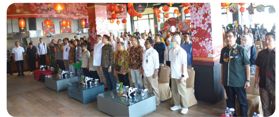
Para tamu kehormatan yang hadir.