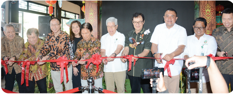
Prosesi gunting pita.