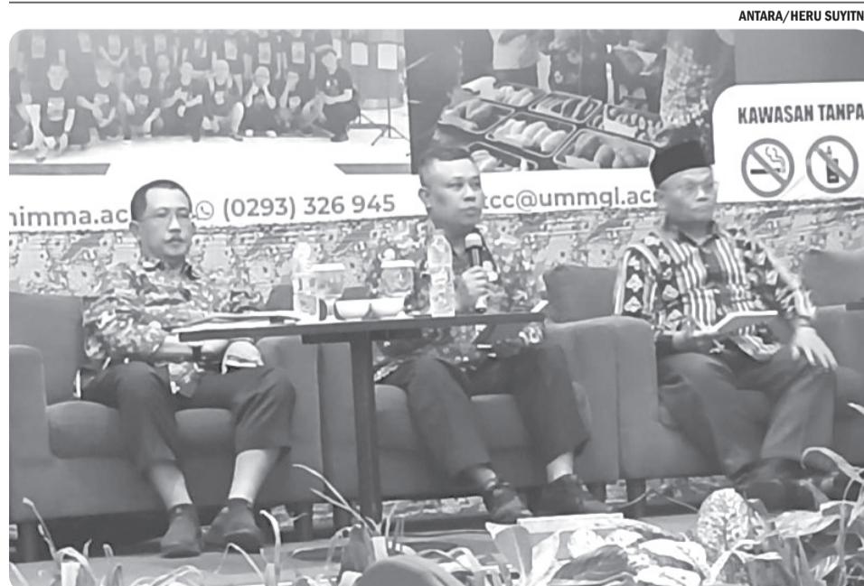
LUAS TANAM TEMBAKAU DI TEMANGGUNG TURUN 5.000 HA

"Perusahaan saat ini tidak hanya melihat kemampuan teknis, tetapi juga sikap serta aktivitas media sosial pelamar sebagai bagian dari penilaian karakter," ucapnya. ● pur