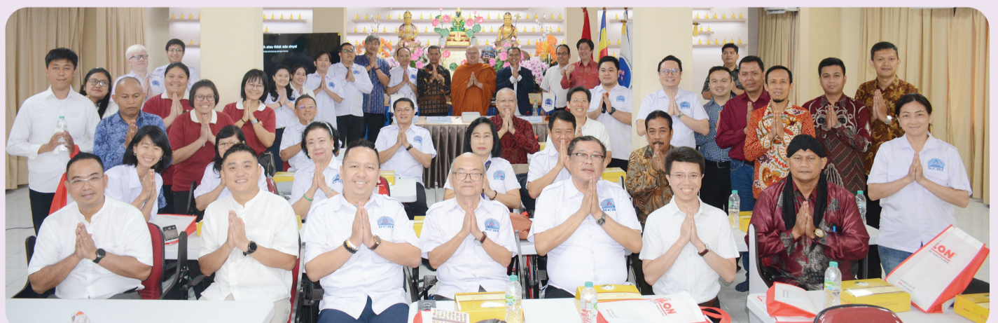
Para pimpinan organisasi dan pengurus berfoto bersama.