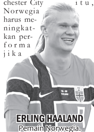
ERLING HAALAND Pemain Norwegia.

Haaland menilai timnya berhasil memenuhi ekspektasi sebagai unggulan pada pertandingan pembuka tersebut. "Kami memang diharapkan menang dan untungnya kami menang. Sekarang semua orang di Norwegia akan bahagia dan saya harap mereka merayakannya," ujarnya. ●vdp