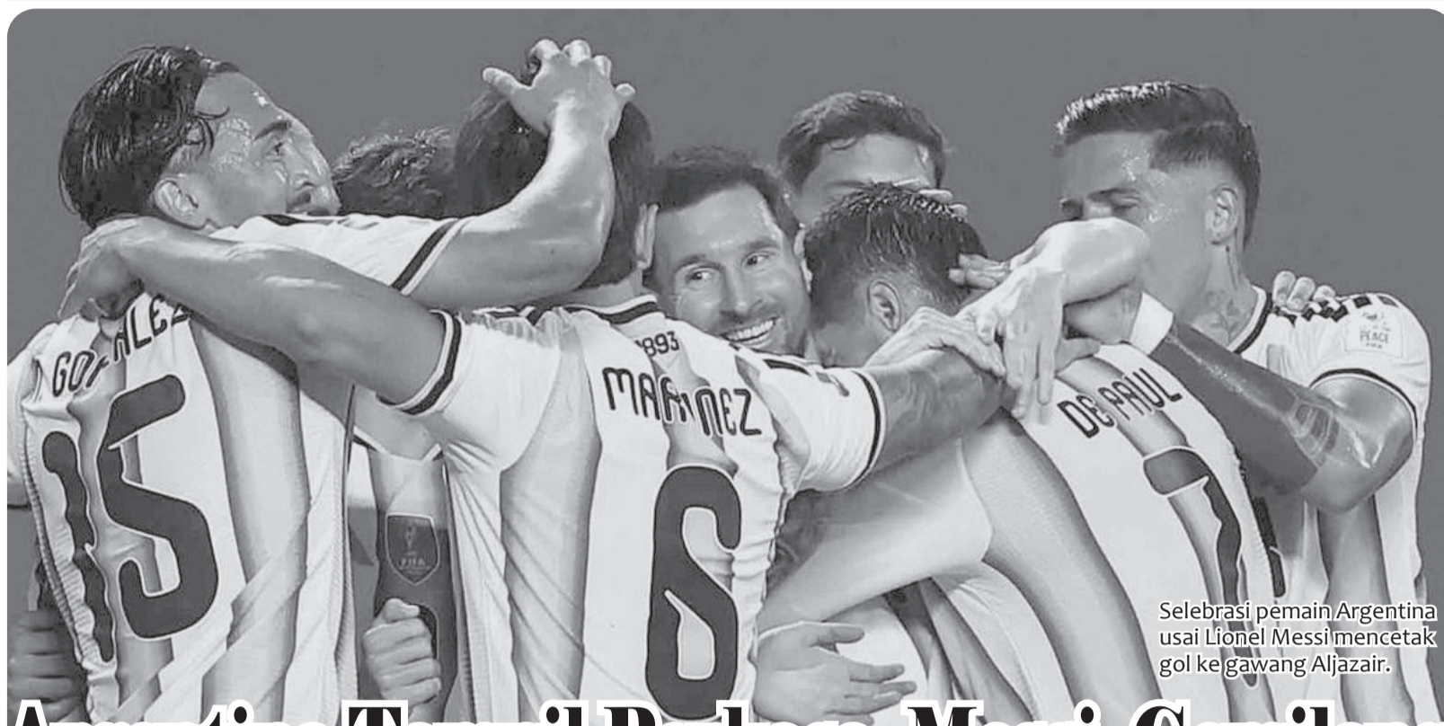
Selebrasi pemain Argentina usai Lionel Messi mencetak gol ke gawang Aljazair.