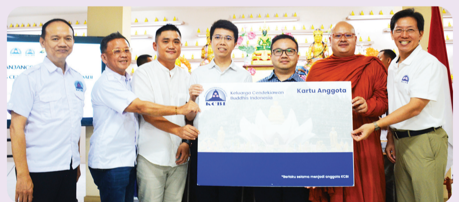
Pemberian kartu anggota secara simbolis.