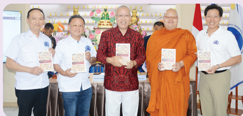
Penyerahan buku Ikon Buddhis Dunia.

Kehadiran para tokoh tersebut mencerminkan kuatnya komitmen bersama dalam membangun kolaborasi yang berkelanjutan guna memperkuat peran intelektual Buddhis dalam bidang pendidikan, pengembangan sumber daya manusia, pengabdian masyarakat, serta pembangunan karakter bangsa yang berlandaskan nilai-nilai Dharma. ● kris