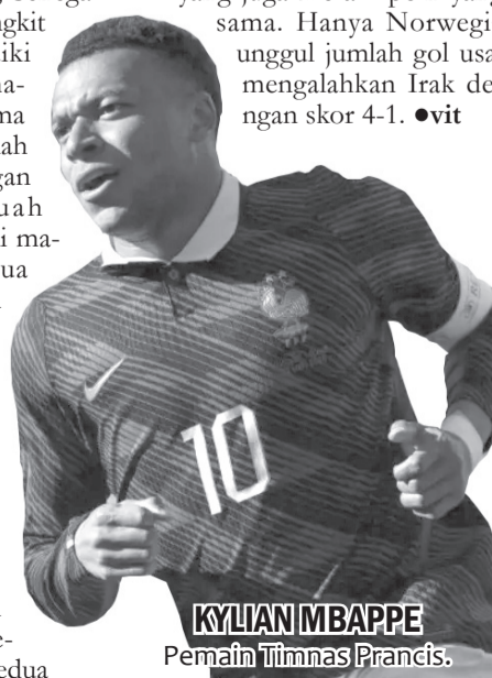
KYLIAN MBAPPE Pemain Timnas Prancis.

klasemen grup, mengoleksi tiga poin di bawah Norwegia yang juga meraih poin yang sama. Hanya Norwegia unggul jumlah gol usai mengalahkan Irak dengan skor 4-1. ●vit