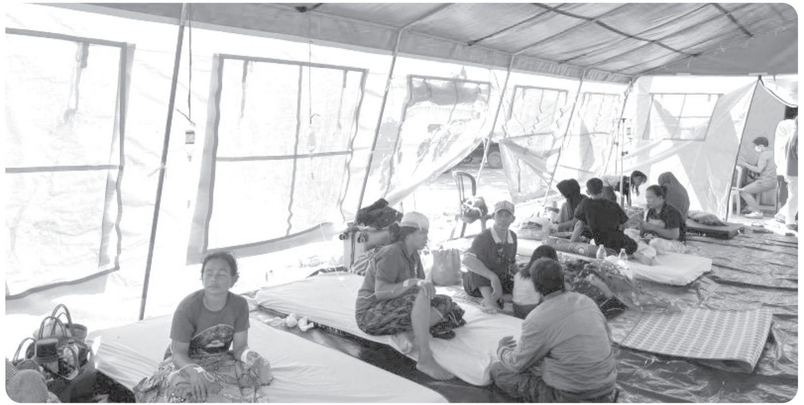
KORBAN BENCANA GEMPA BUMI SIGI

Masyarakat korban bencana gempa bumi di Kabupaten Sigi, Sulawesi Tengah sementara dirawat pada tenda darurat di lingkungan RSUD Torabelo Sigi, Rabu (17/6/2026). Dinas Pendidikan dan Kebudayaan Kabupaten Sigi, Sulawesi Tengah menghentikan kegiatan belajar mengajar pada seluruh satuan pendidikan seperti TK, sekolah dasar dan sekolah menengah pertama (SMP) pascagempa bumi di daerah tersebut.