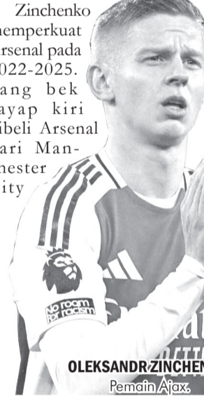
OLEKSANDR ZINCHENKO Pemain Ajax.

Zinchenko memperkuat Arsenal pada 2022-2025. Sang bek sayap kiri dibeli Arsenal dari Manchester City