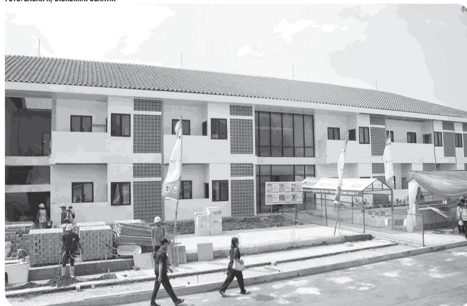
SEKOLAH RAKYAT: Sekolah Rakyat Provinsi Jawa Barat 2 yang berlokasi di Desa Sukamahi, Kecamatan Cikarang Pusat.

CIKARANG PUSAT (LB) - Program Sekolah Rakyat (SR) di Kabupaten Bekasi, Jawa Barat, dipastikan mulai melaksanakan kegiatan belajar-mengajar (KBM) pada tahun ajaran 2026 yang akan berlangsung pada akhir Juni mendatang.