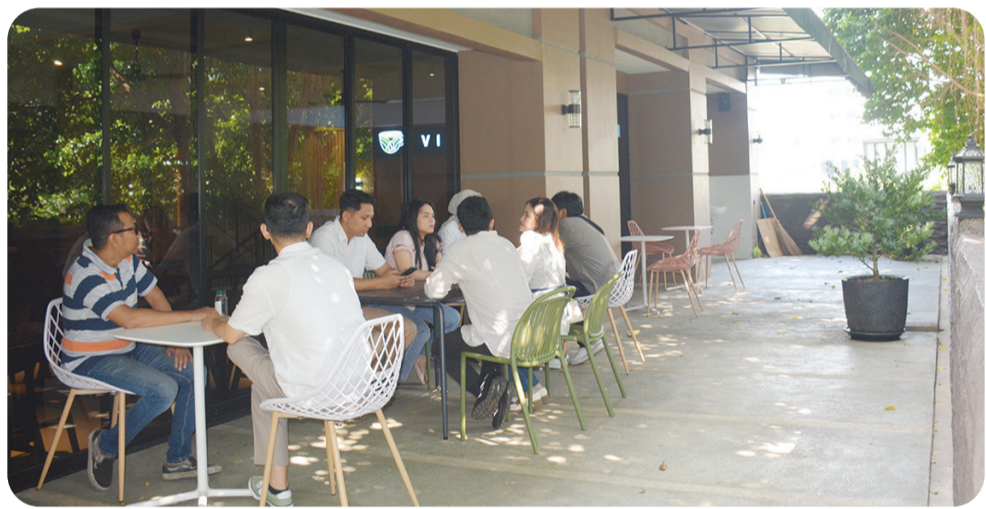
Pilihan ruang outdoor yang teduh untuk bersantai.