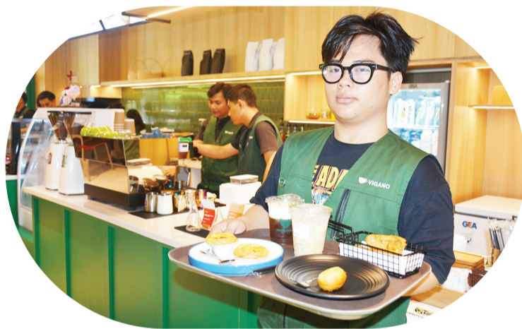
Staf pelayanan memberikan pengalaman makan dan minum yang nyaman dan menyenangkan.