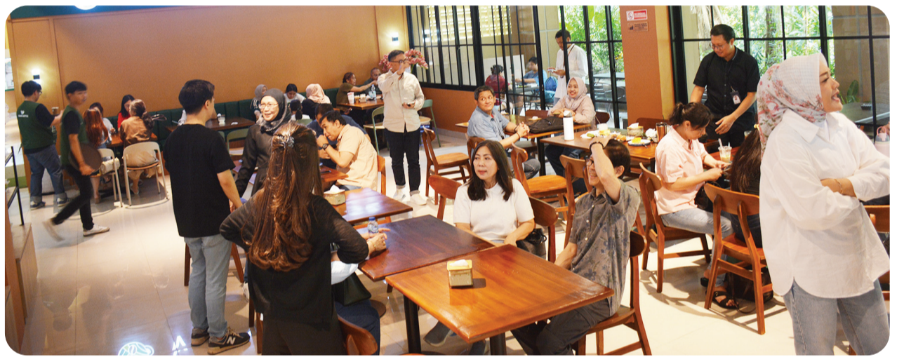
Pilihan ruang indoor yang nyaman dan elegan.