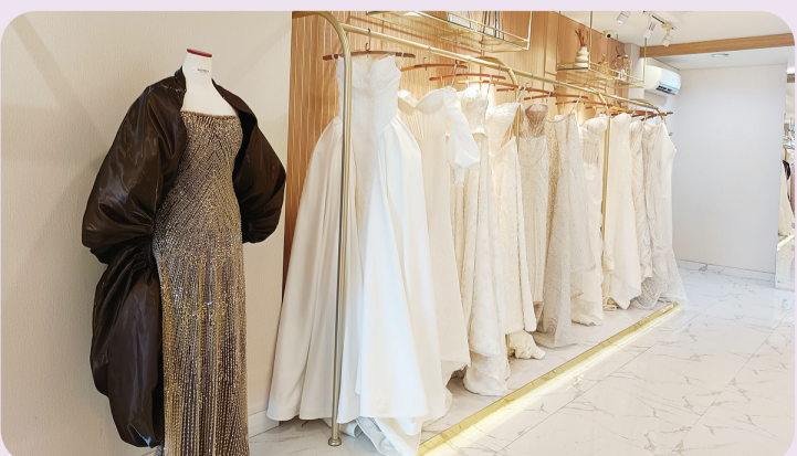
Contoh gaun produksi Alvuella Couturier.