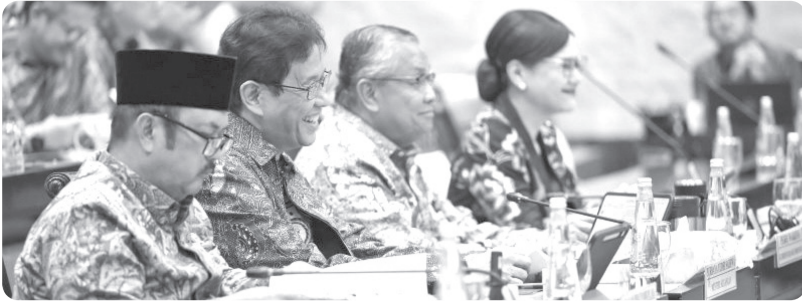
PEMERINTAH KEJAR PERTUMBUHAN LEWAT "PRO GROWTH-PRO WELFARE"

KI-KA: Menteri PPN/Kepala Bappenas Rachmat Pambudy, Menteri Keuangan Purbaya Yudhi Sadewa, Gubernur BI Perry Warjiyo, dan Ketua Dewan Komisiner OJK (Otoritas Jasa Keuangan) Friderica Widayarsi Dewi dalam Rapat Kerja bersama Komisi XI DPR RI di Jakarta, Rabu (10/6/2026). Pemerintah mengejar pertumbuhan ekonomi nasional pada 2027 melalui strategi pro pertumbuhan dan pro kesejahteraan atau "pro growth-pro welfare."