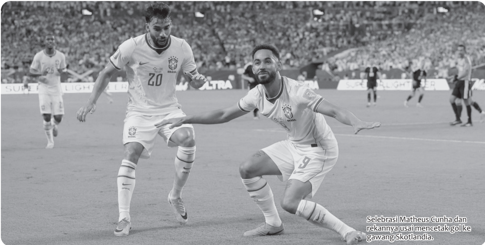
Selebrasi Matheus Cunha dan rekannya usai mencetak gol ke gawang Skotlandia.