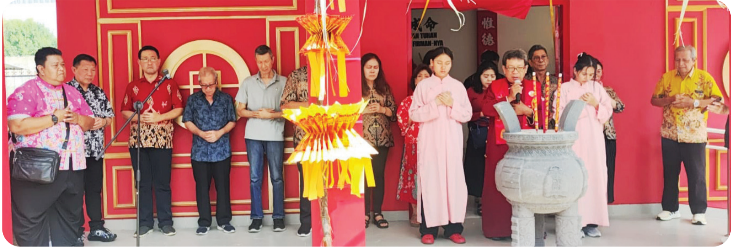
Prosesi sembahyang Tiam.