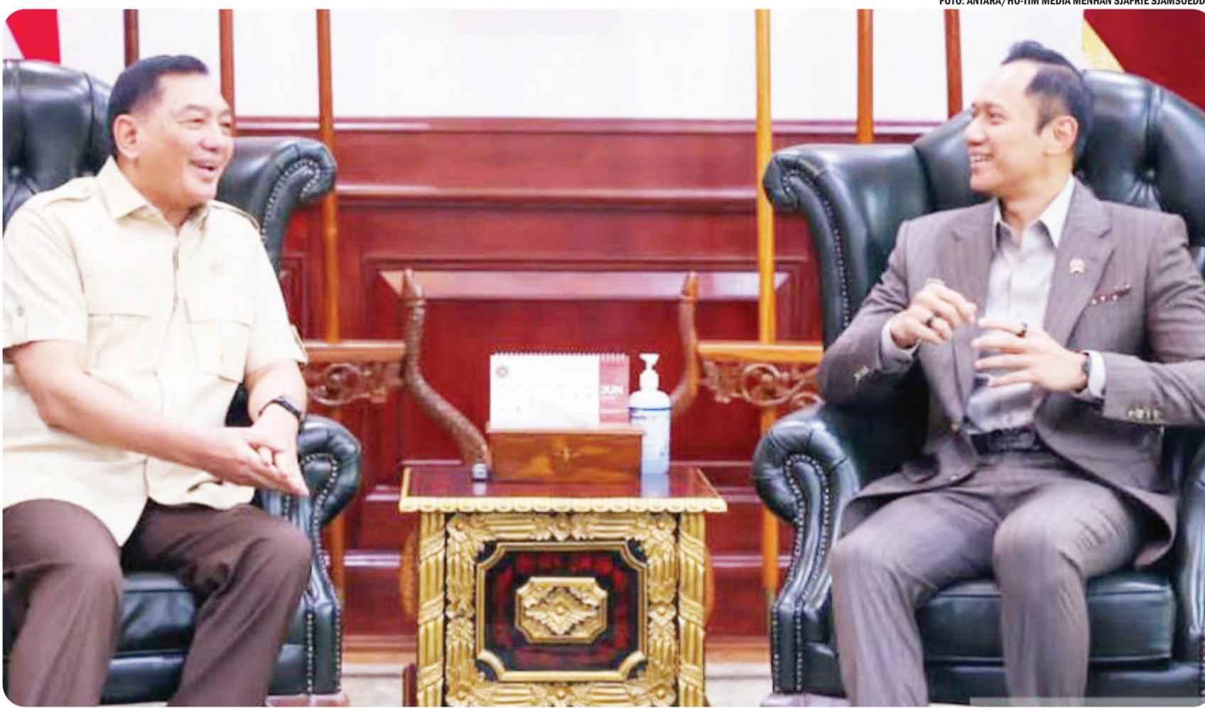
SJAFRIE SJAMSOEDDIN

HARGA ECERAN DALAM KOTA : Rp3.500, LUAR KOTA + ONGKOS KIRIM