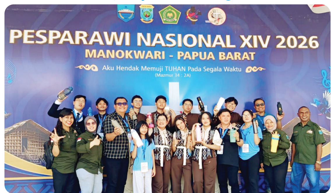
Para kontingen Pesparawi 2026 membawa tumbler selama berlangsungnya acara di Manokwari, Papua Barat.

Ketika ribuan peserta dari seluruh Indonesia membawa semangat yang sama, PESPARAWI tidak hanya menjadi ajang menampilkan