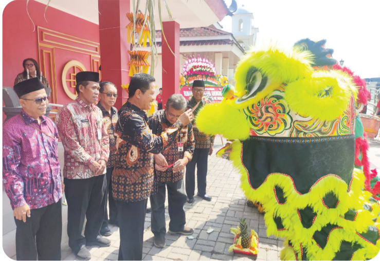
Prosesi pemberian angpao ke barongsai.