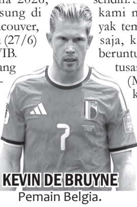
KEVIN DE BRUYNE Pemain Belgia.

Namun Selandia Baru berpeluang menciptakan kejutan melalui serangan balik, namun sulit membayangkan mereka mampu meredam Belgia selama 90 menit penuh. •vit