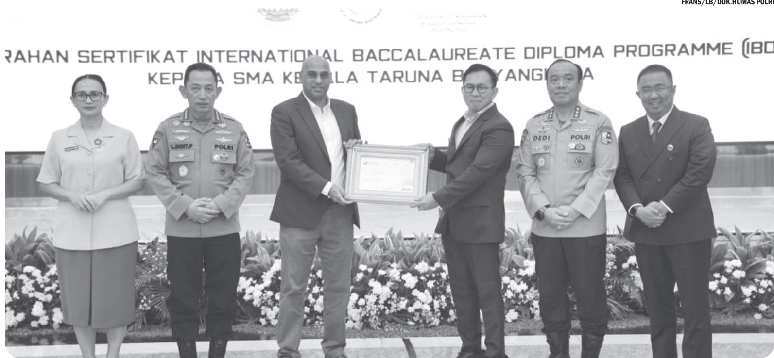
TERIMA SERTIFIKAT IBDP SMA KTB