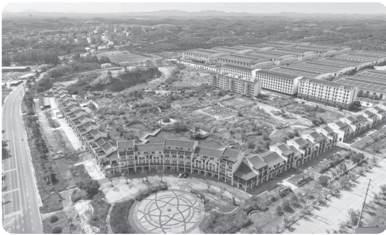
KAWASAN INDUSTRI KOTA LUWU - TIONGGOK Foto udara yang diambil oleh drone pada 10 Juni 2026 menunjukkan pemandangan kawasan industri di Kota Luwu, Kabupaten Lingshan, Daerah Otonomi Zhuang Guangxi, Tiongkok.