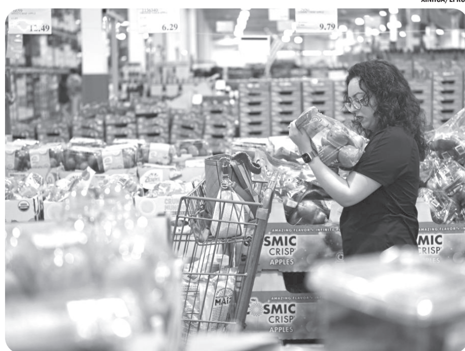
INDEKS HARGA KONSUMEN AS BULAN MEI NAIK KE LEVEL TERTINGGI Seorang wanita berbelanja bahan makanan di sebuah toko di Arlington, Virginia, Amerika Serikat, pada 10 Juni 2026. Menurut data yang dirilis Biro Statistik Tenaga Kerja AS pada hari Rabu, Indeks harga konsumen (CPI) AS naik 4,2 persen secara tahunan pada bulan Mei, menandai level tertinggi sejak Mei 2023, karena harga energi tetap tinggi.

"Klaim Trump bahwa pejabat Iran menghembunginya dibantah keras. Ini adalah dalih untuk menghindari perang," tegas IRGC. Kantor berita Tasnim menyebut pernyataan Trump sebagai "kebohongan mutlak" dan menegaskan Iran akan memberikan respons menghancurkan atas agresi militer AS. Televisi pemerintah Iran, mengutip pejabat senior yang tak disebutkan namanya, menilai klaim itu bertujuan menutupi mundurnya AS dari konfrontasi dengan Teheran. ●tom