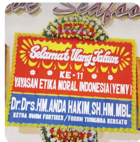
Papan bunga ucapan dari HM Anda Hakim.