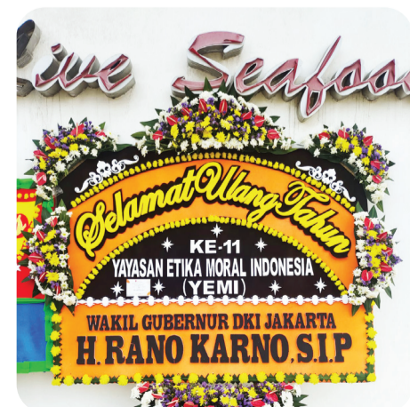
Papan bunga ucapan dari Wakil Gubernur Rano Karno.