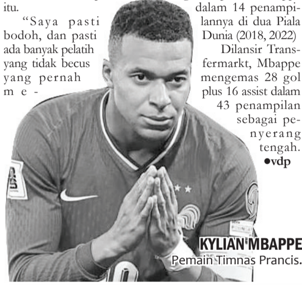
KYLIAN MBAPPE Pemain Timnas Prancis.

"Saya pasti bodoh, dan pasti ada banyak pelatih yang tidak becus yang pernah me-