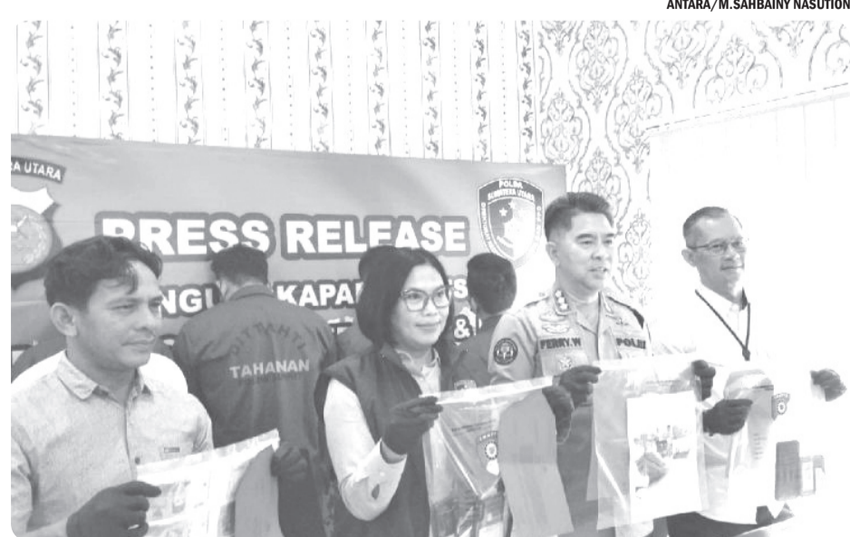
KASUS PENYELUNDUPAN PEKERJA MIGRAN ILEGAL KE MALAYSIA

"Berawal di area Kelapa Gading, Jakarta Utara, kemudian tim melakukan penyelidikan. Saat dilakukan tempat target berpindah ke daerah Cempaka Putih, Jakarta Pusat lalu target berpindah tempat ke daerah Krukut, Tamansari, Jakarta Barat," ungkapnya. • osm