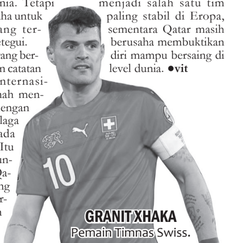
GRANIT XHAKA Pemain Timnas Swiss.

demikian, kondisi saat ini jauh berbeda. Swiss berkembang menjadi salah satu tim paling stabil di Eropa, sementara Qatar masih berusaha membuktikan diri mampu bersaing di level dunia. ●vit