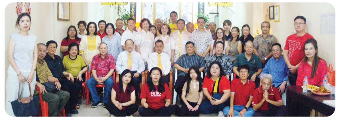
Pengurus dan anggota YEMI berfoto bersama.

“Sebelas tahun perjalanan YEMI merupakan amanah yang harus terus dijaga dan dikembangkan. Kami berharap YEMI dapat terus menjadi wadah yang memberikan manfaat nyata bagi masyarakat, memperkuat