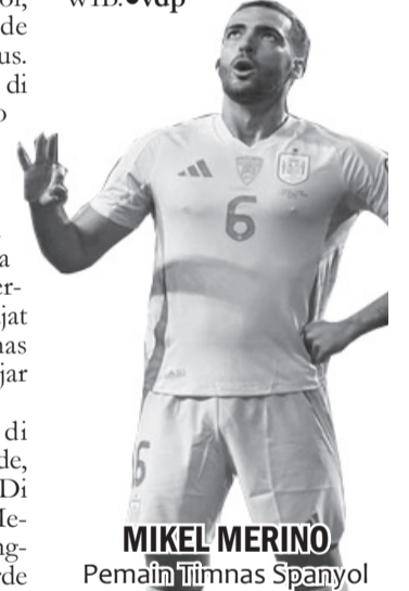
MIKEL MERINO Pemain Timnas Spanyol