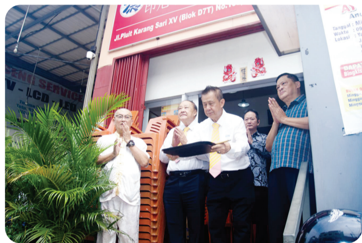
Prosepsi sembahyang bersama.