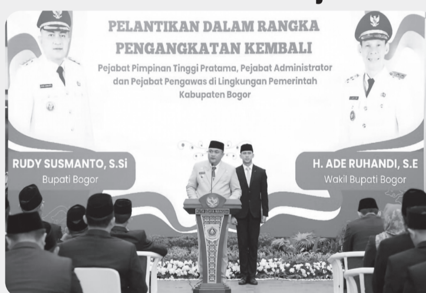
Bupati Bogor, Rudy Susmanto meresmikan dua SKPD baru yang beroperasi di VIVO Mall, Sukaraja, Jumat (2/1).

CIBINONG (LB) - Bupati Bogor, Rudy Susmanto meresmikan dua SKPD baru yang beroperasi di VIVO Mall, Sukaraja, Jumat (2/1).