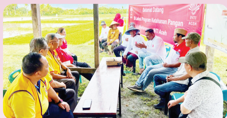
Pengurus INTI dan Marga Huang Jakarta berdiskusi dengan para petani Aceh mengenai teknologi pertanian modern.

Azmi meyakini dengan kekuatan jaringan yang dimiliki oleh INTI sekarang ini baik di dalam maupun luar negeri akan memberi banyak kemajuan bagi Aceh khususnya dalam bidang ekonomi dan perdagangan. ● kris