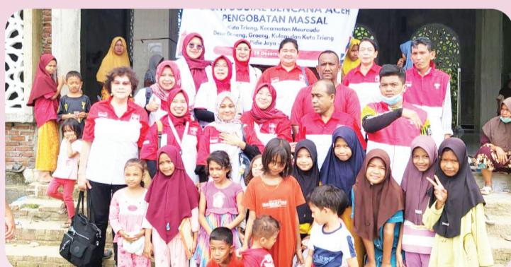
Tim dokter relawan berfoto bersama anak-anak seusia bakso.

sembilan orang dokter relawan dari Banda Aceh melayani warga berobat.