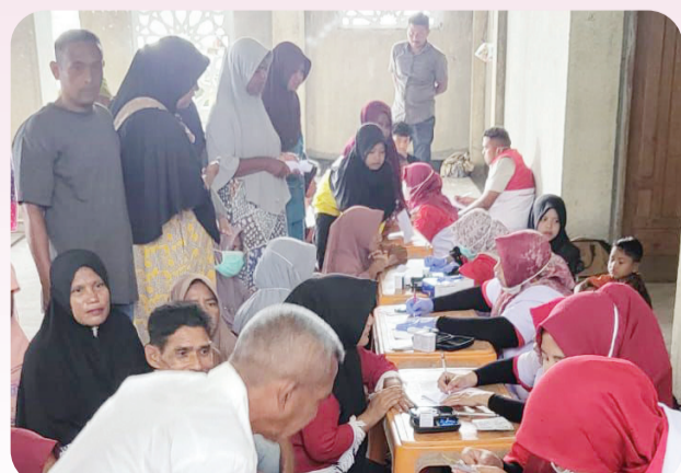
Warga korban bencana tampak antusias mengikuti pengobatan gratis.

Sementara program dapur umum INTI di Pidie Jaya juga terus berlanjut, setiap hari 19 orang tim relawan INTI Aceh memasak dan membagikan ratusan nasi bungkus langsung