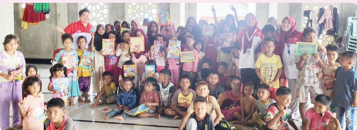
Trauma healing bermain bersama anak-anak korban bencana.