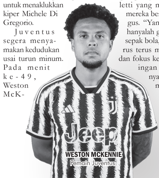
WESTON MCKENNIE Pemain Juventus.