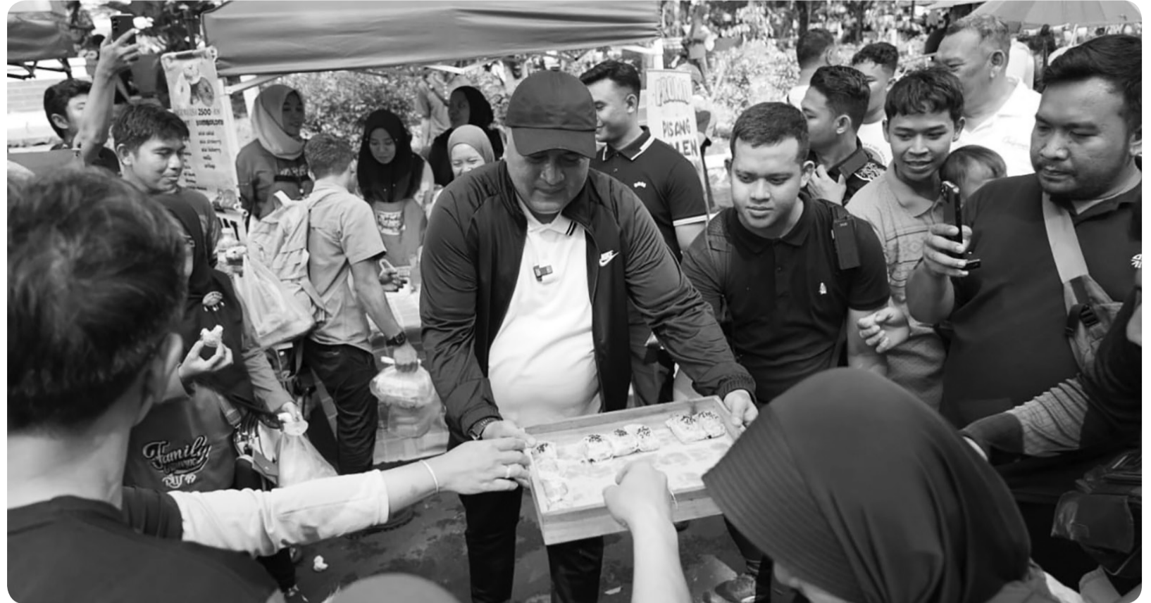
Bupati Bogor awali tahun 2026 dengan membukan kegiatan CFD di kawasan Tegar Beriman, Minggu pagi (4/1).