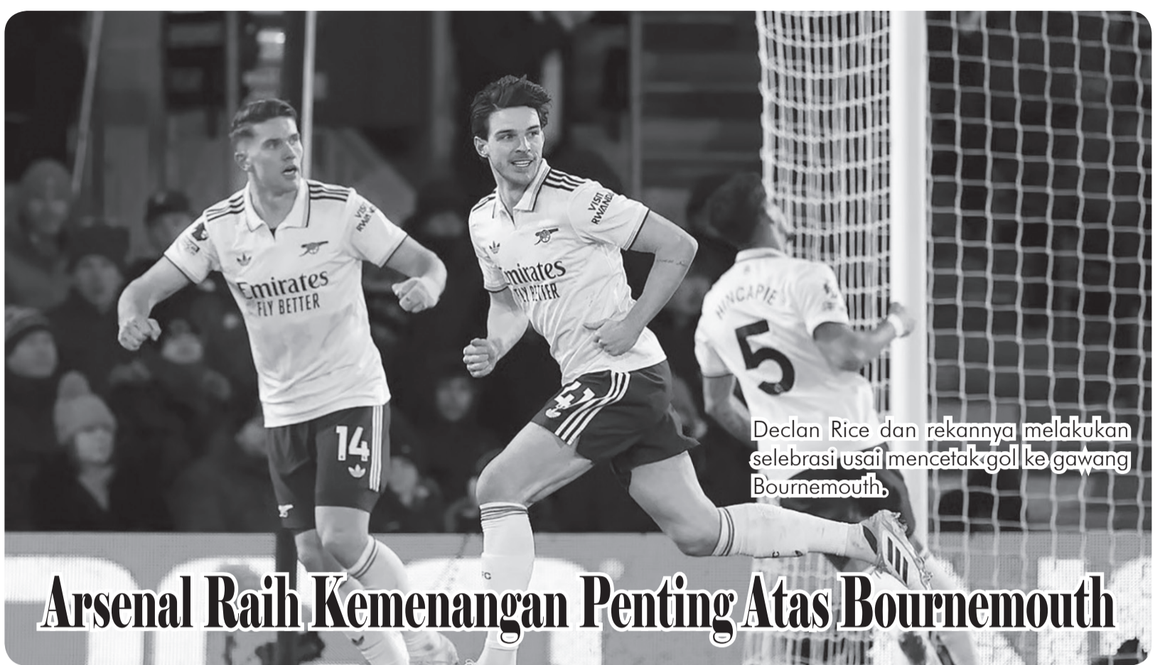
Declan Rice dan rekannya melakukan selebrasi usai mencetak gol ke gawang Bournemouth.