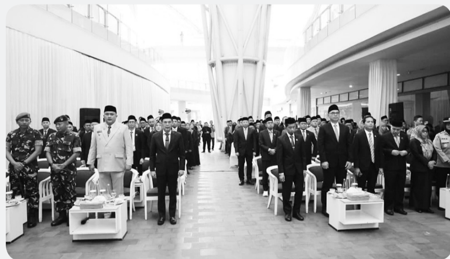
Pelantikan dan pengambilan sumpah jabatan Pejabat Pimpinan Tinggi Pratama, Pejabat Administrator Dan Pejabat Pengawas dilakukan pada hari kerja pertama tahun 2026, di VIVO Mall, Sukaraja, Jumat (2/1).

Keberadaan Mal Pelayanan Publik nantinya tidak hanya berfungsi sebagai pusat layanan pemerintahan,