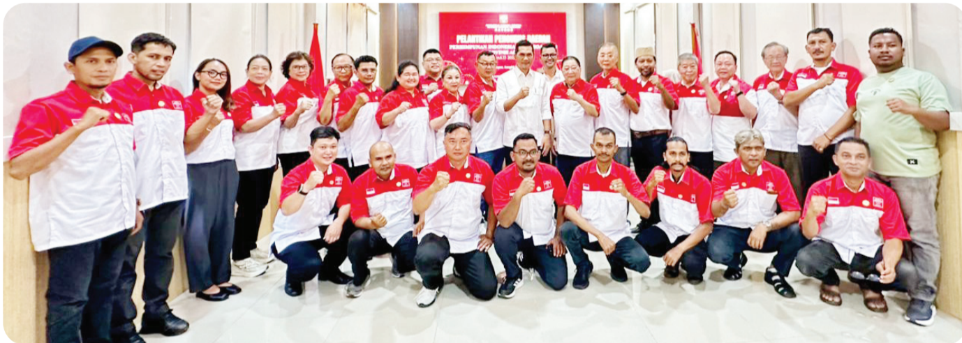
Foto bersama pengurus INTI dengan Sekda Aceh dan Kadispورا Aceh.