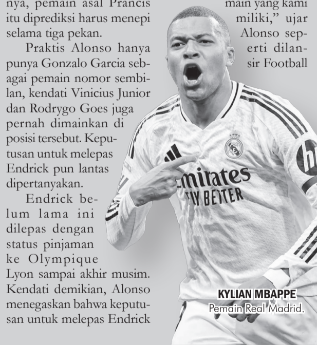
KYLIAN MBAPPE Pemain Real Madrid.

"Kami akan berupaya mempersingkat waktu absennya. Ini tentang perasaan. Kami akan melakukan segala yang mungkin untuk mempersingkat (absennya) agar dia bisa siap secepat mungkin. Tapi kapan itu? Itulah pertanyaannya, saya tidak tahu," ujar Alonso dikutip ESPN. ●