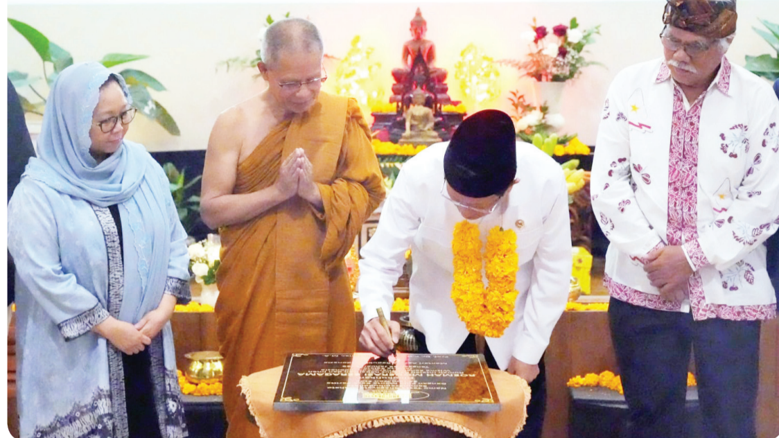
Menag Nasaruddin Umar meresmikan Wisma Sangha Theravada sebagai Rumah Moderasi Beragama.

man; semua orang takut akan kematian. Setelah membandingkan orang lain dengan diri sendiri, hendaknya seseorang tidak membunuh atau mengakibatkan pembunuhan. Maka dari itulah, mari jadikan tempat ini