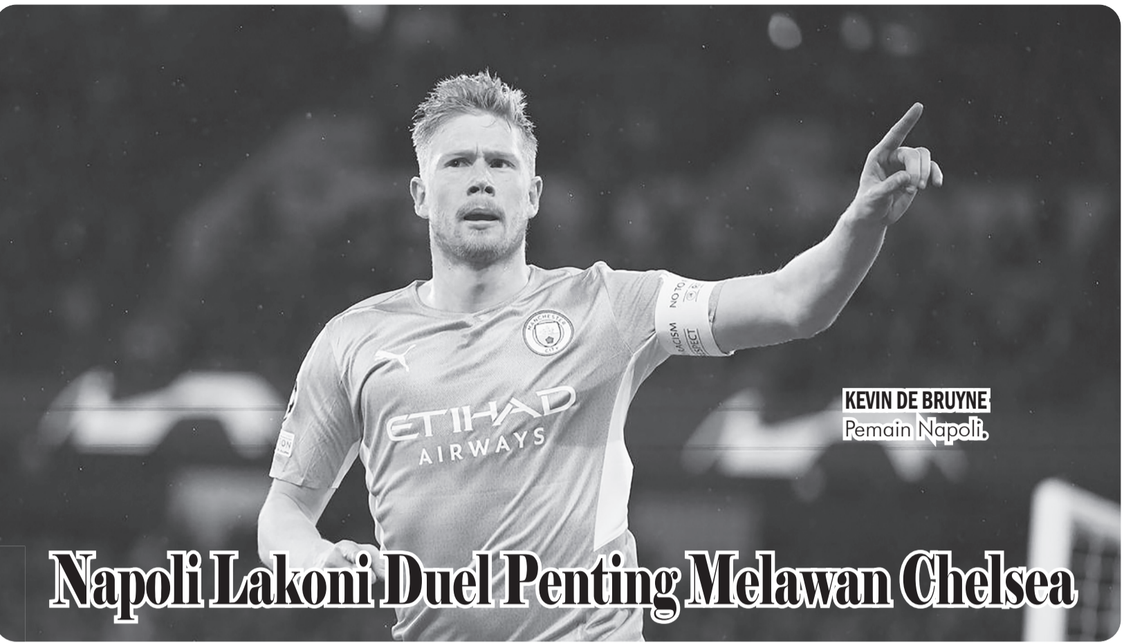
KEVIN DE BRUYNE Pemain Napoli.