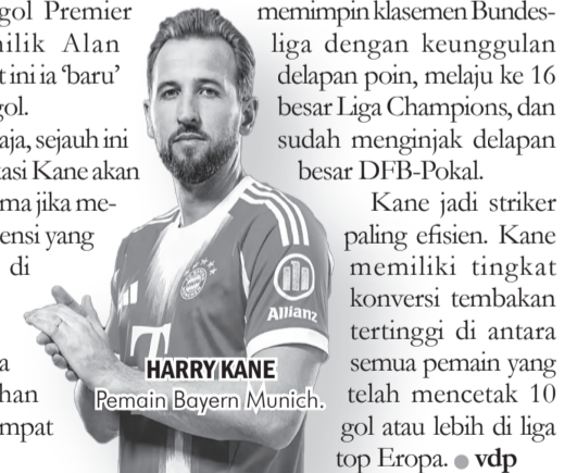
HARRY KANE Pemain Bayern Munich.

Kane jadi striker paling efisien. Kane memiliki tingkat konversi tembakan tertinggi di antara semua pemain yang telah mencetak 10 gol atau lebih di liga top Eropa. ● vdp