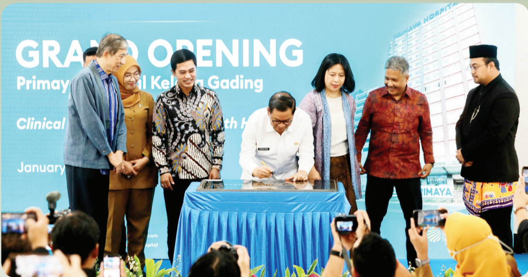
Prosesi penandatanganan prasasti peresmian Primaya Hospital Kelapa Gading.