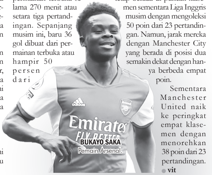
Emirates FLY BETTER BUKAYO SAKA Pemain Arsenal.

Sementara Manchester United naik ke peringkat empat klasemen dengan menorehkan 38 poin dari 23 pertandingan. ● vit