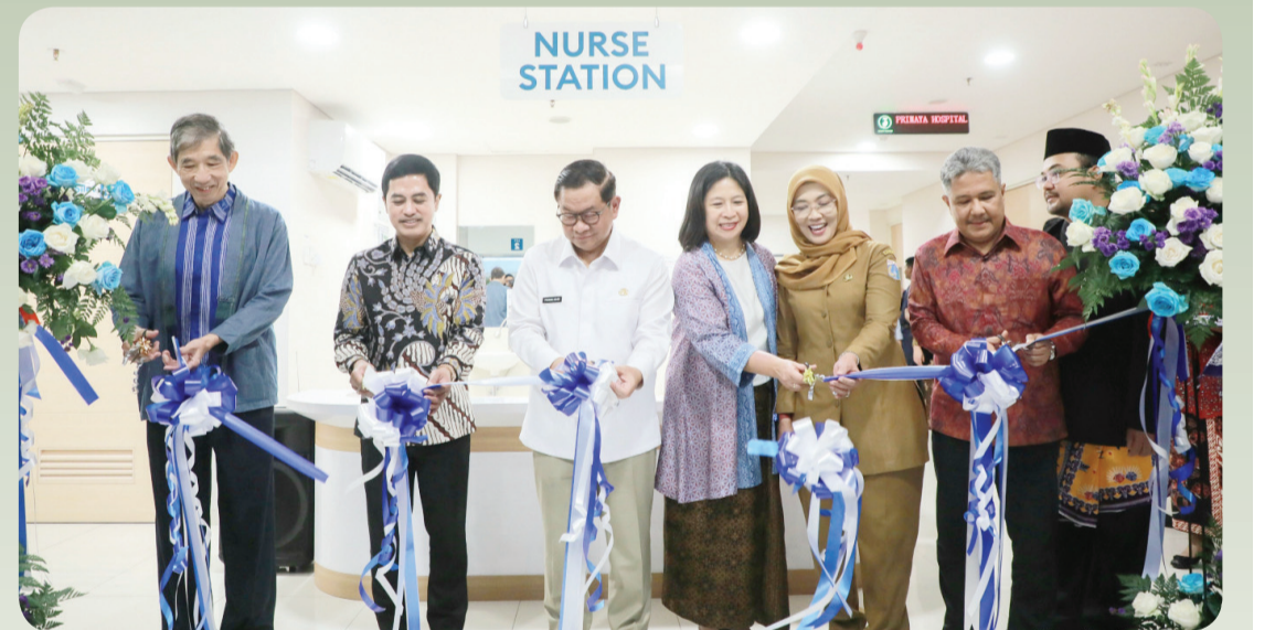
Prosesi pengguntingan pita menandai pembukaan operasional rumah sakit.

JAKARTA (LB) - Gubernur DKI Jakarta Pramono Anung bersama Wakil Menteri Kesehatan RI Dante Saksono Harbuwono meresmikan Primaya Hospital Kelapa Gading, Cakung Barat, Jakarta Timur, Selasa (27/1/2026).