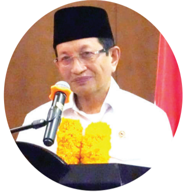
Menag Nasaruddin Umar