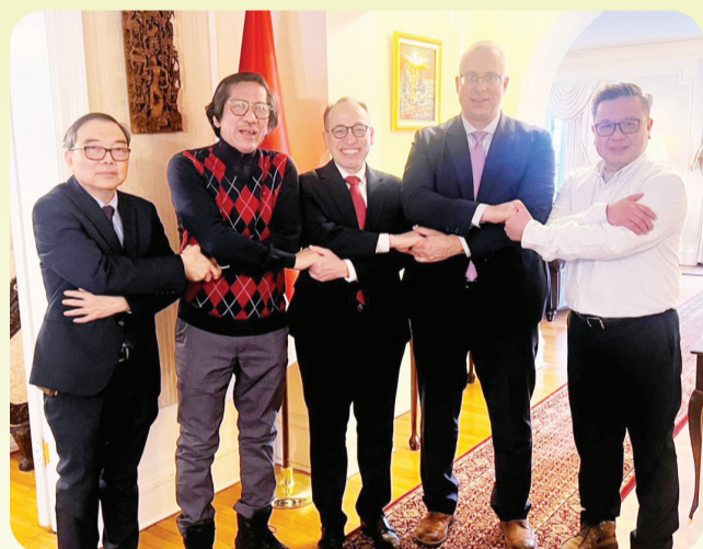
Kesepakatan membentuk CBF Indonesia Regional Chapter Canada dengan restu dari Dubes RI Muhsin Syihab.