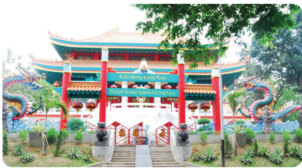
Kelenteng "Kong Miao" TMII.

Kong Miao sendiri terdiri dari tiga bangunan utama antara lain Tian Tan, altar khusus untuk sembahyang kehadiran Tian/Shang Di, Da Cheng Dian, altar Shengren Kong Zi, dan Qi Fu Dian, yang berisi altar para Shen Ming seperti Guan Yin Niang Niang, Tian Shang Sheng Mu, Guan Yu/Guan Di/