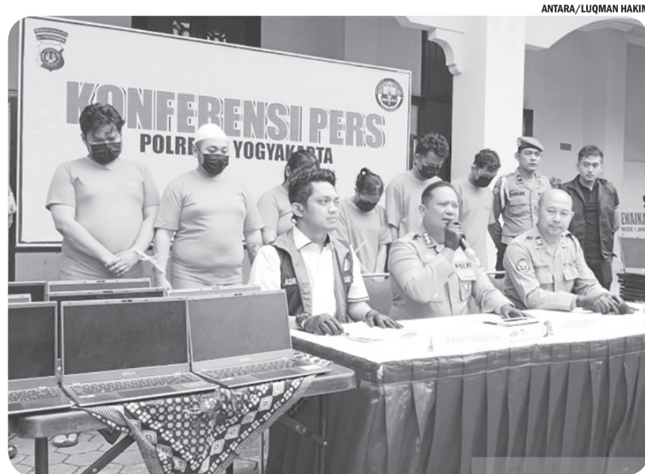
PENGUNGKAPAN SINDIKAT LOVE SCAMMING INTERNASIONAL

Atas perbuatannya, para tersangka dijerat dengan sejumlah pasal, di antaranya Pasal 407 atau Pasal 492 KUHP sebagaimana diatur dalam UU Nomor 1 Tahun 2023, juncto Pasal 20 dan Pasal 21 KUHP, serta ketentuan dalam UU Informasi dan Transaksi Elektronik dan UU Pornografi dengan ancaman hukuman minimal enam bulan dan paling lama 10 tahun penjara. • osm