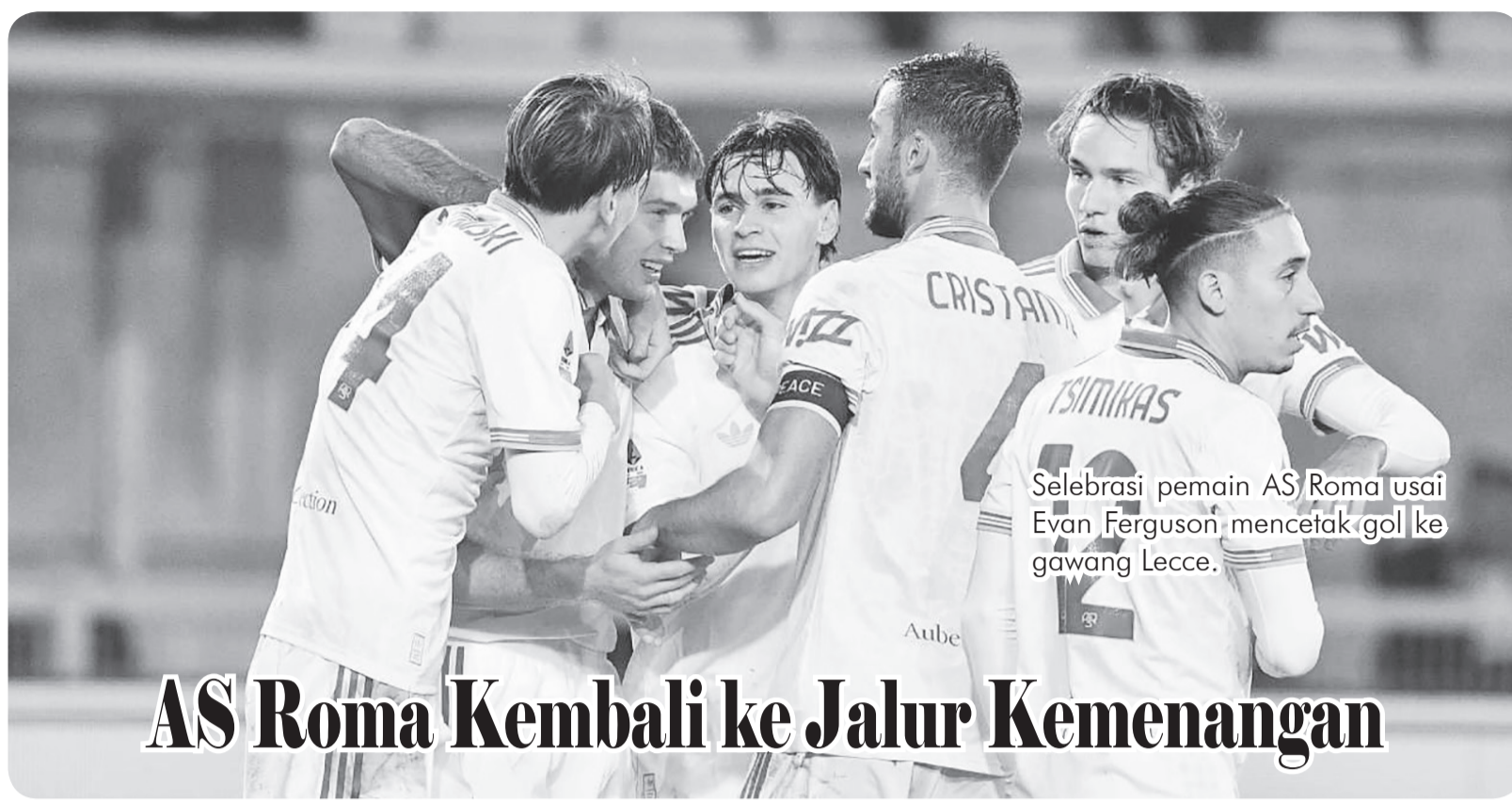
Selebrasi pemain AS Roma usai Evan Ferguson mencetak gol ke gawang Lecce.