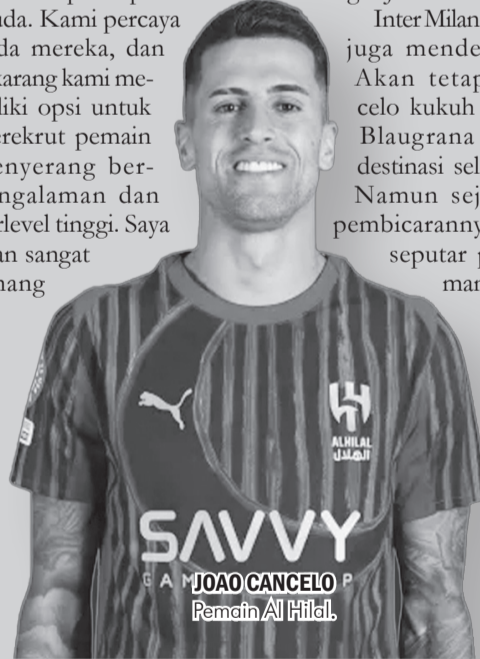
JOAO CANCELO Pemain Al Hilal.

Inter Milan kabarnya juga mendekatinya. Akan tetapi, Cancelo kukuh memilih Blaugrana sebagai destinasi selanjutnya. Namun sejauh ini, pembicaraan masih seputar pinjaman. ● vdp