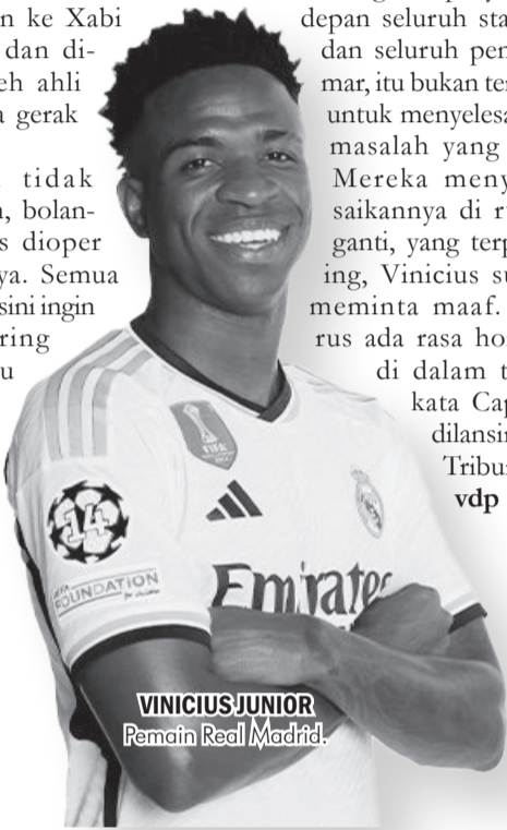
VINICIUS JUNIOR Pemain Real Madrid.

depan seluruh stadion dan seluruh penggemar, itu bukan tempat untuk menyelesaikan masalah yang ada. Mereka menyelesaikannya di ruang ganti, yang terpenting, Vinicius sudah meminta maaf. Harus ada rasa hormat di dalam tim," kata Capello dilansir dari Tribuna. ● vdp