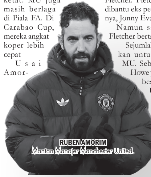
RUBEN AMORIM Mantan Manajer Manchester United.

Howe yang kini membesut Newcastle United, Oliver Glasner yang sedang menjadi manajer Crystal Palace dan juga Ole Gunnar Solskjaer. ● vit