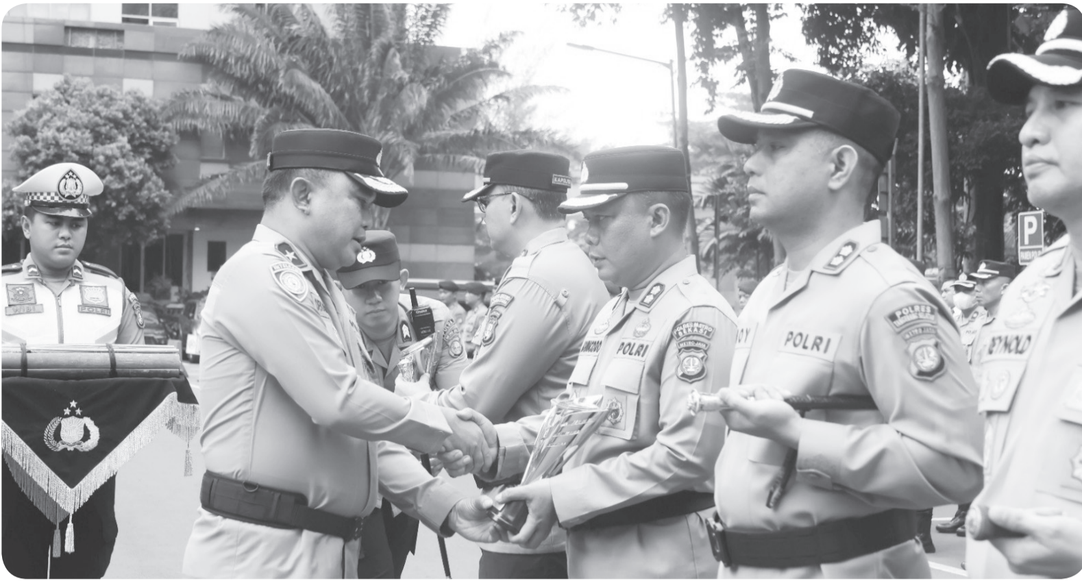
PENGHARGAAN POS TERBAIK OPS LILIN JAYA 2025