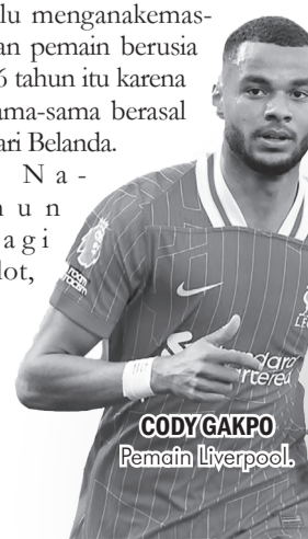
CODY GAKPO Pemain Liverpool.

Gakpo sudah mengumpulkan 7 gol dari 29 pertandingan Liverpool. Dia berada di urutan ketiga top skor sementara The Reds setelah Ekitike (12 gol) dan Szoboszlai (8 gol). • vit