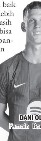
DANI OLMO Pemain Barcelona.