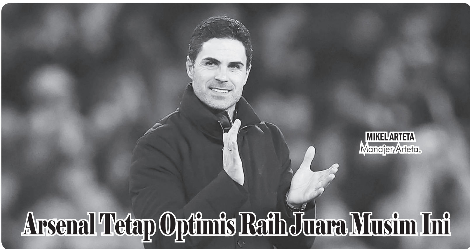
MIKEL ARTETA Manajer Arsenal.