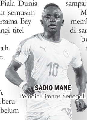
SADIO MANE Pemain Timnas Senegal.

Mane turut membantu masyarakat di sana dengan memberikan bantuan makanan dan uang tunai. Namun hal itu tidak terkuak dari mulutnya sendiri, melainkan dari penuturan orang-orang lain. ● vit