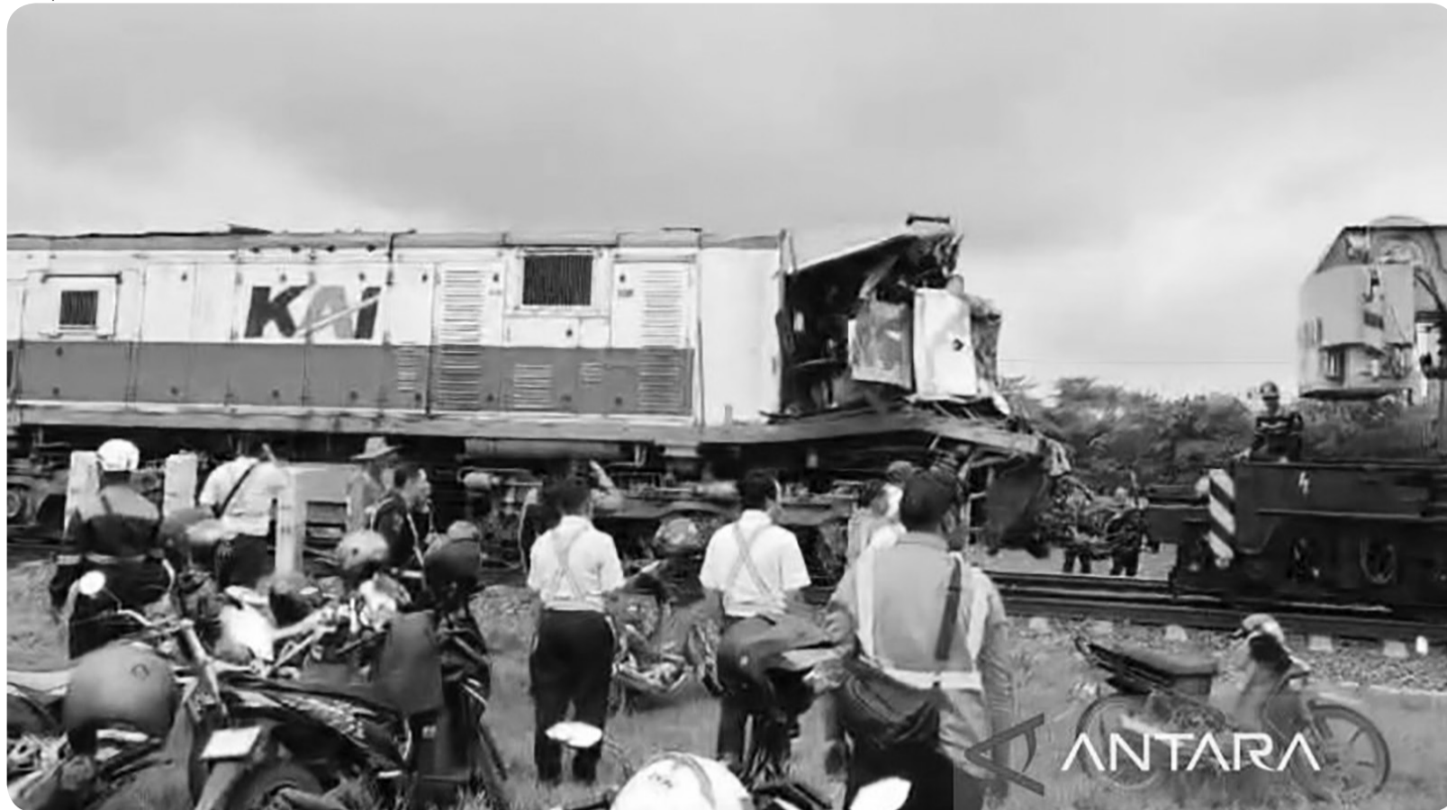
KECELAKAAN KERETA API DI CIREBON

Proses evakuasi lokomotif yang mengalami kecelakaan di Cirebon, Jawa Barat, Rabu (21/1/2026). PT KAI Daop (Kereta Api Indonesia Daerah Operasi) 3 Cirebon memastikan tidak ada penumpang yang mengalami cedera dalam insiden KA Menoreh relasi Semarang Tawang-Pasar Senen yang tertemper truk di Kabupaten Cirebon, Jawa Barat, pada Rabu dini hari.