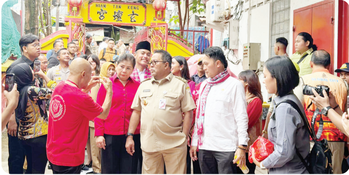
Wagub Rano Karno bersama Kevin Wu dan Wali Kota lin Mutmainnah saat mengunjungi Vihara Kim Tek Yan.