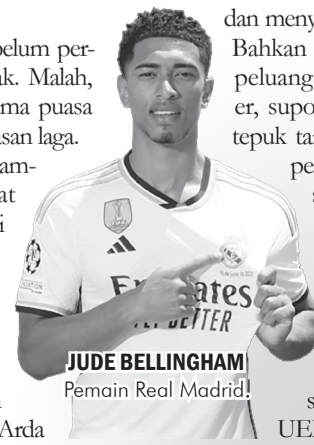
JUDE BELLINGHAM Pemain Real Madrid!

"Saya rasa, para supporter kini mendukung Vinicius lagi dan menyanyikan namanya. Bahkan ketika Vini bikin peluang dan ditepis kiper, supporter memberinya tepuk tangan. Vini adalah pemain muda, emosional dan butuh dukungan dari sekelilingnya. Dia bertalenta dan selalu bekerja keras," jelas Arbeloa dilansir dari situs resmi UEFA. ● vit