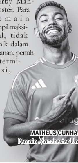
MATHEUS CUNHA Pemain Manchester United.

Carrick enggan terlena dengan kemenangan di Derby Manchester. Carrick meminta para pemainnya tampil konsisten ke depannya. "Konsistensi adalah kunci kesuksesan dari segalanya. Jika Anda dapat menemukan itu, maka Anda akan meraih kemenangan. Itulah tantangan kami. Kami harus menemukan cara untuk melakukannya," tegasnya. ● vdp