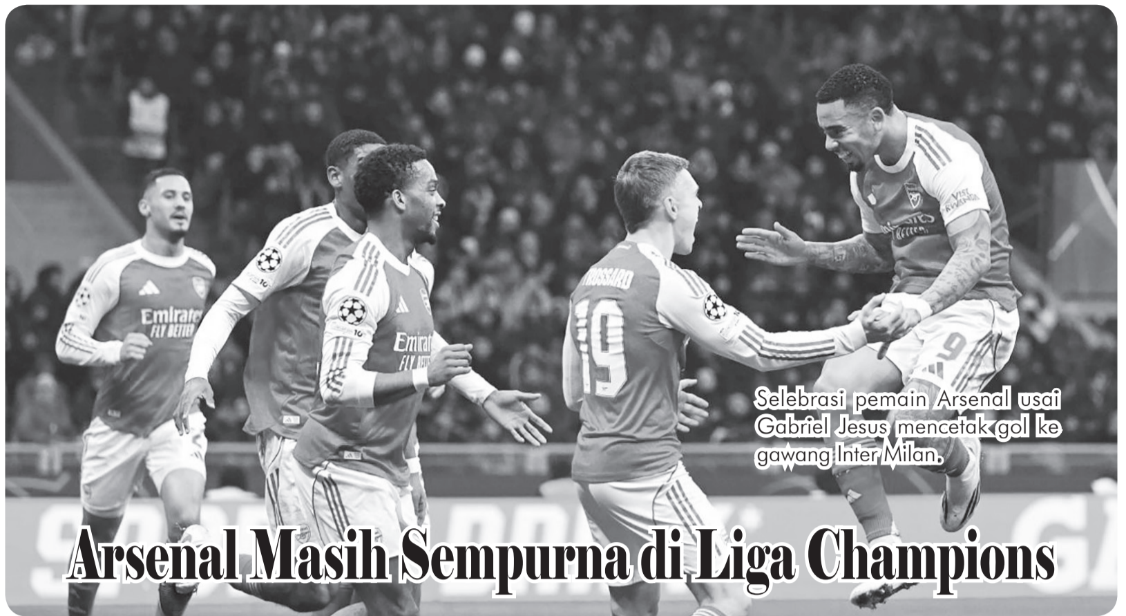
Selebrasi pemain Arsenal usai Gabriel Jesus mencetak gol ke gawang Inter Milan.