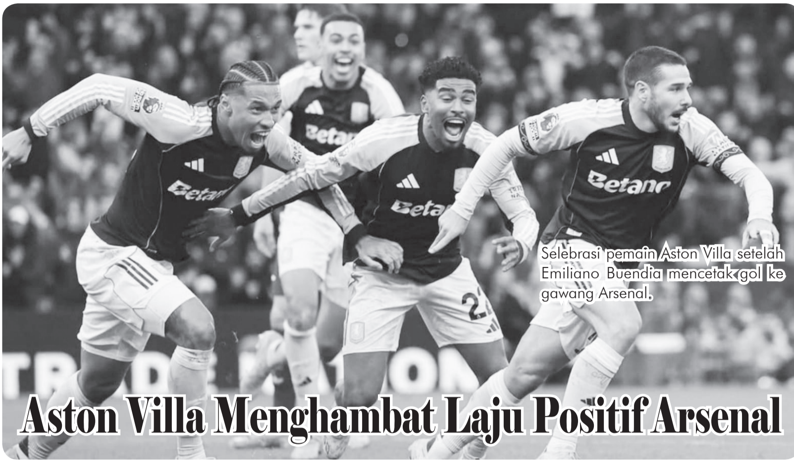
Selebrasi pemain Aston Villa setelah Emiliano Buendia mencetak gol ke gawang Arsenal.