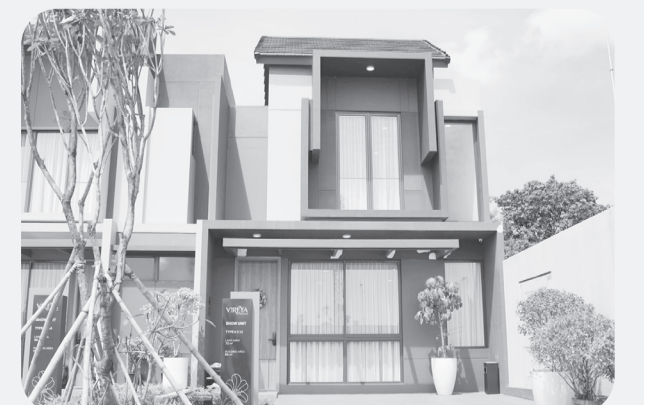
Klaster Vireya Tipe 6 dilengkapi dengan tiga kamar tidur dan dua carport.

Kawasan Vireya dilengkapi dengan beragam fasilitas untuk menunjang aktivitas para penghuni, seperti vibrant commercial lane, club house, river walk, outdoor gym, children playground, dan jogging track. Keberadaan ruang terbuka hijau yang sangat luas dan aliran sungai alami di dalam kawasan menghadirkan suasana sejuk dan nyaman, sekaligus memperkuat nilai keberlanjutan lingkungan. ● vit