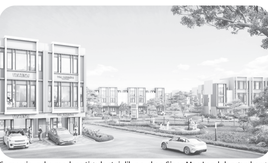
Comersio, ruko modern tiga lantai diluncurkan Sinar Mas Land dengan harga kompetitif di kawasan Latinos Business District, BSD City.