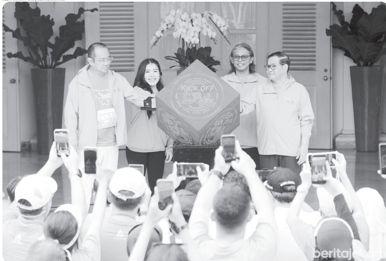
PELUNCURAN JEKATE RUNNING SERIES 2025

Prosesi peluncuran JEKATE Running Series : Explore the City Own Your Flow, di Pendopo Balai Kota DKI Jakarta, Gambir, Jakarta Pusat, Minggu (7/12/2025). Pemprov DKI Jakarta berkolaborasi dengan PAM Jaya menggelar PAM Jaya JEKATE Running Series 2025 yang merupakan program gaya hidup sehat melalui rangkaian lari yang akan digelar di lima wilayah kota di Provinsi DKI Jakarta pada tahun 2026 diawali dengan kick off pada 14 Desember 2025 di Epiwalk kawasan Rasuna Said, Jakarta Selatan.