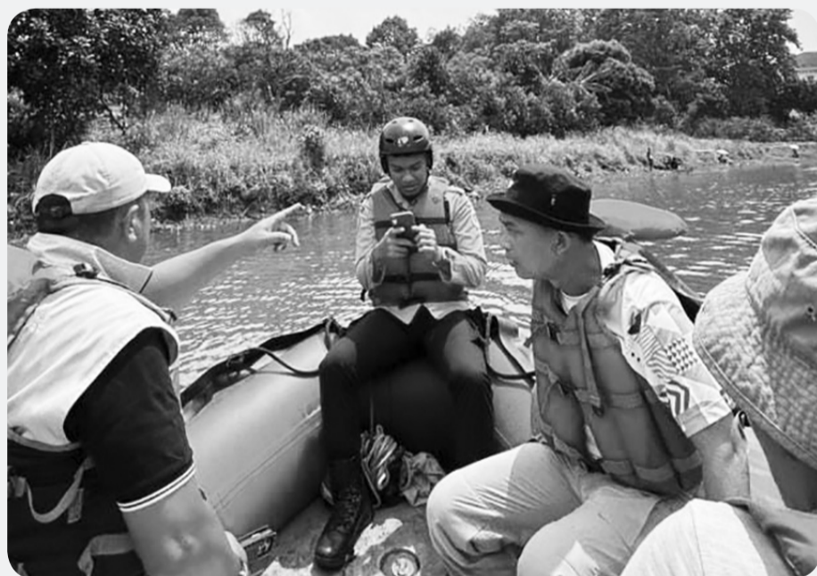
Bupati tinjau potensi setu yang rencananya mengintegrasikan dua setu yakni Setu Kabantenan dan Setu Cikaret sebagai satu kawasan wisata air dapat dinikmati masyarakat.

Pada awalnya pemerintah daerah mempertimbangkan pembuatan sodetan sebagai penghubung antar setu, tapi hasil peninjauan lapangan menunjukkan bahwa sudah terdapat aliran sungai sepanjang satu kilometer yang meng-