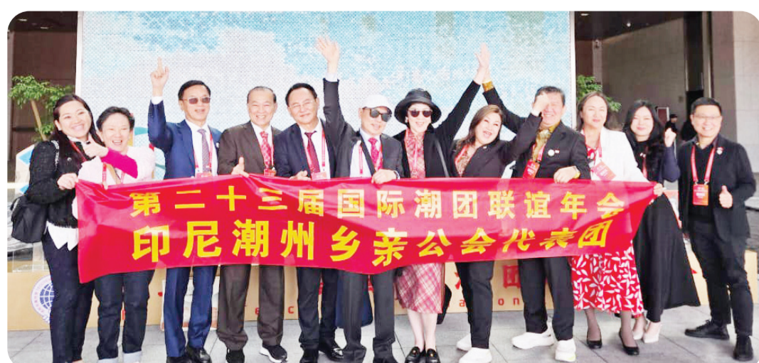
Rombongan Teo Chew Indonesia bersama peserta The 23 rd Teochew International Convention .