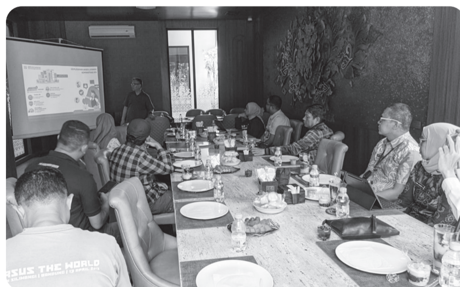
Perkuat dan percepatan Universal Health Coverage, Pemkab Bogor kerjasama dengan BPJS Kesehatan Kabupaten Bogor.

CIBINONG (LB) - BPJS Kesehatan Kabupaten Bogor Perkuat Sinergi dengan Pemerintah Kabupaten Bogor untuk mendorong Percepatan Universal Health Coverage (UHC) di Kabupaten Bogor, untuk memastikan seluruh warga Kabupaten Bogor mendapatkan akses layanan kesehatan yang mudah, cepat, dan berkualitas.