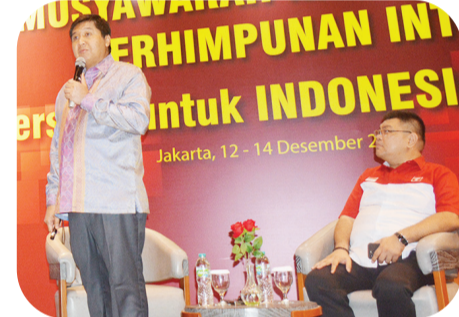
Menteri PKP Maruarar Sirait dalam sesi Dialog Kebangsaan.