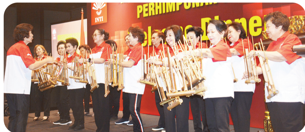
Penampilan Group Angklung Perhimpunan INTI.