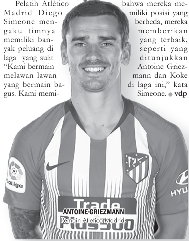
ANTOINE GRIEZMANN Pemain Atletico Madrid

Ia juga harus berterima kasih kepada dua veteran klub, yaitu kapten Koke dan pencetak gol terbanyak sepanjang masa Griezmann. "Saya tidak terkejut karena pemain bintang tidak pernah menimbulkan masalah. Dalam sejarah tim, pemain bintang, pemain bintang sejati, tidak menimbulkan masalah. Mereka memahami posisi mereka, mereka tahu bahwa mereka memiliki posisi yang berbeda, mereka memberikan yang terbaik, seperti yang ditunjukkan Antoine Griezmann dan Koke di laga ini," kata Simeone. ● vdp