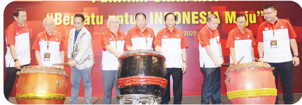
Prosesi pukul tambur sebagai tanda dimulainya kegiatan Munas.