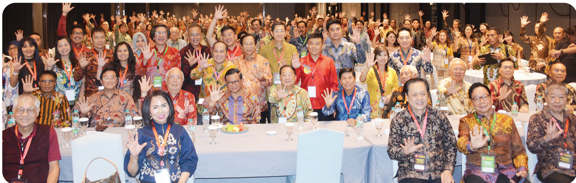
Gubernur Pramono Anung berfoto bersama peserta Munas.