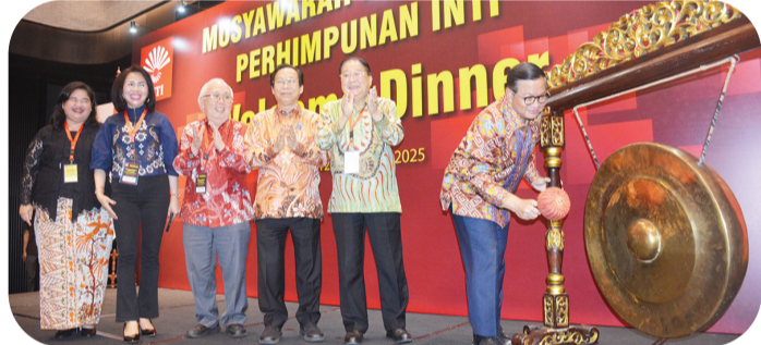
Gubernur Pramono Anung memukul gong pembukaan Munas ke-6 Perhimpunan INTI.

"Semoga semua itu tetap terpelihara dan bahkan akan semakin ditingkatkan di masa mendatang," ucapnya.