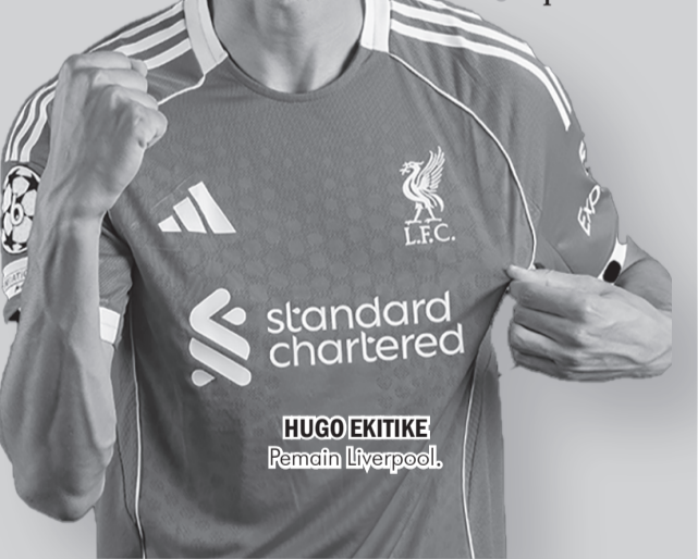
HUGO EKITIKE Pemain Liverpool

tetap bersama. Saya pikir kami pantas mendapatkannya. Kami menjalani minggu yang hebat dan mari kita lanjutkan," kata Ekitike, dilansir dari BBC.