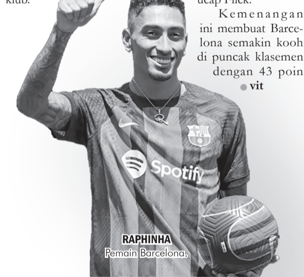
RAPHINHA Pemain Barcelona

"Yang paling penting adalah tiga poin. Kami mengendalikan permainan, menguasai lebih dari 80 persen bola. Kami solid secara defensif. Kami tidak memiliki peluang terbaik, tapi berhasil mencetak dua gol. Bagus untuk menjaga clean sheet. Selamat untuk seluruh tim atas bagaimana mereka bertahan. Semua bekerja keras, baik menyerang maupun bertahan. Senang melihat tim bermain seperti ini setelah beberapa pekan sulit," tutur Flick di laman klub.