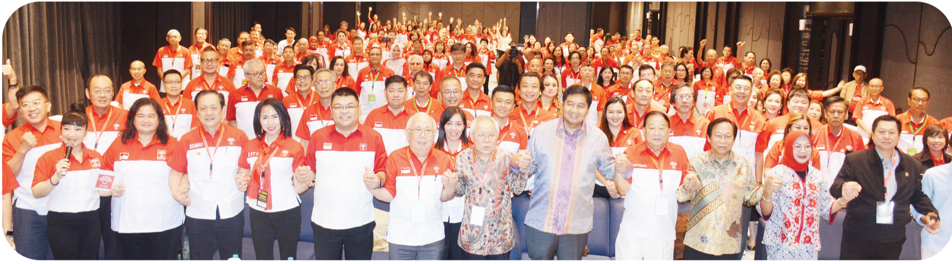
Menteri Maruarar Sirait berfoto bersama peserta Munas.

JAKARTA (LB) - Keluarga besar Perhimpunan INTI (Indonesia Tionghoa) baru saja sukses menyelenggarakan Munas (Musyawarah Nasional) ke-6 yang digelar 12 - 14 Desember 2025, di Grand Ballroom Aston Kemayoran City Hotel, Kemayoran, Jakarta Pusat.