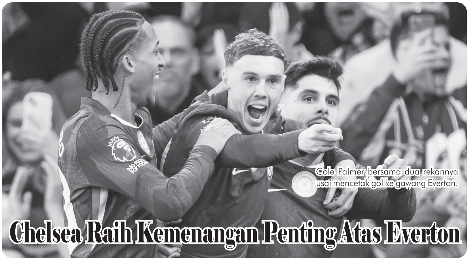
Cole Palmer bersama dua rekannya usai mencetak gol ke gawang Everton.