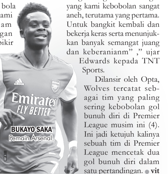
BUKAYO SAKA Pemain Arsenal

Dilansir oleh Opta, Wolves tercatat sebagai tim yang paling sering kebobolan gol bunuh diri di Premier League musim ini (4). Ini jadi ketujuh kalinya sebuah tim di Premier League mencetak dua gol bunuh diri dalam satu pertandingan. ● vit