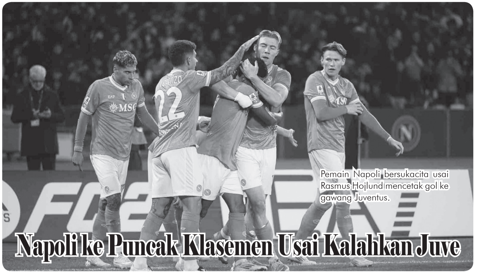
Pemain Napoli bersukacita usai Rasmus Hojlund mencetak gol ke gawang Juventus.