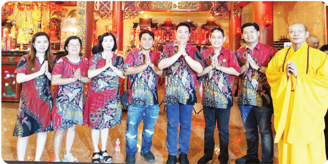
Para pengurus Yayasan, Cia dan Hu locu serta pemimpin ritual berfoto bersama.