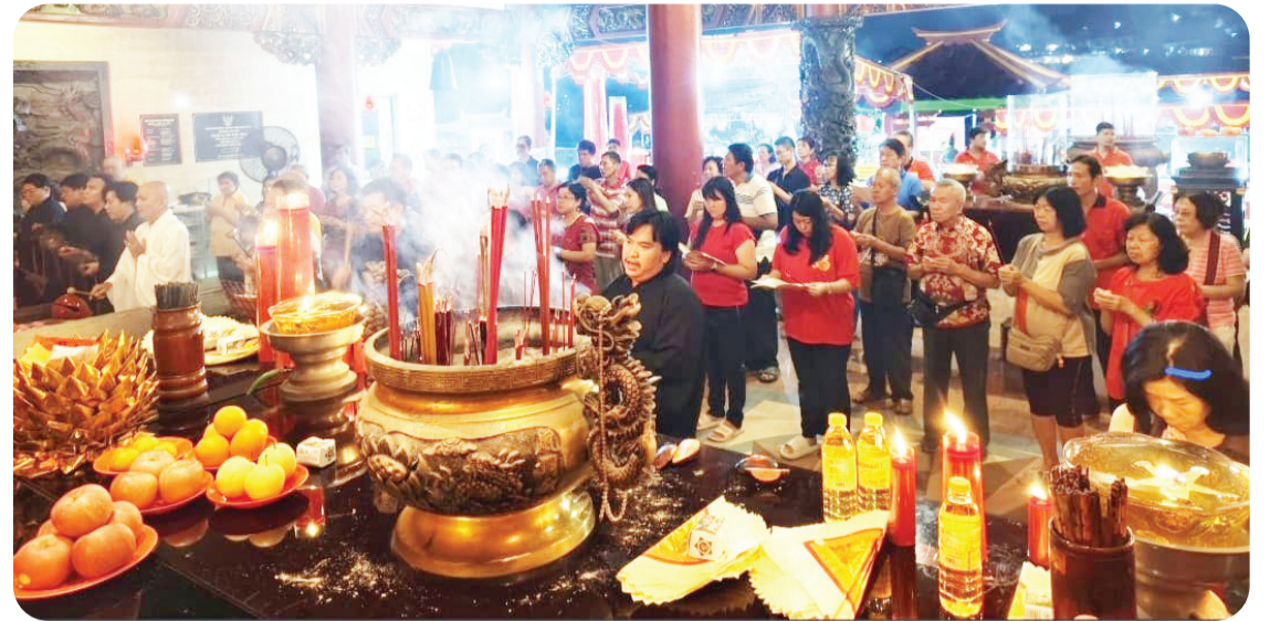
Suasana doa bersama dalam rangka peringatan HUT Te Bo/ Bunda Bumi di TITD Low Lie Bio Jl.Roro Jonggrang Timur Kota Semarang.

SEMARANG (LB) - Ratusan umat Tri dharma (Buddhis, Tao dan Khonghucu) dari berbagai kota hadir di TITD Low Lie Bio, Kelenteng yang bertengger di perbukitan wilayah Semarang Barat Jawa Tengah pada Sabtu (6/12/2025) malam lalu.