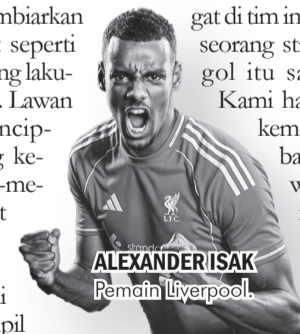
ALEXANDER ISAK Pemain Liverpool.

"Saya tahu sudah lama mereka menantikan ini dan saya mencoba untuk kembali ke performa terbaik saya. Masih proses, tapi saya senang bisa mencetak gol. Yang bikin senang adalah kami menang dan itu cara terbaik menumbuhkan semangat di tim ini, tapi tentu saja saya seorang striker dan mencetak gol itu sangat membantu. Kami harus memanfaatkan kemenangan ini dengan baik, tapi jangan jemu. Kami harus tetap fokus dan bekerja keras untuk menjaga momentum ini," ujar Isak di BBC Sport. ● vdp