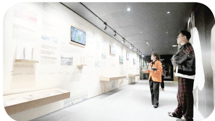
Perjalanan Summarecon dari tahun 1975 hingga 2025 di Zona Timeline 50 Years of Our Journey.