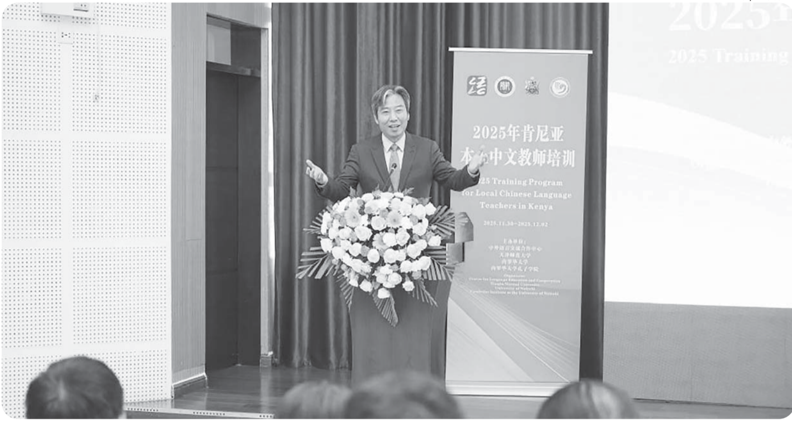
PROGRAM PELATIHAN BAGI GURU BAHASA MANDARIN DI KENYA