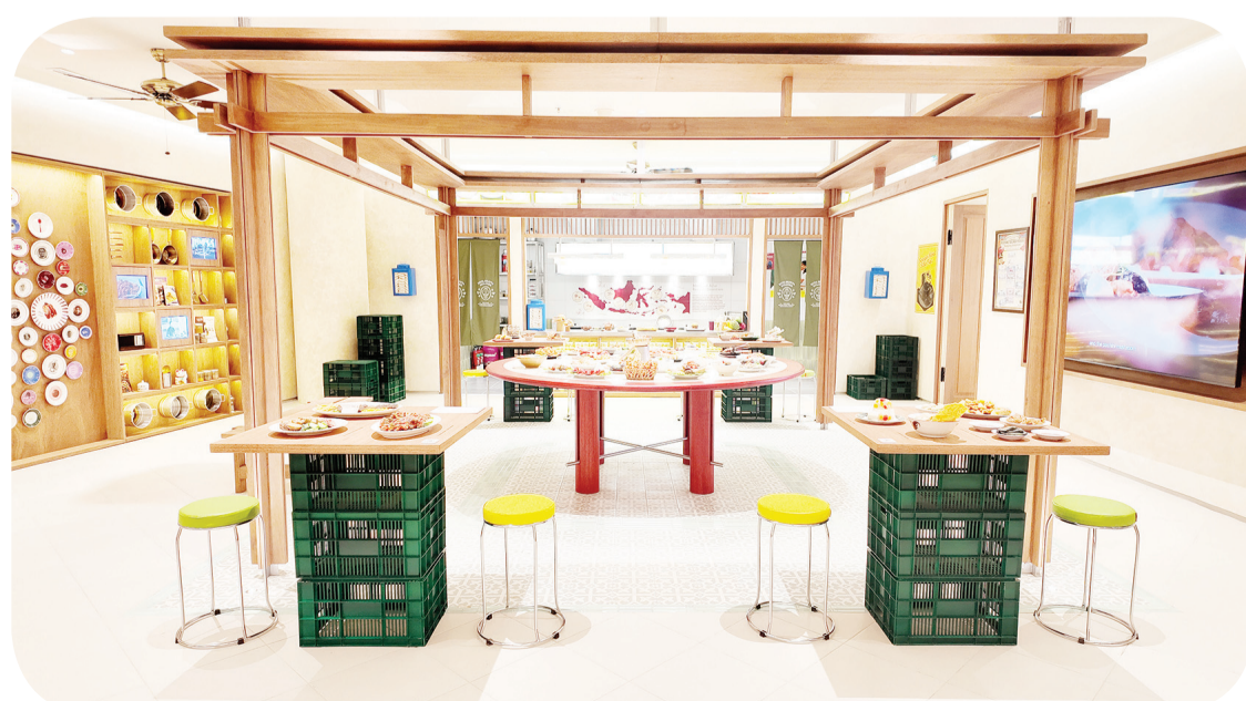
Beragam replika makanan di Zona City of Million Culinary.