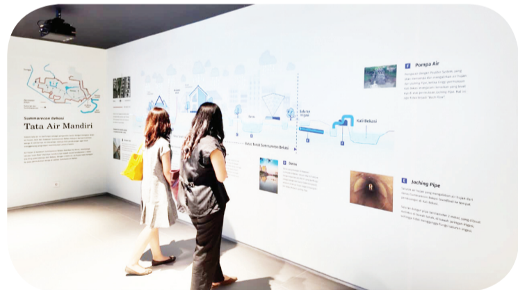
Zona Breakthrough, Terobosan Kawasan (sistem tata air mandiri di Summarecon Bekasi).