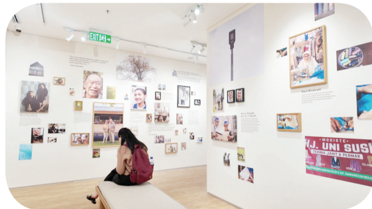
Zona Tales of The People, cerita dari konsumen dan karyawan tentang Summarecon.