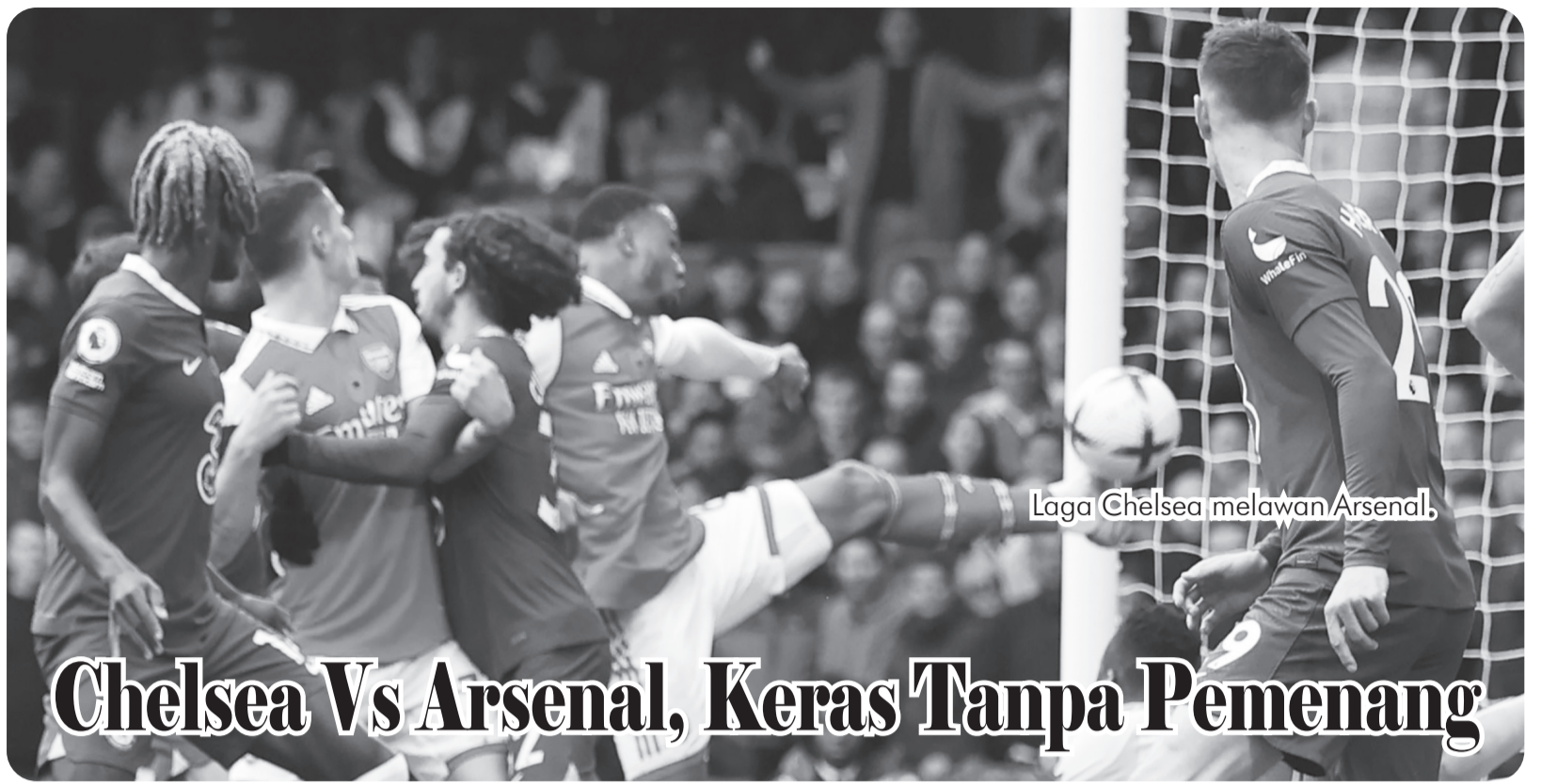
Laga Chelsea melawan Arsenal.