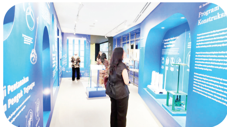
Zona Breakthrough, Terobosan Konstruksi (Summarecon Quality Improvement Initiative - SQII).