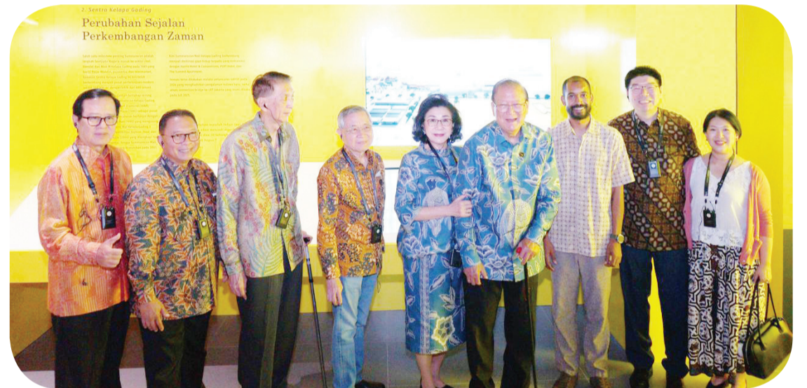
Foto bersama di Zona Breakthrough, Terobosan Komersial (Sentra Kelapa Gading).