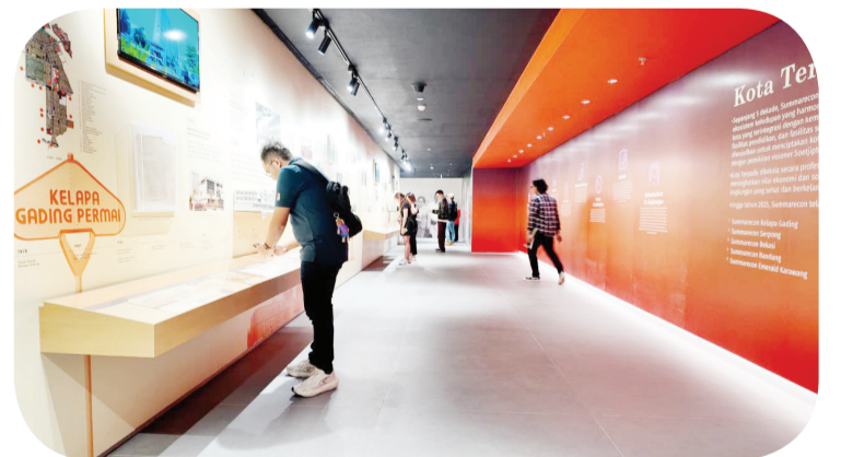
Zona Timeline 50 Years of Our Journey.