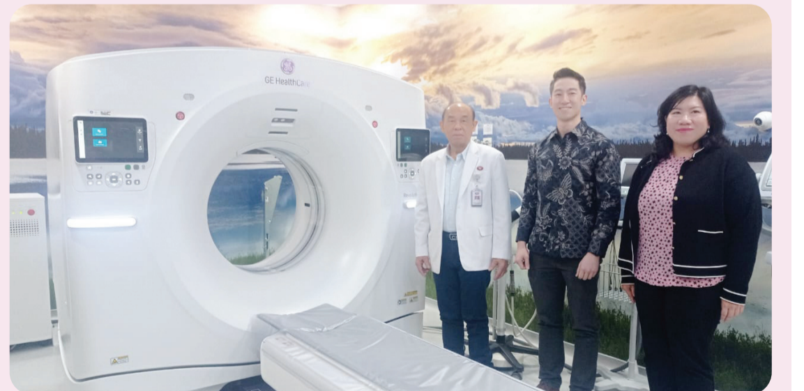
CT Scan Revolution Ascend 128, CT Scan generasi terbaru yang dilengkapi AI TrueFidelityTM.

CT Scan Revo Ascend 128 dengan TrueFidelityTM menghadirkan pemeriksaan yang lebih cepat, nyaman, dan akurat bagi pasien, sekaligus membantu tenaga kesehatan bekerja dengan lebih efisien. Dengan hasil gambar yang