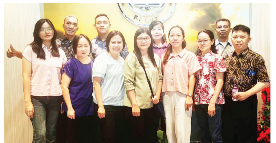
Staf GKY Mangga Besar berfoto bersama.