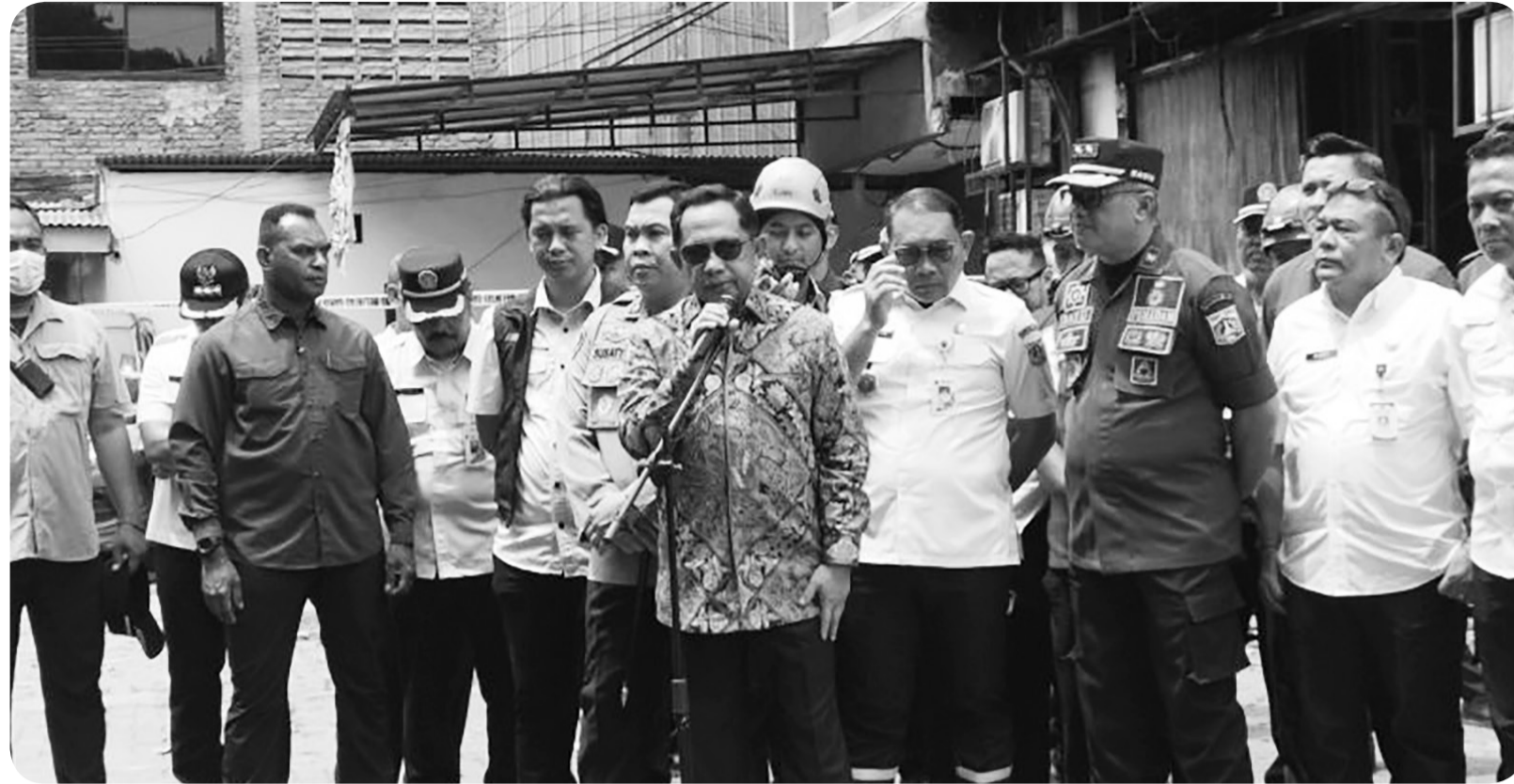
PRESIDEN TAK INGIN KEBAKARAN TERULANG LAGI SEPerti DI JAKPUS

Menteri Dalam Negeri Tito Karnavian saat konferensi pers usai meninjau lokasi pascakebakaran di ruko Terra Drone, Jakarta, Rabu (10/12/2025). Menteri Dalam Negeri Tito Karnavian menegaskan bahwa Presiden Prabowo Subianto tidak ingin peristiwa kebakaran yang merenggut nyawa kembali terulang, seperti yang terjadi di sebuah gedung ruko Terra Drone di Jakarta Pusat.