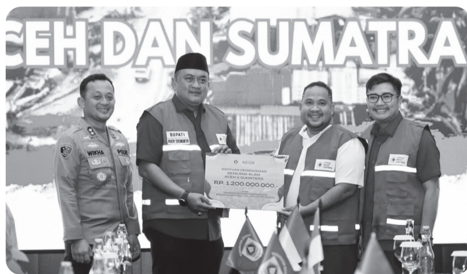
Bupati Bogor saat menyerahkan bantuan bencana longsor, banjir di Sumatera, Aceh Rp1,2 miliar ke PMI Kabupaten Bogor.

"Kabupaten Bogor tidak bisa dibangun satu orang, satu