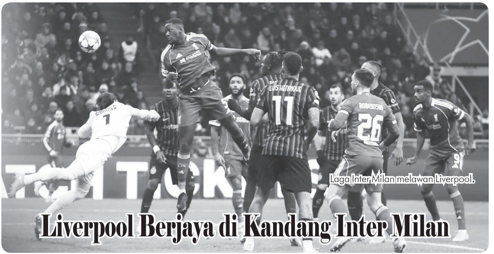
Laga Inter Milan melawan Liverpool.