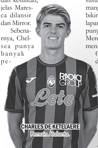
CHARLES DE KETELAERE Pemain Atalanta

Chelsea sementara duduk di peringkat ke-11 Klase-men Liga Champions dengan 10 poin dari enam laga. Mereka masih bisa disalip tiga tim di bawahnya. "Kami harus lebih agresif. Dua poin dari empat laga terakhir bukanlah hal bagus, kami harus lebih baik," tutup Maresca. ● vit