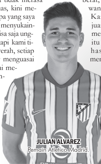
JULIAN ALVAREZ Pemain Atletico Madrid

Julian Alvarez mengaku senang karena menjadi bagian dari kemenangan timnya. "Laga sebenarnya berat, karena tim lawan tampil bagus. Kami harus berjuang keras untuk mencetak gol dan itu terjadi. Tentu hasil ini sangat menggembirakan," kata Alvarez di situs klub. ● vit