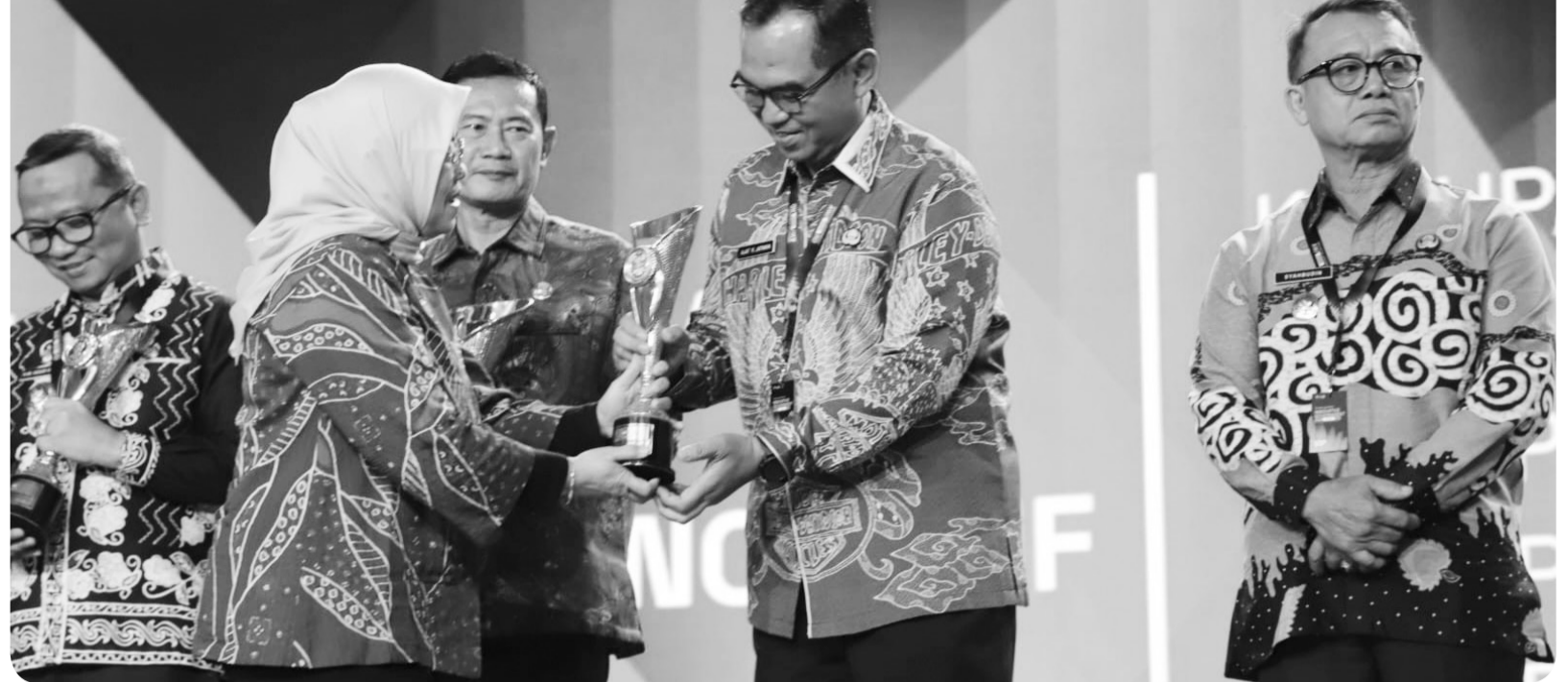
Pemkab Bogor meraih IGA tahun 2025 kategori Kabupaten Terinovatif.