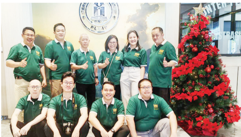
Staf GKY Pluit berfoto bersama.