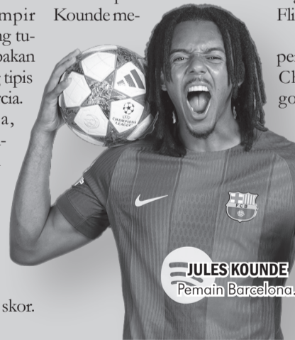
JULES KOUNDE Pemain Barcelona

Barcelona kini naik ke peringkat 14 klasemen Liga Champions setelah mengoleksi 10 poin dari enam pertandingan. Frankfurt di ambang eliminasi setelah menempati peringkat 30 dengan empat poin. ● vdp