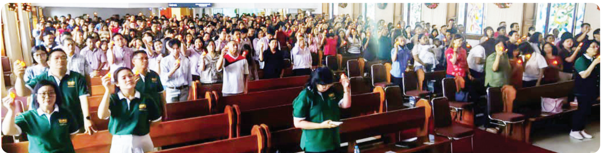
Lilin Natal, telah dihidupkan oleh jemaat yang hadir.