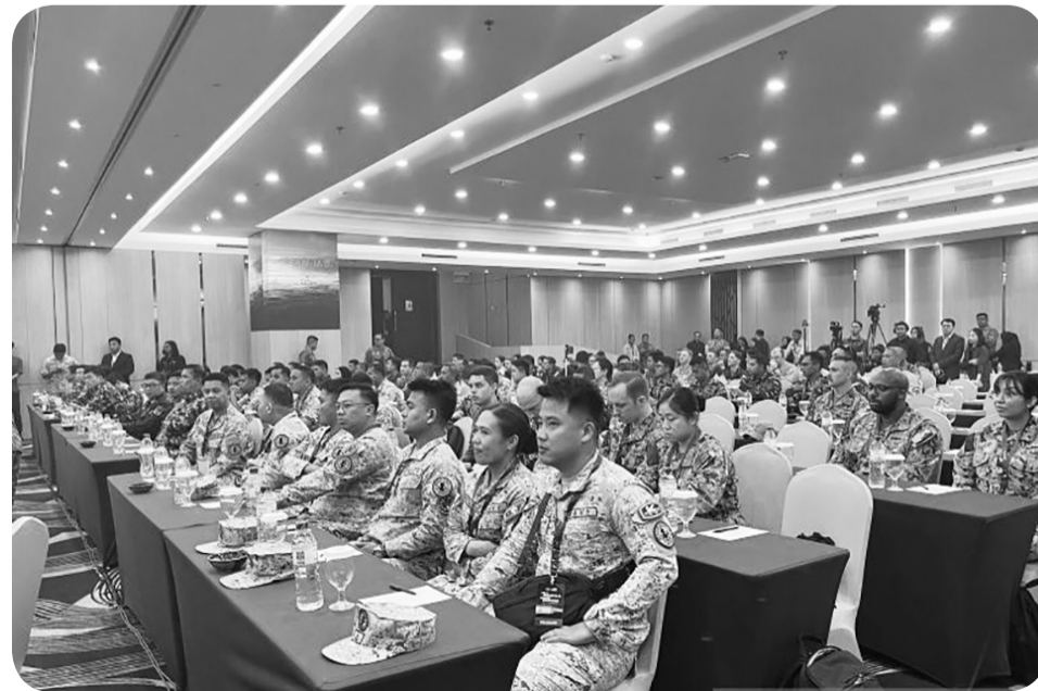
ANGKATAN LAUT AS PERKUAT KEMITRAAN KAWASAN INDO-PASIFIK

Anggota Angkatan Laut Amerika Serikat dan negara-negara ASEAN berkumpul di Batam, Kepri, dalam Latihan Maritim (AUMX) ke-2 Tahun 2025, Rabu (10/12/2025). Angkatan Laut Amerika Serikat bergabung bersama angkatan laut negara-negara ASEAN dalam kegiatan Latihan Maritim (AUMX 2025) ke-2 di Batam, Kepulauan Riau, sebagai komitmen memperkuat kemitraan di kawasan Indo-Pasifik.