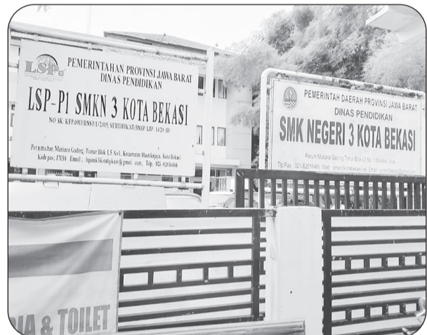
SMK Negeri 3 Kota Bekasi, Rabu (10/12).

KOTA BEKASI (LB) - Laporan realisasi untuk biaya perawatan Sekolah Menengah Kejuruan (SMK) Negeri 3 Kota Bekasi, Jawa Barat dipertanyakan.