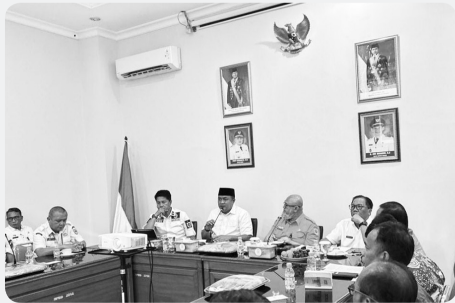
Bupati Bogor saat rapat koordinasi untuk memperkuat mitigasi bencana bersama swasta di Kantor BPBD Kabupaten Bogor, Rabu (10/12).

Menurutnya, langkah ini merupakan upaya strategis untuk memperkuat mitigasi, meningkatkan kesiapsiagaan, serta memastikan respons cepat terhadap setiap potensi bencana.