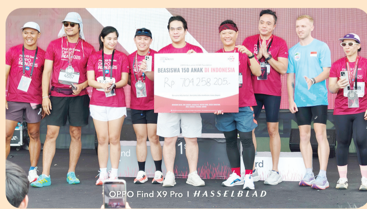
Para Pemenang Kategori Half Marathon 21K Overall Male di OPPO Run 2025.

Total hadiah yang diberikan kepada para pemenang di OPPO Run 2025 senilai Rp 545,5 juta, menjadikannya salah satu kompetisi lari paling menarik di Indonesia.