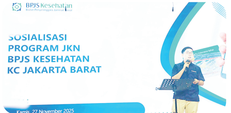
Antony menyampaikan penjelasan tentang program BPJS.