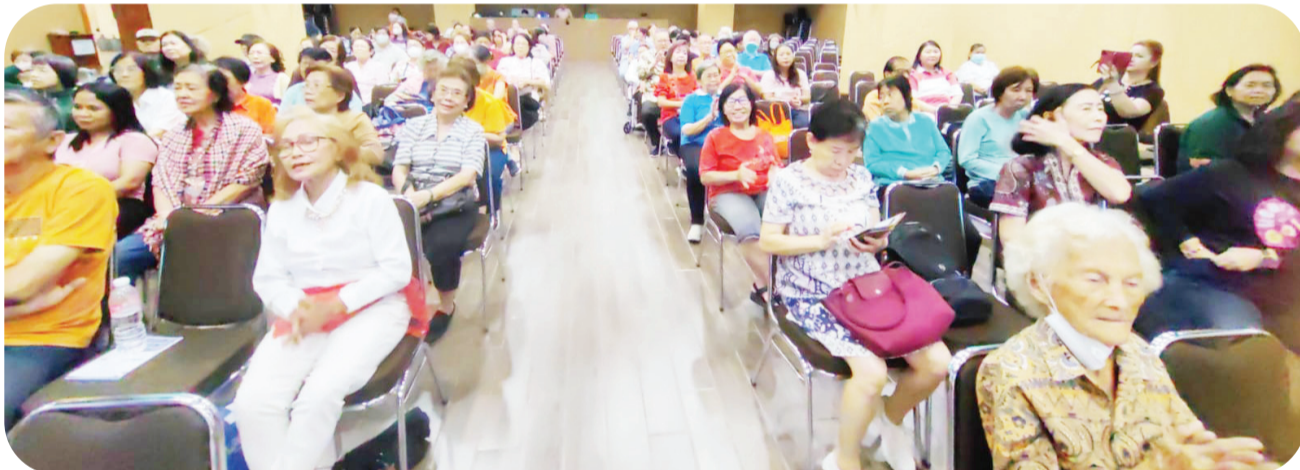
Para jemaat yang hadir.