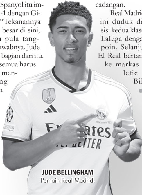
JUDE BELLINGHAM Pemain Real Madrid.

Real Madrid saat ini duduk di posisi kedua klasemen LaLiga dengan 33 poin. Selanjutnya El Real bertandang ke markas Athletic Club Bilbao. ● vdp