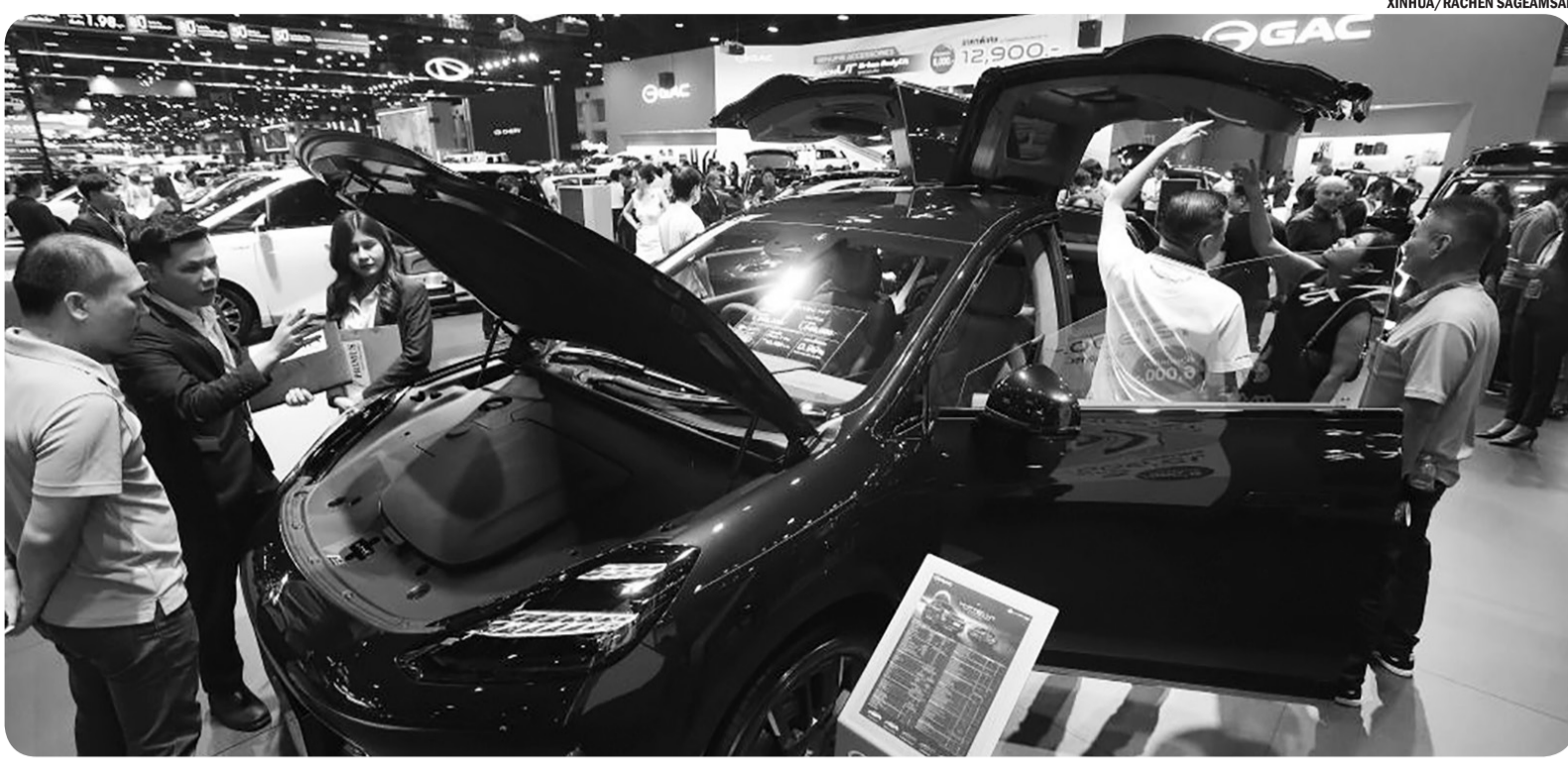
PAMERAN MOTOR INTERNASIONAL THAILAND KE-42 DI BANGKOK

Pengunjung memadati area Thailand International Motor Expo ke-42 di Bangkok, Thailand, Selasa (2/12/2025).