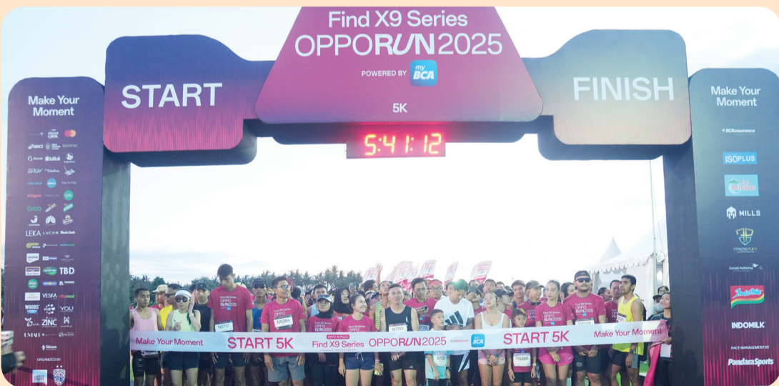
Race Day OPPO Run 2025.

BALI (LB) - OPPO Run 2025 Powered by myBCA sukses digelar pada 30 November 2025 di Bali. Tahun ini, ajang lari tahunan tersebut tidak hanya berhasil menarik 7.000 pelari dari 20 negara, tetapi juga memperlihatkan bagaimana olahraga, komunitas, teknologi, dan aksi sosial dapat bersatu dalam satu perayaan besar yang menginspirasi.