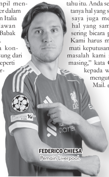
FEDERICO CHIESA Pemain Liverpool.

tanya hal yang sama dan saya juga menjawab hal yang sama. Saya sering bicara padanya. Kami harus menghormati keputusannya dan masalah kami masing-masing,” kata Gattuso, kepada wartawan mengutip Daily Mail. ● vdp