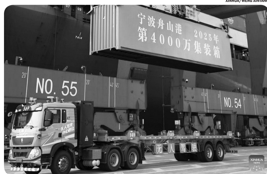
AKTIVITAS PELABUHAN NINGBO-ZHOUSHAN

"Keluarga korban ditawarkan amnesti dan perdamaian, tetapi mereka menolak," kata Mahkamah Agung dalam pernyataannya. ● ans