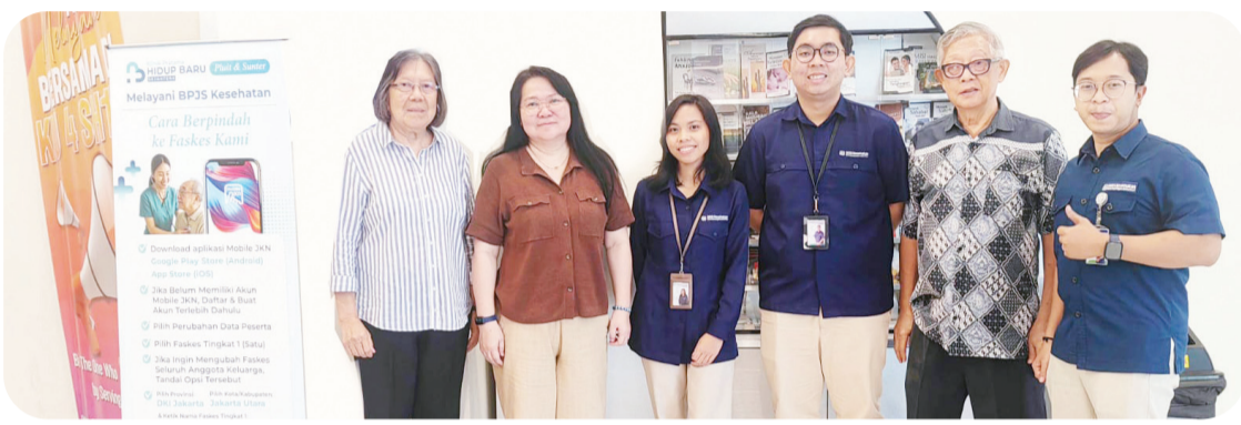
Foto bersama hamba Tuhan dan rekan.