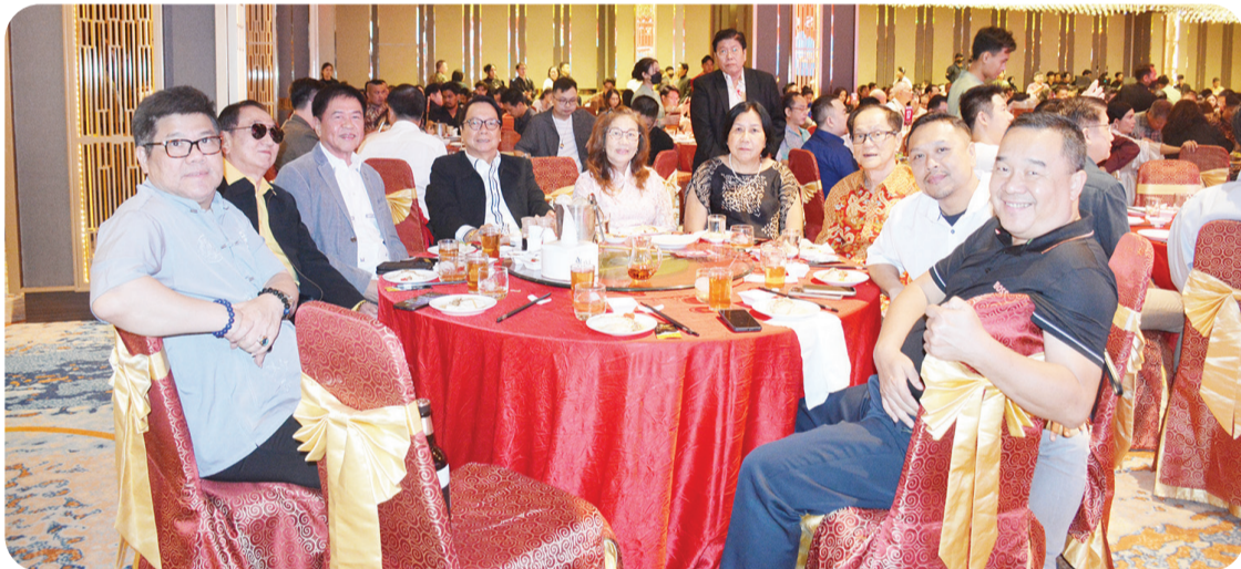
Para tamu undangan antusias menyaksikan jalannya acara.