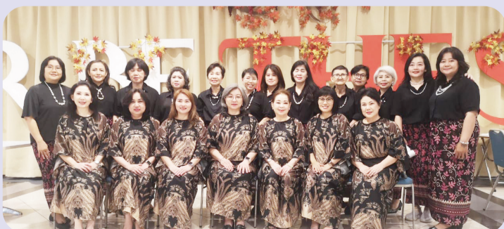
Para pemain musik angklung dan kolintang.