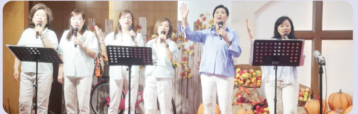
Penampilan Singer Komisi Wanita GKYMBS.

JAKARTA (LB) — GKYMJB (Gereja Kristus Yesus Mangga Besar), Jumat (21/11/2025) pagi pukul 10 pagi di ruangan Gloria, mengadakan acara Thanksgiving, di Ruang Gloria GKYMJB, Jakarta.