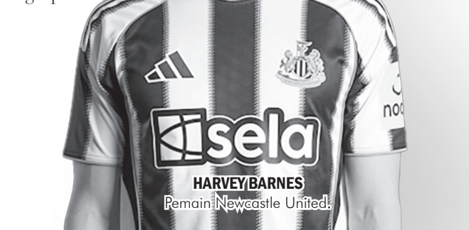
HARVEY BARNES Pemain Newcastle United.

uang emas dan cuma memenangi 50 persen duel. “Dia selalu bisa membuat dua atau tiga peluang karena dia yang terbaik. Ya, coba lagi di laga berikutnya,” kata Guardiola di BBC Sport. ● vit