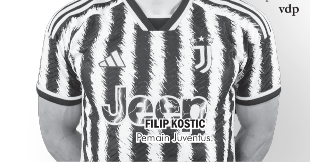
FILIP KOSTIC Pemain Juventus.

Napoli kini mengumpulkan 25 poin dari 12 laga. Sementara Atalanta dengan 13 poin. ● vdp