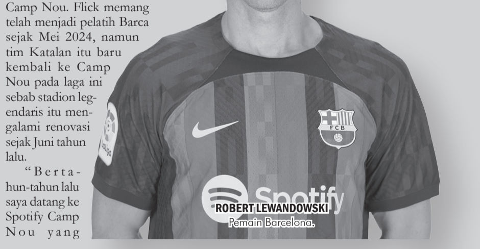
ROBERT LEWANDOWSKI Pemain Barcelona.

Flick juga memberi pujian tersendiri bagi Lewandowski. “Selama 10 tahun terakhir dia adalah salah satu penyerang nomor sembilan terbaik di sepak bola. Usianya tidak menghambatnya: fisiknya prima, dia lapar gol, dan itu penting. Bagi dia mencetak gol pertama di Spotify Camp Nou yang baru adalah sesuatu yang benar-benar spesial,” kata Flick. ● vdp