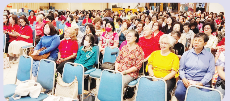
Para jemaat yang hadir.