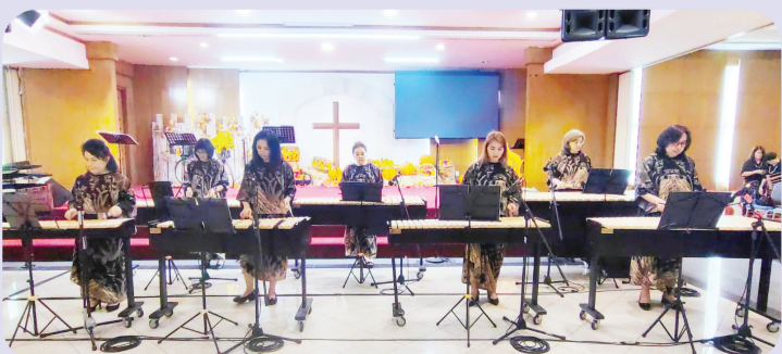
Penampilan pemain musik, angklung dan kolintang.