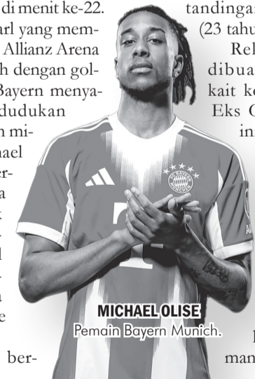
MICHAEL OLISE Pemain Bayern Munich.