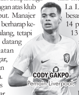
CODY GAKPO Pemain Liverpool.

Lantas seperti apa jalannya laga nanti? Patut diikuti. ● vdp