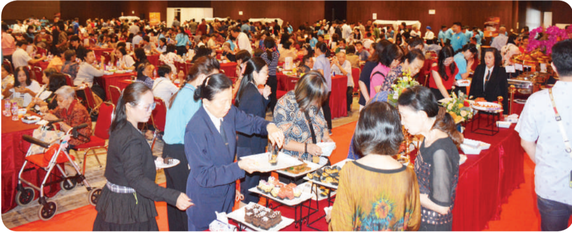
Ribuan orang menikmati ragam sajian menu vegetarian dalam kegiatan Vegetarian Charity 2025.