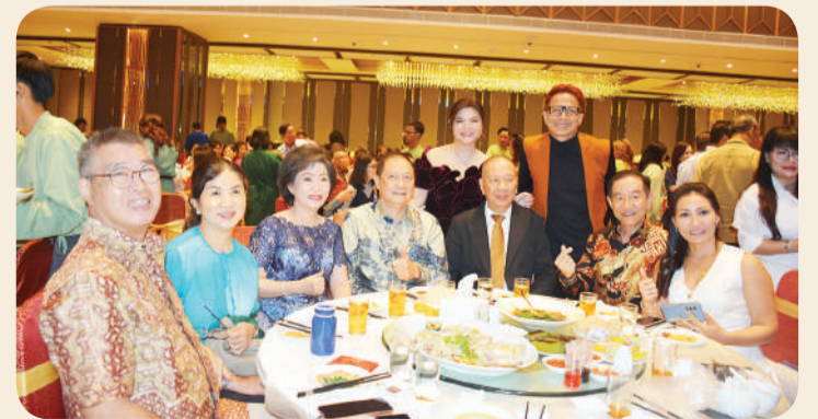
Delon berfoto bersama pengurus dan tamu kehormatan.