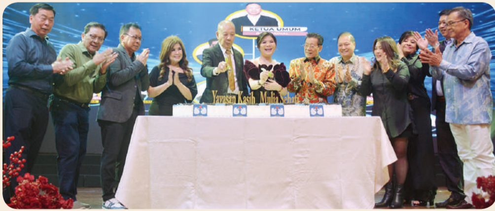
Para pengurus Yayasan Kasih Mulia Sehat bersama-sama potong kue.

JAKARTA (LB) — Gathering yang digelar keluarga besar Yayasan Kasih Mulia Sehat pada Sabtu (1/11/2025) di Restoran Sense Ballroom Mangga Dua Square Jakarta berlangsung meriah.