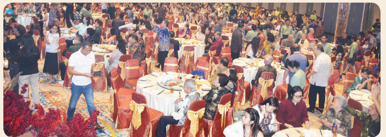
Para tamu undangan antusias mengikuti acara.