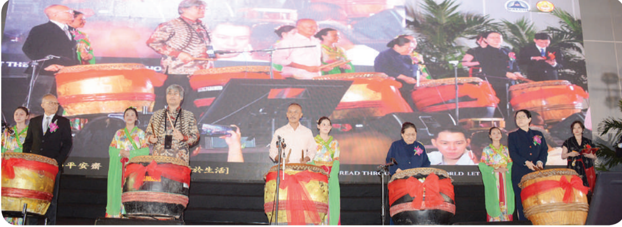
Prosesi pembukaan Vegetarian Charity 2025 yang ditandai dengan pemukulan tambur.