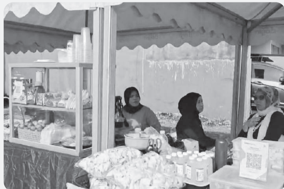
Pemkab Bogor menggelar pameran UMKM pada gelaran Car Free Day, Minggu (2/11).

Pada kesempatan itu, Bupati Bogor, Rudy Susmanto, menegaskan kegiatan CFD bukan hanya ruang rekreasi dan olahraga masyarakat, tetapi juga menjadi wadah pemberdayaan