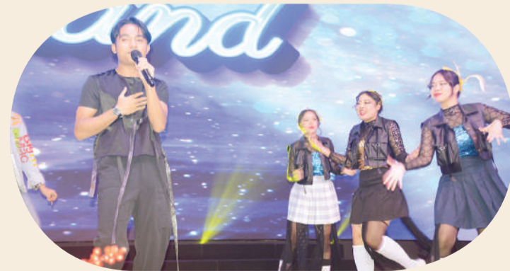
Penampilan Bertrand Peto.