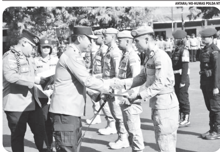
ANTARA/HO-HUMAS POLDA NTT

"Kami mendukung penuh proses hukum dan mengimbau masyarakat untuk waspada terhadap segel palsu. Segel resmi jika di-scan akan menampilkan informasi produk, jika tidak, berarti palsu," ujarnya. ● han