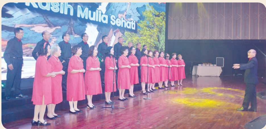
Penampilan paduan suara Yayasan Kasih Mulia Sehat.