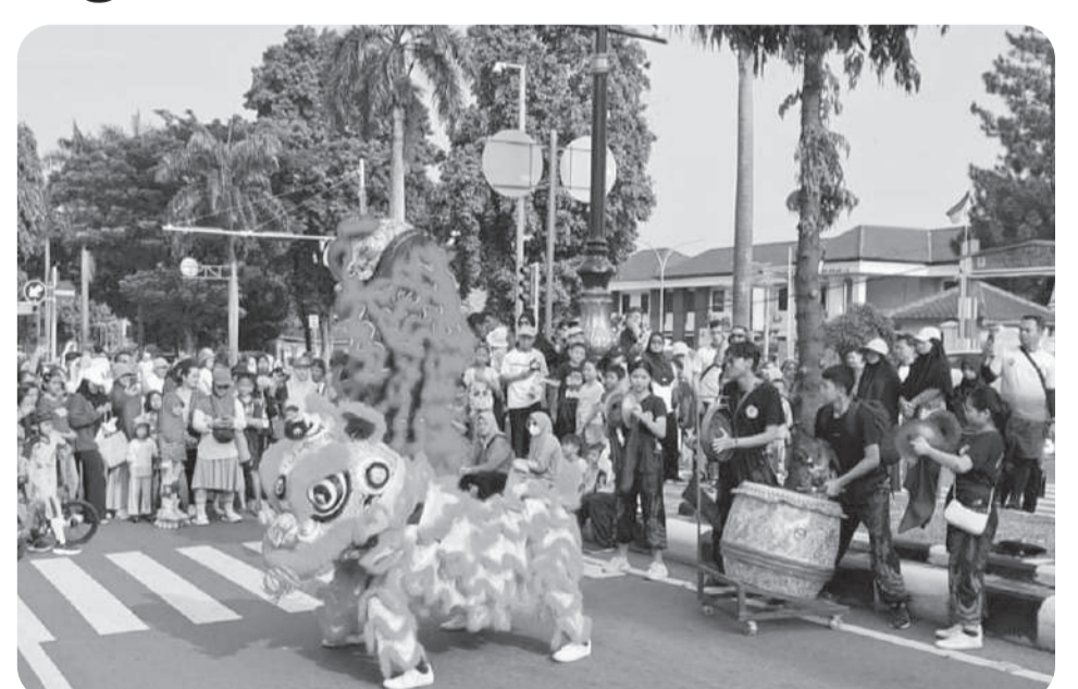
Masyarakat menyambut hangat kehadiran kembali CFD yang diramaikan sejumlah pertunjukan budaya seni, di Jln Tegar Beriman, Minggu (2/11).