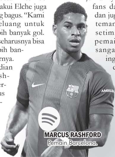
MARCUS RASHFORD Pemain Barcelona.

“Ketika Anda melihat peluang yang dia punya, satu atau dua gol lagi akan lebih baik, juga untuknya. Tapi tentu saja kami boleh senang dengannya. Saya sangat senang dengan Rashford. Dia bisa main di level ini dan saya senang dia menunjukkan fans dan klub, dan juga untuk teman-teman setimnya dia pemain yang sangat penting,” tandas Flick. ● vit