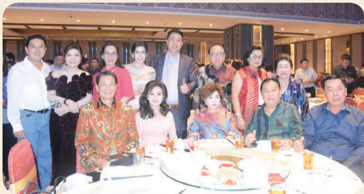
Pengurus dan tamu kehormatan.