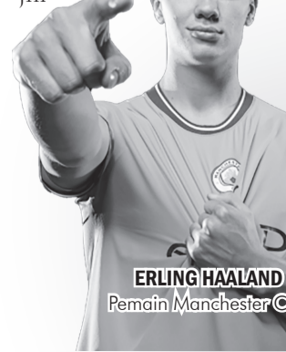
ERLING HAALAND Pemain Manchester City.

memberi assist semasa membela Olympique Lyon. 21 assist dia berikan buat Lyon musim lalu dari 48 pertandingan di semua kompetisi.