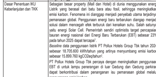
Dasar Penentuan IKU Keberlanjutan dan TKK

Emisi Karbon Berwujud sebesar 184.320 kgCO2eq dengan Penggunaan Energi Baru Terbarukan (EBT) Solar Cell sebesar 40 kWP selama tahun 2025 – 2029 pada tahun penengaran luar bangunan dan parkir. 100% sarana dan prasarana air dipulihkan (Recovered Water) di Mall dan Hotel yang berimplikasi menegahkan meningkatkan penambahan emisi karbon dengan penggunaan Listrik yang tidak normal selama tahun 2025-2029.