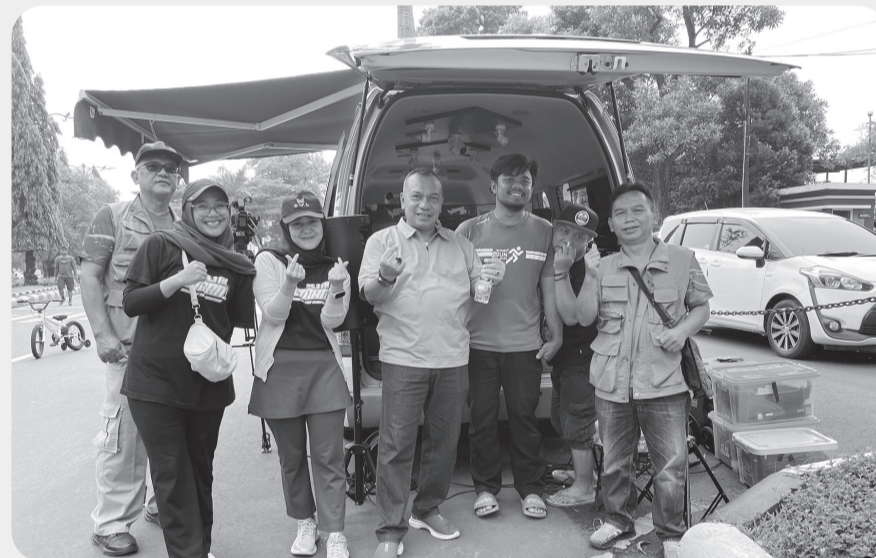
Diskominfo Kabupaten Bogor ikut mendukung kegiatan CFD Tegar Beriman, pada Minggu pagi (23/11).

CIBINONG (LB) - Dinas Komunikasi dan Informatika (Diskominfo) Kabupaten Bogor kembali menunjukkan peran aktifnya dalam mendukung kegiatan Car Free Day (CFD) Tegar Beriman yang digelar pada Minggu pagi (23/11).