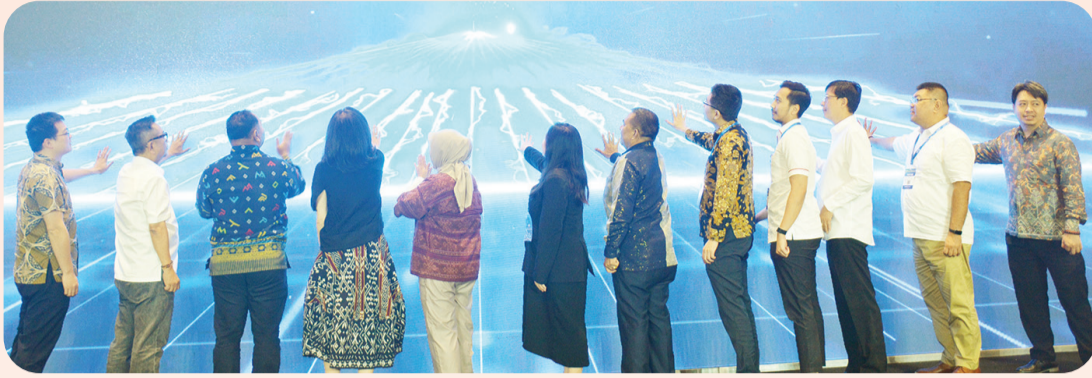
Prosesi pembukaan pameran.