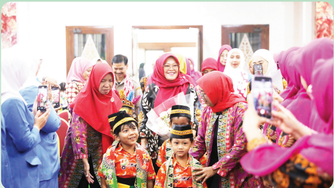
Ketua DPD PP-PAUD Provinsi DKI Jakarta tiba di lokasi acara didampingi anak-anak TK.

JAKARTA (LB) - Dewan Pimpinan Daerah Perkumpulan Penyelenggara Pendidikan Anak Usia Dini (DPD PP-PAUD) dan Ikatan Guru Taman Kanak-Kanak Indonesia (IGTKI) bersama Dinas Pendidikan (Disdik) Provinsi DKI Jakarta menggelar Peringatan Hari Anak Sedunia 2025 di Gedung Nyi Ageng Serang, Jalan HR Rasuna Said, Jakarta Selatan, Senin (24/11).