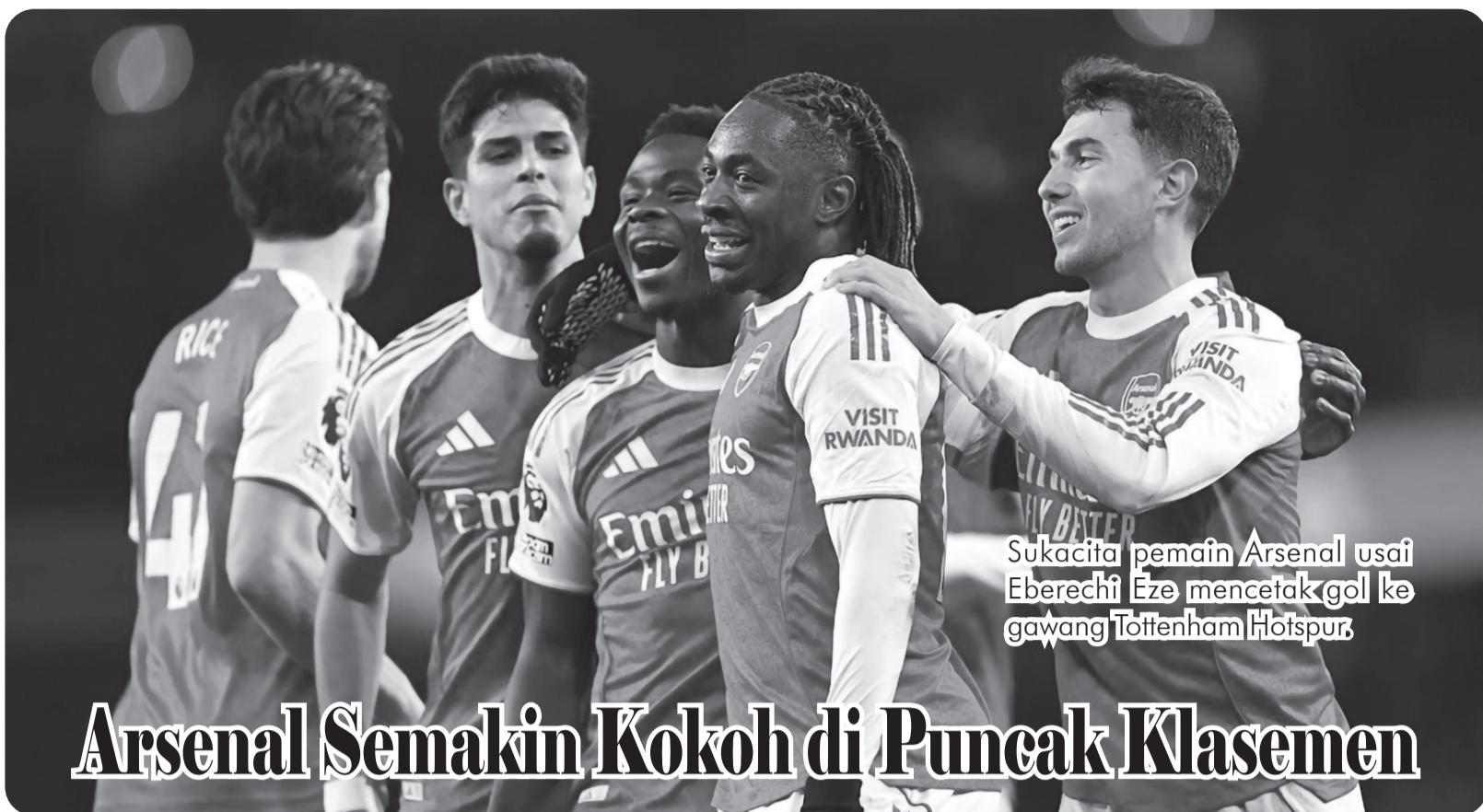
Sukacita pemain Arsenal usai Eberechi Eze mencetak gol ke gawang Tottenham Hotspur.