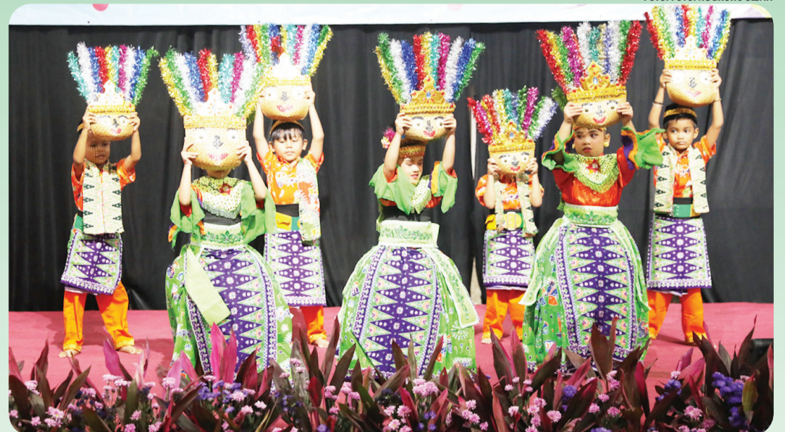
Anak-anak TK Dharma Siwi mementaskan tarian Betawi.

"Melalui kegiatan ini, penyelenggara berharap anak-anak dapat merasakan langsung bagaimana hak mereka diapresiasi dan difasilitasi dalam lingkungan pendidikan," tandasnya. • beritajakarta.id