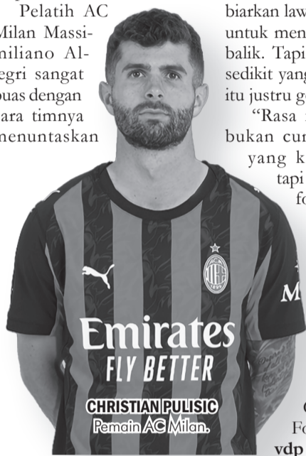
Emirates FLY BETTER CHRISTIAN PULISIC Pemain AC Milan.

Pelatih AC Milan Massimiliano Allegri sangat puas dengan cara timnya menuntaskan