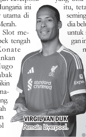
VIRGIL VAN DIJK Pemain Liverpool.

kan bek. Biasanya, setidaknya saya juga lebih suka memasukkan pemain yang bisa mencetak gol," ujar Slot dikutip dari situs Liverpool. ● vit