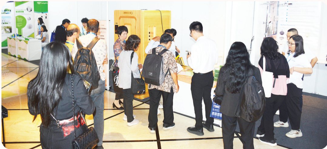
Para pengunjung memadati salah satu area pameran.