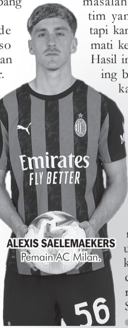
ALEXIS SAELEMAEKERS Pemain AC Milan.

Namun Saelemaekers mengingatkan rekan-rekannya untuk fokus ke laga-laga selanjutnya. “Menang atas tim-tim besar itu selalu menghadirkan perbedaan. Kami sebelumnya punya masalah dengan tim-tim yang lebih kecil, tapi kami bisa menikmati kemenangan ini. Hasil ini sangat penting buat kerja yang kami kerahkan sepanjang pekan, tapi mulai besok kami perlu alih fokus. Lupakan laga ini dan bekerja buat berikutnya. Penting untuk melangkah ke depan dan melakukan reset,” tandas Saelemaekers. ● vdp