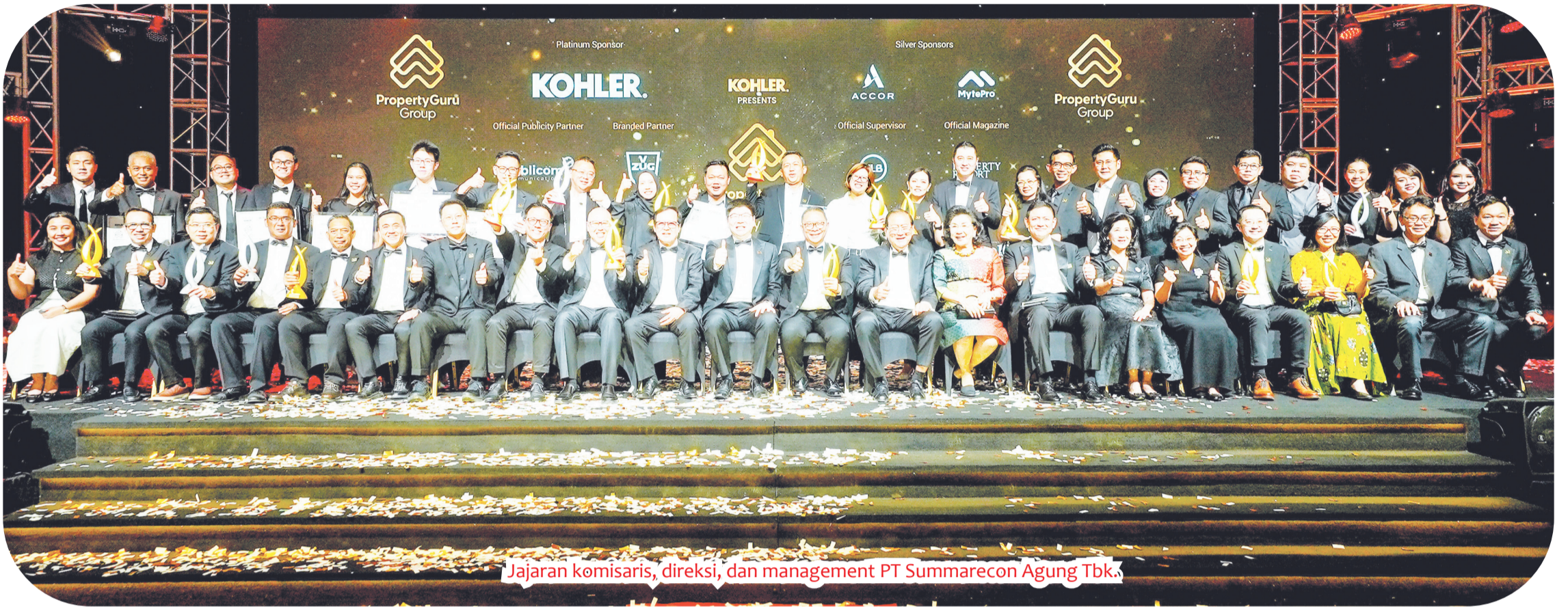
Jajaran komisaris, direksi, dan management PT Summarecon Agung Tbk.

JAKARTA (LB) - Menjelang ulang tahun ke-50, PT Summarecon Agung Tbk (Summarecon) kembali meraih pencapaian istimewa dengan meraih 16 penghargaan di ajang The 11th PropertyGuru Indonesia Property Awards.