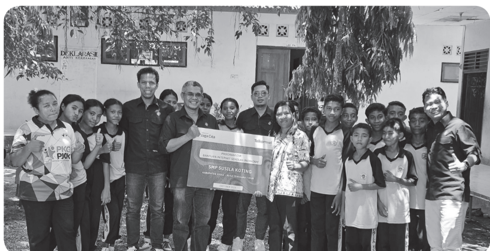
Penyerahan bantuan 111.500 GB kuota internet Telkomsel kepada perwakilan SMP Susila Koting.

BANDUNG (LB) - PT Telkom Indonesia (Persero) Tbk (Telkom) menegaskan komitmennya dalam mendukung pembangunan inklusif dan kedaulatan digital nasional melalui penyaluran 111.500 GB kuota internet Telkom-