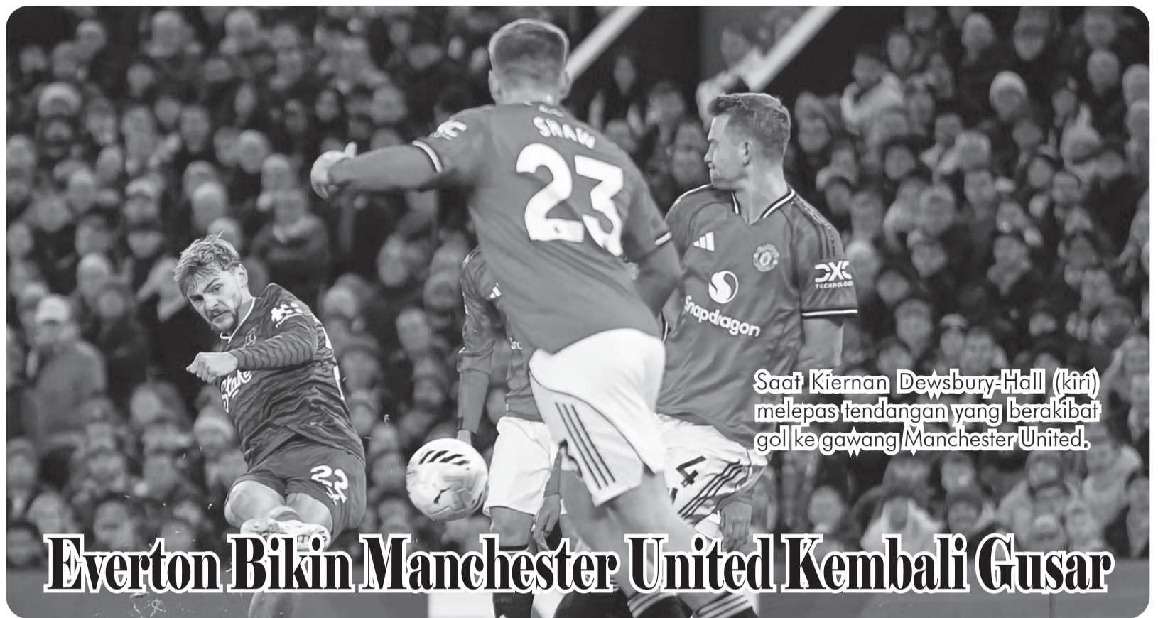
Saat Kiernan Dewsbury-Hall (kiri) melepaskan tendangan yang berakibat gol ke gawang Manchester United.