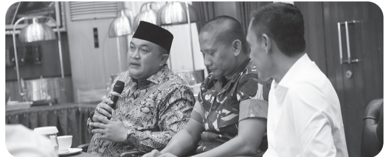
Bupati Bogor saat menyampaikan amanahnya dalam menggelar rapat koordinasi percepatan pelaksanaan Koperasi Desa Kelurahan Merah Putih.