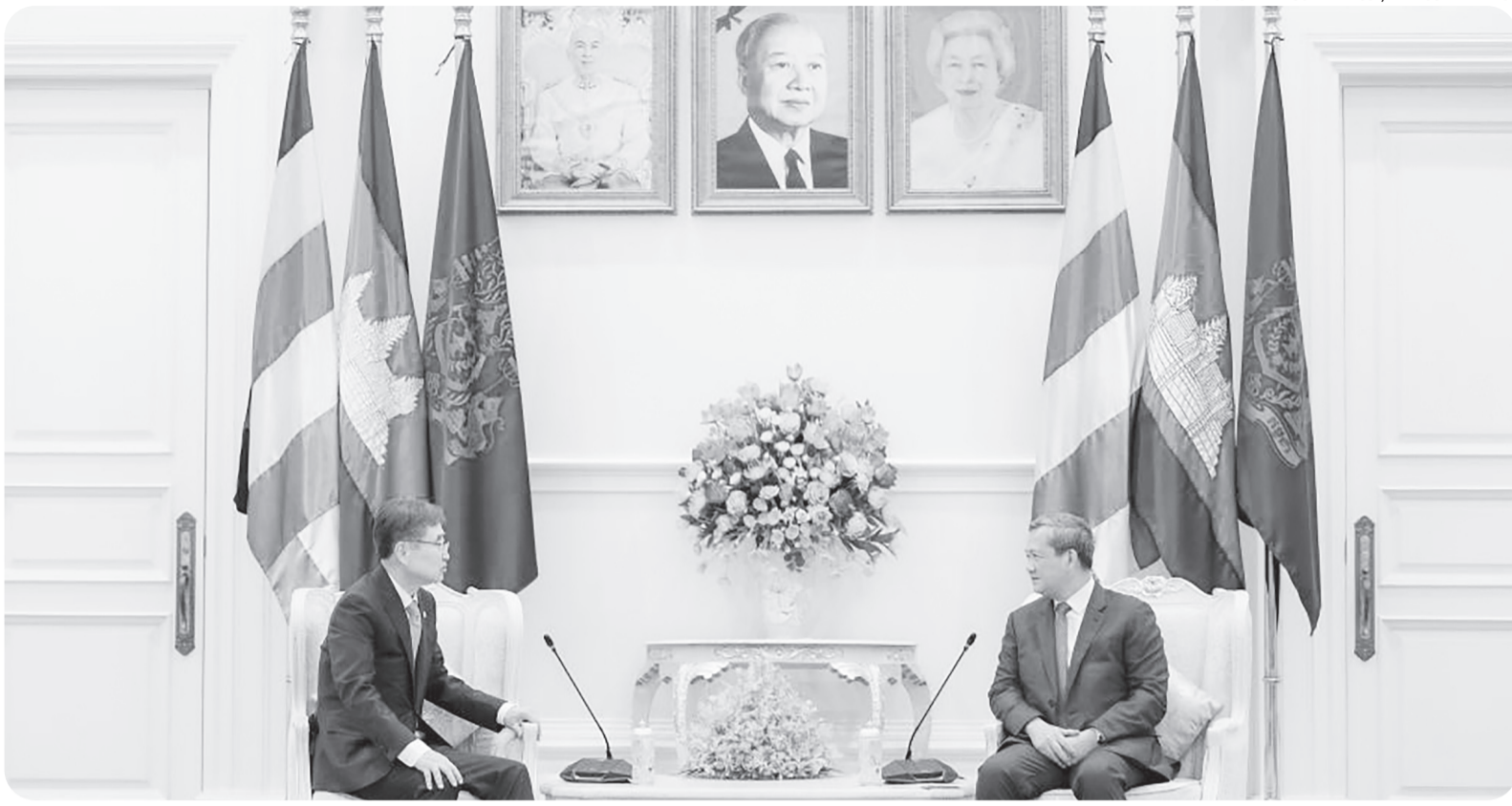
PERTEMUAN PM KAMBOJA DENGAN MENLU KORSEL

Perdana Menteri Kamboja Hun Manet (kanan) bertemu dengan Menteri Luar Negeri Korea Selatan Cho Hyun di Phnom Penh, Kamboja, Senin (10/11/2025). Kamboja dan Korea Selatan pada hari Senin sepakat untuk meningkatkan kerja sama dan memerangi penipuan daring, demikian siaran pers dari pihak Kamboja.