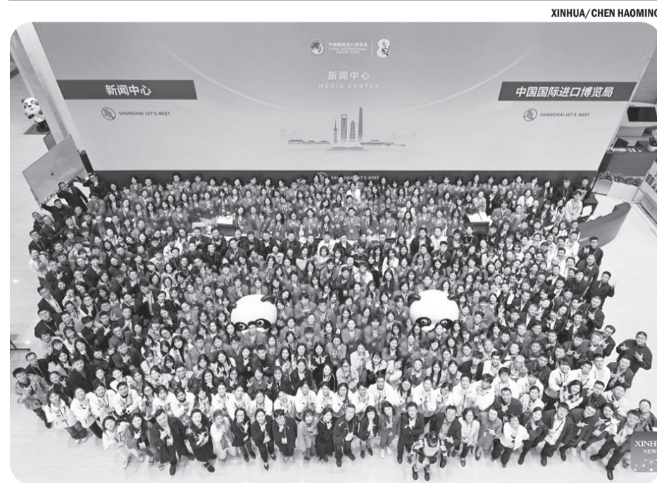
PENUTUPAN PAMERAN IMPOR INTERNASIONAL TIONGGOK

Dalam pernyataannya, GNU menyambut baik "niat tulus yang diungkapkan oleh para pemimpin Lebanon untuk mengaktifkan kembali hubungan diplomatik antara kedua negara dan mengembangkan kerja sama di bidang politik, ekonomi, dan keamanan". ● tom