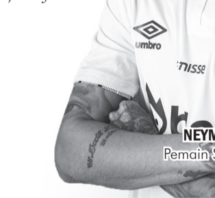
NEYMAR Pemain Santos.