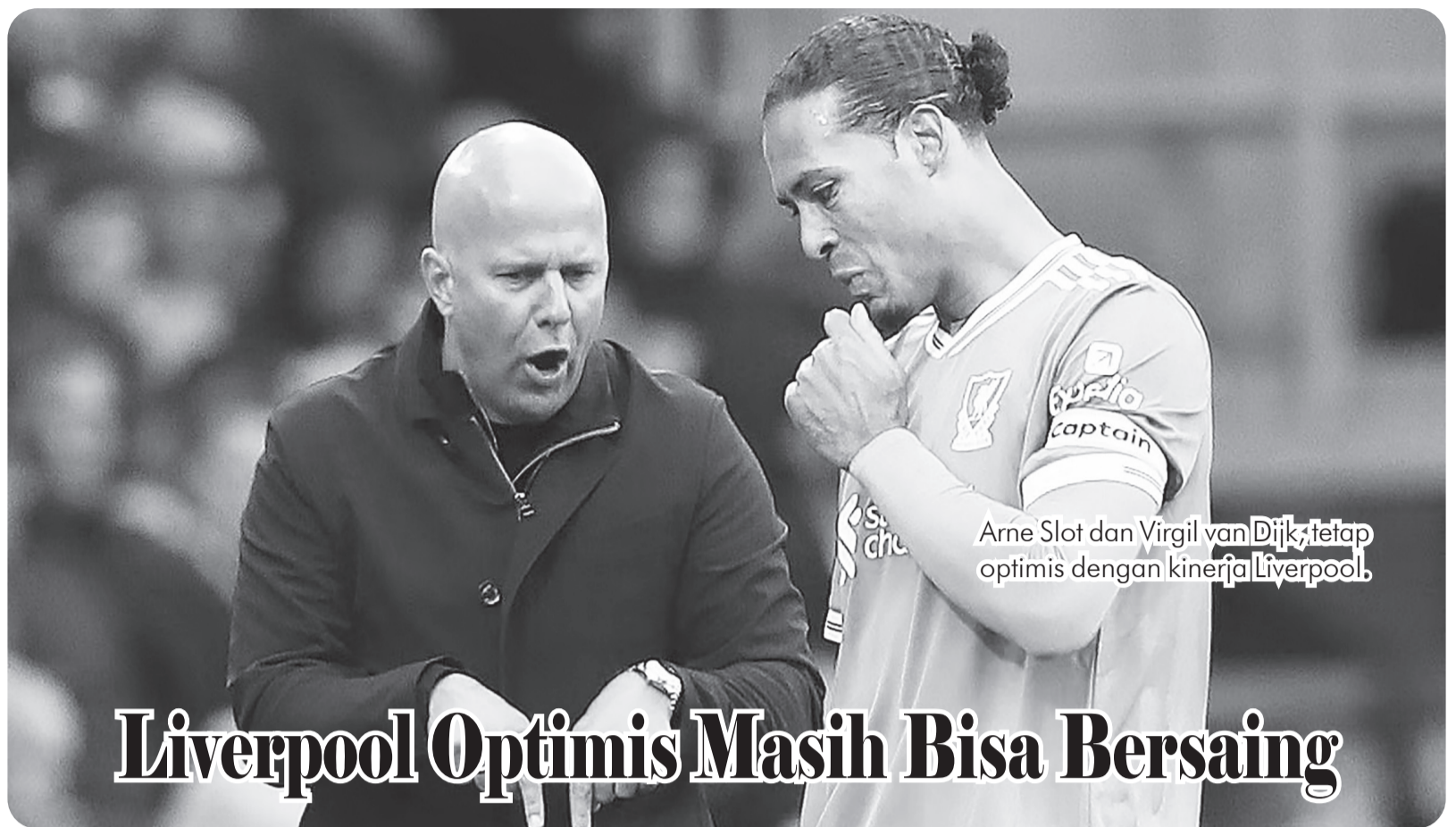
Arne Slot dan Virgil van Dijk tetap optimis dengan kinerja Liverpool.