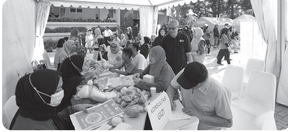
Pasien tuberkulosis atau TBC perlu mendapat dukungan dari keluarga hingga masyarakat untuk berobat. Bukan dikucilkan atau dijauhi.

Di kesempatan yang sama, Deputi Bidang Koordinasi Peningkatan Kualitas Pendidikan dan Moderasi Beragama Kemenko PMK, Profesor Ojat Darajat mengatakan hal serupa. Gotong royong