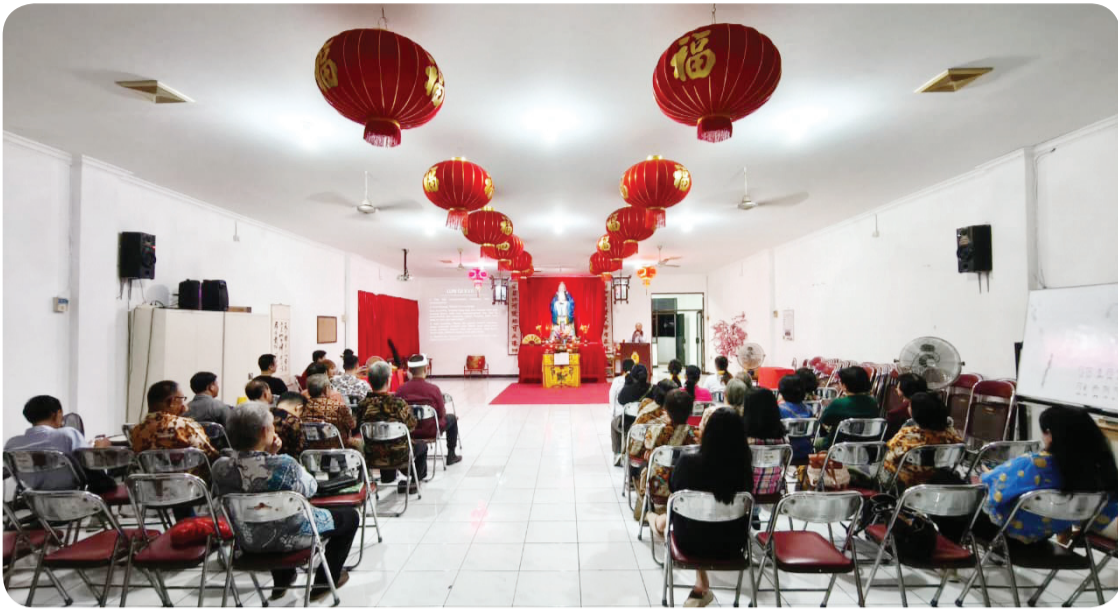
Suasana kebaktian yang berlangsung khidmat.