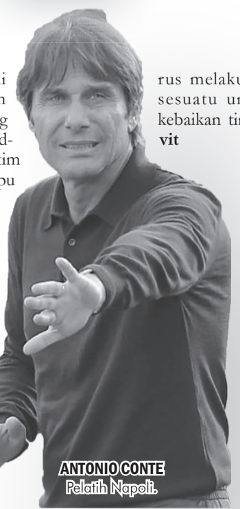
ANTONIO CONTE Pelatih Napoli.