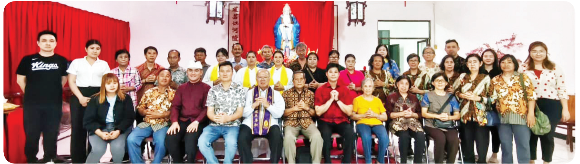
Foto bersama Kebaktian Malam Purnama II.