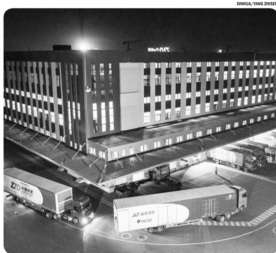
KANTOR PUSAT MANAJEMEN ZTO EXPRESS

Insiden ini menambah daftar keagungan infrastruktur di Tiongkok, setelah sebelumnya pada Agustus lalu jembatan dari jalur nasional yang menghubungkan Sichuan dan Tibet. Sebelum kejadian, jem-