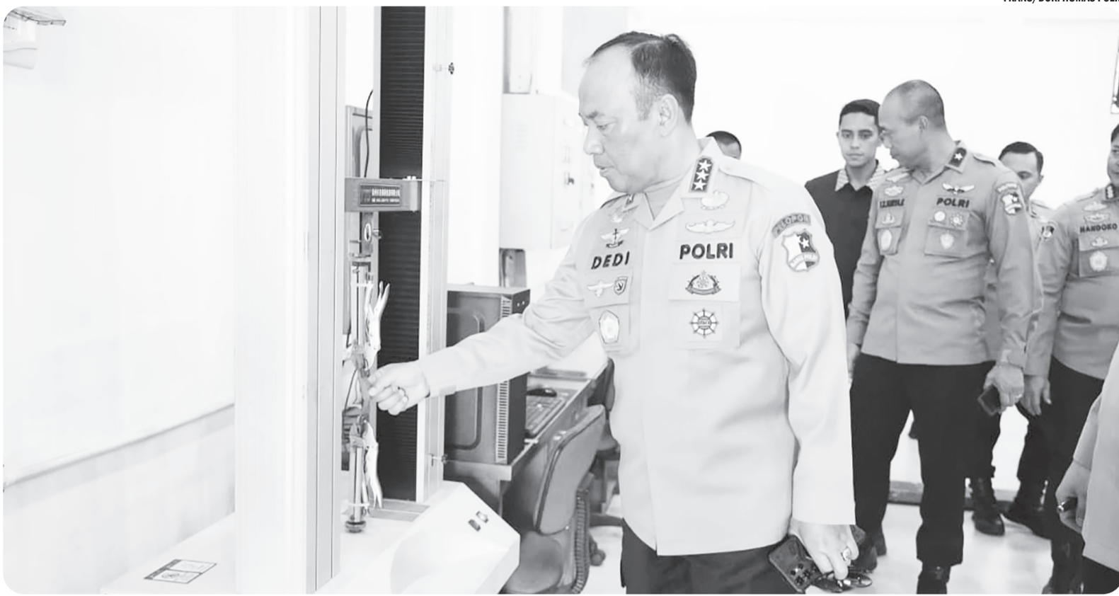
WAKAPOLRI KUNKER KE PUSLITBANG POLRI

Wakil Kepala Kepolisian Komjen Pol. Dedi Prasetyo dan jajarannya melakukan kunjungan kerja ke Puslitbang (Pusat Penelitian dan Pengembangan) Polri di Bojoggede, Kabupaten Bogor, Rabu (12/11/2025). Wakapolri Komjen Pol. Dedi Prasetyo menegaskan bahwa Pusat Penelitian dan Pengembangan (Puslitbang) Polri harus benar-benar urip - hidup, dinamis, dan menjadi api perubahan Polri.