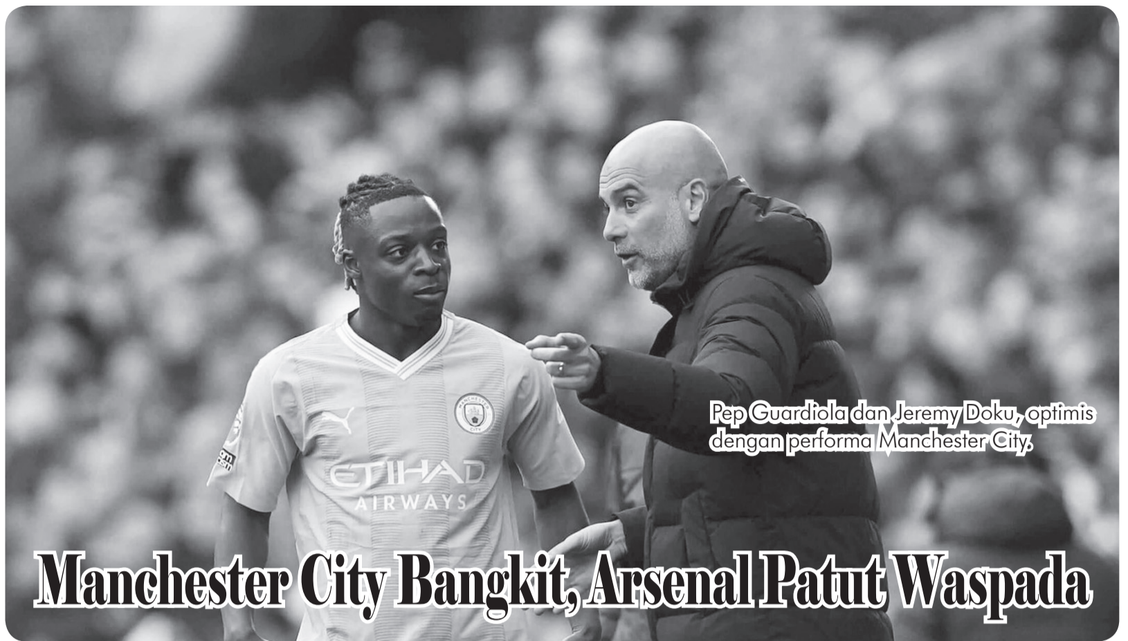
Pep Guardiola dan Jeremy Doku, optimis dengan performa Manchester City.