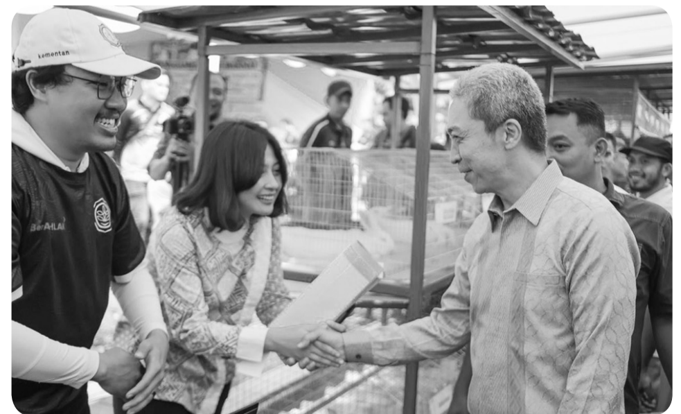
PERINGATAN SATU TAHUN BRMP