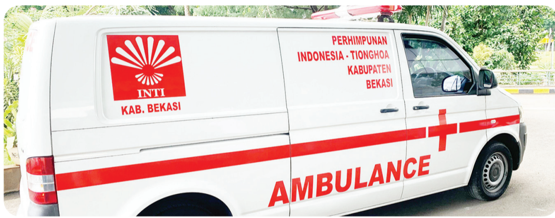
Mobil ambulans milik INTI Kabupaten Bekasi.

"Ini salah bentuk pengabdian INTI Kabupaten Bekasi kepada masyarakat. Ambulans ini gratis dan bisa digunakan oleh semua