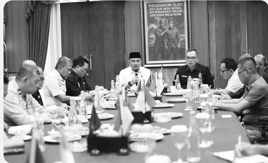
Bupati Bogor, Rudy Susmanto saat menggelar rapat koordinasi TRC kebersihan di ruang Soekarno-Hatta, Pendopo Bupati Bogor, Kabupaten Bogor, Senin (11/11).

CIBINONG (LB) - Bupati Bogor, Rudy Susmanto berupaya secara optimal dengan membentuk sistem kebersihan lebih terintegrasi, berkelanjutan, dan menjadi budaya bersama seluruh masyarakat.