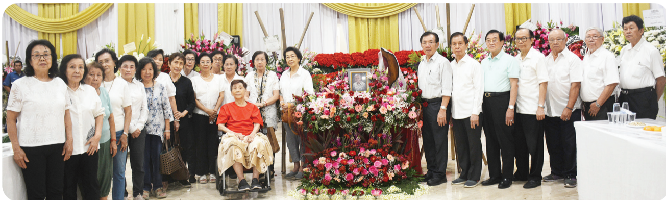
Para tokoh dan pimpinan serta anggota komunitas Tionghoa berfoto bersama.

JAKARTA (LB) — Sejumlah tokoh dan pimpinan komunitas Tionghoa, pengusaha dan kerabat, Selasa (11/11/2025) hadir malam kembang