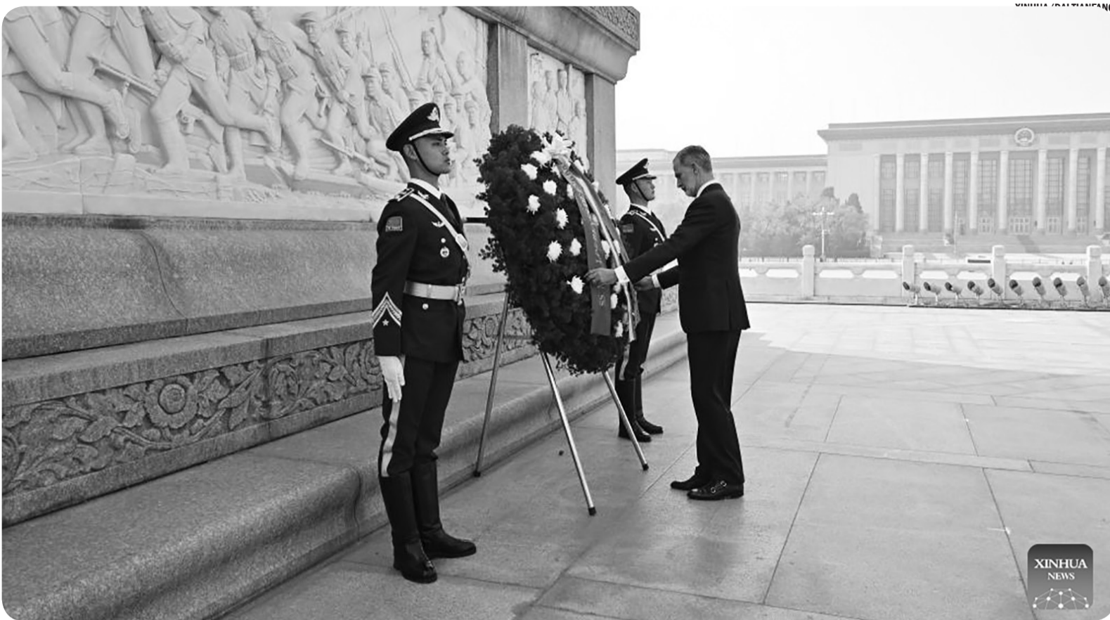
KUNJUNGAN RAJA FELIPE VI DARI SPANYOL DI BEIJING

Raja Felipe VI dari Spanyol meletakkan karangan bunga di Monumen Pahlawan Rakyat di Lapangan Tiananmen di Beijing, Tiongkok, Rabu (12/11/2025).