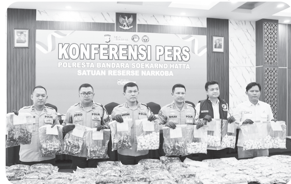
POLRESTA BANDARA SOETTA BONGKAR PEREDARAN VAPE BERISI OBAT KERAS