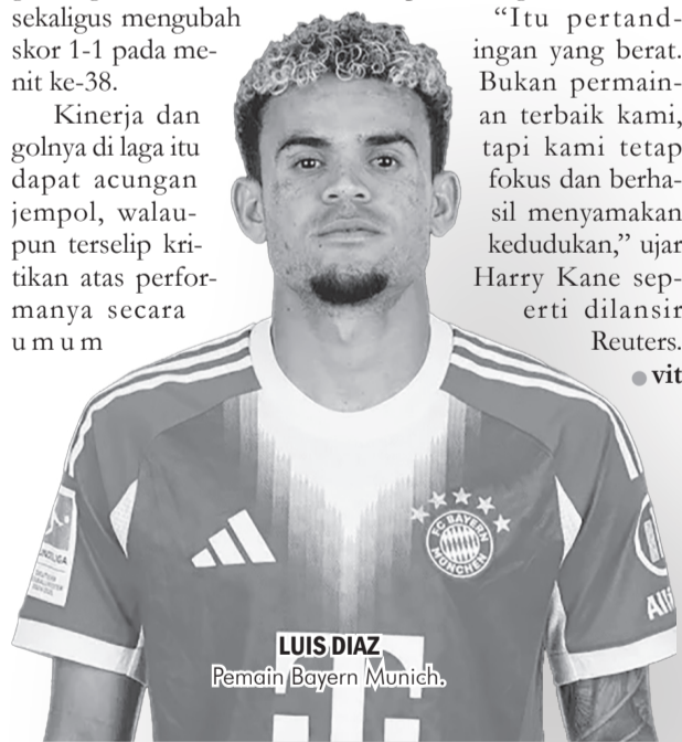
LUIS DIAZ Pemain Bayern Munich.

"Itu pertandingan yang berat. Bukan permainan terbaik kami, tapi kami tetap fokus dan berhasil menyamakan kedudukan," ujar Harry Kane seperti dilansir Reuters. ● vit