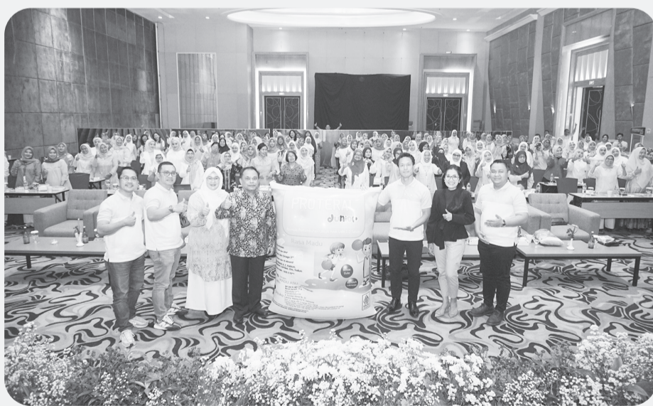
Prosesi peluncuran PROTERAL Junior.