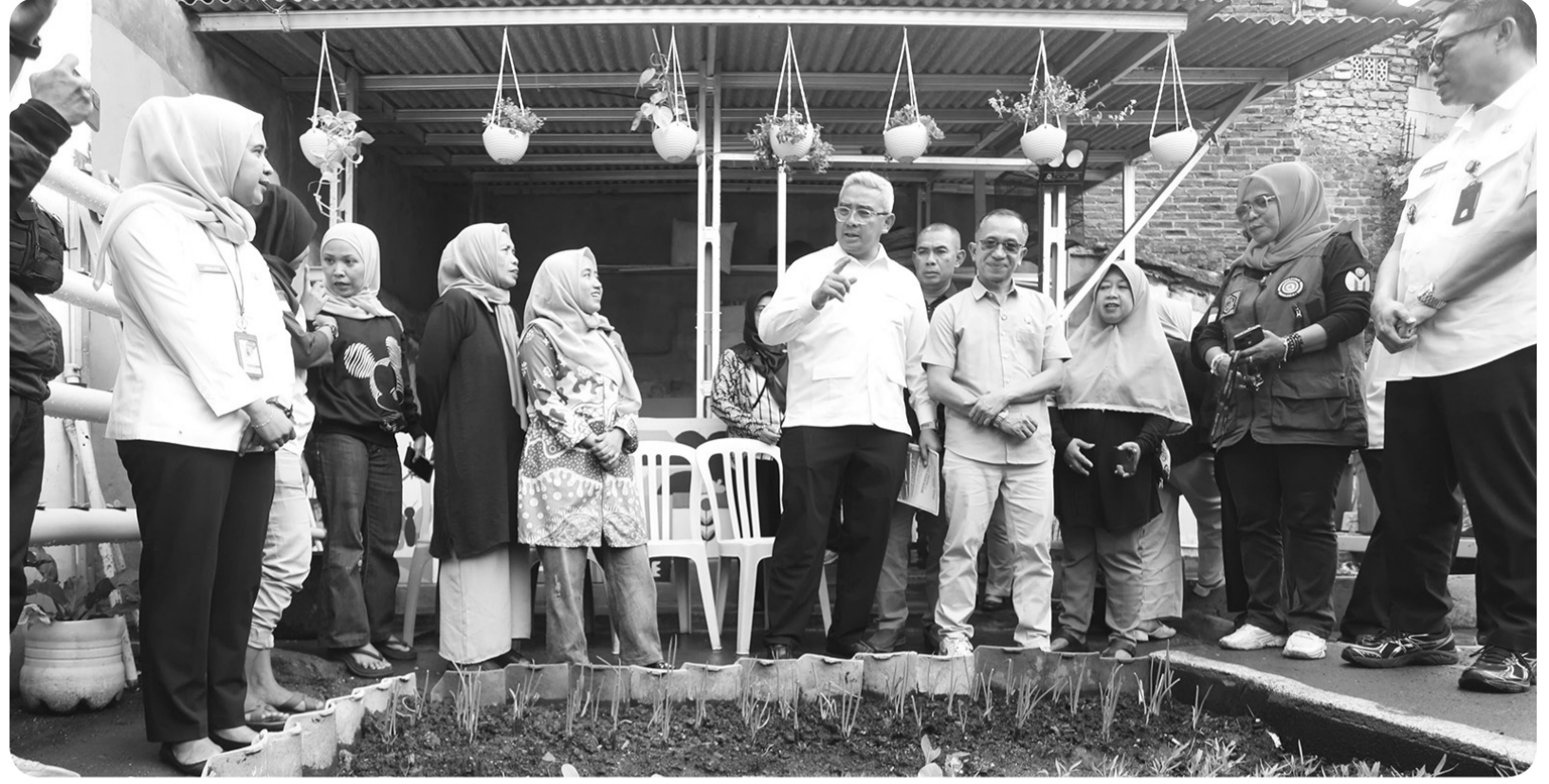
SISKAMLING SIAGA BENCANA EDISI KE-34

Wali Kota Bandung Muhammad Farhan saat kegiatan Siskamling Siaga Bencana Edisi ke-34 di Kelurahan Cibadak, Rabu (12/11/2025). Wali Kota Farhan menilai septic tank komunal merupakan hal penting untuk menjaga sanitasi lingkungan Kota Bandung. Dengan septic tank komunal, warga tak lagi mencemari lingkungan dengan limbah domestik.