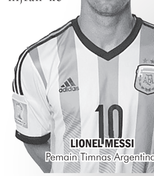
LIONEL MESSI Pemain Timnas Argentina.

Dua tahun di klub Paris tersebut, Messi lantas memutuskan hijrah ke