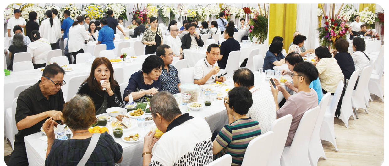
Para pelayat yang datang pada malam kembang.