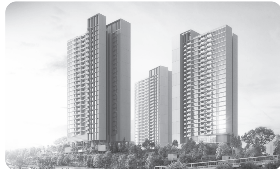
Nava Grove, terletak di kawasan hijau Pine Grove, Singapura.

Aksesibilitas yang sangat baik ini menjadikan Nava Grove pilihan ideal bagi para profesional yang bekerja di kota, serta bagi keluarga yang sedang mencari hunian di lokasi terbaik. ● vit