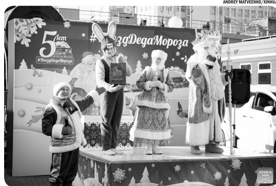
PEMENTASAN SINTERKLAS DAN GADIS SALJU

Di Eropa, pemerintah Belanda bahkan menyarankan agar anak di bawah 15 tahun tidak menggunakan aplikasi seperti TikTok dan Snapchat. ● tom