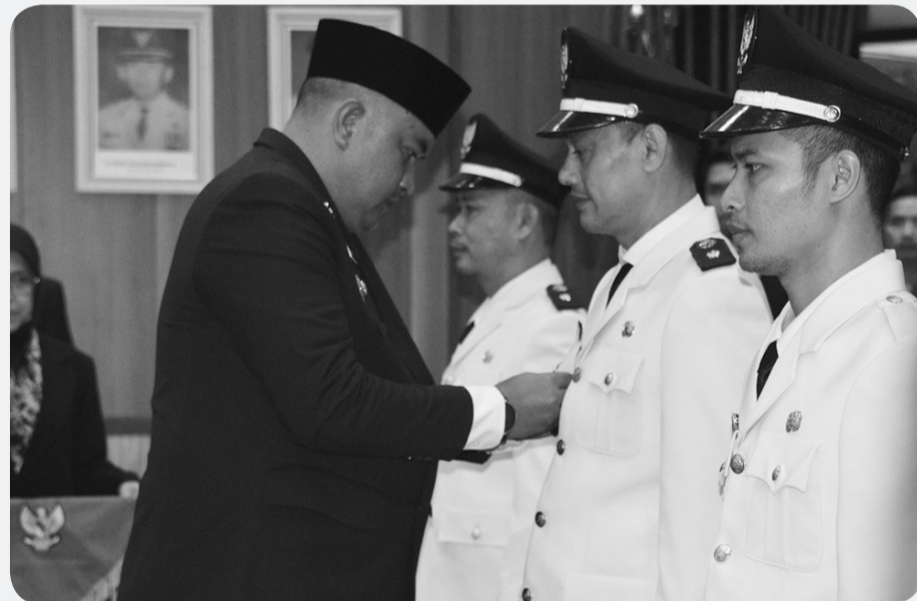
Bupati Bogor, Rudy Susmanto saat melantik empat Kades PAW Rabu (19/11).

Pada kesempatan itu, Rudy juga mengingatkan pembangunan bangsa dan Kabupaten Bogor harus dijalankan melalui kebersamaan, kolaborasi, dan komitmen yang sama dari seluruh