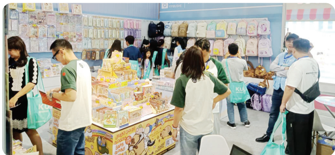
Para pengunjung menyaksikan beragam produk yang ditampilkan peserta pameran.