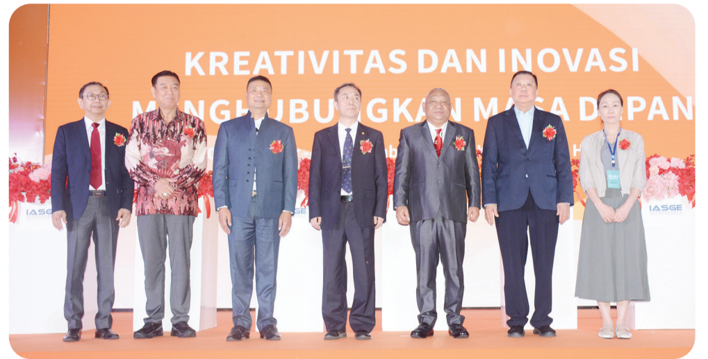
Prosesi pembukaan pameran IASGE 2025.

JAKARTA (LB) - Mengusung tema “Kreativitas dan Inovasi Menghubungkan Masa Depan”, Pameran Alat Tulis & Kado Indonesia-ASEAN 2025 (IASGE/Indonesia Asean Stationery & Gift Expo) yang diselenggarakan oleh Asosiasi Industri Perlengkapan Budaya Yiwu resmi dibuka pada Kamis (20/11/2025) di Hall D2 JIExpo Kemayoran, Jakarta.