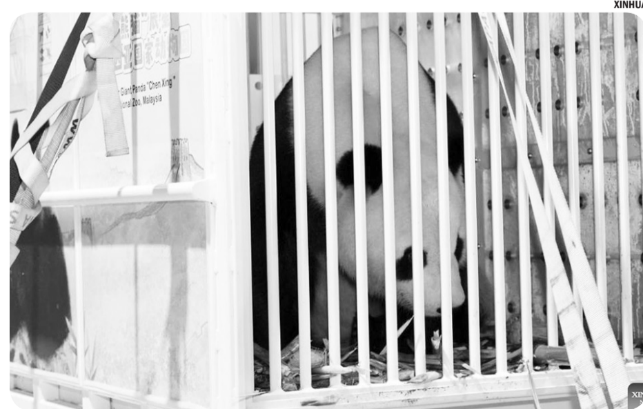
MALAYSIA SAMBUT KEDATANGAN PANDA RAKSASA CHEN XING DAN XIAO YUE Panda raksasa "Chen Xing" terlihat di Bandara Internasional Kuala Lumpur, Malaysia, Selasa (18/11/2025). Malaysia menyambut kedatangan sepasang panda raksasa baru, "Chen Xing" dan "Xiao Yue", dengan keduanya mendarat di Bandara Internasional Kuala Lumpur pada hari Selasa.

"Jika kita ingin berdaulat, kita harus berinovasi, melindungi teknologi-teknologi kunci, dan mempercepat kemunculan perusahaan-perusahaan teknologi besar dari Eropa yang bisa menjadi pemimpin global," tambahnya. ● tom