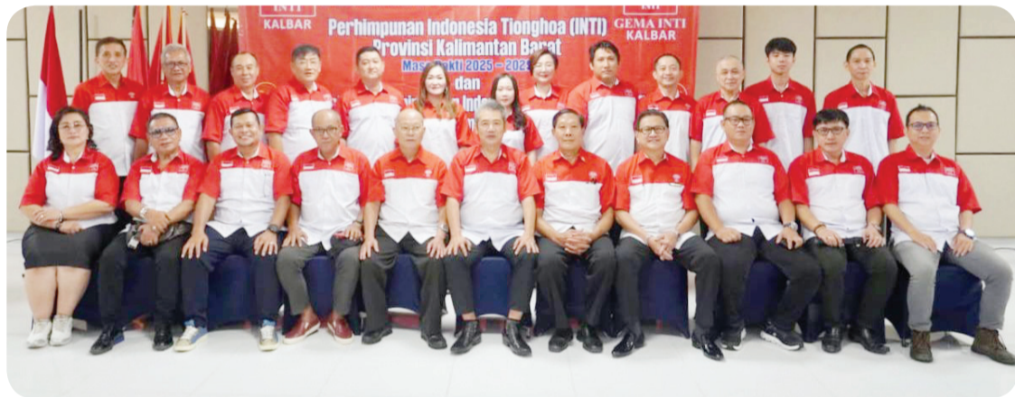
Foto bersama Pengurus Daerah INTI Kalbar.