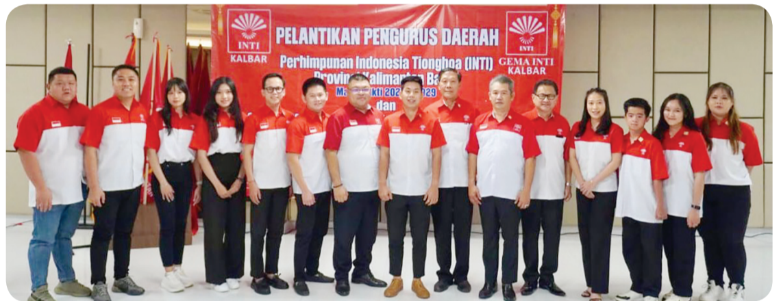
Pengurus Cabang INTI Singkawang berfoto bersama dengan INTI Pusat dan INTI Kalbar.