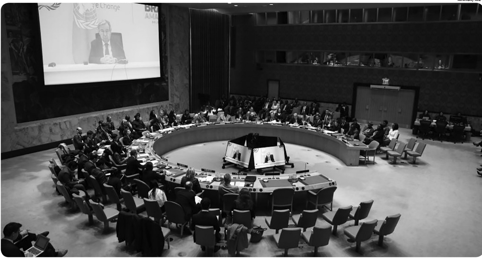
PERTEMUAN KONSOLIDASI PERDAMAIAN DI AFRIKA BARAT

DK PBB (Dewan Keamanan Perserikatan Bangsa-Bangsa) mengadakan pertemuan tentang konsolidasi perdamaian di Afrika Barat, di markas besar PBB di New York, Selasa (18/11/2025). Sekretaris Jenderal PBB Antonio Guterres pada hari Selasa menyerukan persatuan regional untuk memerangi terorisme di Afrika Barat dan Sahel.