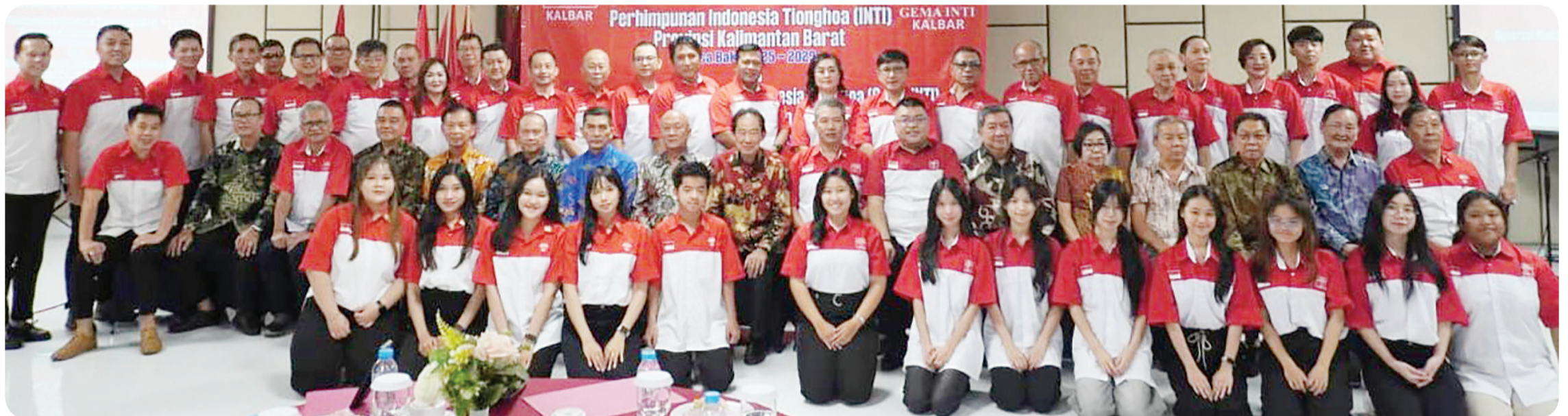
Foto bersama INTI Pusat, GEMA INTI Pusat, GEMA INTI Kalbar, INTI Singkawang.