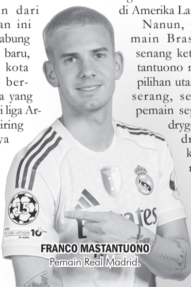
FRANCO MASTANTUONO Pemain Real Madrid.

Nanun, para pemain Brasil tidak senang ketika Mastantuono mulai jadi pilihan utama di lini serang, sementara pemain seperti Rodrygo dan Endrick, jadi kesulitan mendapat jam terbang. ● vdp