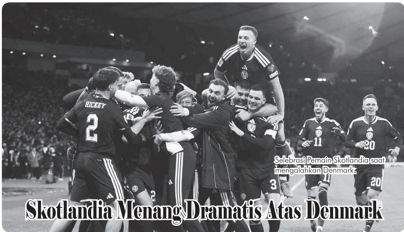
Selebrasi Pemain Skotlandia saat mengalahkan Denmark.