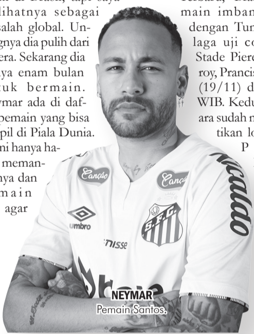
NEYMAR Pemain Santos.