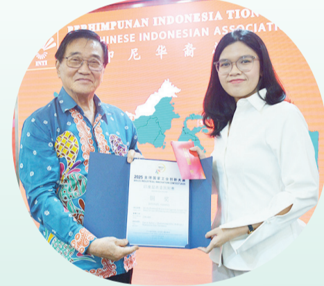
Penyerahan sertifikat penghargaan Bronze Award.