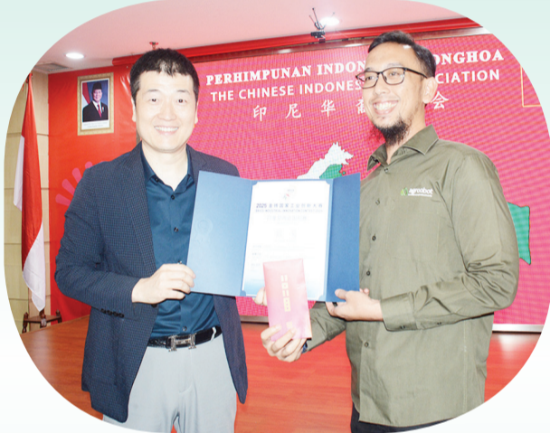
Penyerahan sertifikat penghargaan Silver Award.