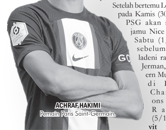
ACHRAF HAKIMI Pemain Paris Saint-Germain.