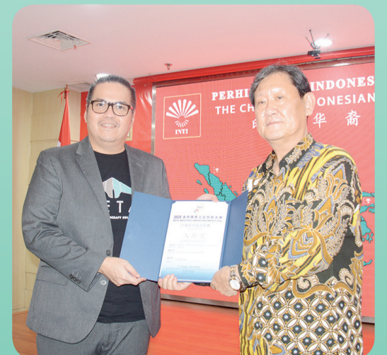
Penyerahan sertifikat penghargaan Nomination Award.

omic and Technical Cooperation, Ministry of Industry and Information Technology, serta diselenggarakan bersama oleh Genertec International Holding Co., Ltd., Perhimpunan INTI (Indonesia Tionghoa), Genertec BRICS (Xiamen) Investment Development Co., Ltd., dan Xiamen Industry and Information International Technology Development Co., Ltd.