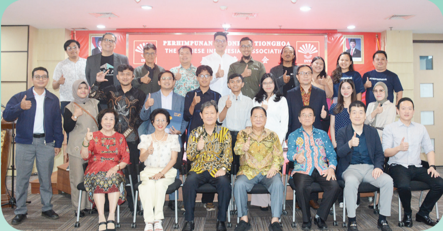
Foto bersama usai penyerahan sertifikat penghargaan.