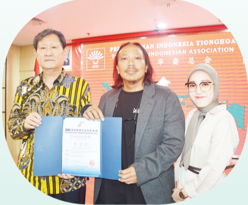
Penyerahan sertifikat penghargaan Excellence Award.