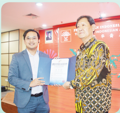
Penyerahan sertifikat penghargaan Excellence Award.