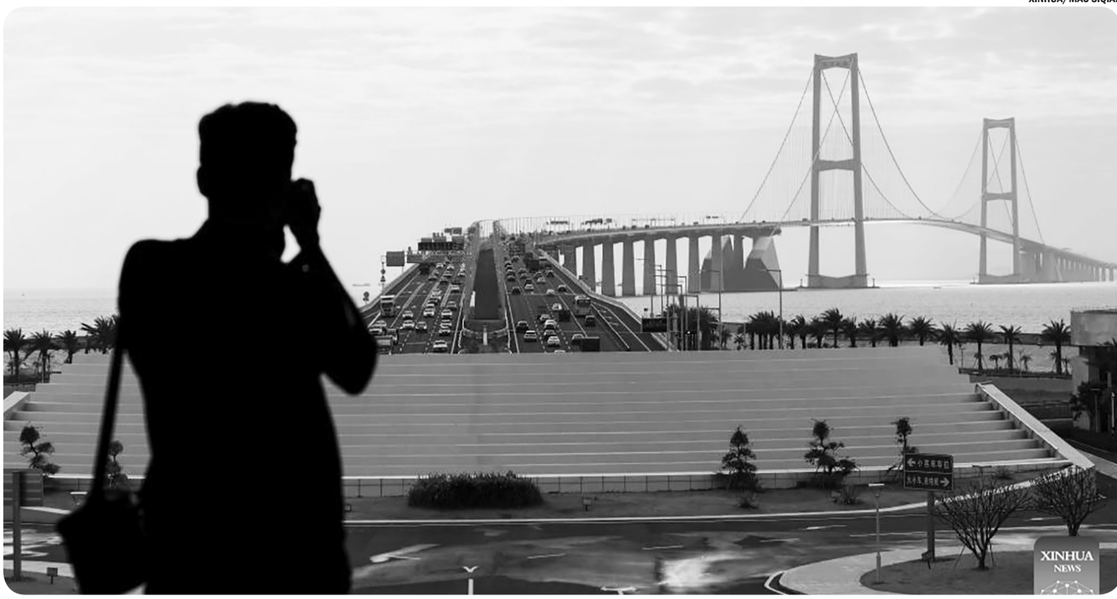
JEMBATAN SHENZHONG DI GUANGDONG

Seorang pria memotret Jembatan Shenzhong dari anjungan pandang di pulau buatan sebelah barat Jalur Shenzhen-Zhongshan di Provinsi Guangdong, Tiongkok, Sabtu (25/10/2025). Pulau buatan sebelah barat Jalur Shenzhen-Zhongshan memulai uji coba operasi untuk pariwisata pada hari Sabtu.