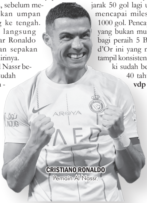
CRISTIANO RONALDO Pemain Al Nassr.