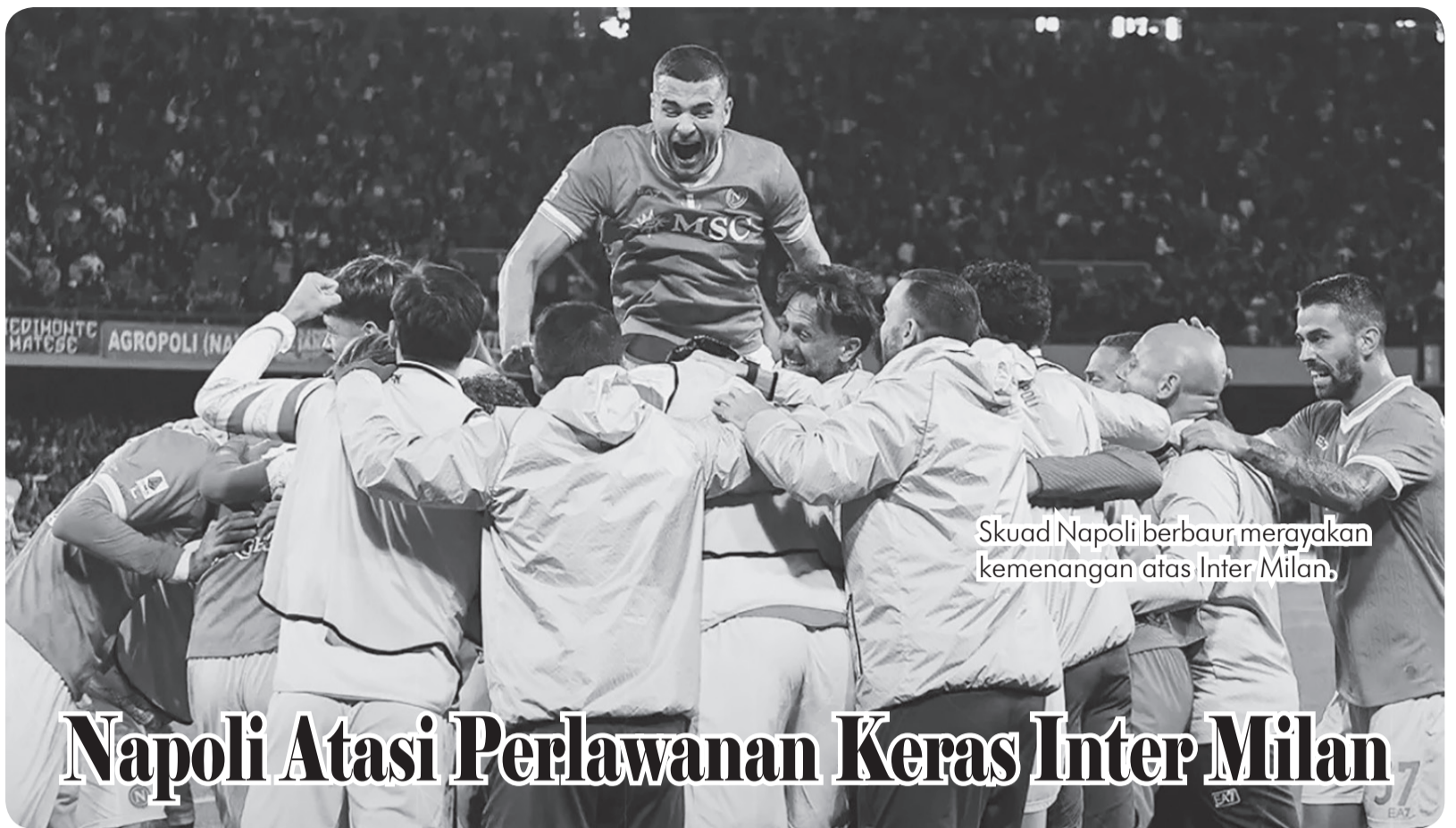
Skuad Napoli berbaris merayakan kemenangan atas Inter Milan.