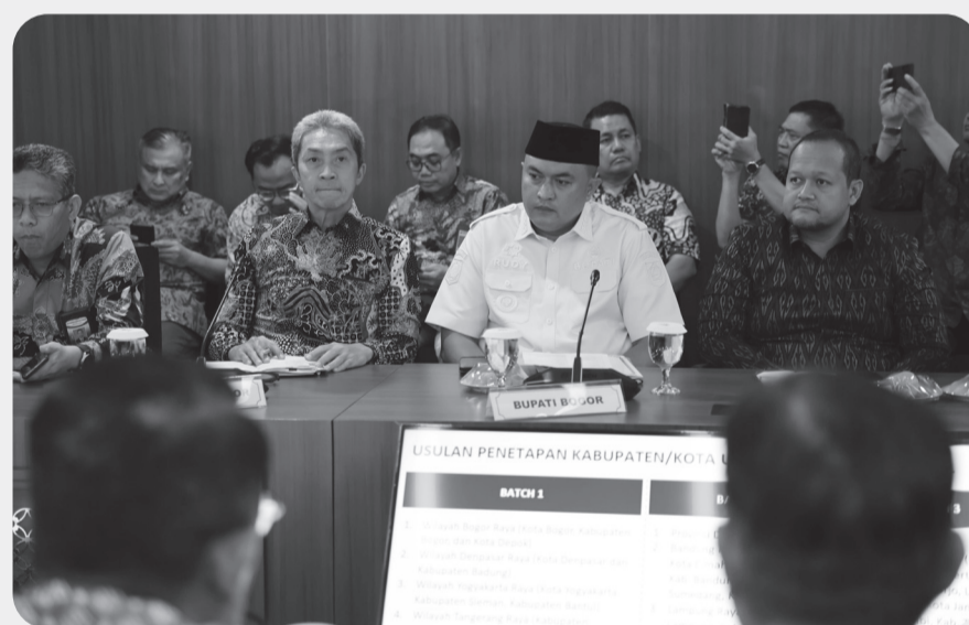
Bupati Bogor, Rudy Susmanto.

CIBINONG (LB) - Bupati Bogor, Rudy Susmanto mendukung penuh pembangunan program Waste To Energy (WTE) atau Pengolahan Sampah Menjadi Energi Listrik (PSEL) oleh pemerintah pusat di tujuh lokasi, salah satunya di wilayah Bogor Raya.