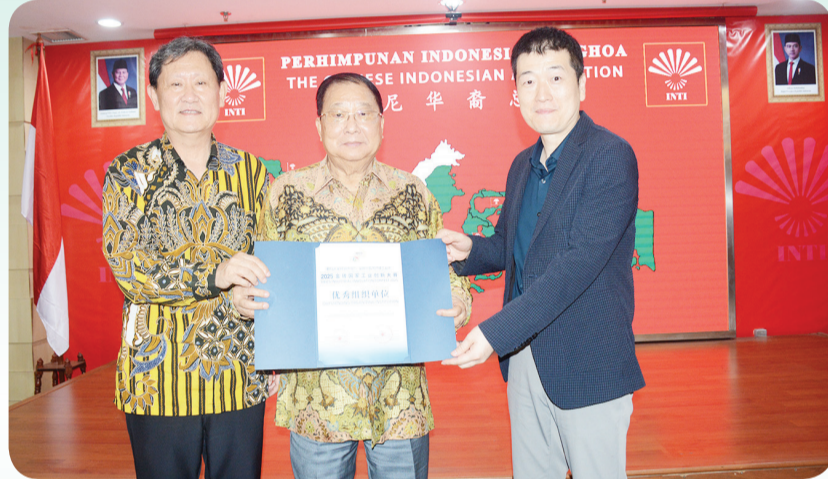
Panitia memberikan sertifikat penghargaan kepada Perhimpunan INTI.