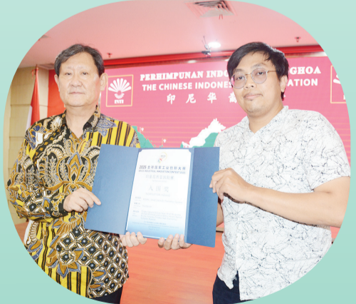
Penyerahan sertifikat penghargaan Nomination Award.