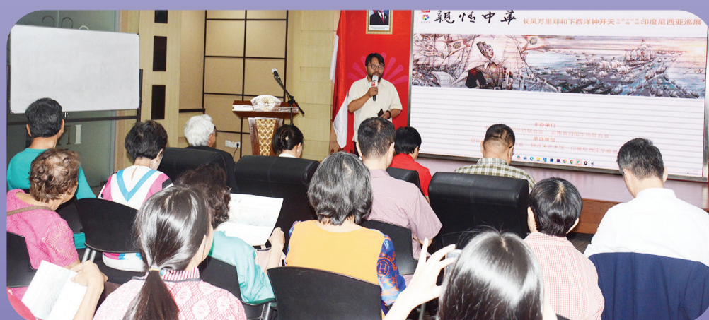
Suasana pembukaan pameran.