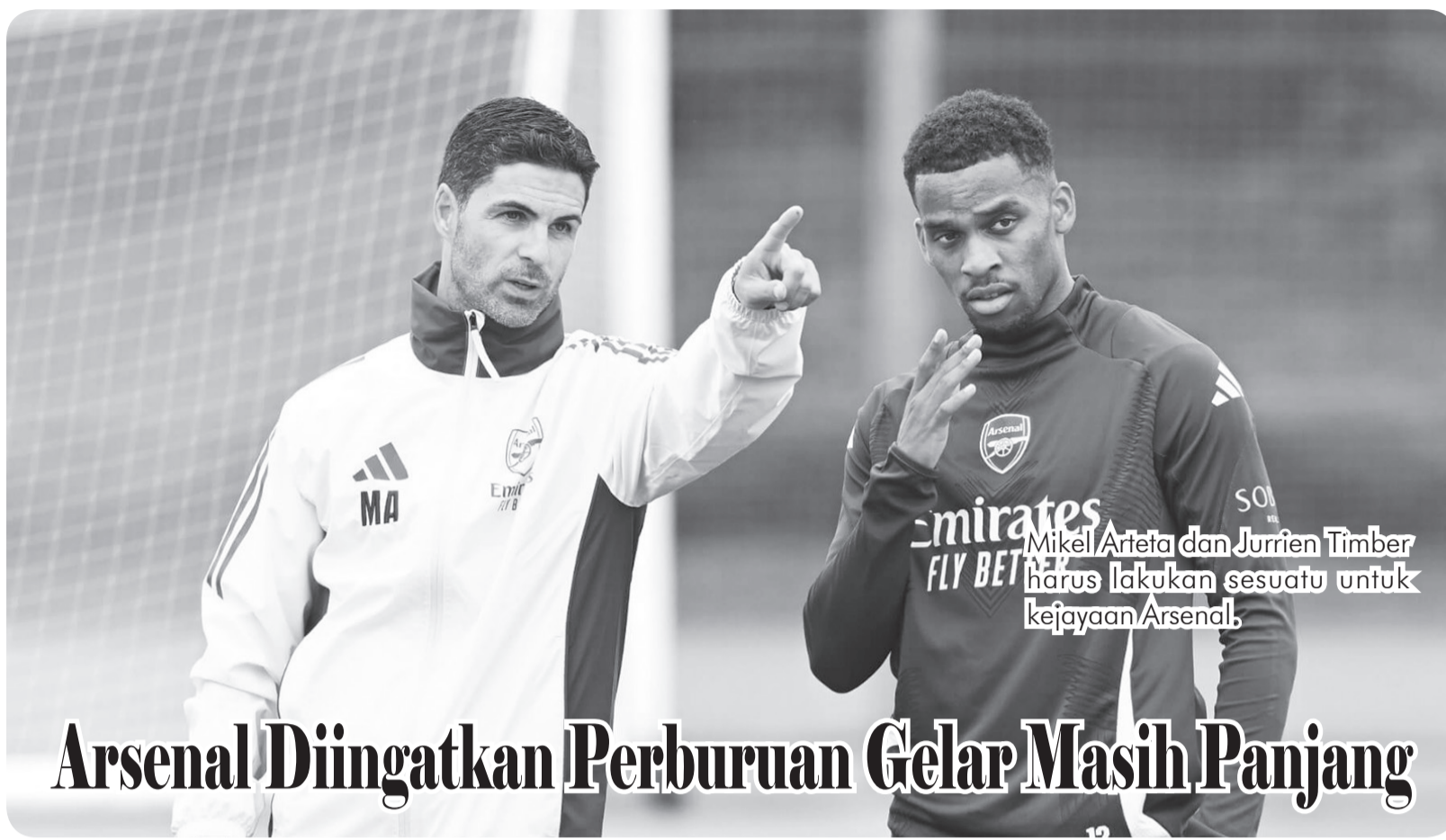
Mikel Arteta dan Jurrien Timber harus lakukan sesuatu untuk kejayaan Arsenal.