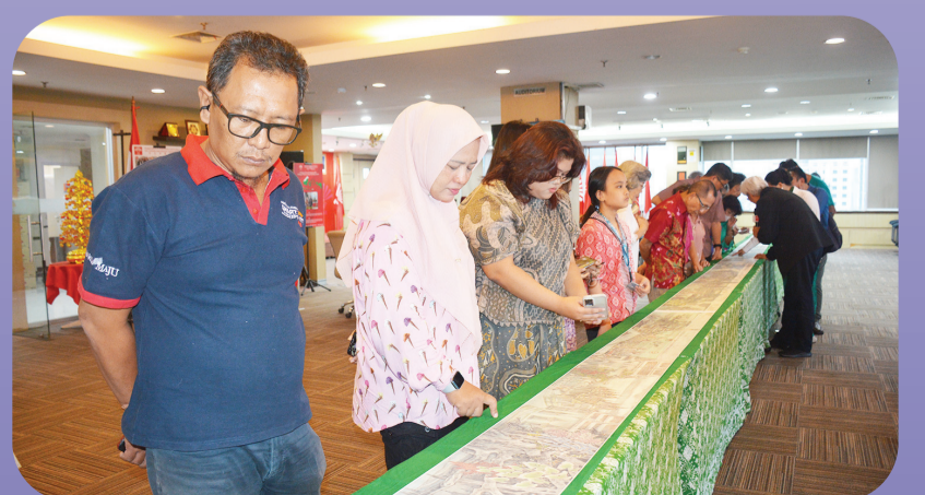
Para pengunjung mengamati karya lukis Zhong Kaitian.