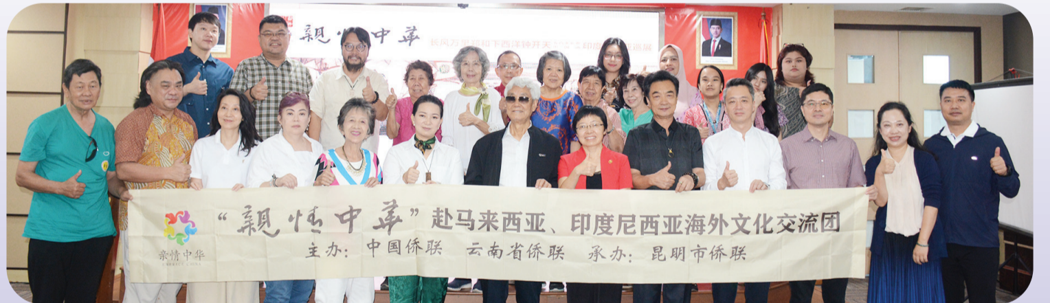
Foto bersama pada pembukaan pameran.