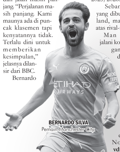
BERNARDO SILVA Pemain Manchester City.

Silva menyebut, kalau permainan Manchester City cukup bagus. Serangan demi serangan terus diluncurkan apa daya apesnya hanya belum bisa menjebol gawang lawan.