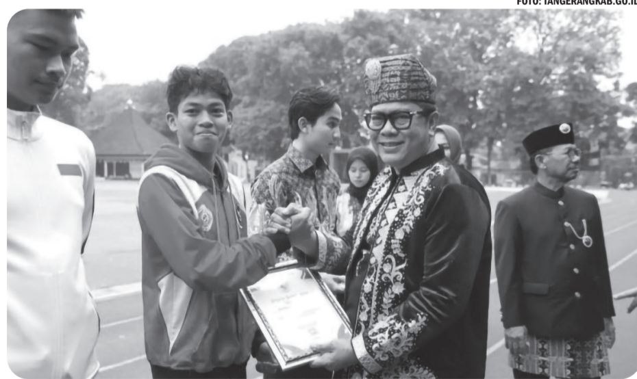
WABUP INTAN HADIRI SIMULASI MANASIK HAJI SISWA TK

Wakil Bupati Tangerang Intan Nurul Hikmah menghadiri tarbiyah simulasi manasik haji siswa Taman Kanak-kanak (TK) yang digelar Al Muhmudah Manasik Training Center Lubana Sengkol, Tangerang Selatan, Senin (27/10/25). Dalam sambutannya, Wabup Intan menyambut baik kegiatan bagi anak-anak TK tersebut dalam rangka mengenalkan dan mensimulasikan salah satu rukun Islam sejak dini, agar mereka nantinya juga termotivasi untuk senantiasa menyelaraskan pola hidupnya sesuai dengan teladan Nabi Muhammad SAW.