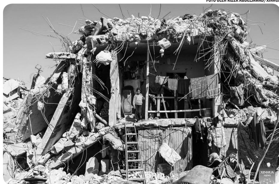
92 PERSEN BANGUNAN DI GAZA HANCUR

Usulan itu ditolak dengan hasil pemungutan suara 54 berbanding 45, kurang dari ambang 60 suara yang dibutuhkan untuk melanjutkan pembahasan. ● tom