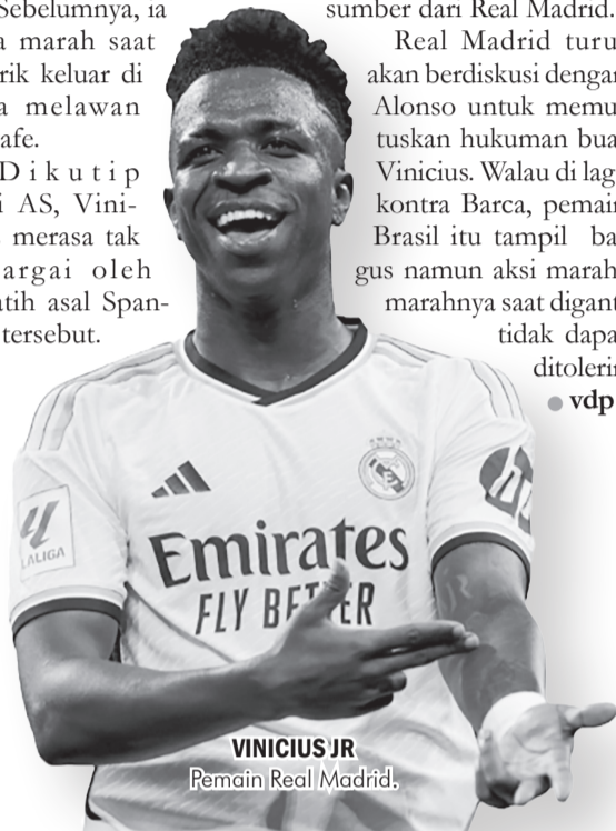
VINICIUS JR Remain Real Madrid.