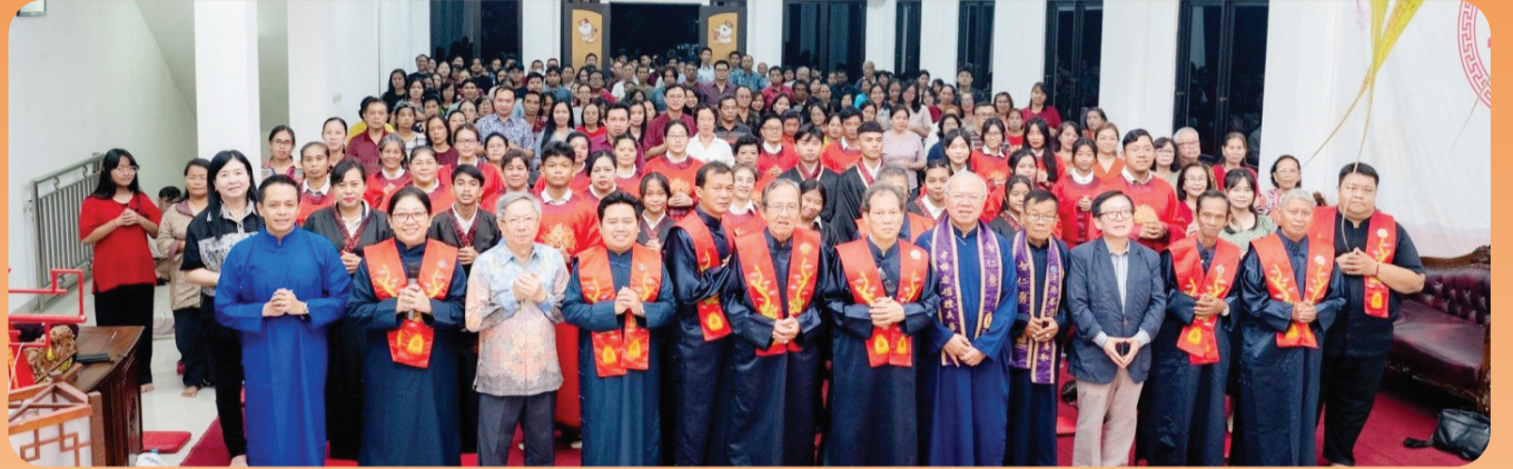
Foto bersama usai kebaktian.