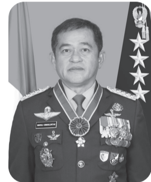
Jendral TNI Maruli Simanjuntak

ga kita bisa cukup dipandang baik di luar,” jelas Maruli.