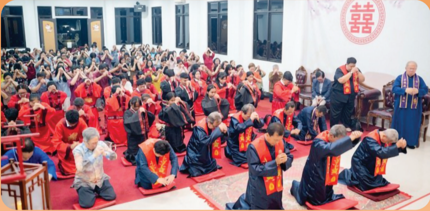
Prosesi persembahyangan Peringatan Hari Lahir Nabi Kongzi ke 2575 di Lithang Gerbang Kebajikan MAKIN Citeureup.