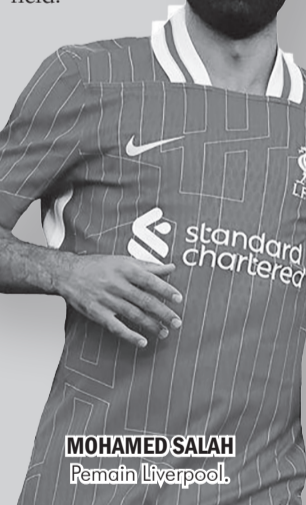
MOHAMED SALAH Pemain Liverpool.

Namun, ajang Carabao Cup ini bisa saja menjadi pelampiasan Liverpool untuk bangkit. Salah satu faktornya karena laga berlangsung di Anfield.