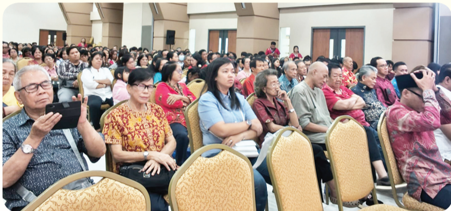
Para hadirin mengikuti Perayaan Hari Lahir Nabi Agung Kongzi ke 2576 Kongzili.

Tak hanya diisi oleh sambutan-sambutan, acara tersebut juga dimeriahkan dengan berbagai hiburan, diantaranya, seni tari, penyanyi, rampak tambur, dan seni drama musikal kelahiran Nabi Kongzi yang diperankan oleh siswa-siswi Sekolah Setia Bhakti Tangerang. • kris