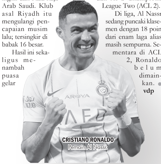
CRISTIANO RONALDO Pemain Al Nassr.