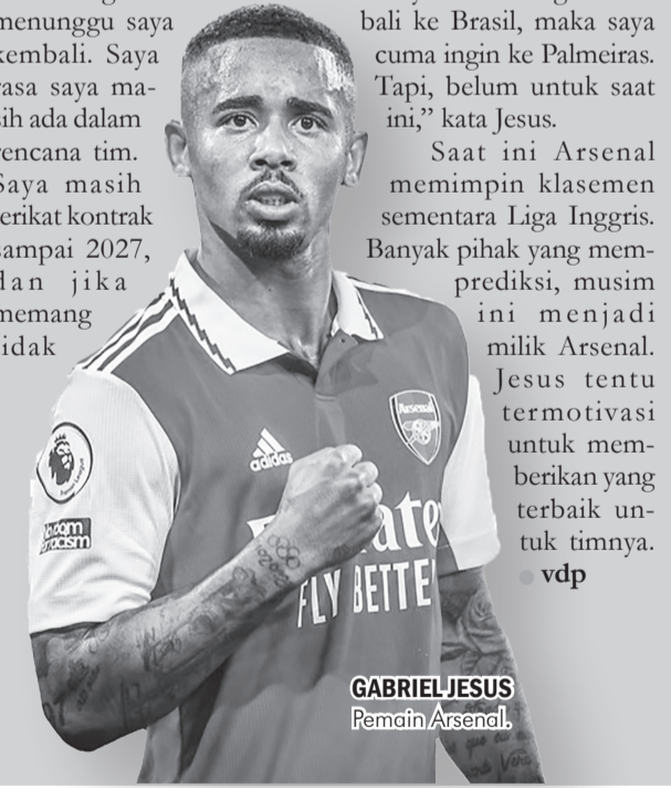
GABRIEL JESUS Pemain Arsenal.