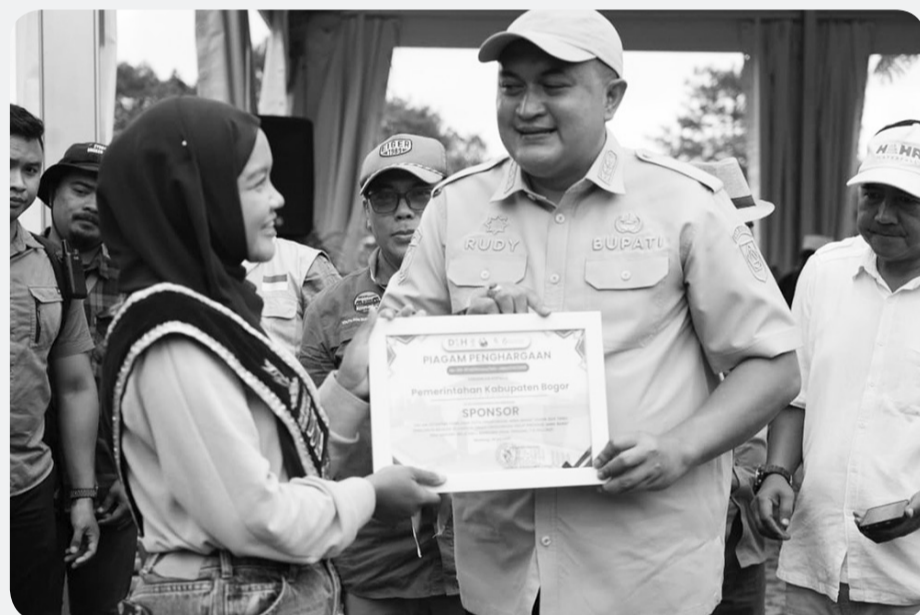
Bupati Bogor, Rudy Susmanto tengah berikan penghargaan kepada warga ikut partisipasi penghijauan di Kabupaten Bogor.

Rudy menegaskan bahwa upaya pelestarian lingkungan dan pengembangan ekonomi harus berjalan seimbang. Pemerintah Kabupaten Bogor, kata dia, berkomitmen memastikan kegiatan investasi tetap dapat tumbuh tanpa mengabaikan aspek kelestarian alam.