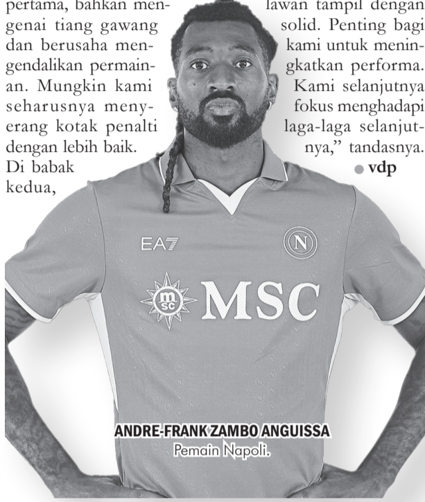
ANDRE-FRANK ZAMBO ANGUSSA Pemain Napoli.