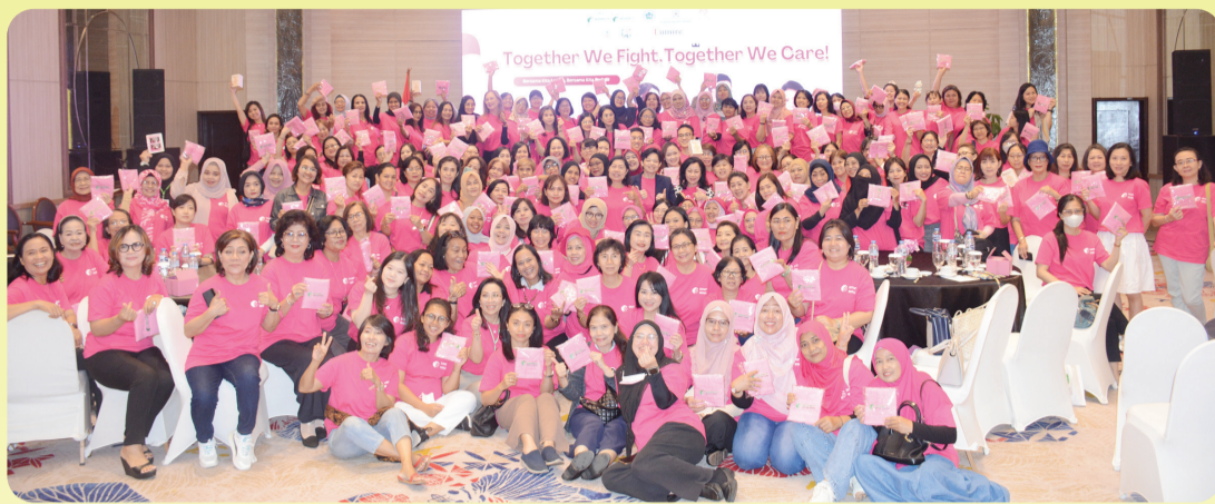
Berfoto bersama para peserta health talk.

Shum menjelaskan bahwa kanker payudara adalah kanker yang terjadi ketika sel-sel pada jaringan payudara berubah dan tumbuh secara tidak terkendali, biasanya ditandai dengan benjolan di payudara.