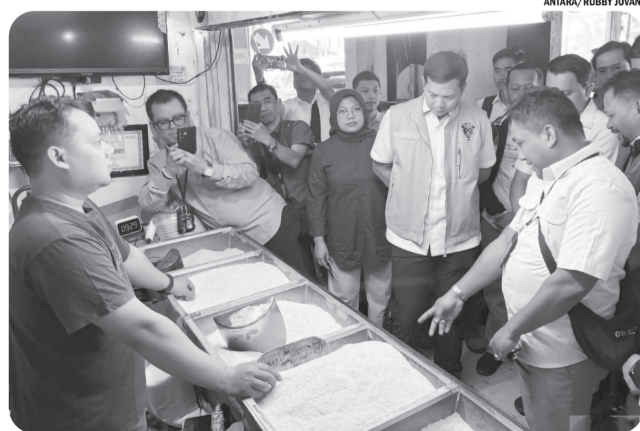
POLDA JABAR CEK KEBERSIKAPAN BERAS

“Selain itu, ekshumasi juga bisa bertujuan untuk mengidentifikasi identitas mayat atau untuk keperluan nonforensik lainnya, seperti pemindahan makam atas permintaan keluarga,” katanya. ● osm