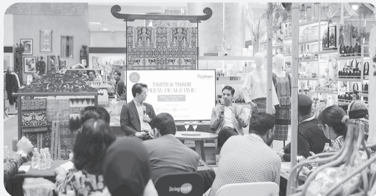
Suasana talk show.

TANGERANG SELATAN (LB) - Dalam rangka mendukung kesuksesan Trade Expo Indonesia (TEI) 2025, Pendopo bersama dengan MS Consultant dan didukung oleh CLIK dan Indonesia Exim Bank serta berkolaborasi dengan Kementerian Luar Negeri RI dan Kementerian Perdagangan RI, menjadi tuan rumah penyelenggaraan acara bertajuk Taste & Trade: Brew Deals Time, Jumat (17/10) lalu.