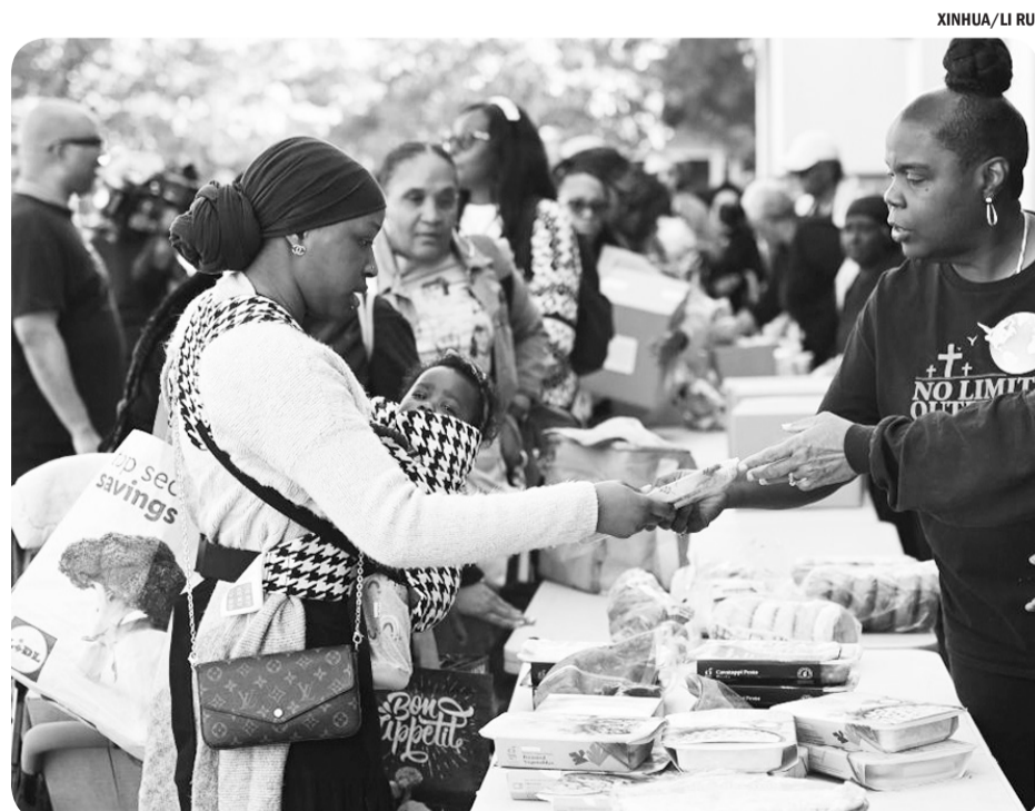
BANTUAN MAKANAN BAGI PEGAWAI FEDERAL DAN KONTRAKTOR AS