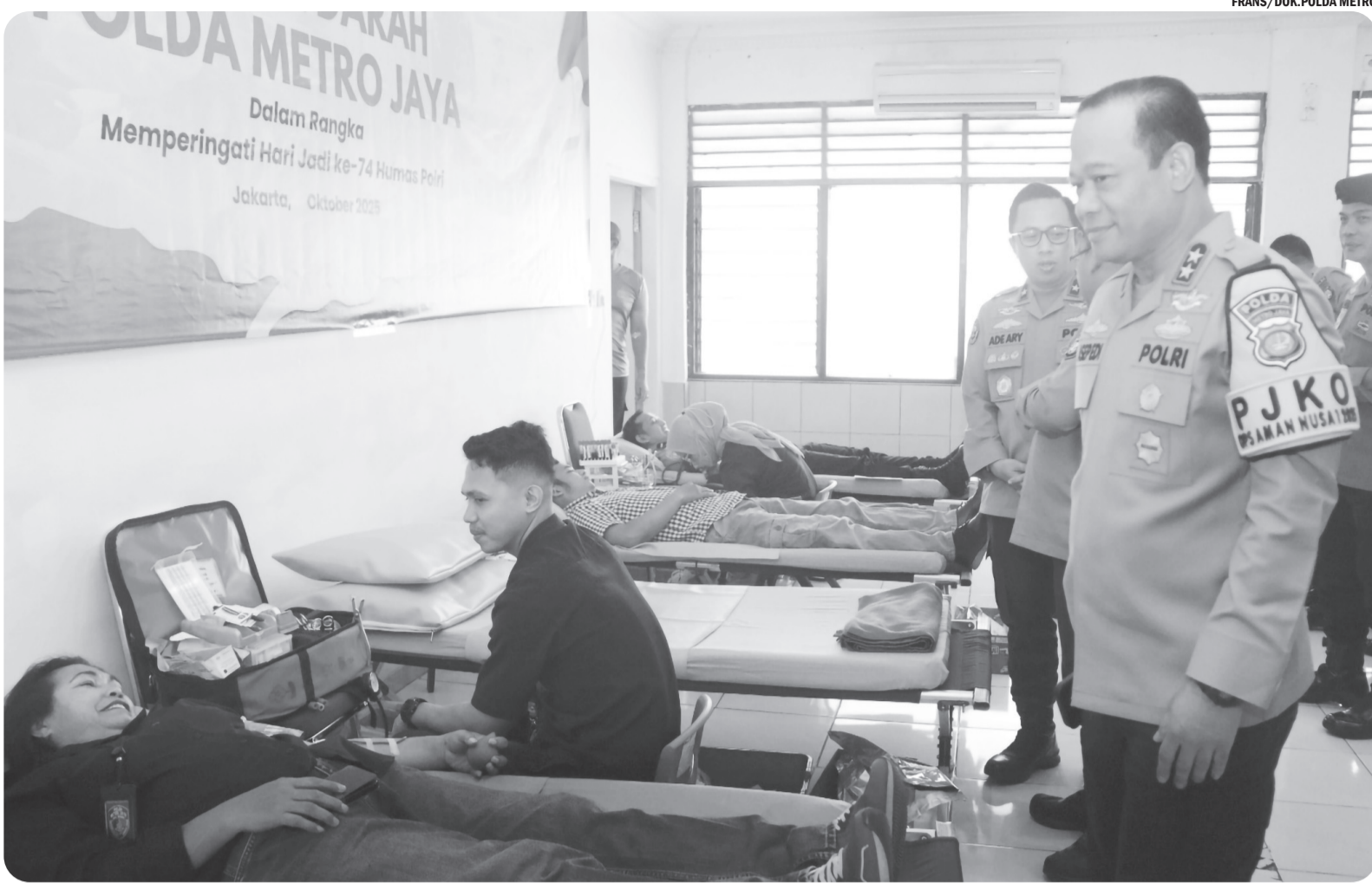
POLDA METRO JAYA GELAR DONOR DARAH