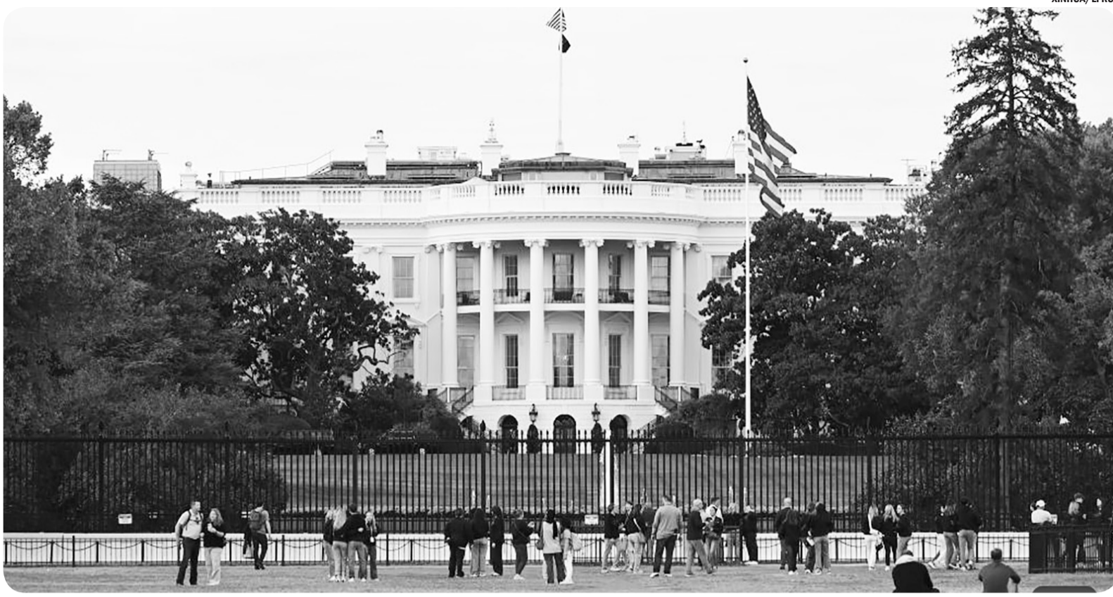
HARI KE-21 PENUTUPAN PEMERINTAH FEDERAL

Sejumlah warga menghabiskan waktu luang mereka di depan Gedung Putih di Washington, D.C., Amerika Serikat, Selasa (21/10/2025). Penutupan pemerintah federal memasuki hari ke-21 pada hari Selasa.