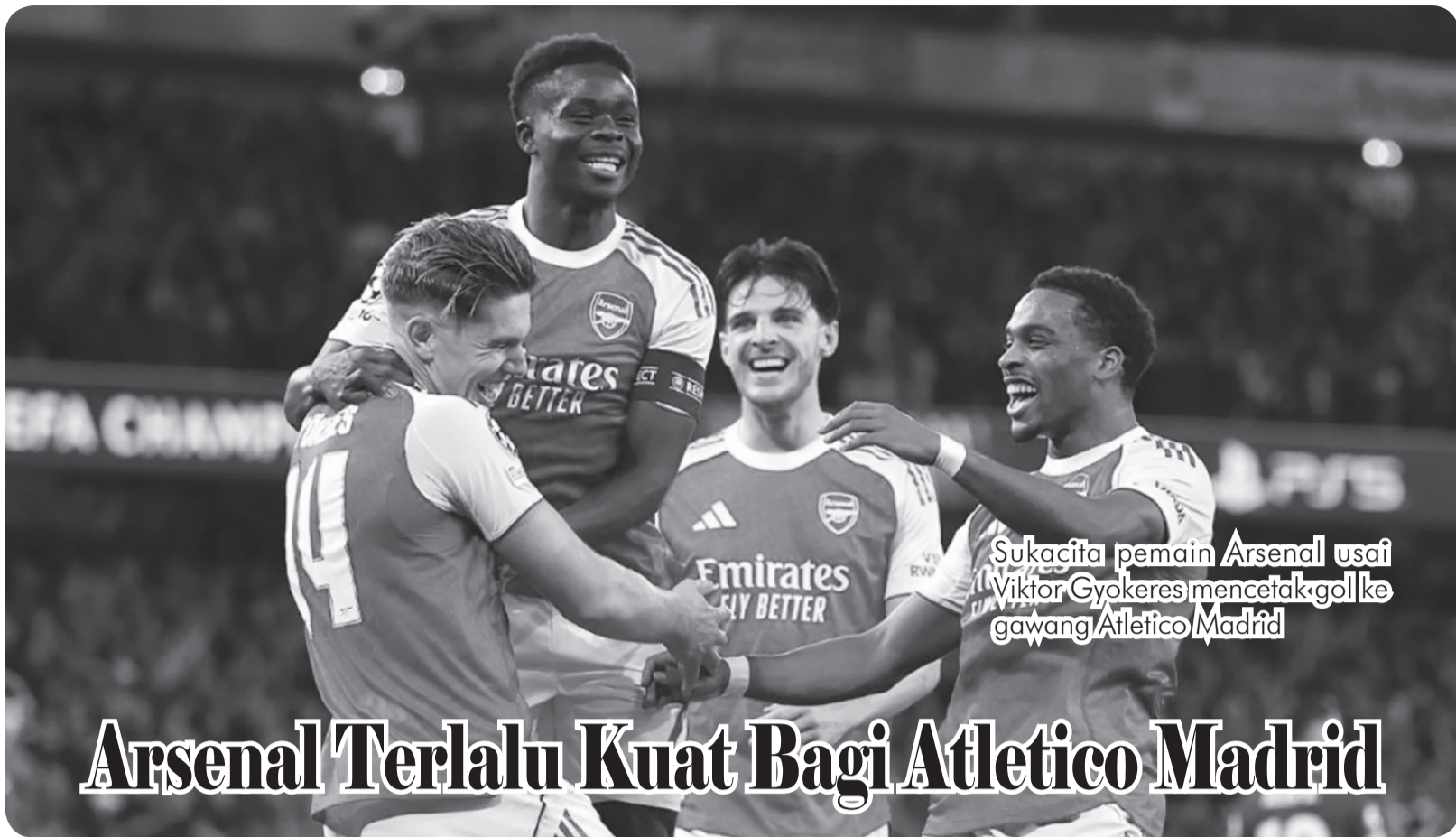
Sukacita pemain Arsenal usai Viktor Gyokeres mencetak gol ke gawang Atletico Madrid