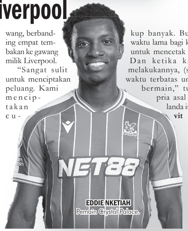
EDDIE NKETIAH Pemain Crystal Palace

"Saya sangat senang dengan kemenangan ini. Itu adalah momen yang penting bagi kami. Kami akan terus berjuang untuk memenangkan pertandingan berikutnya."