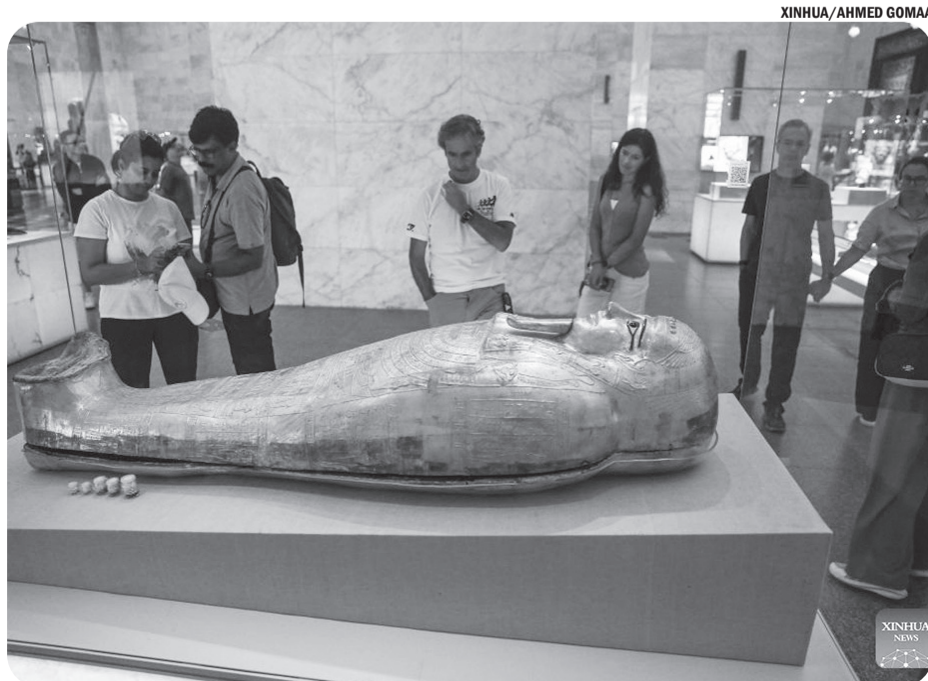
MUSEUM NASIONAL PERADABAN MESIR Wisatawan mengunjungi Museum Nasional Peradaban Mesir dalam rangka Hari Pariwisata Dunia di Kairo, Mesir, pada Sabtu (27/9/2025).

Saat suaminya menjadi presiden tahun 2000, Eihivet menolak hanya berperan sebagai pendamping seremonial. Ia menjadi penasihat politik penting bagi suaminya dan kerap disebut sebagai "alter ego politik" sang presiden. Julukan "wanita besi" pun melekat pada dirinya hingga kini. ● ans