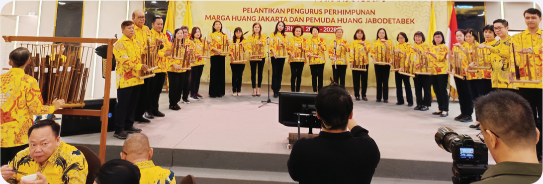
Grup Angklung Marga Huang Jakarta.