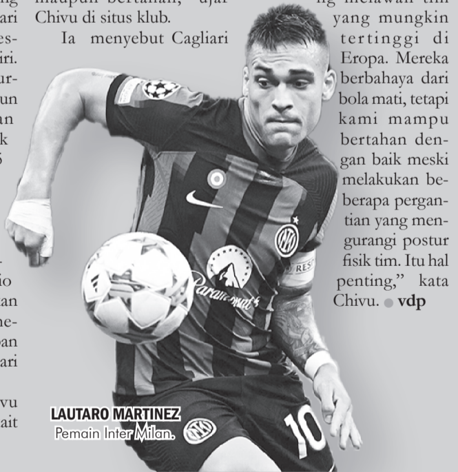
LAUTARO MARTINEZ Pemain Inter Milan

"Kami sempat dua kali mengenai tiang gawang melawan tim yang mungkin tertinggi di Eropa. Mereka berbahaya dari bola mati, tetapi kami mampu bertahan dengan baik meski melakukan beberapa pergantian yang mengurangi postur fisik tim. Itu hal penting," kata Chivu. ● vdp