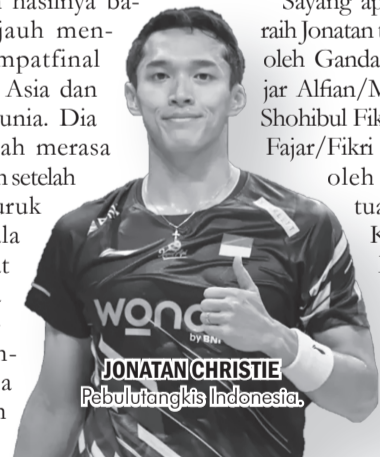
JONATAN CHRISTIE Pebulutangkis Indonesia

Sayang apa yang diraih Jonatan tidak diikuti oleh Ganda Putra, Fajar Alfian/Muhammad Shohibul Fikri. Di final, Fajar/Fikri dikalahkan oleh pasangan tuan rumah, Kim Won Ho/Seo Seung Jae dengan skor 16-21 dan 21-23. ● vdp