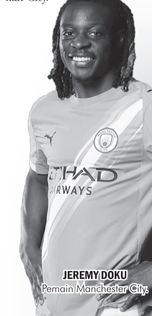
JEREMY DOKU Pemain Manchester City

Guardiola, memuji penampilan pemain sayap, Jeremy Doku yang walaupun tidak mencetak gol, namun terlibat aktif dalam dua gol yang dibukukannya City.