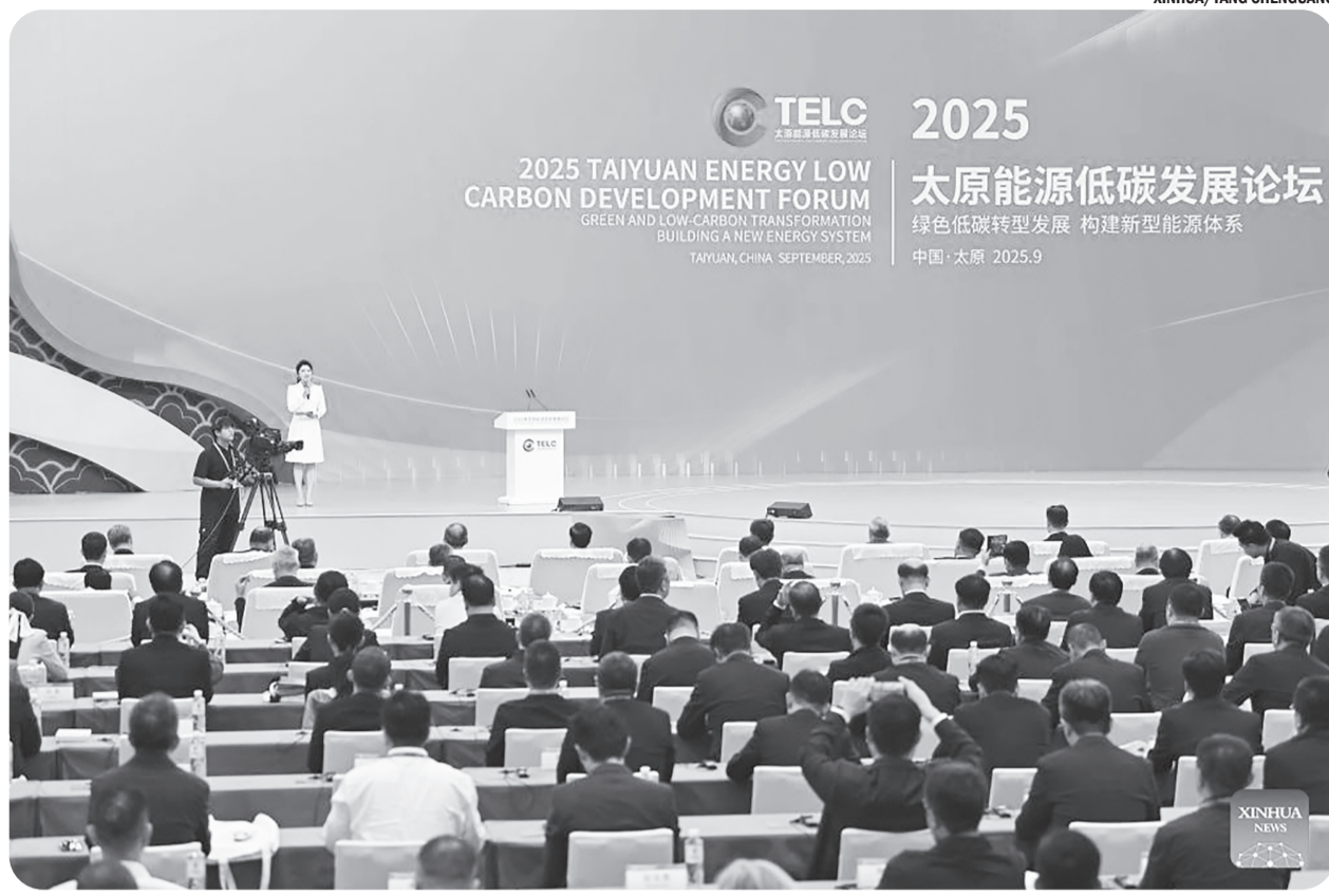
Foto yang diambil pada Sabtu (27/9/2025) ini menunjukkan upacara pembukaan Forum Pengembangan Energi Rendah Karbon Taiyuan 2025 di Taiyuan, Provinsi Shanxi, Tiongkok.