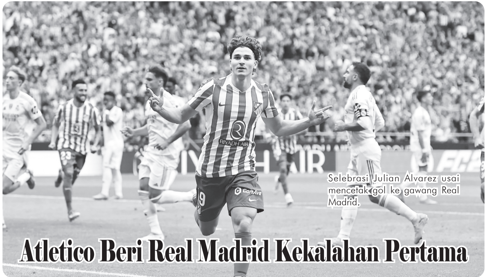
Selebrasi Julian Alvarez usai mencetak gol ke gawang Real Madrid.