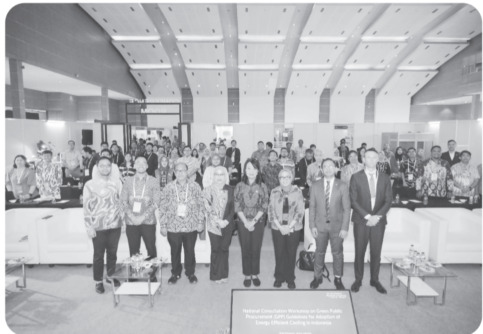
Peserta pada Lokakarya Konsultasi Nasional mengenai Pedoman Pengadaan Penermatan Hijau untuk Pendingin Hemat Energi.

JAKARTA (LB) - ACE (ASEAN Centre for Energy), GGGI (Global Green Growth Institute), dan HEAT International melalui Proyek ALCBT (Asia Low-Carbon Buildings Transition), bekerja sama dengan ASHRAE Indonesia Chapter, dengan bantuan dari IKI (International Climate Initiative), terus mempercepat transisi menuju bangunan rendah karbon di Asia Tenggara dan Indonesia melalui langkah-langkah efisiensi energi. Sektor bangunan di Indonesia saat ini menyumbang 33% emisi gas rumah kaca, dengan penggunaan pendingin sebagai salah satu penyumbang terbesar. Pada rangkaian dialog yang diselenggarakan dalam Refrigeration & HVAC Indonesia Expo 2025 di Jakarta International Expo pada 24-26 September, Kementerian Pekerjaan Umum menyampaikan komitmen pemerintah untuk mencapai target kinerja efisiensi sumber daya pada bangunan yang dikelola oleh pemerintah maupun sektor swasta. "Sektor bangunan merupakan salah satu kontributor terbesar emisi di Indonesia. Hal ini menjadi perhatian serius bagi Pemerintah dalam mendorong berbagai pemangku kepentingan untuk mendukung upaya penguran-