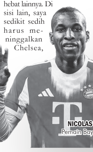
NICOLAS JACKSON Pemain Bayern Munich.

Jackson membela Chelsea sejak 2023. Ia punya catatan 30 gol dan 12 assist, membantu memenangkan trofi Conference League dan Piala Dunia Antarklub 2025. ● vit