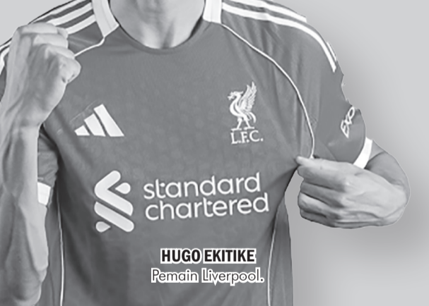
HUGO EKITIKE Pemain Liverpool.

"Menyenangkan. Ketika Anda main untuk tim terbaik, Anda akan bersaing dengan pemain-pemain terbaik. Isak adalah pemain yang juga sudah saya pantau, jadi melihatnya gabung adalah sebuah kesenangan. Kompetisinya akan berat, tapi saya akan fokus main bagus agar jadi masalah untuk manajer," ujar Ekitike. ● vit