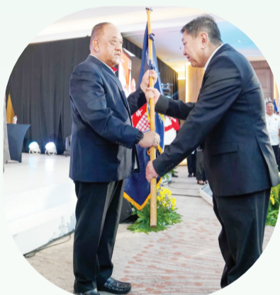
Penyerahan Pataka PB PEXI kepada KONI Pusat.