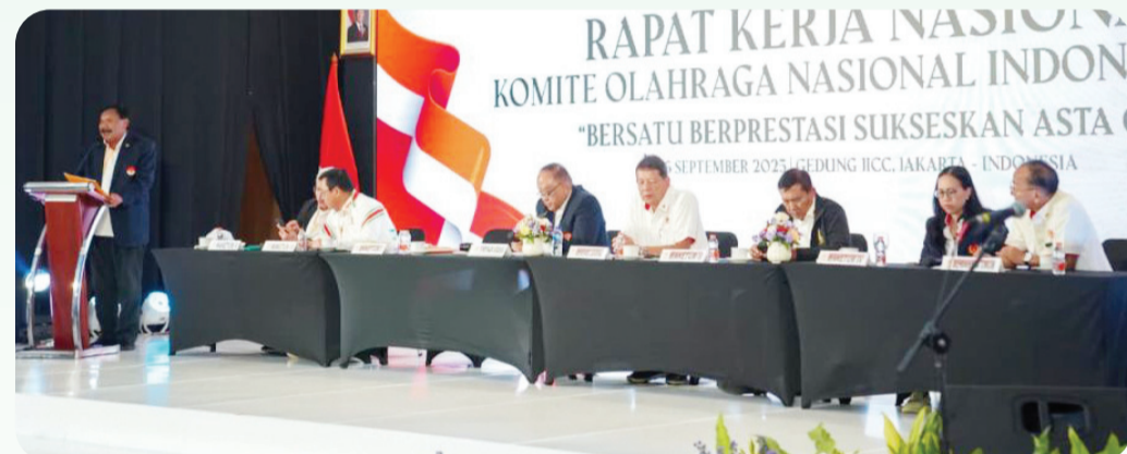
Rakernas KONI tahun 2025.