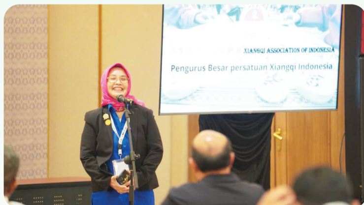
Pemameran tentang Xiangqi oleh sekretariat PB PEXI.