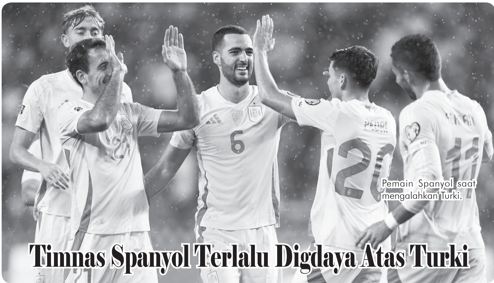
Pemain Spanyol saat mengalahkan Turki.