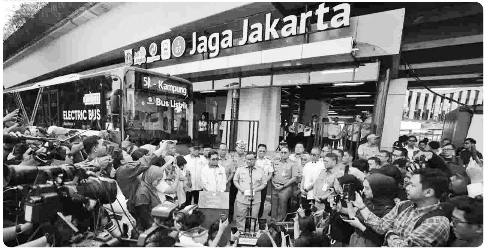
PERESMIAN HALTE TRANSJAKARTA JAGA JAKARTA

Gubernur DKI Jakarta Pramono Anung memberikan keterangan pers usai meresmikan Halte Transjakarta Jaga Jakarta yang sebelumnya dikenal dengan nama Halte Senen Sentral, di kawasan Senen, Jakarta Pusat, Senin (8/9). Gubernur Pramono menjelaskan perubahan nama halte tersebut menjadi pengingat bersama agar peristiwa kerusakan di masa lalu tidak terulang kembali.