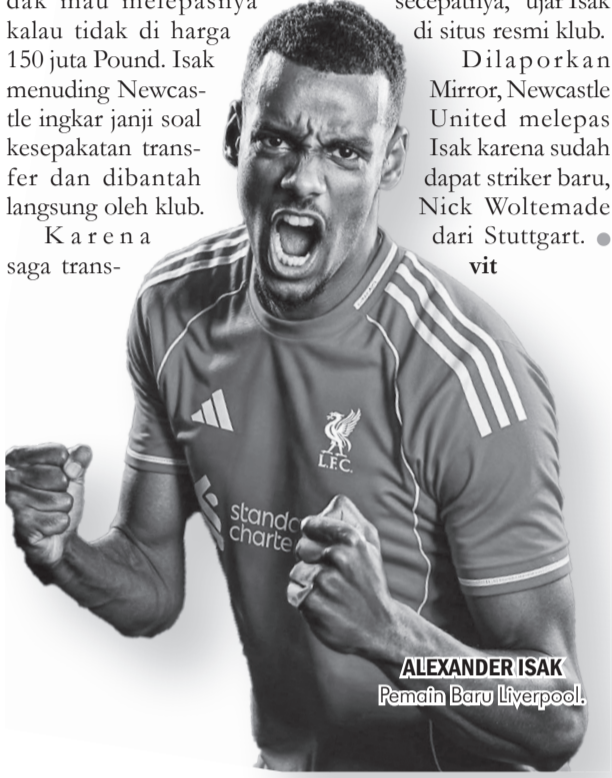
ALEXANDER ISAK Pemain Baru Liverpool.

Dilaporkan Mirror, Newcastle United melepas Isak karena sudah dapat striker baru, Nick Woltemade dari Stuttgart. ● vit