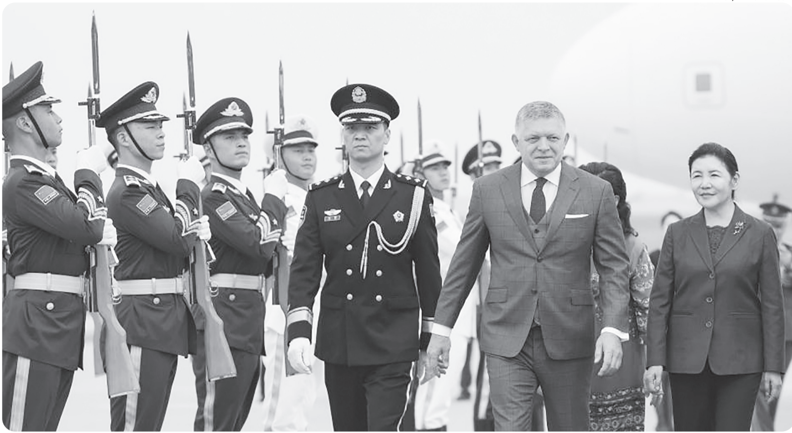
KEDATANGAN PM SLOVAKIA DI BEIJING

Perdana Menteri Slovakia Robert Fico tiba di Beijing, Tiongkok, Selasa (2/9/2025), untuk menghadiri peringatan 80 tahun kemenangan Perang Perlawanan Rakyat Tiongkok melawan Agresi Jepang dan Perang Anti-Fasis Dunia.