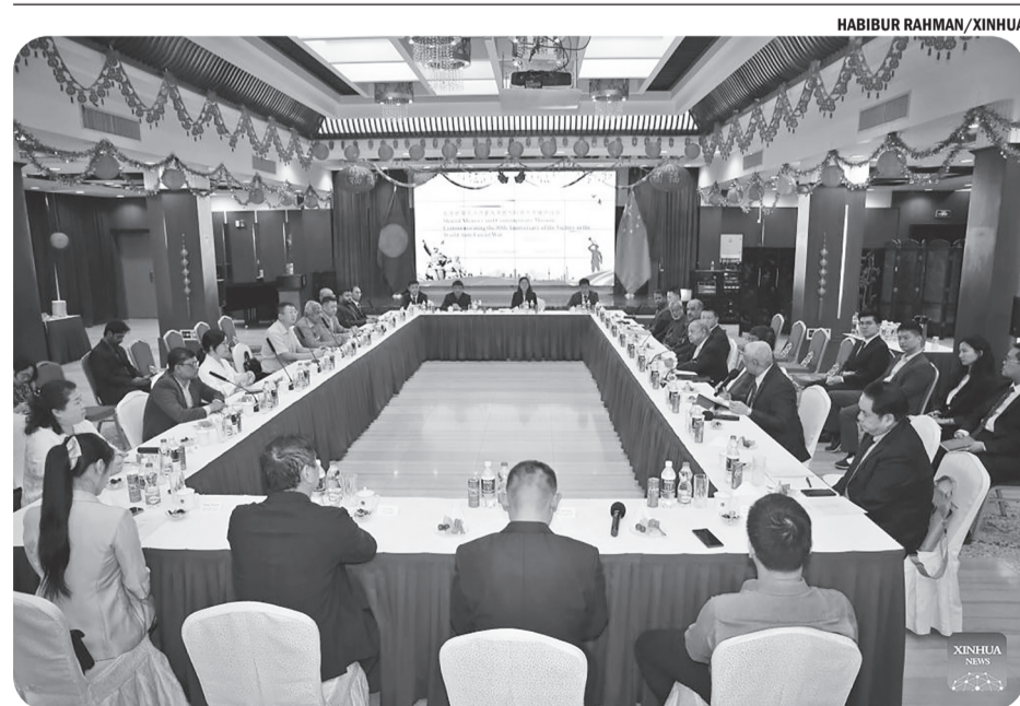
SEMINAR PERINGATAN 80 TAHUN KEMENANGAN PERANG ANTI-FASIS DUNIA

Menurut Xi Jinping, output ekonomi SCO telah mencapai USD30 triliun. Dia menambahkan bahwa pengaruh global SCO juga meluas dan para anggota bekerja sama untuk mengatasi tantangan termasuk keamanan, isu lingkungan, dan inovasi. ● tom