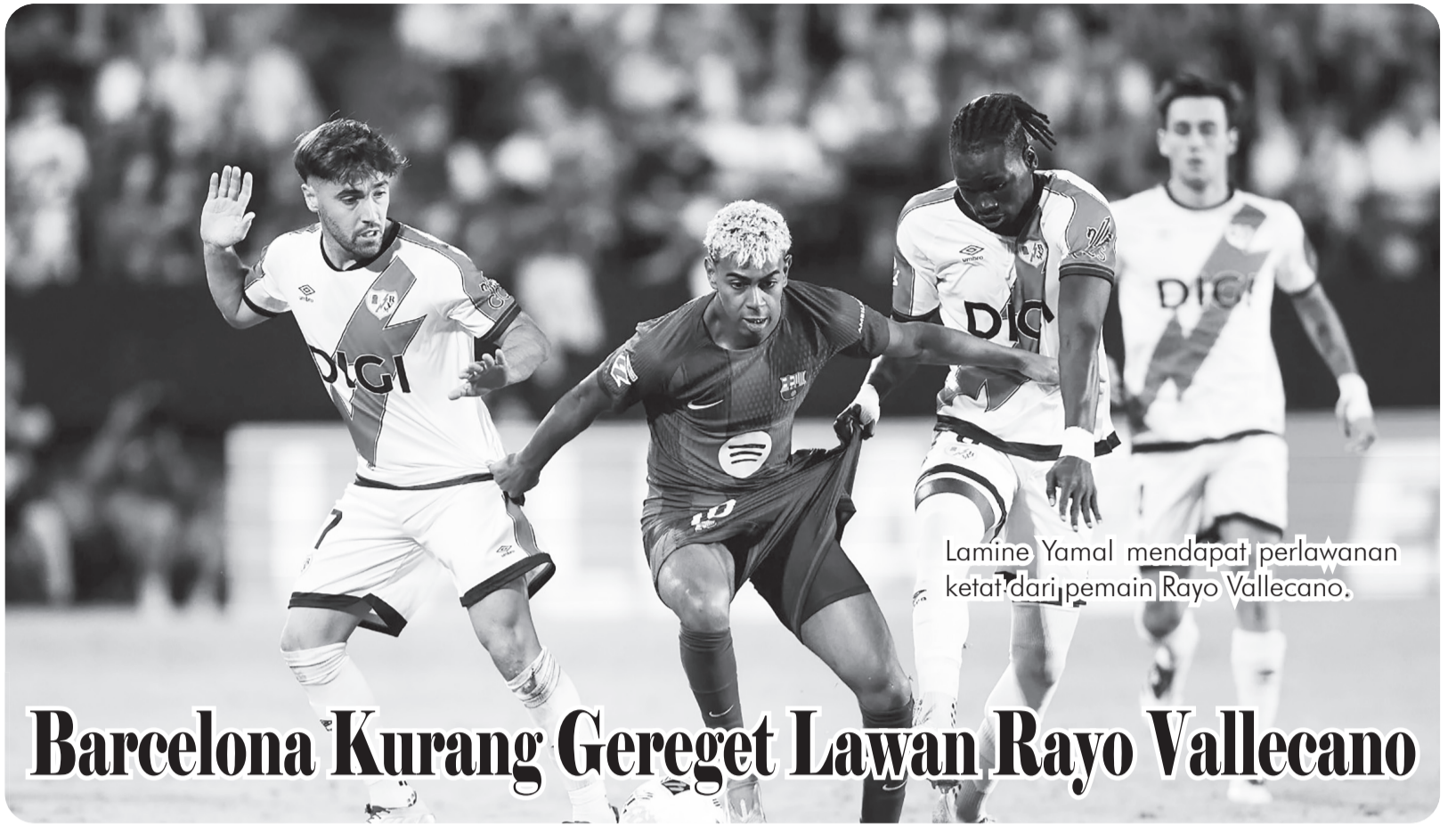
Lamine Yamal mendapat perlawanan ketat dari pemain Rayo Vallecano.