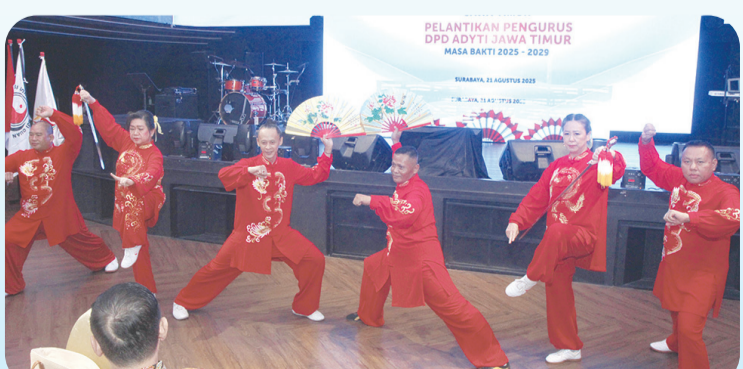
Penampilan taiji kipas dan pedang.