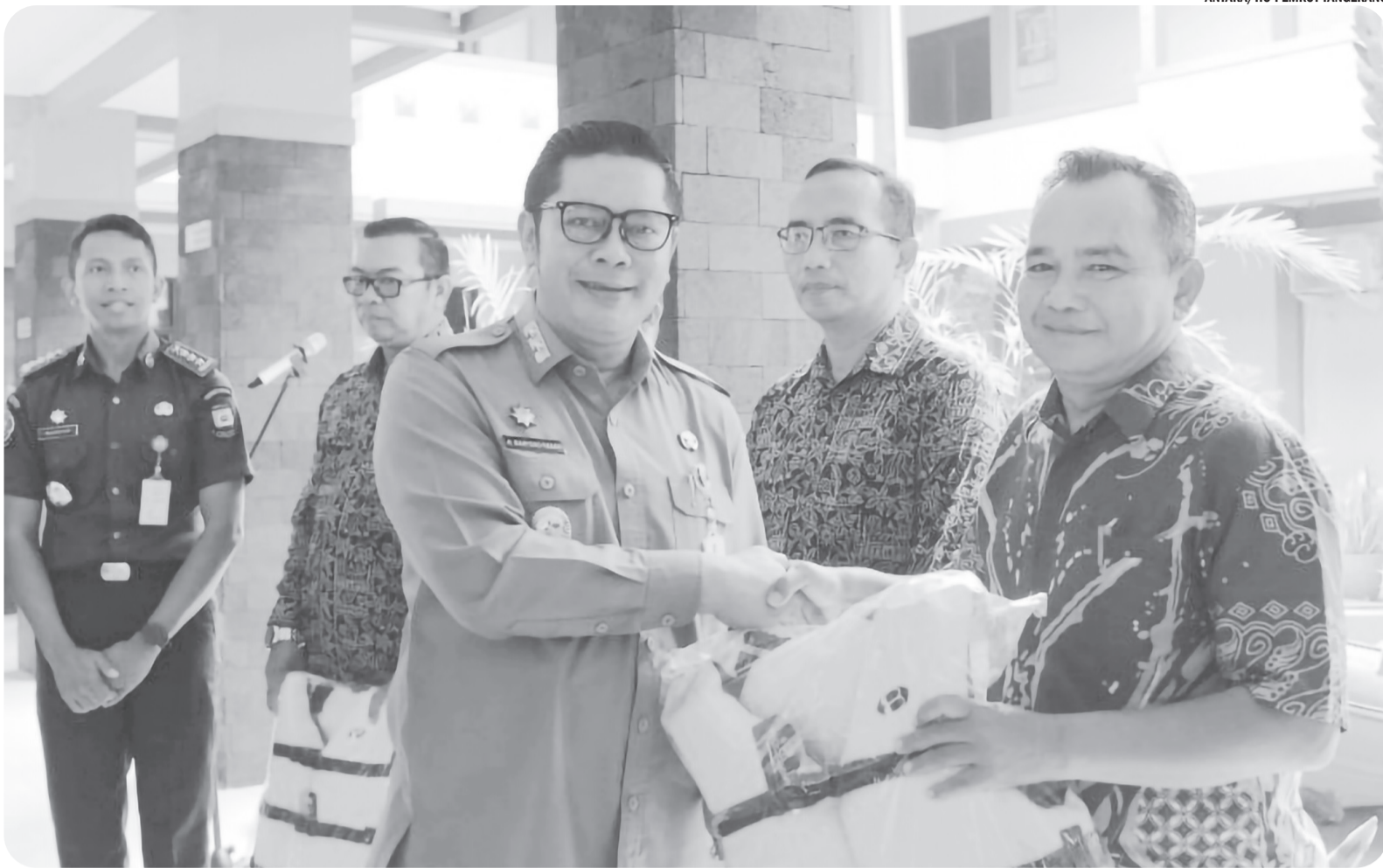
PENYERAHAN BANTUAN KEPADA WILAYAH RAWAN BENCANA