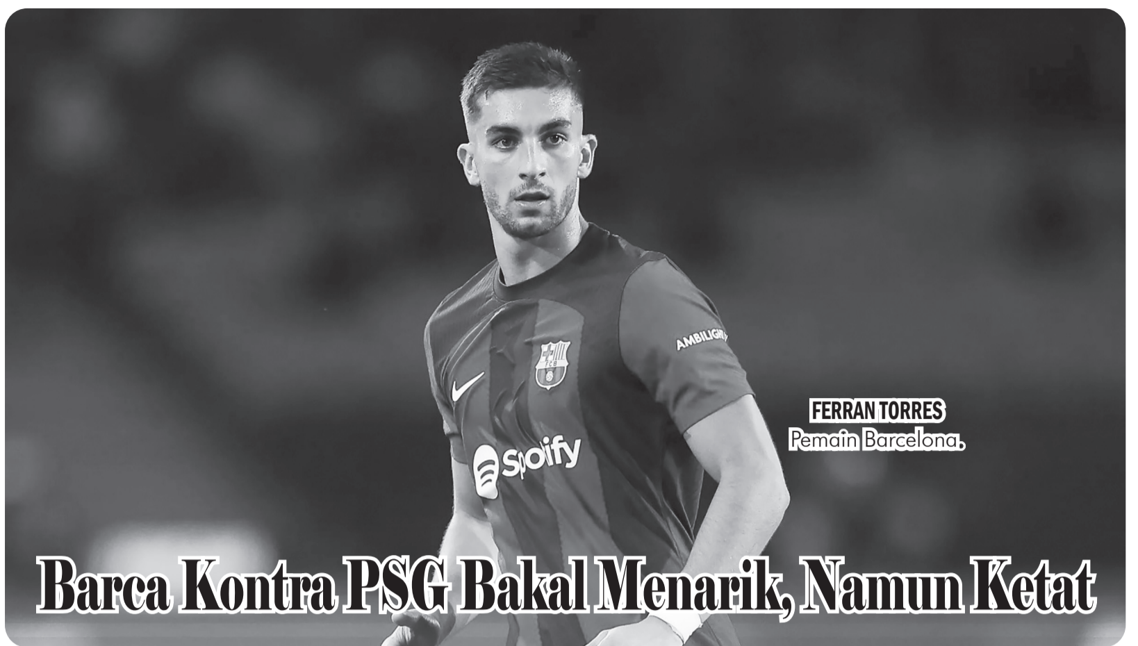
FERRAN TORRES Pemain Barcelona.