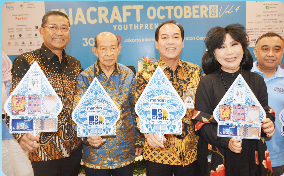
Peluncuran e-money Bank Mandiri Edisi Spesial INACRAFT 2025.

JAKARTA (LB) - The Jakarta International Handicraft Trade Fair (INACRAFT), pameran kerajinan terbesar dan terlengkap di Asia Tenggara kembali hadir di tahun ini dengan sister event-nya yang bertajuk INACRAFT October 2025 Vol.4 Youthpreneurs. Acara yang diprakarsai oleh ASEPHI (Asosiasi Eksportir dan Produsen Handicraft Indonesia) bersama Mediatama Event ini disajikan selama 5 hari, 1-5 Oktober 2025 di JICC (Jakarta International Convention Center) Senayan, Jakarta, dengan menggunakan seluruh hall (24.941m 2 ). “Mengusung tema “Craft, Culture, and Future”, INACRAFT October 2025 menjadi wadah perpaduan antara kekayaan budaya dengan semangat berinovasi. Me-