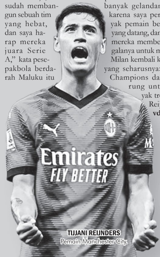
TIJJANI REIJNDERS Pemain Manchester City.

Milan menutup ruang yang ditinggalkan Reijnders dengan membawa masuk Ardon Jashari, Samuele Ricci, Rabiot, dan mantan pemenang Ballon d'Or Luka Modric. "Saya tidak tahu apakah mereka membeli banyak gelandang cuma karena saya pergi? Banyak pemain berkualitas yang datang, dan kuharap mereka memberikan segalanya untuk membawa Milan kembali ke tempat yang seharusnya: di Liga Champions dan bertarung untuk banyak trofi," kata Reijnders. ● vdp