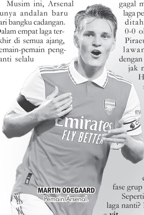
MARTIN ODEGAARD Pemain Arsenal.

Seperti apa jalannya laga nanti? Patut diikuti. ● vit