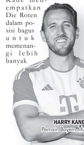
HARRY KANE Pemain Bayern Munich.

Patut ditunggu seperti apa komentar Kane seputar isu yang berkembang. ● vdp