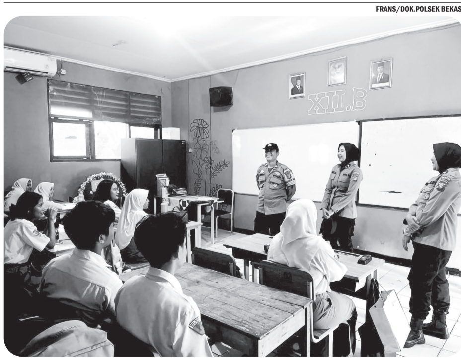
POLSEK BEKASI SELATAN BERI EDUKASI HUKUM KE PELAJAR SMA Jajaran Polsek Bekasi Selatan melaksanakan sosialisasi dan edukasi hukum kepada para pelajar SMAN 8 Kota Bekasi, Bekasi Selatan, Senin (29/9/2025). Polsek Bekasi Selatan terus mengedepankan upaya preventif dalam menjaga generasi muda dari pengaruh negatif kenakalan remaja.