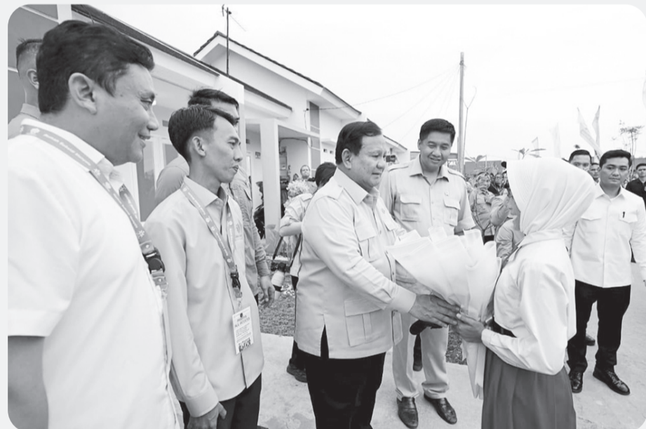
Presiden RI, Prabowo Subianto, secara simbolis menyaksikan akad kredit KPR sebanyak 26 ribu orang di Cileungsi, Kabupaten Bogor.

Presiden Republik Indonesia, Prabowo Subianto menyoroti bahwa realisasi 26.000 unit KPR ini telah melampaui target awal 25.000 unit yang dijanjikan. Fenomena ini, menurutnya,