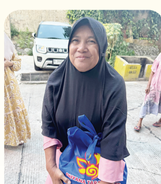
Warga penerima paket sembako mengucapkan terima kasih kepada YEMI.