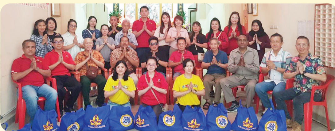
Foto Bersama sebelum pelaksanaan baksos.