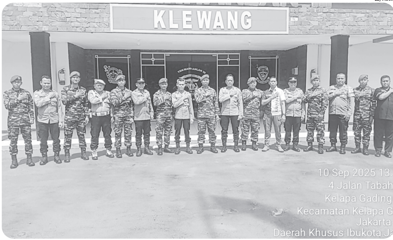
10 Sep 2025 13:04 4 Jalan Tabah Kelapa Gading Kecamatan Kelapa Gading Jakarta Daerah Khusus Ibukota Ja