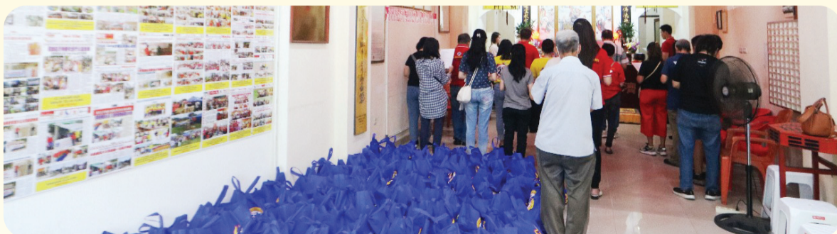
Doa bersama sebelum pelaksanaan baksos.