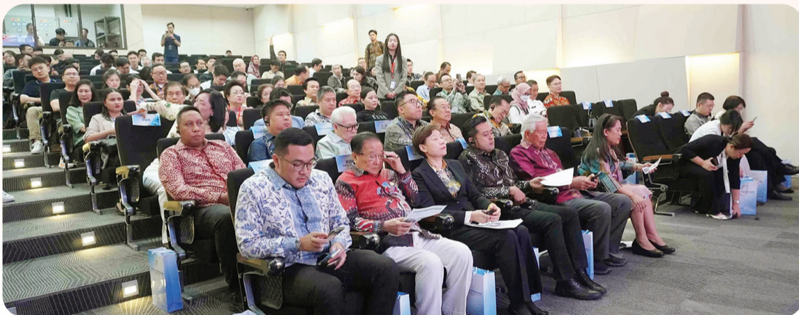
Para peserta dan panitia serta undangan.