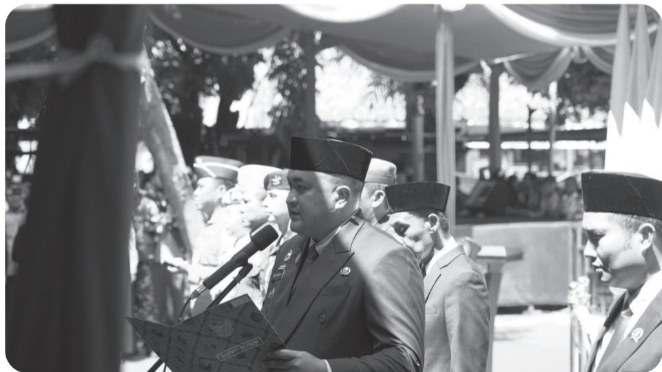
Bupati Bogor saat melantik tiga pejabat tinggi pratama yang digelar di Alun-alun Kecamatan Jonggol, Kabupaten Bogor, Rabu (10/9).

CIBINONG (LB) - Bupati Bogor, Rudy Susmanto melantik tiga Pejabat Pimpinan Tinggi Pratama di lingkungan Pemerintah Kabupaten Bogor dengan cara berbeda, yakni digelar di Alun-alun Kecamatan Jonggol, Rabu (10/9).