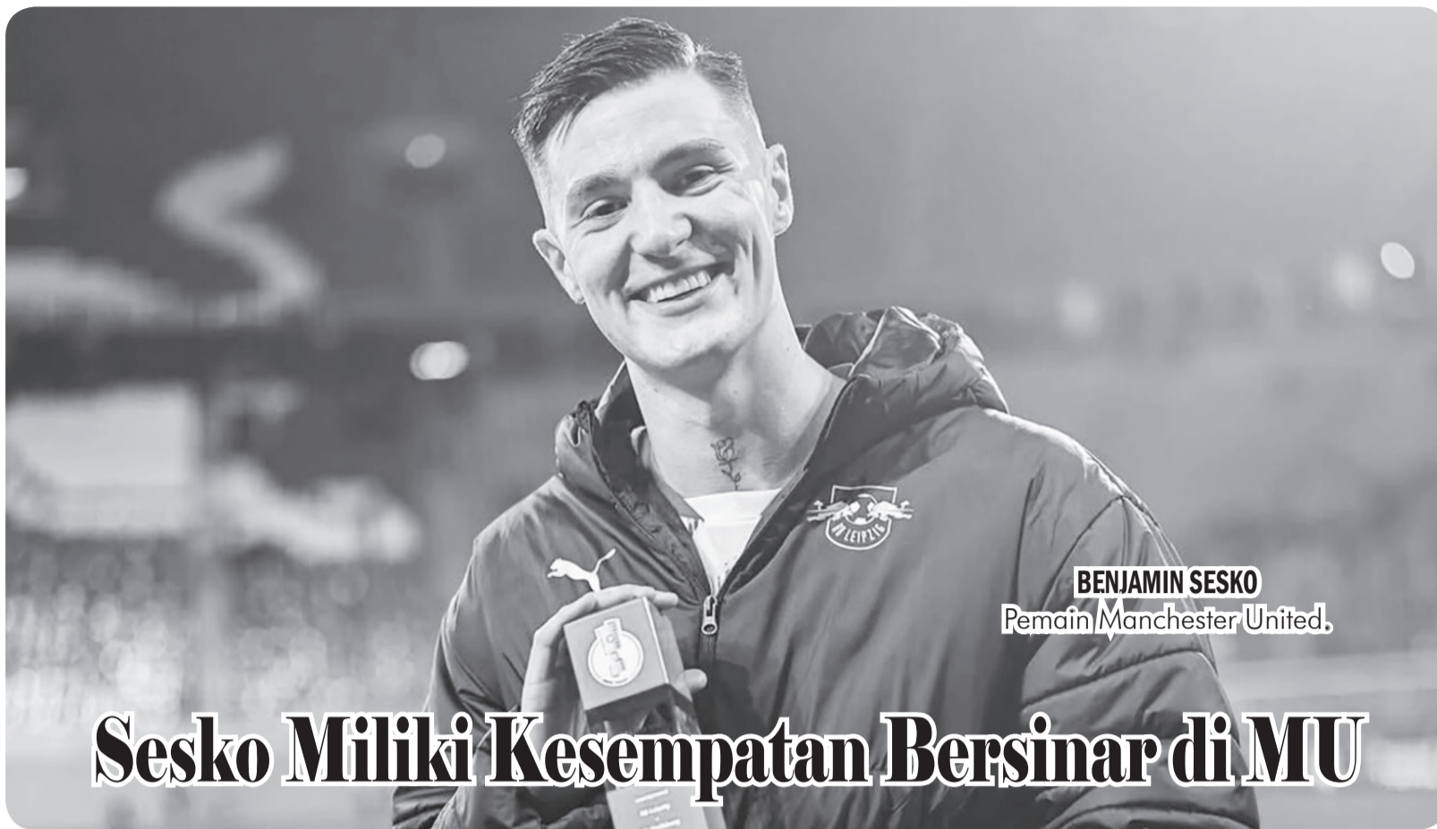
BENJAMIN SESKO Pemain Manchester United.