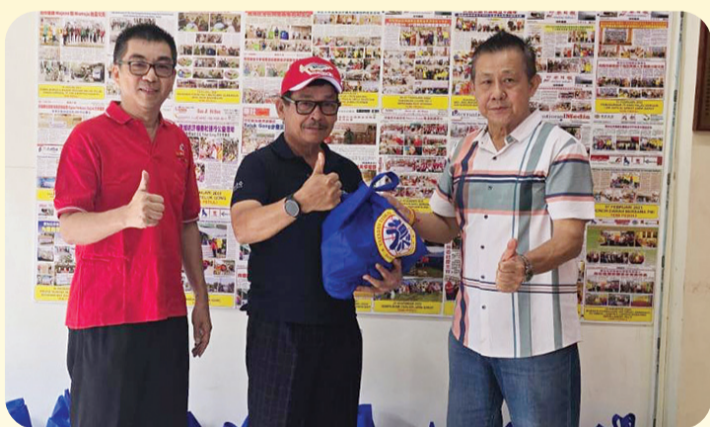
Marsekal Pertama TNI (Purn.) Dwi Badarmanto turut berpartisipasi membantu memberikan paket sembako.