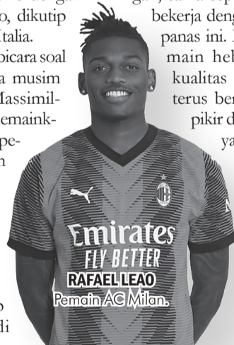
RAFAEL LEAO Pemain AC Milan.