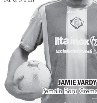
JAMIE VARDY Pemain Baru Cremonese.

"Sepanjang karier saya, orang-orang selalu meragukan saya, tetapi saya selalu berhasil membuktikan mereka salah. Saya telah melihat semangat pelatih. Musim