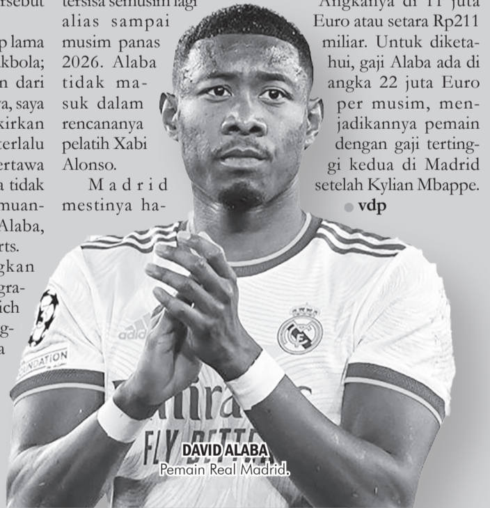
DAVID ALABA Pemain Real Madrid.