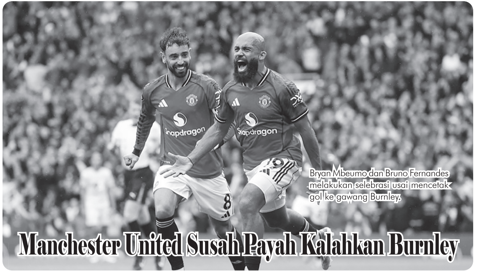
Bryan Mbeumo dan Bruno Fernandes melakukan selebrasi usai mencetak gol ke gawang Burnley.