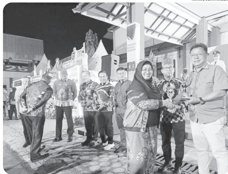
SAMPIT TRADE EXPO

Selain distribusi, Bulog juga membuka layanan aduan publik Bella Bulog di 0811 1967 016 untuk memastikan pengawasan dan transparansi. • hen