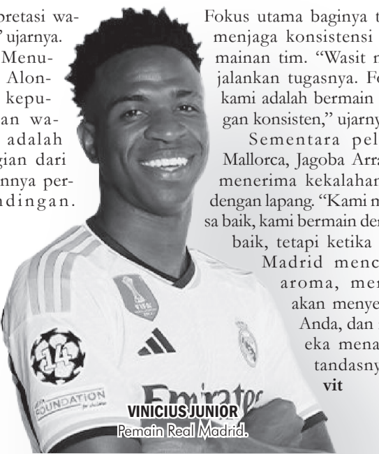
VINICIUS JUNIOR Pemain Real Madrid.

aroma, mereka akan menyerang Anda, dan mereka menang," tandasnya. ● vit