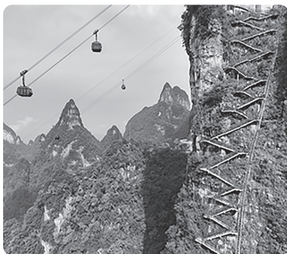
PANJAT TEBING PUNCAK TIAMMEN 2025

Pekan lalu, Israel mengatakan telah menyerang sasaran-sasaran Houthi di Sanaa, sebagai tanggapan atas serangan rudal gerakan tersebut yang menurut Israel membawa amunisi tandingan. ● tom