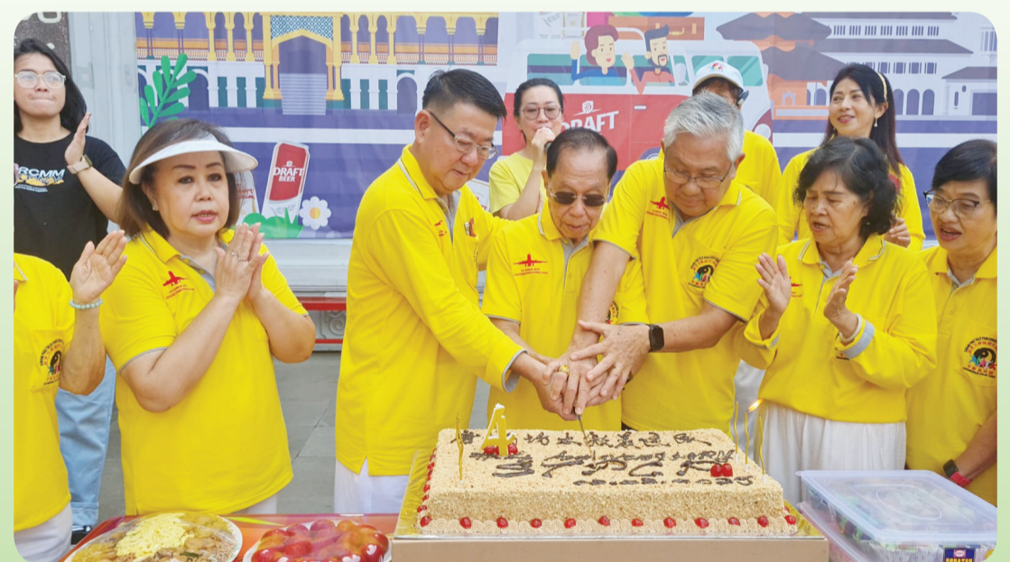
Pemotongan kue HUT ke-4 oleh pengurus.

Selepas kata sambutan, acara diisi dengan prosesi potong kue ulang tahun oleh para pengurus, dilanjutkan dengan pelepasan balon ke udara. Hal ini menandai kelompok senam ini terus bertumbuh dengan jumlah anggota yang terus meningkat dari tahun ke tahun.