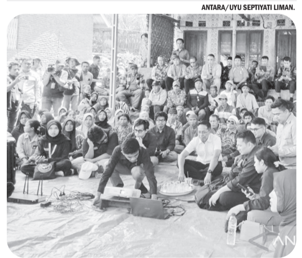
DIALOG WARGA SELAPARANG DENGAN KEMENTRANS

Program budidaya ikan laut ini tidak hanya berorientasi pada ekonomi, tetapi juga mencerminkan komitmen berkelanjutan. Dengan memberdayakan nelayan, MIND ID memastikan bahwa kehadiran industri tambang memberikan manfaat jangka panjang bagi masyarakat pesisir yang selama ini rentan secara ekonomi. • dot