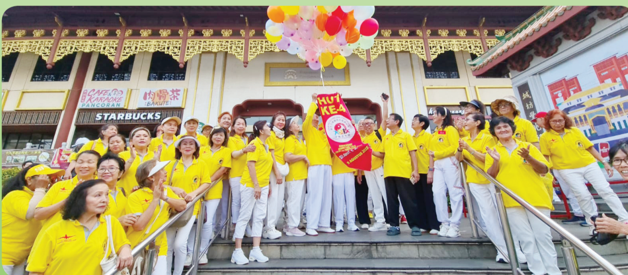
Pelepasan balon ke udara.

Jakarta tapi di 2 tempat, dilanjutkan dengan Refreshing pada tgl. 14-15-16 Agustus'25 di Puncak. ● sibie