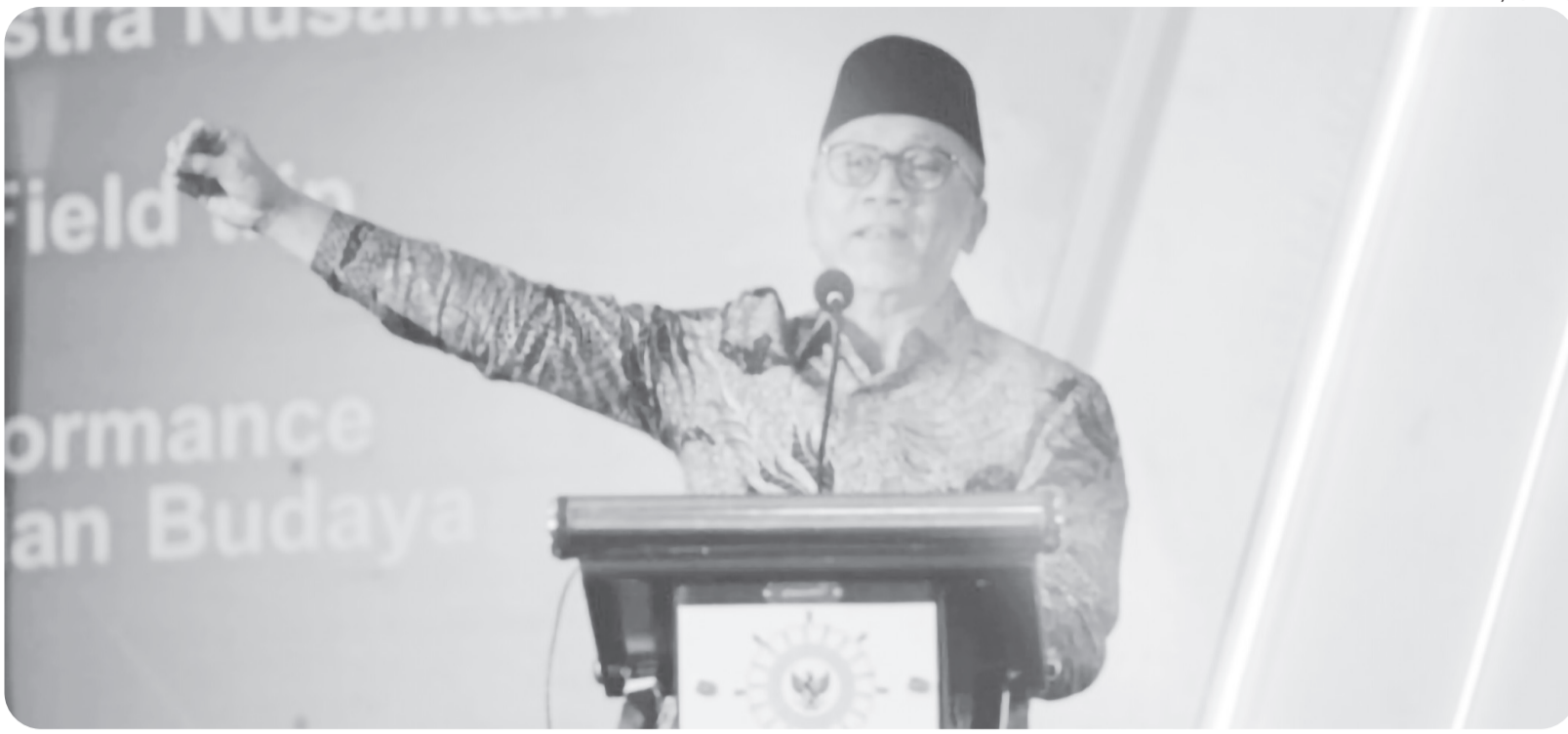
PENUTUPAN APKASI OTONOMI EXPO

Menko Pangan (Menteri Koordinator Bidang Pangan) Zulkifli Hasan saat penutupan pameran AOE (Apkasi Otonomi Expo) 2025 di ICE BSD, Kabupaten Tangerang, Banten, Sabtu (30/8/2025). Menko Zulkifli Hasan tekankan pentingnya pemberdayaan ekonomi desa.