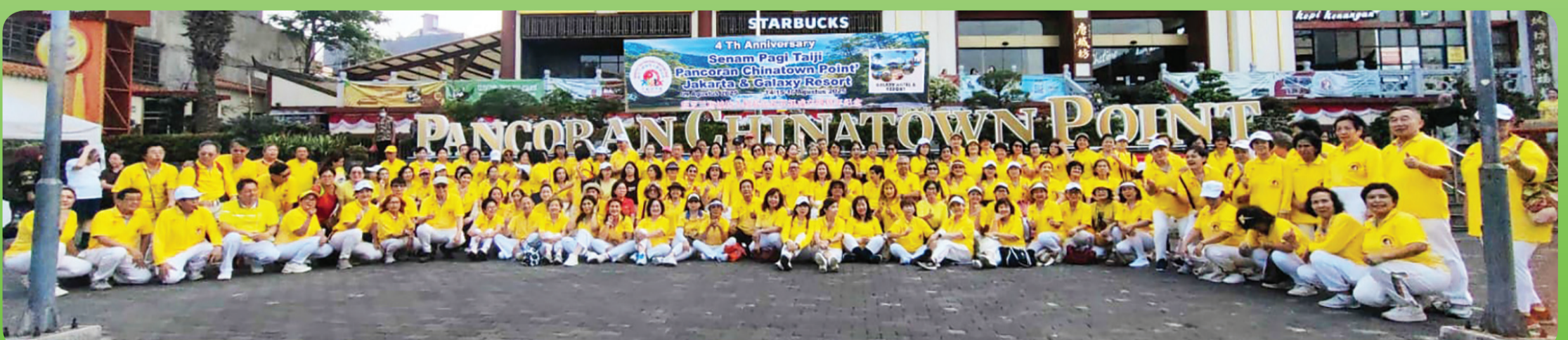
Foto bersama dengan pesenam China Town Pancoran.