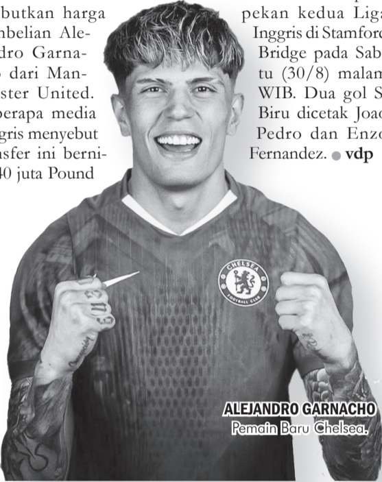
ALEJANDRO GARNACHO Pemain Baru Chelsea.

Inggris di Stamford Bridge pada Sabtu (30/8) malam WIB. Dua gol Si Biru dicetak Joao Pedro dan Enzo Fernandez. ● vdp