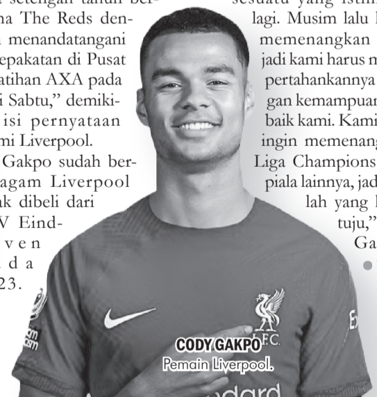
CODY GAKPO Pemain Liverpool.

memenangkan liga, jadi kami harus mempertahankannya dengan kemampuan terbaik kami. Kami juga ingin memenangkan Liga Champions dan piala lainnya, jadi itulah yang kami tuju," kata Gakpo. ● vdp