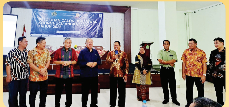
Ketua SETIAKIN menyapa peserta DAK Angkatan V.

BABEL (LB) - Diklat Agama Khonghucu Angkatan V yang diinisiasi oleh Pusat Bimbingan & Pendidikan Khonghucu bekerjasama dengan MATAKIN (Majelis Tinggi Agama Khonghucu Indonesia) resmi diselenggarakan di Provinsi Kepulauan Bangka Belitung, 22 – 24 Agustus 2025.