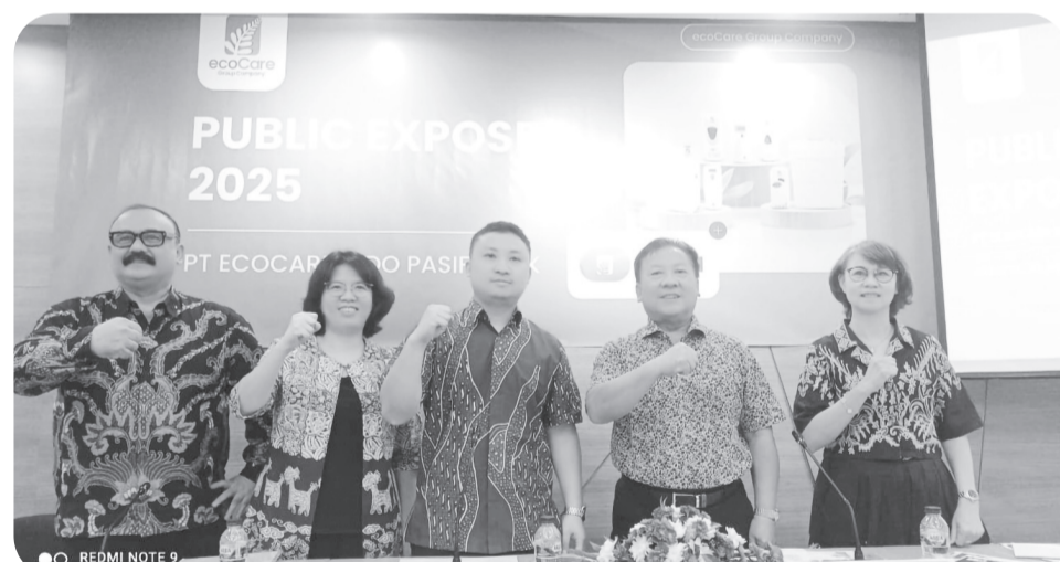
Komisaris Utama dan Direksi PT Ecocare Indo Pasifik Tbk.

"Perseroan akan terus melakukan ekspansi pasar, memperluas development produk, menjalankan program management trainee, meningkatkan training on-