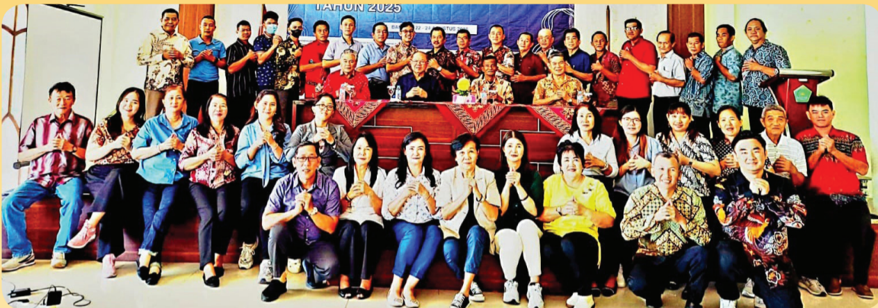
Foto bersama seluruh peserta dan narasumber.