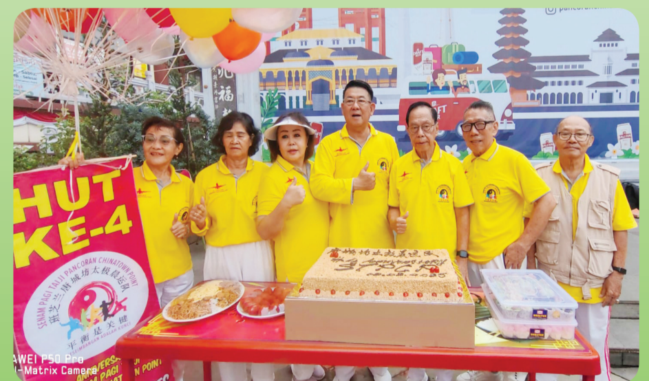
Pengurus berfoto bersama.