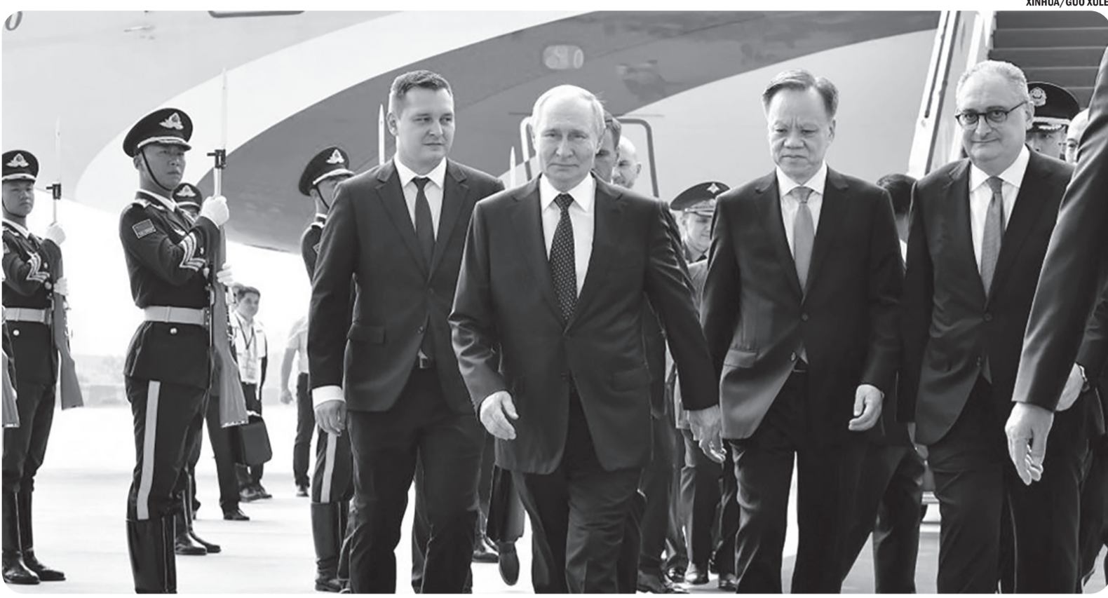
PUTIN HADIRI KTT ORGANISASI KERJA SAMA SHANGHAI

Presiden Rusia Vladimir Putin tiba di KTT Organisasi Kerja Sama Shanghai (SCO) 2025 di Tianjin, Tiongkok, Minggu (31/8/2025).