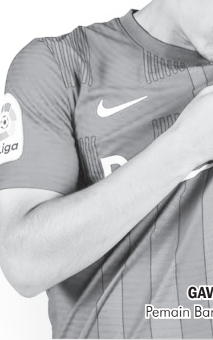
GAVI Pemain Barcelona

“ Saya harap dia akan menang (Ballon d’Or). Jika dia tidak menang di tahun ini, dia kan ma-