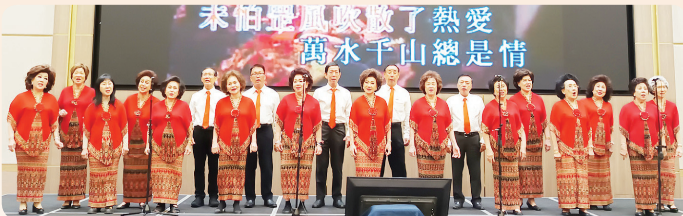
Paduan Suara Guangzhao Jakarta di acara gala dinner.