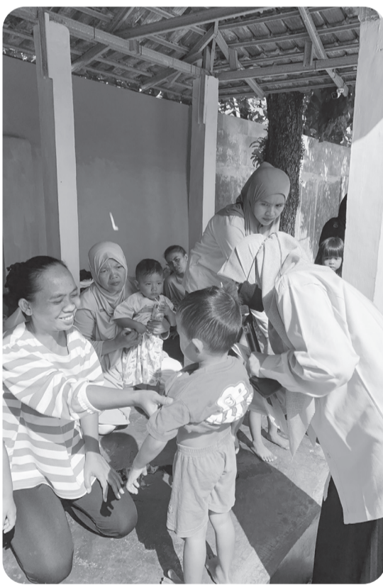
Update harga pasar, Disdagin Kabupaten Bogor berinovasi lewat DIRGA.

CIBINONG (LB) - Dinas Perdagangan dan Perindustrian (Disdagin) Kabupaten Bogor meluncurkan inovasi digital bertajuk DIRGA (Data Informasi Harga).