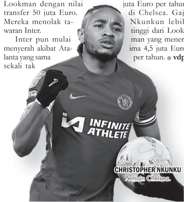
CHRISTOPHER NKUNKU Pemain Chelsea

Inter bisa meminjam Nkunku dari Chelsea dengan opsi permanen. Namun gaji Nkunku yang tinggi membuat Inter. Nkunku mendapatkan 6,5 juta Euro per tahun di Chelsea. Gaji Nkunku lebih tinggi dari Lookman yang menerima 4,5 juta Euro per tahun. ● vdp