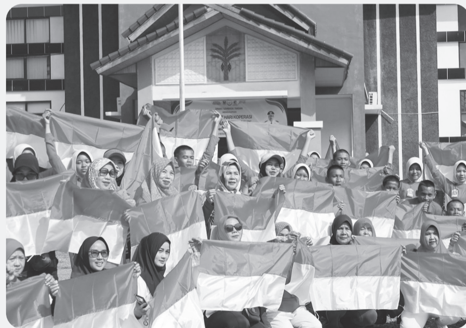
Bupati Bogor membagikan bendera ke seluruh kecamatan untuk menyemarakkan peringatan Hari Ulang Tahun ke-80 Kemerdekaan Republik Indonesia.

Di wilayah barat, seperti Kecamatan Leuwiliang, antusiasme masyarakat sangat tinggi. Ratusan bendera dibagikan kepada pengemudi angkutan umum, pelaku usaha kecil, dan warga yang melintas di pasar tradisional dan simpul-simpul transportasi.