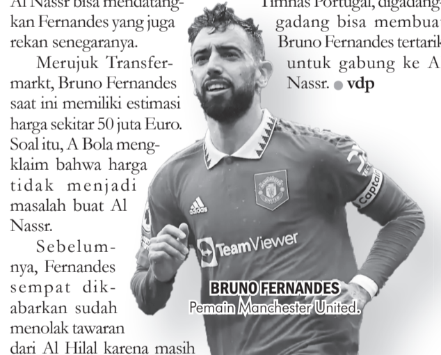
BRUNO FERNANDES Pemain Manchester United

Lekatnya nuansa Selecao das Quinas, julukan untuk Timnas Portugal, digadang-gadang bisa membuat Bruno Fernandes tertarik untuk gabung ke Al Nassr. ● vdp