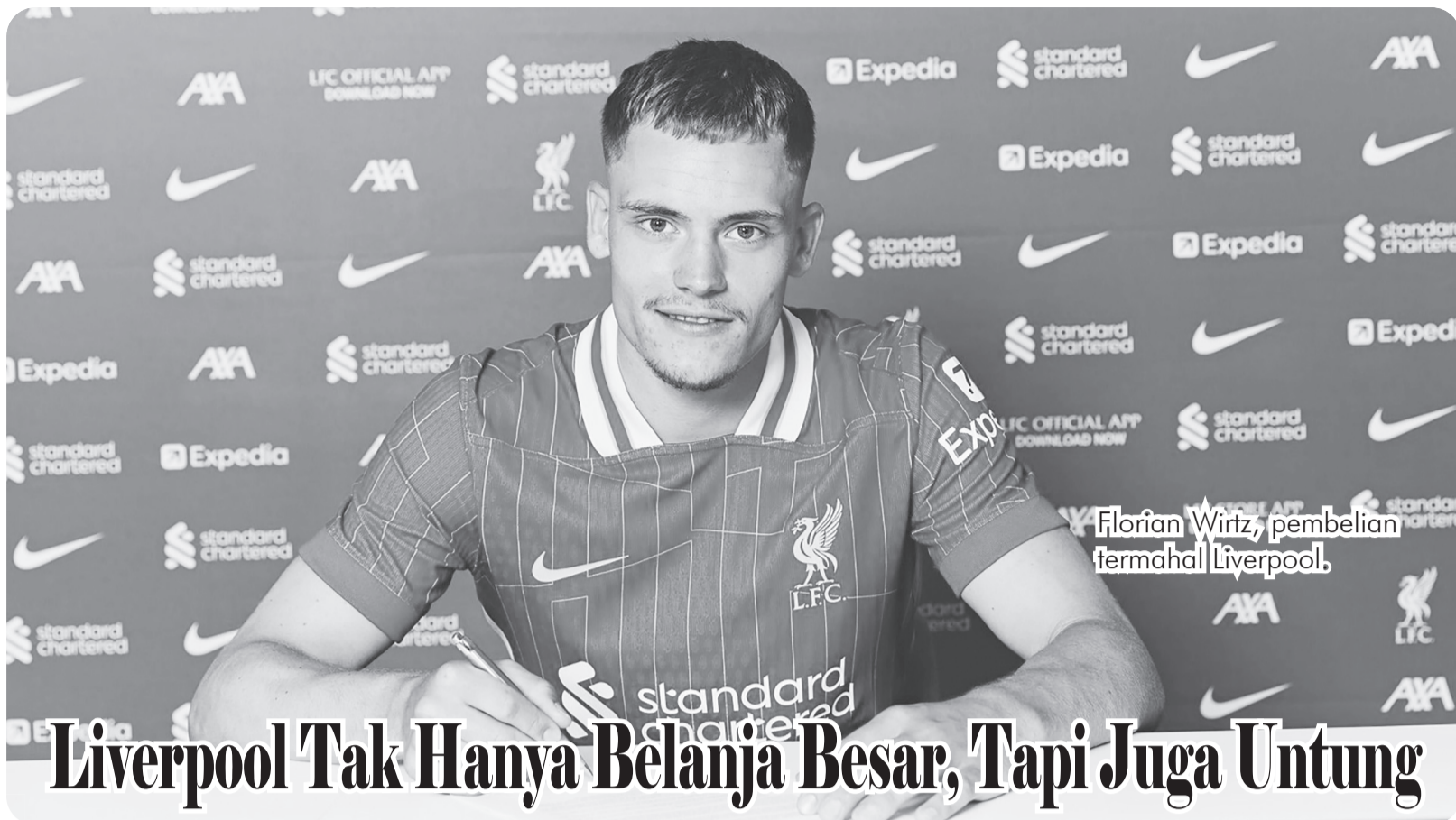
Florian Wirtz, pembelian termahal Liverpool.