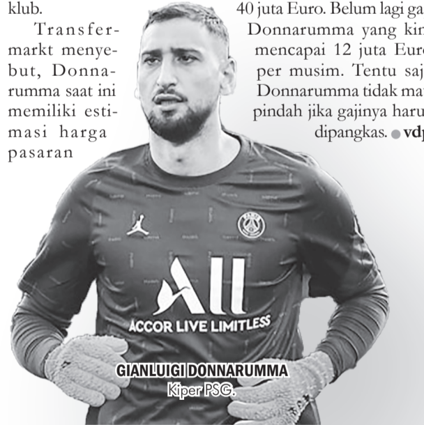
GIANLUIGI DONNARUMMA Kiper PSG

Namun untuk pindah ke MU, ada banyak hambatan yang membuat kepindahan Donnarumma sulit terwujud. Dikutip Daily Mail, MU setidaknya harus membayar mahal untuk menggaet Donnarumma yang dihargai 40 juta Euro. Belum lagi gaji Donnarumma yang kini mencapai 12 juta Euro per musim. Tentu saja Donnarumma tidak mau pindah jika gajinya harus dipangkas. ● vdp