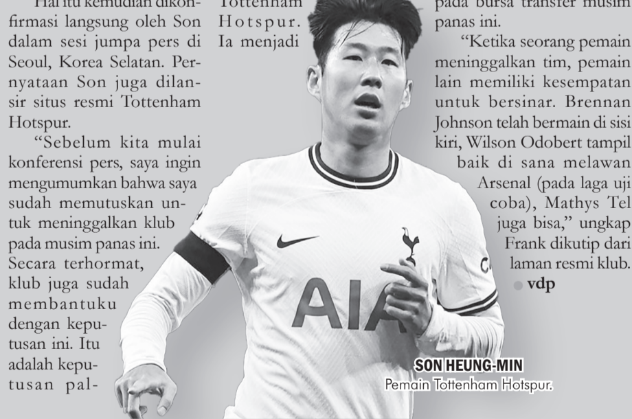
SON HEUNG-MIN Pemain Tottenham Hotspur

“Ketika seorang pemain meninggalkan tim, pemain lain memiliki kesempatan untuk bersinar. Brennan Johnson telah bermain di sisi kiri, Wilson Odobert tampil baik di sana melawan Arsenal (pada laga uji coba), Mathys Tel juga bisa,” ungkap Frank dikutip dari laman resmi klub. ● vdp