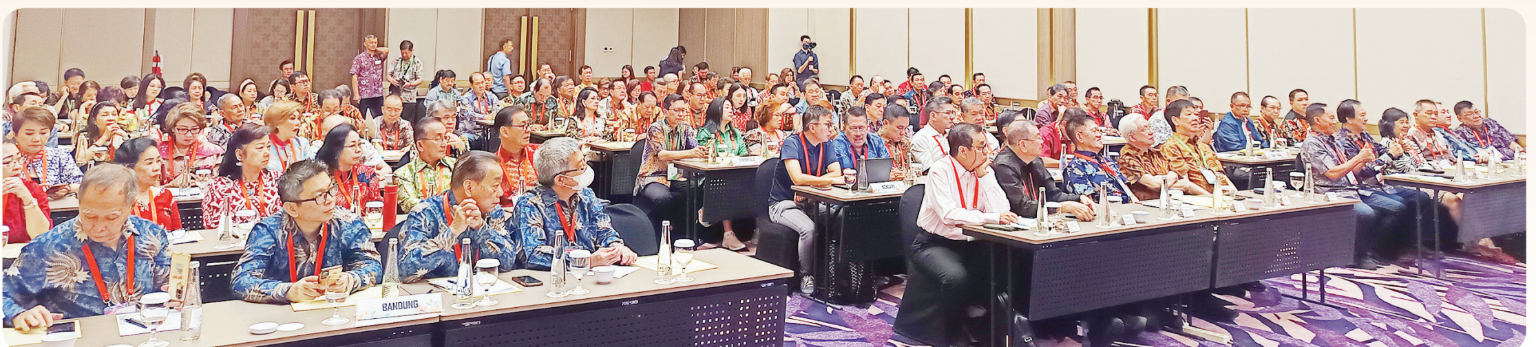
Suasana Rakernas Perhimpunan Warga Guangzhao Seluruh Indonesia (Perwaguzsi) di Hotel Grand Platinum Jl Kartini Raya, Sawah Besar Jakarta Pusat, Sabtu (2/8).