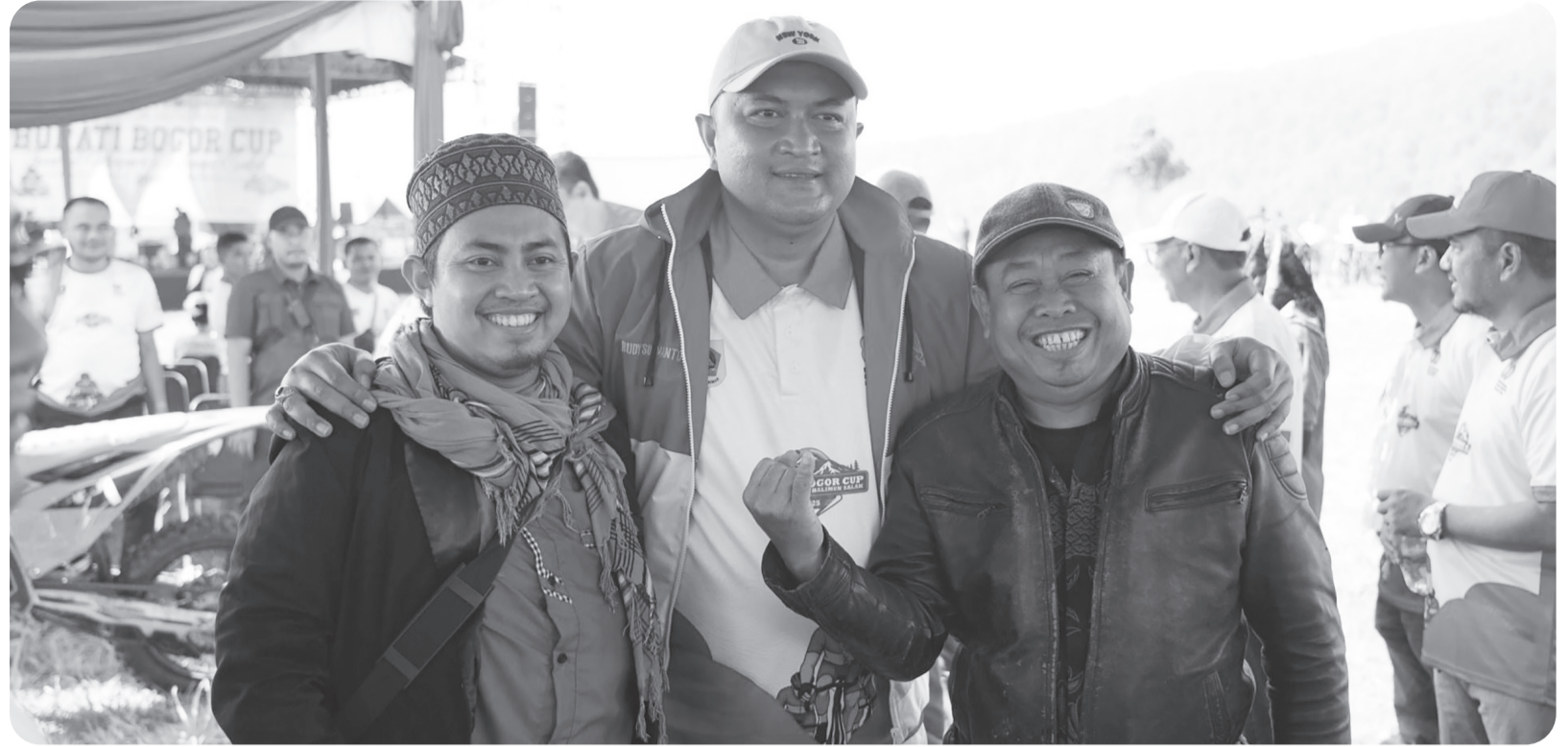
Bupati Bogor meyakini destinasi kawasan Taman Nasional Gunung Halimun Salak, akan dapat memajukan perekonomian, Desa Malasari, Kecamatan Nanggung.