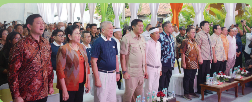
Para hadirin menyanyikan lagu kebangsaan Indonesia Raya.