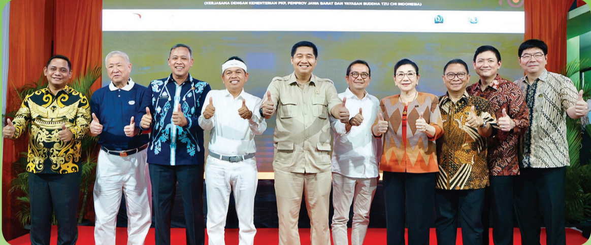
Foto bersama selepas peresmian.

BEKASI (LB) - PT Summarecon Agung Tbk (Summarecon) semakin memperkuat komitmen sosial perusahaan dengan meluncurkan program Bedah Fasilitas Umum (Renovasi Sekolah, Puskesmas dan Prasarana Lainnya) serta program Bedah (Renovasi) 500 Rumah bekerja sama dengan Kementerian PKP (Perumahan dan Kawasan Permukiman), Pemerintah Provinsi Jawa Barat, dan Yayasan Buddha Tzu Chi Indonesia.