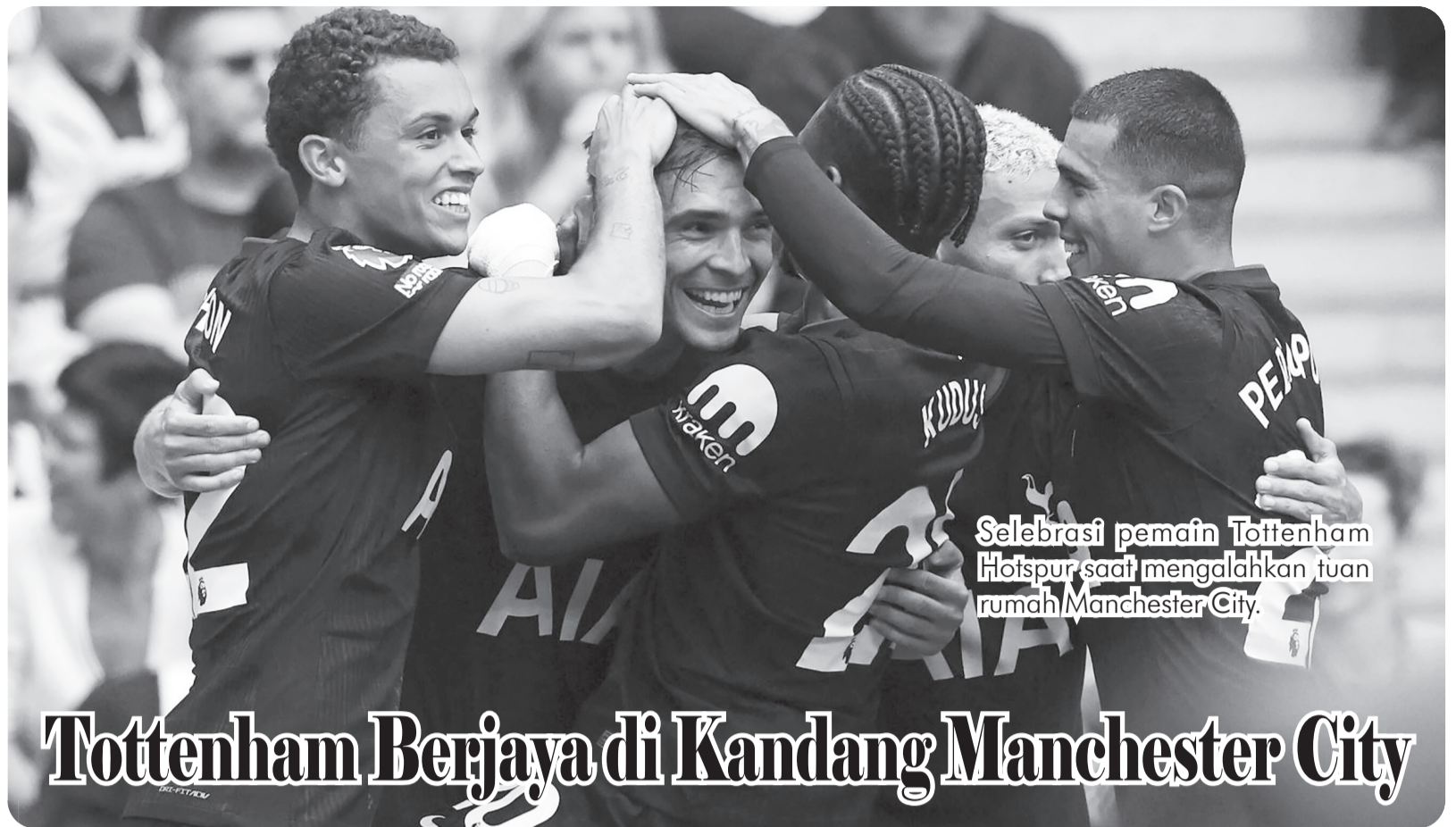
Selebrasi pemain Tottenham Hotspur saat mengalahkan tuan rumah Manchester City.