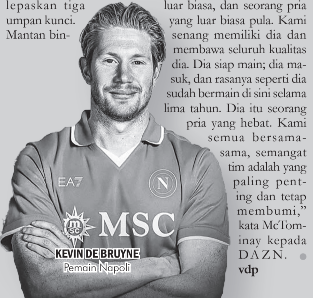
KEVIN DE BRUYNE Pemain Napoli.

De Bruyne menuntaskan pertandingan dengan membuat 67 sentuhan pada bola, dengan melepaskan tiga umpan kunci. Mantan bin-