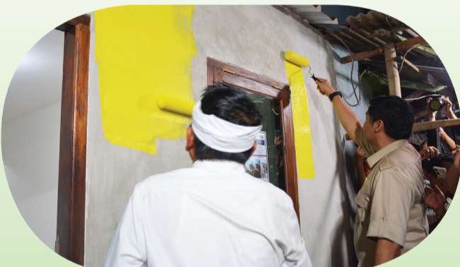
Menteri PKP Maruarar Sirait dan Gubernur Dedi Mulyadi secara simbolik mengecat rumah warga yang direnovasi.