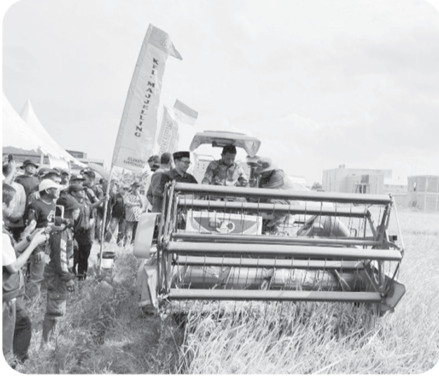
PANEN RAYA KABUPATEN SIDRAP

Panen raya di Kabupaten Sidrap, Sulawesi Selatan. Bulog apresiasi Panen Raya Sidrap catat serapan beras tertinggi.