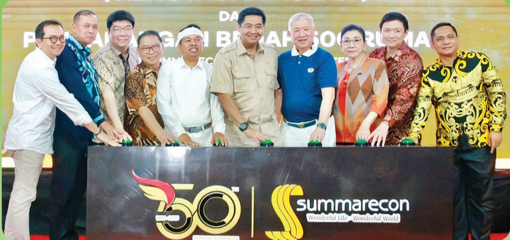
Prosesi penekanan tombol sirena tanda peresmian.