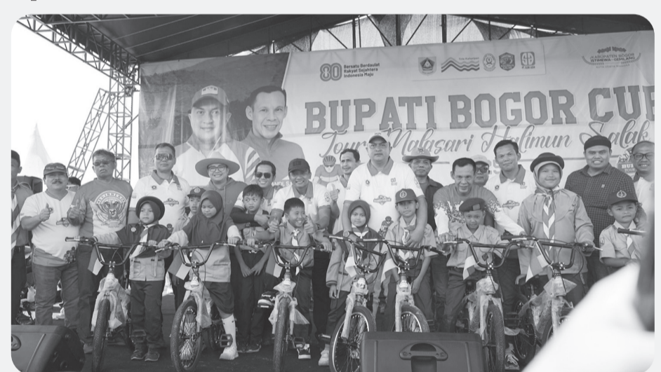
Bupati Bogor buka event Bupati Cup Tour Malasari Halimun Salak 2025 yang digelar di kawasan Taman Nasional Gunung Halimun Salak, Citalahab, Desa Malasari, Kecamatan Nanggung, Sabtu (23/8).

"Untuk memperkuat sektor ekonomi masyarakat, Pemkab Bogor juga menajaki kolaborasi dengan