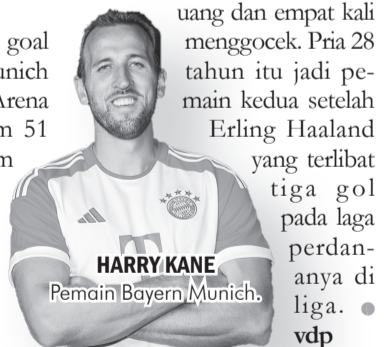
HARRY KANE Pemain Bayern Munich.

Di laga debut Bundesliga, Diaz membuat empat peluang dan empat kali menggocek. Pria 28 tahun itu jadi pemain kedua setelah Erling Haaland yang terlibat tiga gol pada laga perdananya di liga. • vit