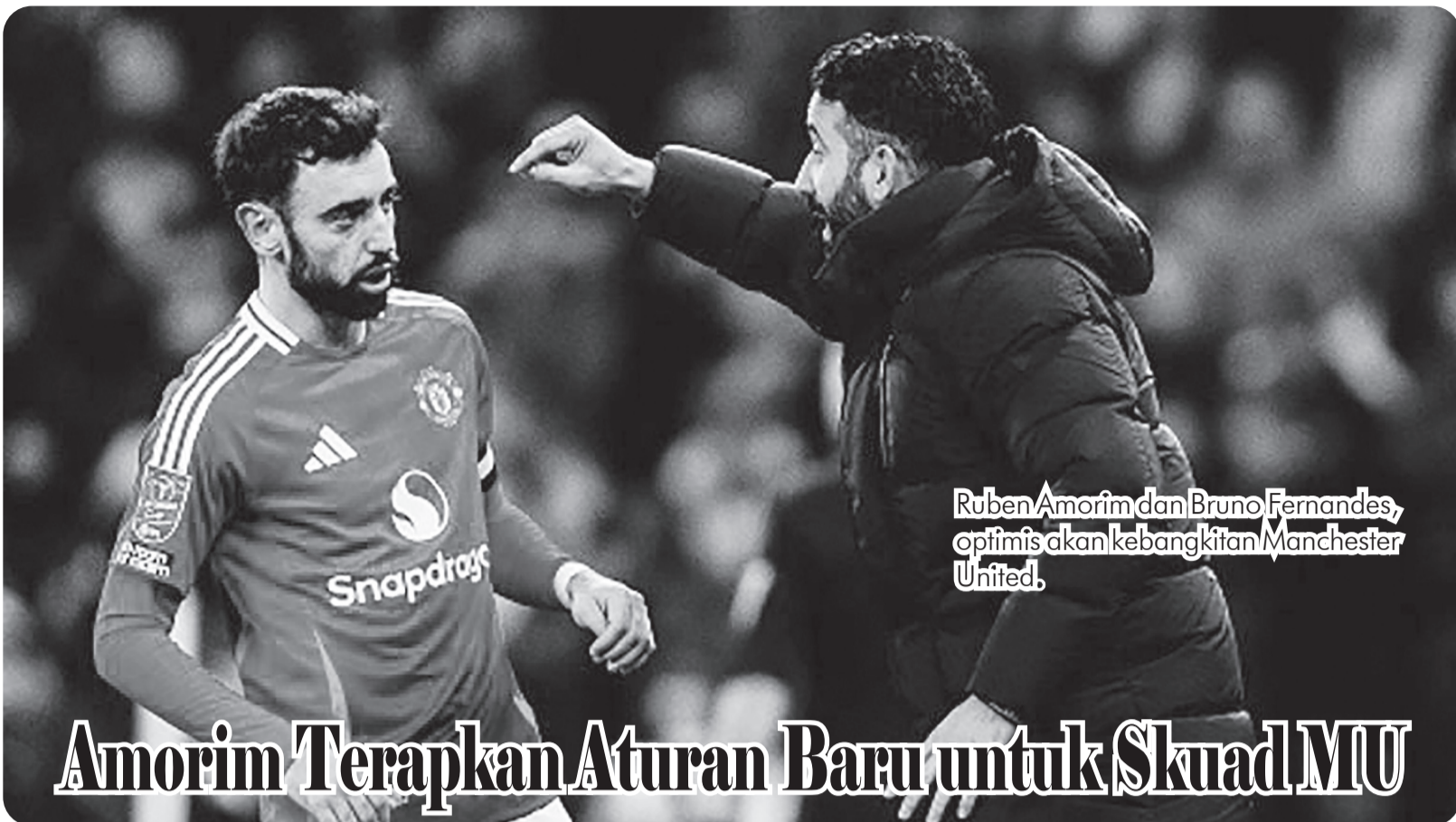
Ruben Amorim dan Bruno Fernandes, optimis akan kebangkitan Manchester United.