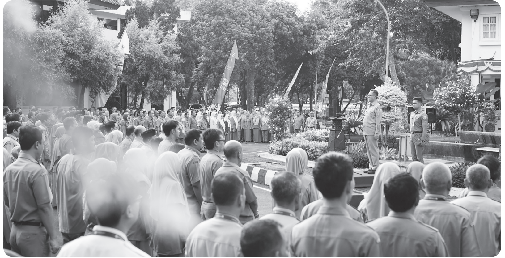
Sekda Kabupaten Bogor mengajak jajarannya untuk meningkatkan kualitas kinerja. ASN harus turut serta mengangkat citra positif Pemerintah Kabupaten Bogor melalui akun-akun media sosial resmi maupun pribadi, sebagai bentuk pertanggungjawaban publik.