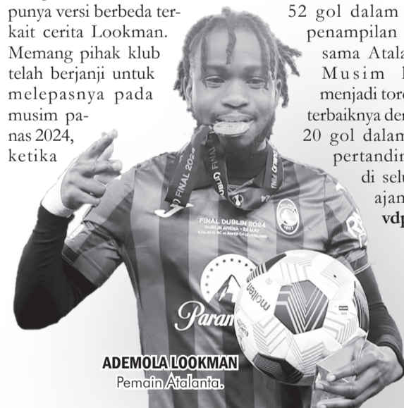
ADEMOLA LOOKMAN Pemain Atalanta.

Lookman mencetak 52 gol dalam 117 penampilan bersama Atalanta. Musim lalu menjadi torehan terbaiknya dengan 20 gol dalam 40 pertandingan di seluruh ajang. ● vdp