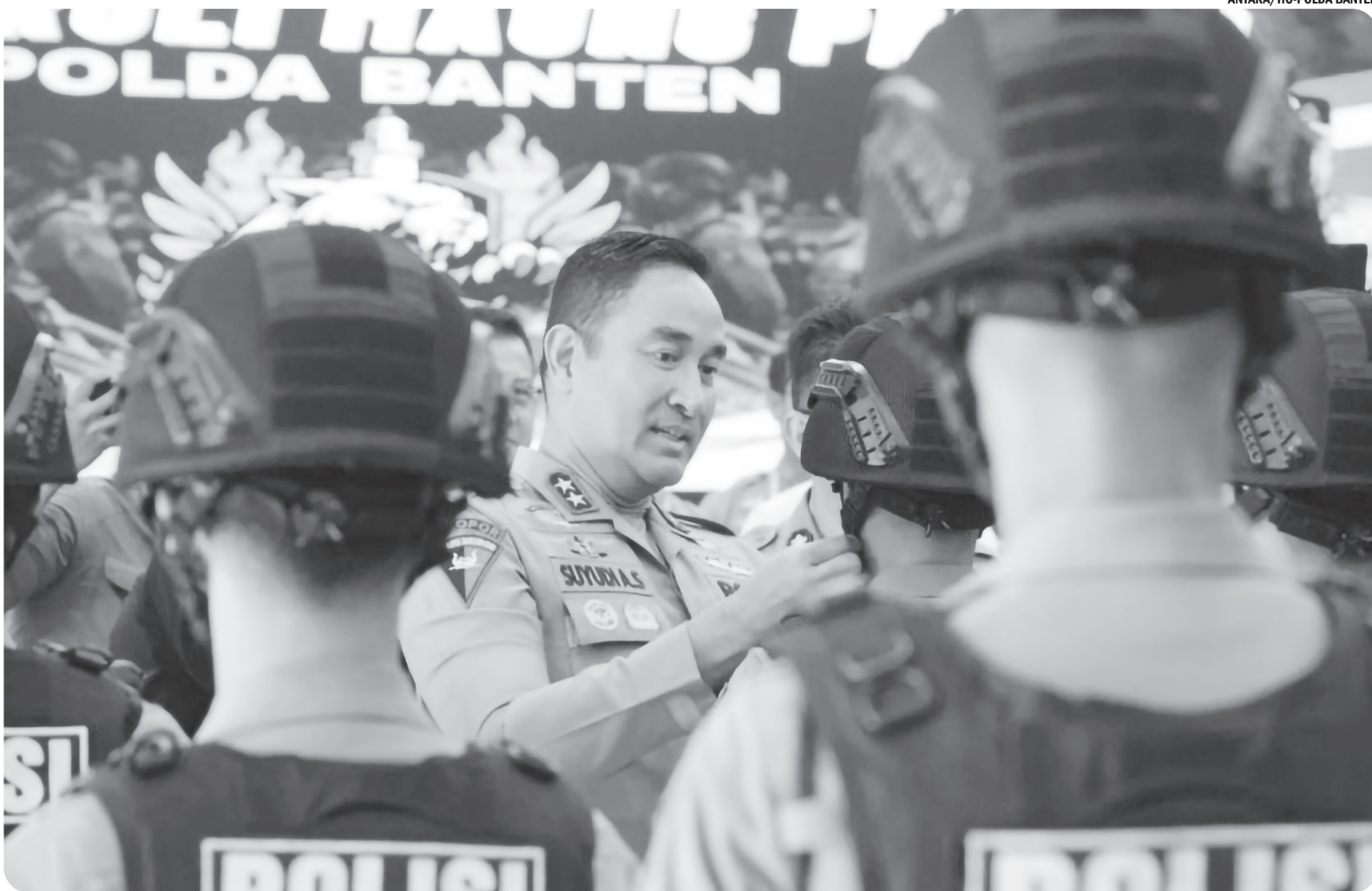
PELATIHAN TIM PATROLI MAUNG PRESISI