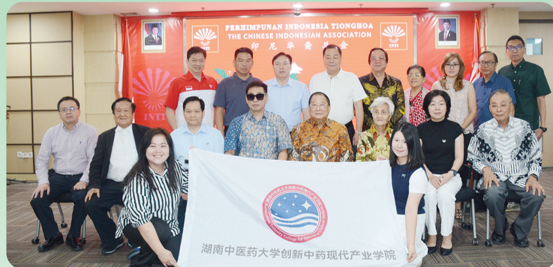
Kedua belah pihak berfoto bersama.