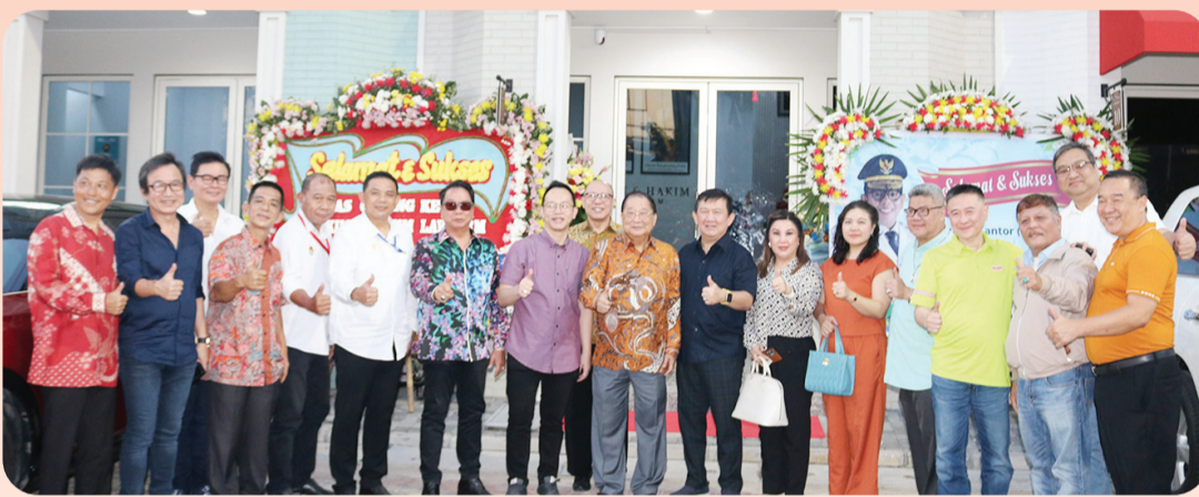
Foto bersama di depan Kantor Hakim & Hakim.