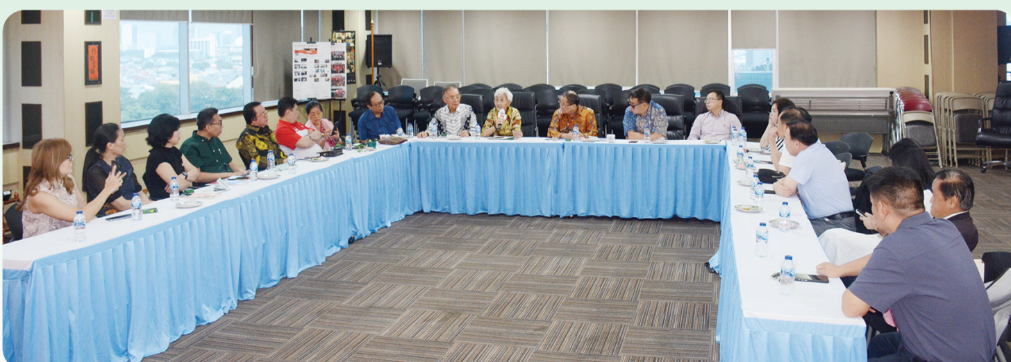
Suasana pertemuan yang berlangsung hangat dan interaktif.

Dia juga menyampaikan bahwa Perhimpunan INTI banyak melakukan kerja sama dengan berbagai organisasi maupun lembaga pendidikan, seperti yang belum lama ini Perhimpunan INTI menjalin kerja sama dengan Universitas Muhammadiyah Malang. • kris