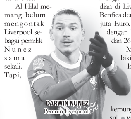
DARWIN NUNEZ Pemain Liverpool.

Musim lalu, dia cuma bikin tujuh gol dari 47 laga di seluruh ajang, sehingga manajer Liverpool Arne Slot menggaet Hugo Ekiteke dan kemungkinan Isak menyusul. ● vit