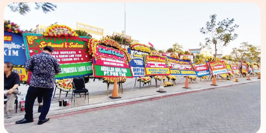
Jajaran karangan bunga ucapan selamat atas peresmian kantor Hakim & Hakim Law Firm.