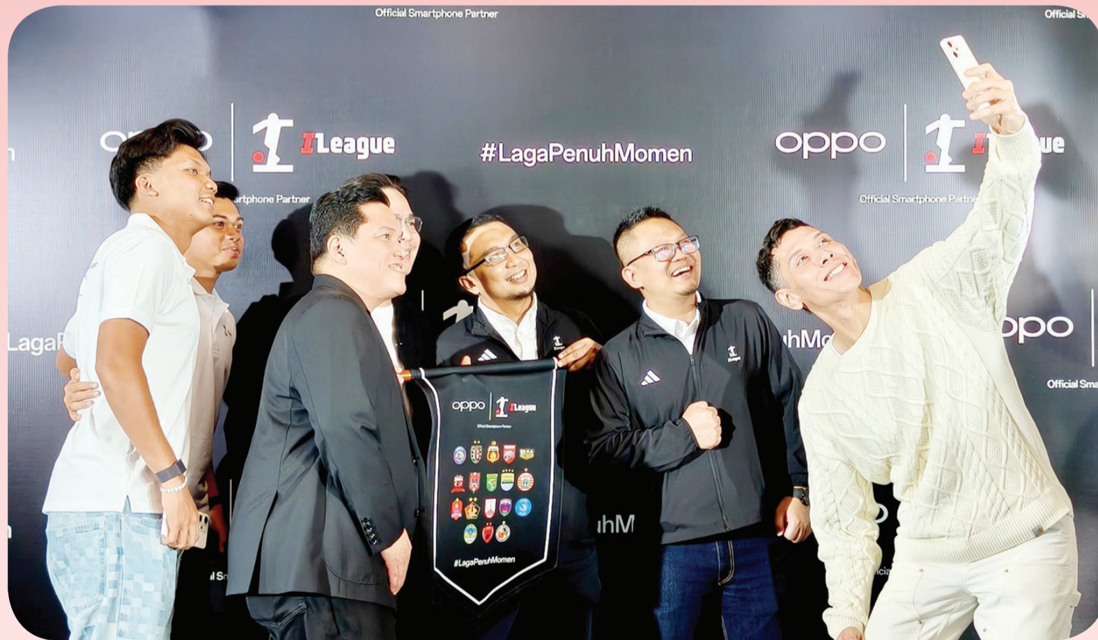
Foto Bersama Kolaborasi OPPO dan BRI Super League.