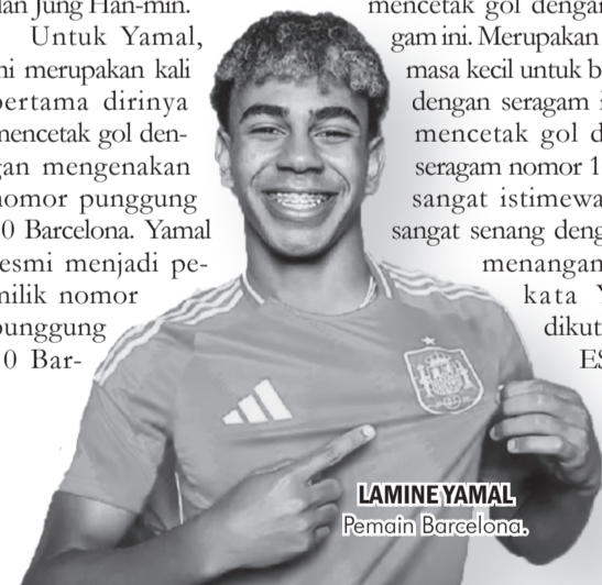
LAMINE YAMAL Pemain Barcelona.

"Saya sangat senang bisa mencetak gol dengan seragam ini. Merupakan impian masa kecil untuk bermain dengan seragam ini dan mencetak gol dengan seragam nomor 10, yang sangat istimewa. Saya sangat senang dengan kemenangan tim," kata Yamal dikutip dari ESPN. ● vdp