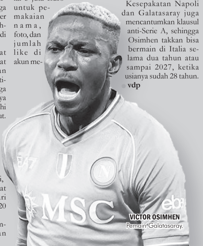
VICTOR OSIMHEN Pemain Galatasaray.

Kesepakatan Napoli dan Galatasaray juga mencantumkan klausul anti-Serie A, sehingga Osimhen takkan bisa bermain di Italia selama dua tahun atau sampai 2027, ketika usianya sudah 28 tahun. vdp