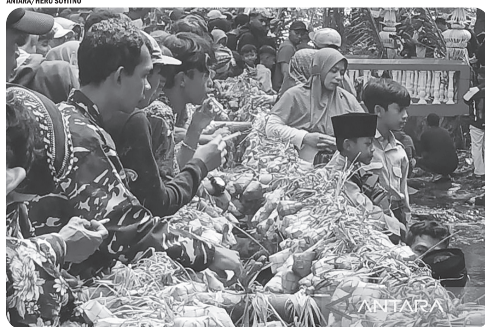
TRADISI SERIBU KETUPAT DI TEMANGGUNG

Tradisi Seribu Ketupat di Dusun Gedongan, Desa Ngemplak, Kandangan, sebagai upaya pelestarian sumber air yang dilaksanakan di Temanggung, Jumat (1/8/2025). Tradisi Seribu Ketupat Desa Ngemplak upaya lestarikan sumber air.