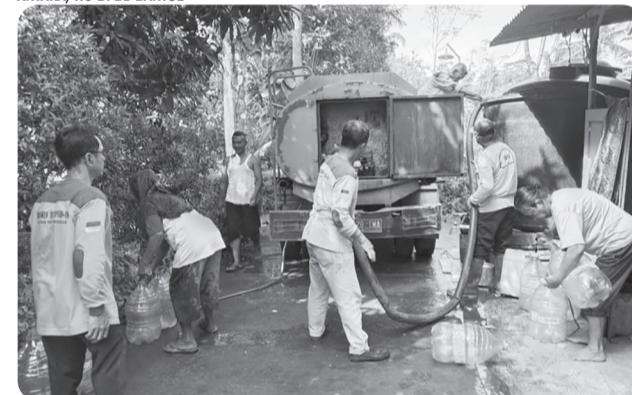
BPBD BANTUL DISTRIBUSIKAN AIR BERSIH

Penyaluran bantuan air bersih ke wilayah terdampak kekeringan di Kelurahan Trimurti Srandakan Bantul Daerah Istimewa Yogyakarta. BPBD Bantul distribusikan air bersih 160.000 liter ke wilayah Trimurti.