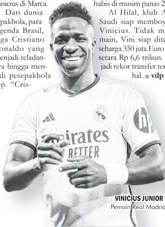
VINICIUS JUNIOR Pemain Real Madrid.

Al Hilal, klub Arab Saudi siap memboyong Vinicius. Tidak main-main, Vini siap ditebus seharga 350 juta Euro atau setara Rp 6,6 triliun. Bisa jadi rekor transfer terahal. ● vdp