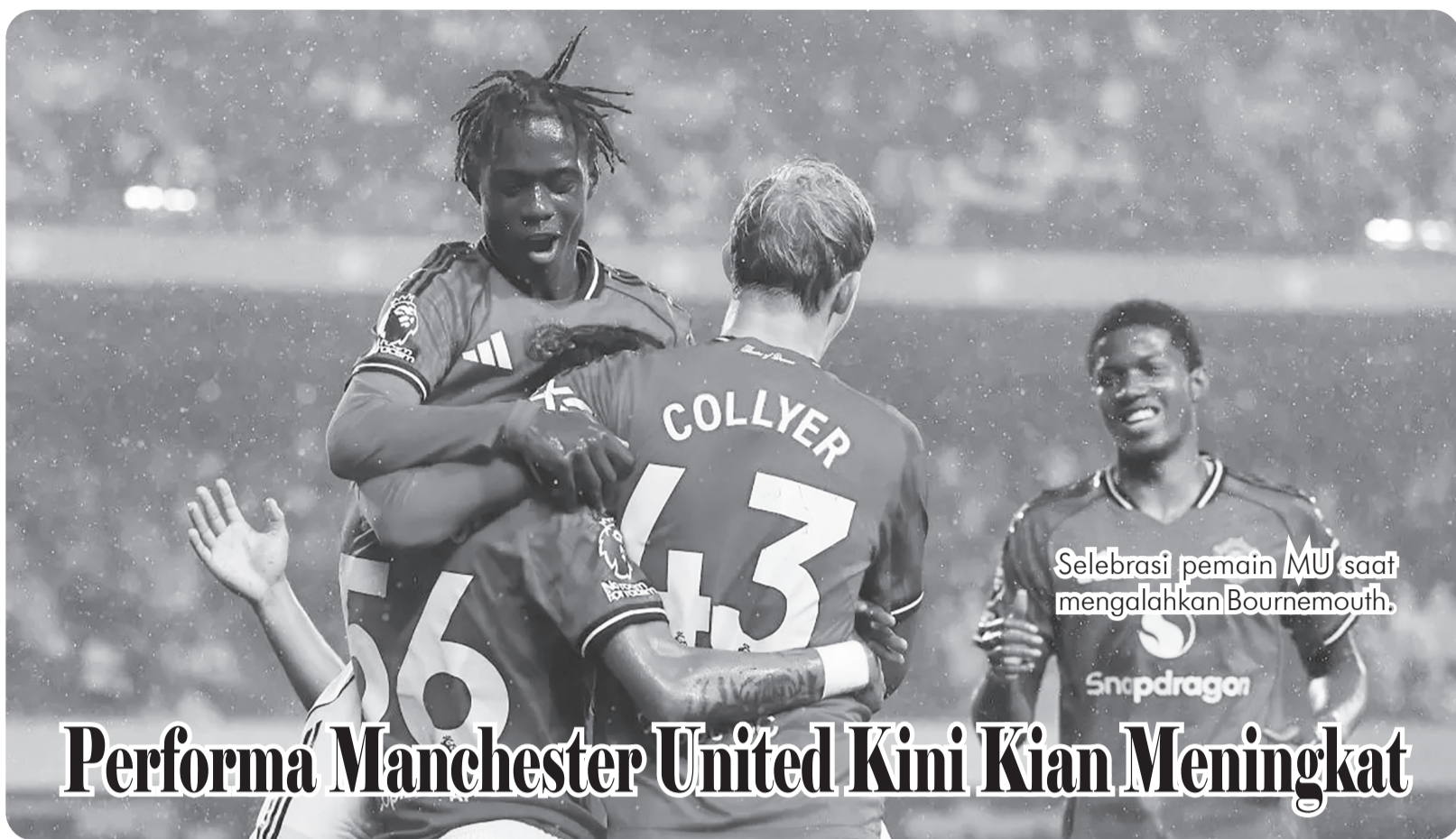
Selebrasi pemain MU saat mengalahkan Bournemouth.