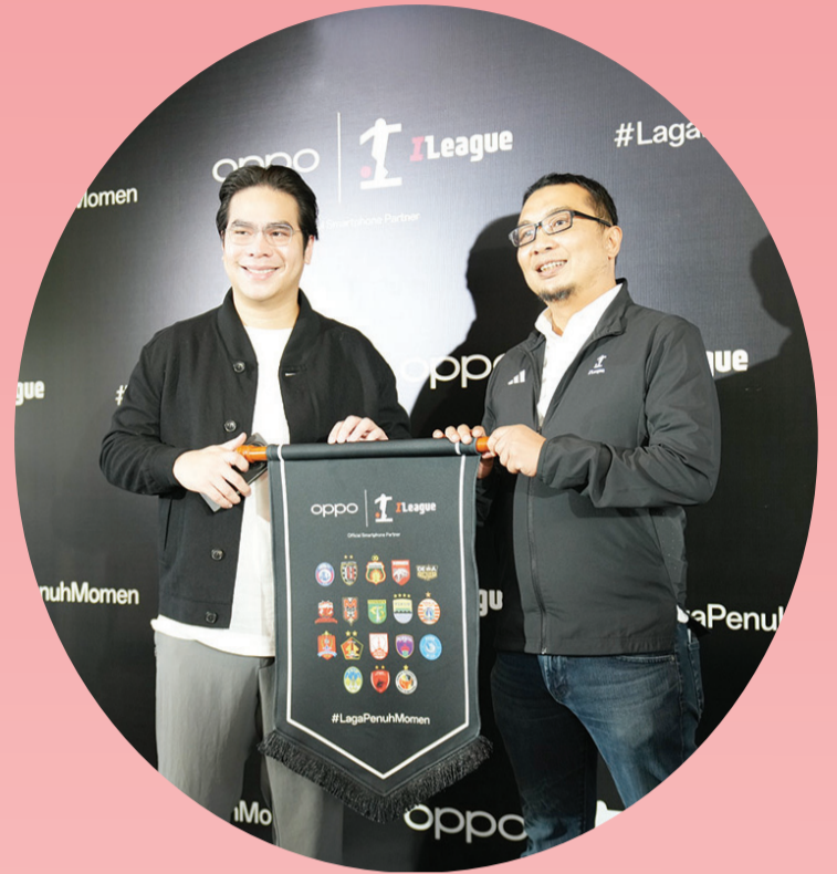
Penyerahan Vadel OPPO x BRI Super League.

JAKARTA (LB) - Dengan menjadi Official Smartphone Partner BRI Super League untuk dua musim berturut-turut 2025-2027, OPPO hadir membawa teknologi untuk menangkap semangat, emosi, dan momen kebanggaan sepak bola Indonesia.