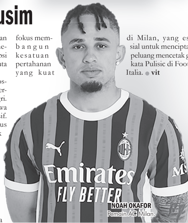
NOAH OKAFOR Pemain AC Milan.

fokus membangun kesatuan pertahanan yang kuat