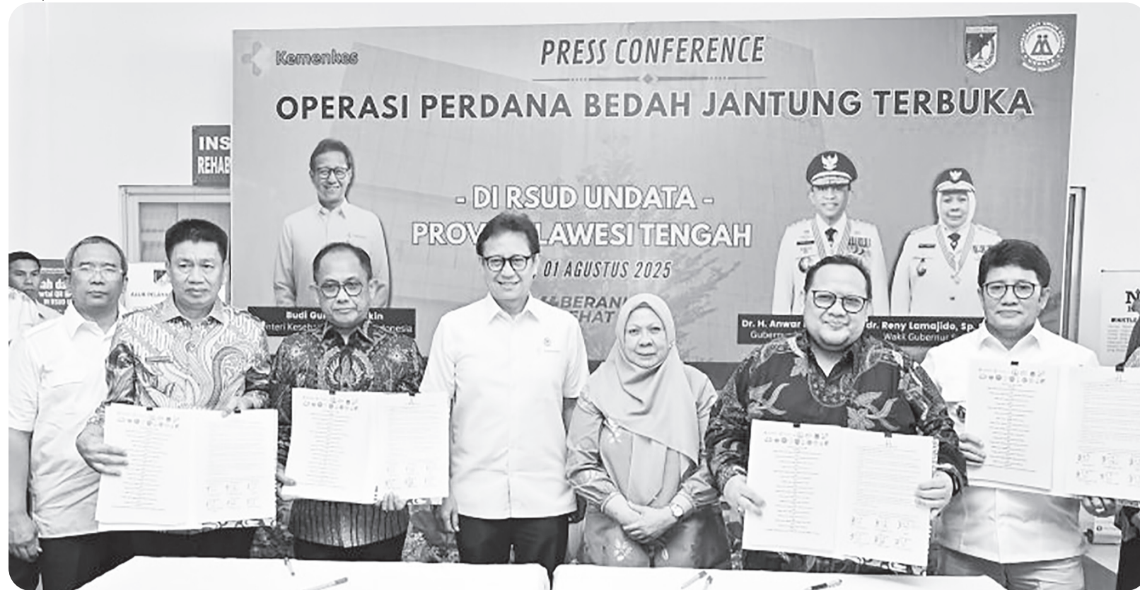
OPERASI PERDANA BEDAH JANTUNG DI RSUD UNDATA PALU

Menteri Kesehatan Budi Gunadi Sadikin menyaksikan penandatanganan perjanjian kerja sama jejaring pengampunan layanan jantung dan pembuluh darah di RSUD Undata Palu, Jumat (1/8/2025). RSUD Undata Palu laksanakan operasi perdana bedah jantung.